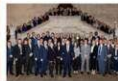
Johnson vows spee invest more

Teško je procijeniti koliko Kina plaća da New York Times, Wall Street Journal i najmanje 30 drugih novina objavljuju China Watch, ali prema jednom izvješću britanski Daily Telegraph dobiva više od devet milijuna dolara kako bi se mjesečno priložilo između četiri i osam stranica.