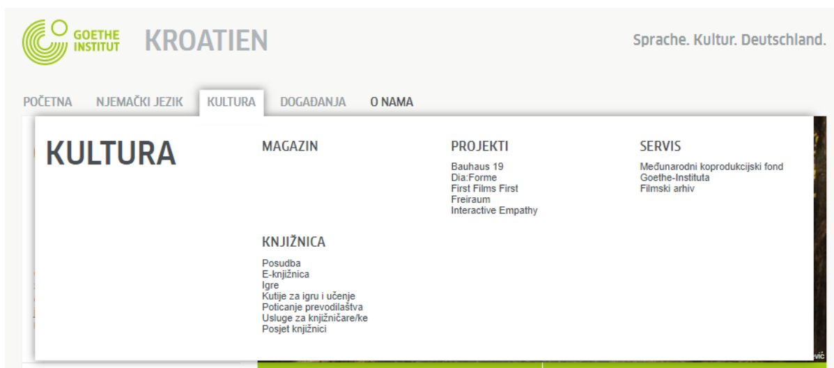
Slika 3. Kultura. Goethe-Institut Hrvatska

U padajućem izborniku pod kategorijom kulture se također mogu uočiti vidne razlike u ponudi Goethe-Instituta u Hrvatskoj u odnosu na Goethe-Institut u Njemačkoj. Sadržaj hrvatskih internetskih stranica je na očigled skromniji, no njihov cilj je i dalje identičan.