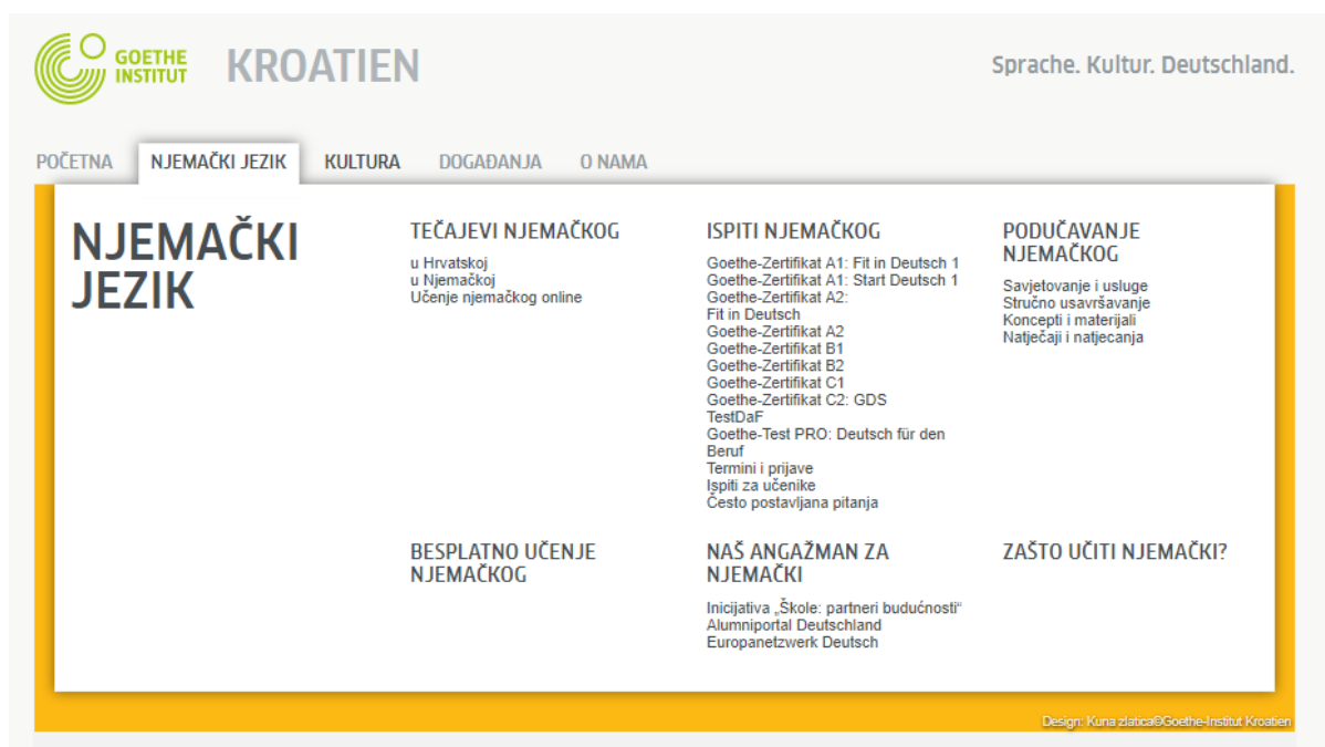
Slika 1. Njemački jezik. Goethe-Institut Hrvatska

razmjene, ključan je, naime, faktor za integraciju svakog doseljenika u zemlju, koji želi upoznati i shvatiti njezinu kulturu. Jezik i komunikacija daju svakom doseljeniku mogućnost dijaloga i obrazovanja, zbog čega su upravo mobilnost i jezik ključni aspekti Instituta. Osim što Institut ima jezičnu i interkulturalnu funkciju, nudi i razne korisne informacije te savjete bilo po pitanju života u Njemačkoj ili pronalaska radnog mjesta. 109