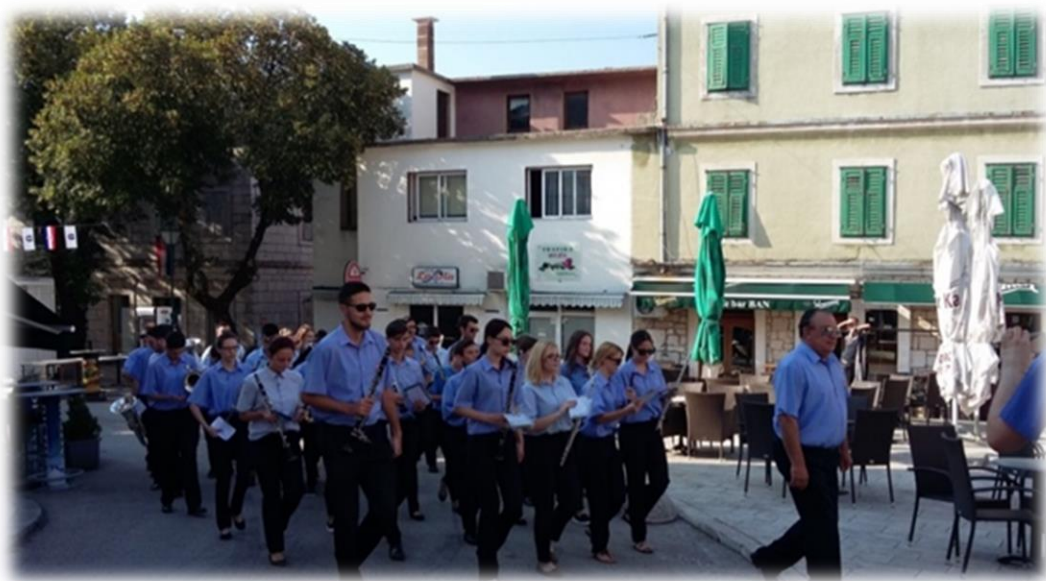
Slika 27.: Budnica Imotskih glazbara u Imotskom (02.08. 2017.)

Prethodnica brojnih događanja bila je budnica ponajboljeg puhačkog orkestra u Hrvatskoj: Gradske glazbe Imotski .