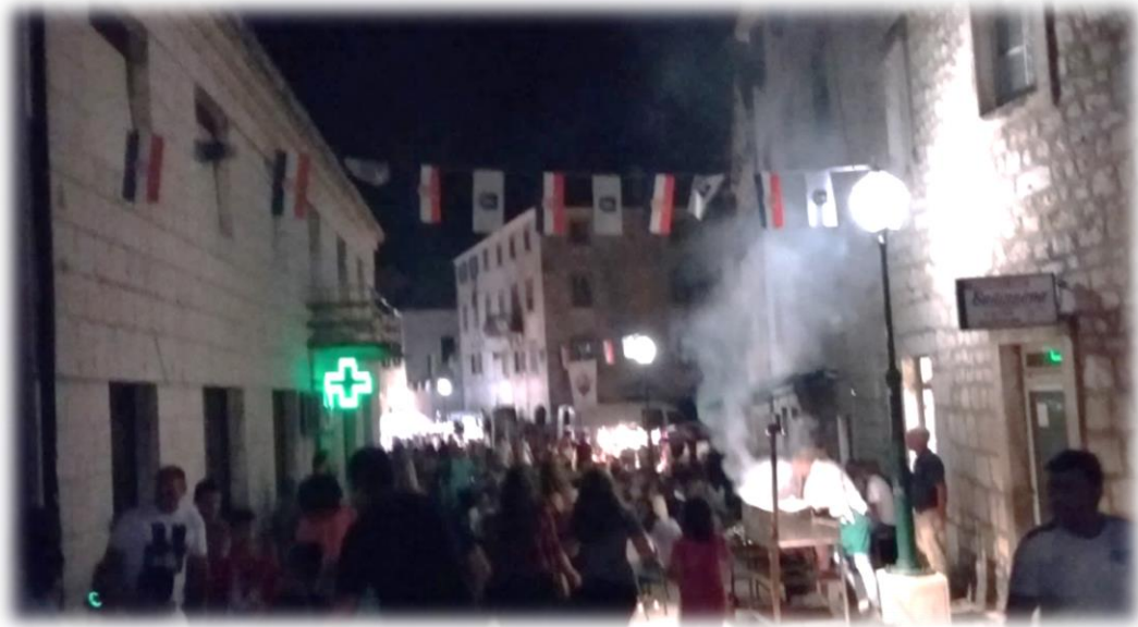
Slika 34.: „Imotska noć“ (02.08. 2018.)

proslavama i dernecima, sada se šalju poruke Viberom, WhatsAppom, rijeđe SMS-om. Šalju se linkovi na objave fotografija s proslave, najčešće još za vrijeme njenog trajanja.