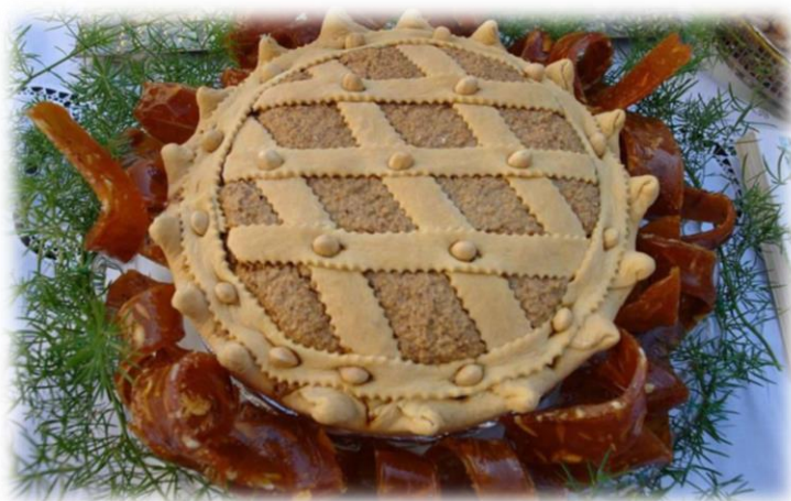
Slika 11.: Imotska torta

Za derneke u Imotskoj krajini, u novije vrijeme pripremaju se i različite vrste kolača i slastica, koji se ne konzumiraju isključivo na derneku, nego se njima časte gosti koji dođu u posjet obitelji čija kuća se nalazi u mjestu održavanja derneka. Tako su se uz standardne kolače redovito pripremala i tradicionalne imotske slastice poput ušećerenih badema , Imotskih rafijola i Imotske torte 110 .