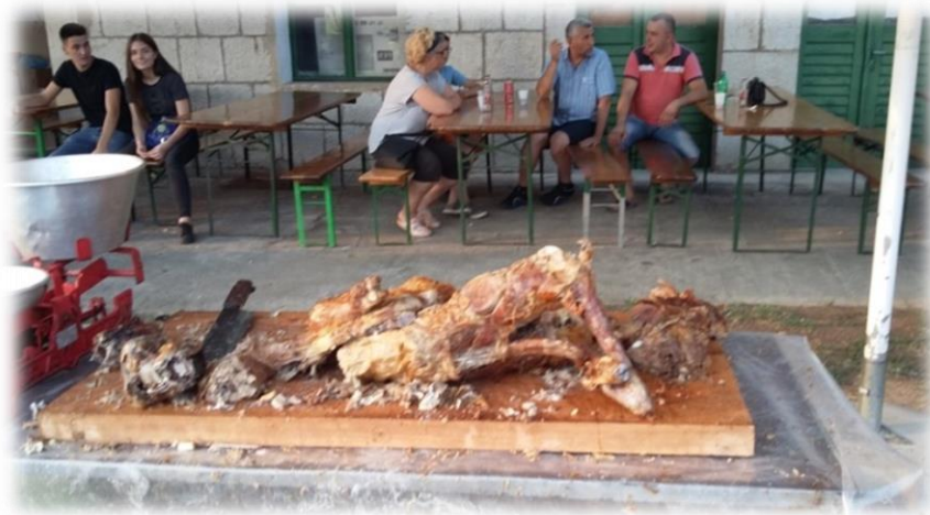
Slika 39.: Pečena janjetina „na kile“ u Gorici Izvor: osobna snimka 3. kolovoza 2017.

nosnicama širi miris pečene janjetine, i ako je netko prehladen može oćutjeti taj „miris“ putem zvuka mesarske satare koja nasijeca komade janjetine da ju je lakše rukama jesti. To je sve tradicija koja je ostala i našla svoje mjesto u našem puku. I danas je dernek na Stipandan živ, iako su u mnogim okolnim mjestima našega šireg podneblja takva slavlja ugašena, ovaj se u Gorici još uvijek ponosno drži. Sve su ovo lijepi, kulturni, sadržajni, puni simbolike i tradicije; oni su popratni sadržaji koji krasi ovo drevno slavlje sv. Stipana u Gorici 3. kolovoza svake godine.“ 259