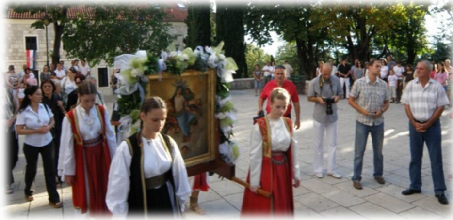
Slika 30.: Procesija sa slikom Gospe od Anđela 2009.

prečicu po hladovini, kad sam u gužvi tik do sebe, prepoznala poznatog hrvatskog političara, starije generacije (pripadnik tzv. Hrvatskog proljeća) kako s teškoćom, ali ipak korača u procesiji te sam od namjere odustajanja i sama odustala i nastavila dalje.