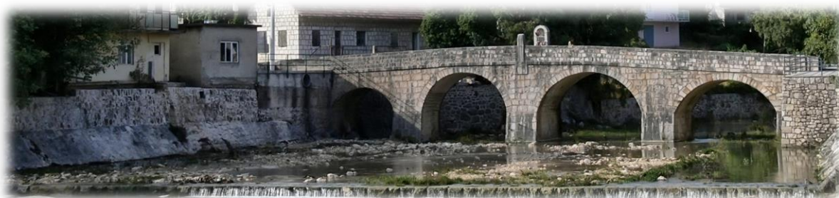
Slika 47.: Prološki most (Šarampov) u središtu Prološca

geografskom smislu, nego i u kolektivnom sjećanju čitave zajednice. Na pitanje odakle ste, većina prološčana osim odgovora da je iz Prološca, odmah će dodati koliko mu je kuća ili zaselak udaljen od mosta. Također ako ih pitate za bilo koje odredište u Prološcu, dobit ćete upute upravo koliko je to odredište, kamo ste se uputili, udaljeno od Šarampovog mosta.