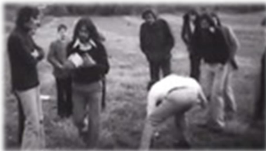
Slika 4.: Scena iz filma Dernek – bacanje kamena s ramena

dokumentarnom filmu - DERNEK 49 u režiji Zorana Tadića. Iako film nije okarakteriziran kao etnografski, u njemu su uz autentične lokacije, zabilježena i autentična iskustva prisustvovanja na derneku u rodnom kraju glavnog glumca. Radnja filma govori o mladiću iz Prisike kod Aržana koji je na „privremenom“ radu u Münchenu i koji kreće na put kući 31. listopada popodne kako bi stigao na dernek , bacanje kamena s ramena, šijavicu i gangu da bi se nakon dva dana, 2. studenoga, vratio natrag u Njemačku.