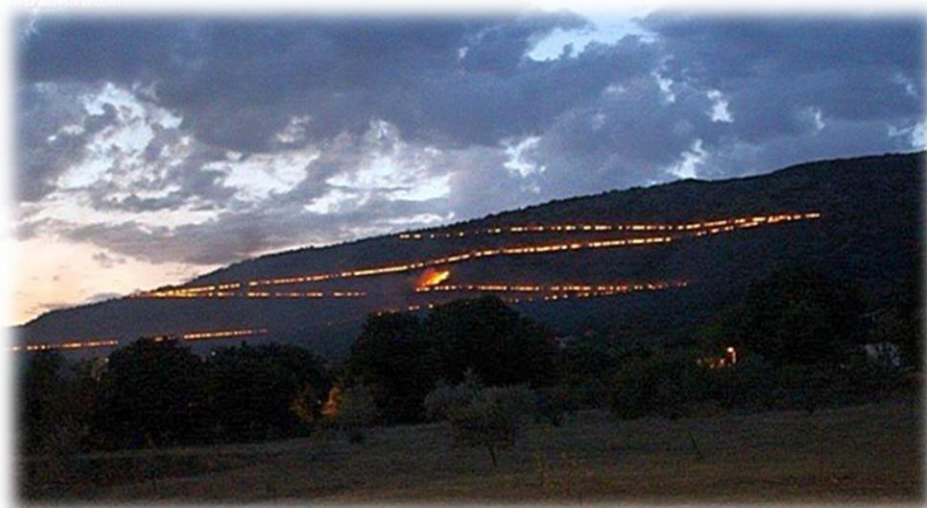
Slika 37.: Svitnjaci na Zavali 2018.

U prijašnjim vremenima, svitnjaci su se palili ispred svih kuća u župi i uzduž puteva koji su vodili prema sv. Stipanu. Budući da Stipanjdanski dernek pada u sri' lita (na trećega dana osmoga mjeseca) i vrućine su velike, nije bila ritkost da se kome zapali i što god oko kuće, pa znale su i pojate izgorit. Župnici su otada preporučivali da se nepali oko kuća i odredili su da se svitnjaci pale uza Zavolu (Zavalu) oko kameni stupića uz cestu, a svitnjaci na Zavoli vidili su se iz daleka, sve do navr Bijakove. 254