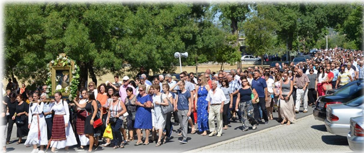
Slika 52.: Procesija kod Gospine crkve na Vrljici

prethodila je procesija u kojoj su djevojke odjevene u tradicijsku odjeću ovog kraja nosile svečano okićenu sliku Blažene Djevice Marije. U Prološcu je tradicija da sliku u procesiji uvijek nose žene, odnosno djevojke. Procesijska ruta započinje iz crkve na Durmiševcu, sudionici obilaze stazom oko parka na izvorištu Vrljike, a završava se na Lučici u Zelenoj katedrali. Slika se postavlja na postolje ispred oltara i tu ostaje do završetka mise.