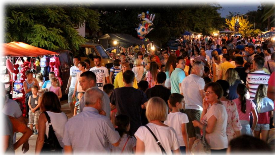
Slika 44.: šetnja na Stipanjdanskom derneku 2018.

Dok su se nekada na derneku ljudi upoznavali, družili i zabavljali, danas je rijetko da će neko pristupiti nekom koga već od prije ne poznaje. Ljudi zastajkuju na šetnjici, kada prepoznaju nekoga koga dugo nisu vidjeli, a zajedno su, primjerice, išli u školu. Međutim, susreti su sve kraći i većinom se za vrijeme susreta, samo razmijene kontakti poput broja mobitela, s obećanjem da će se sigurno javiti i ostati u kontaktu, što većinom i ostaje samo na obećanju.