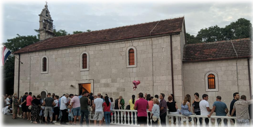
Slika 46.: Gospina crkva na Durmiševcu

Danas se na blagdan Velike Gospe, održavaju mise u oba svetišta. Što se tiče samog imena crkve i njenog titulara, iz arhivskih dokumenata obitelji Franceschi, vidljivo je da se ona spominje kao crkva Svete Marije od Ružarija (..) dok se na jednom drugom ranijem dokumentu titulira samo kao crkva Blažene Djevice Marije. Od navedenih imena najbolje pristaje ono koje je sačuvano u narodu i kojim se naraštajima nazivala – jednostavno Gospina crkva . 276