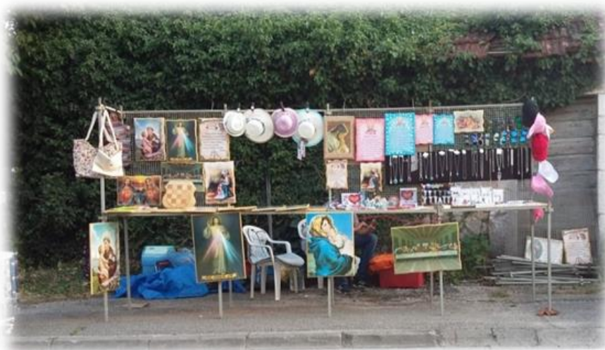
Slika 15.: Prodaja na derneku – štand na nogostupu uz cestu u Gorici

Protekom vremena događale su se određene promjene u različitim praksama, pa se tako, u određenoj mjeri, mijenjala i trgovina na dernećima. Međutim, ta se promjena većinom odnosila na prodaju tehnološki naprednije robe, koja je postajala dodatak standardnoj ponudi s nekadašnjih derneka. Tako se primjerice još uvijek mogu vidjeti štandovi na kojima se u jednom dijelu prodaju slike s motivima svetaca (jednakim od prije pedeset i više godina), moderne torbice i šeširi, nakit, suveniri s nacionalnim obilježjima, drvene igračke, ali i suvremene „maskice za mobitel“, koje se nekada nisu mogle ni zamisliti, a sada su dio standardne trgovačke ponude na svakom derneku.