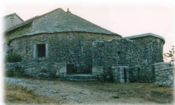
Slika 17.: Majića kula na Sebišini