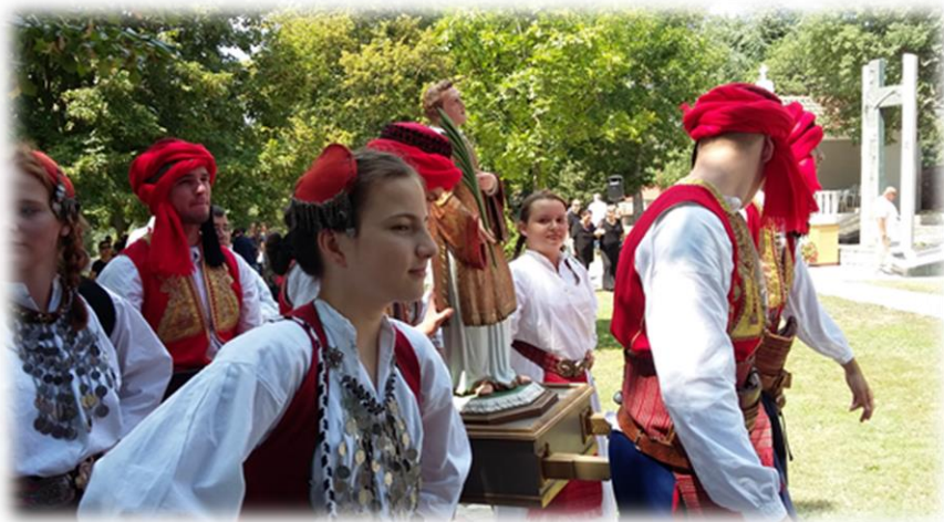
Slika 38 .: Procesija s kipom sv. Stipana Izvor: osobna snimka 3. kolovoza 2018.

Središnje misno slavlje započelo je u 11,00 sati. Svečanu svetu misu na Dan sv. Stjepana, pred velikim brojem vjernika, župljana i hodočasnika iz okolnih krajeva na sam blagdan obično predvodi gostujući svećenik uz kojeg koelebrira još oko desetak svećenika, većinom podrijetlom iz Savića ili Gorice, odnosno bivših župnika ove župe. U propovijedima redovito se uz pozdrav nazočnima, naglašava zajedništvo vjernika s obje strane granice, te pripadnost jednom narodu i jednoj kulturi. Također redovito se govori i o životu svetog Stjepana, njegovoj mučeničkoj smrti i primjeru koji je svojim životom ostavio vjernicima u nasljeđe.