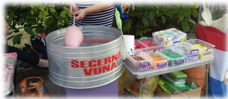
Slika 10.: Šećerna vuna – poslastica na derneku u Gorici Izvor: osobna snimka 3.8.2017.

Za derneke u Imotskoj krajini, u novije vrijeme pripremaju se i različite vrste kolača i slastica, koji se ne konzumiraju isključivo na derneku, nego se njima časte gosti koji dođu u posjet obitelji čija kuća se nalazi u mjestu održavanja derneka. Tako su se uz standardne kolače redovito pripremala i tradicionalne imotske slastice poput ušećerenih badema , Imotskih rafijola i Imotske torte 110 .