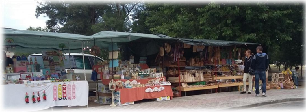
Slika 49.: Štandovi na derneku 2018. u Prološcu

dasaka za rezanje mesa i sl. pa sve do drvenih igračaka i suvenira. Prodavačice koje su stajale iza štandova, pjevale su zajedno s vjericima koji su stajali u okruženju crkve, pokazujući tako svoje sudjelovanje u bogoslužju. Pjesmu i po neku molitvu, povremeno su prekidale obraćajući se grupicama prolaznika ispred štanda, riječima: Faljen Isus i Marija, sretan vam zavjet, hoćemo li što pazarit.