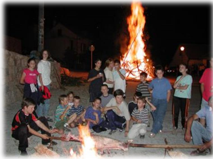
Slika 33.: Pečenje janjca i svitnjak na Bazani

upravo pečenih ćevapčića. Pečenu janjetinu, koja je karakteristična za sve veće proslave u ovom kraju, bilo je moguće naručiti jedino unutar gostionice, nije se moglo vidjeti ni pečenje, ali ni posluživanje janjetine na vanjskom prostoru. Podatak da su se u prošlosti ipak i pekli i posluživali pečeni janjci, na otvorenom prostoru pronašla sam na jednom portalu, koji je objavio i fotografiju na užežin (uočnicu) blagdana kad su se uz svitnjake (krijesove) u imotskom kvartu Bazani pekli janjci na ražnju za proslavu većih blagdana, a blagdan Gospe od Anđela je upravo to i bio.