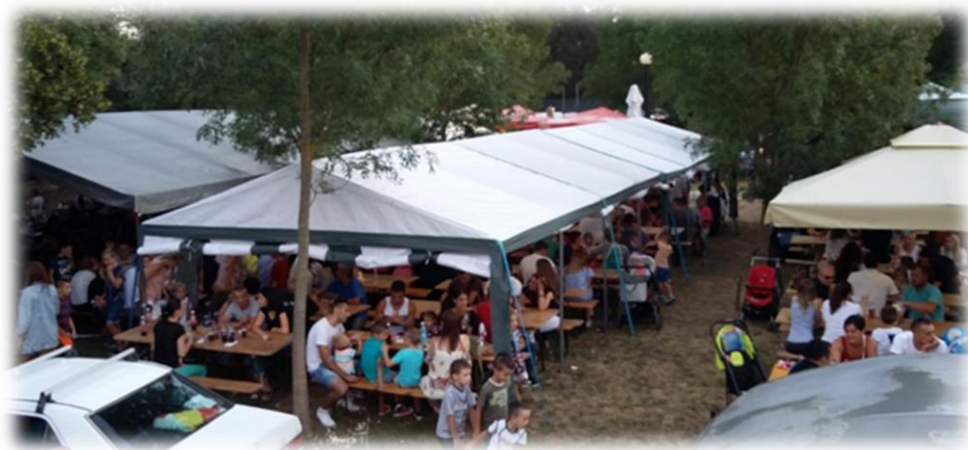
Slika 54.: užina na derneku uz Vrljiku Izvor: osobna snimka 15. kolovoza 2018.

Iako se tijekom cijelog dana, na prostoru izvorišta Vrljike, nalazi veoma velik broj ljudi. Može se pratiti gdje i kada se u intervalima, pojavljuje najveća gužva. Tako je primjerice u rano jutro, najveća gužva na mjestima gdje se održavaju bogoslužja (u i oko obadrije Gospine crkve i Zelenoj katedrali) i tako sve do završetka Velike mise. Nakon toga, u rano poslijepodne, najmasovnije je okupljanje ljudi ispod šatora, za stolovima gdje se objeđuje. Poslije podne i u predvečerje, gužva se povećava ispred štandova na kojima se trguje. A pri kraju večeri, pa sve do ranih jutarnjih sati sljedećeg dana, najveća gužva je za šankovima na kojima se toči piće, odnosno na upriličenom koncertu ili kakvoj drugoj glazbenoj manifestaciji .