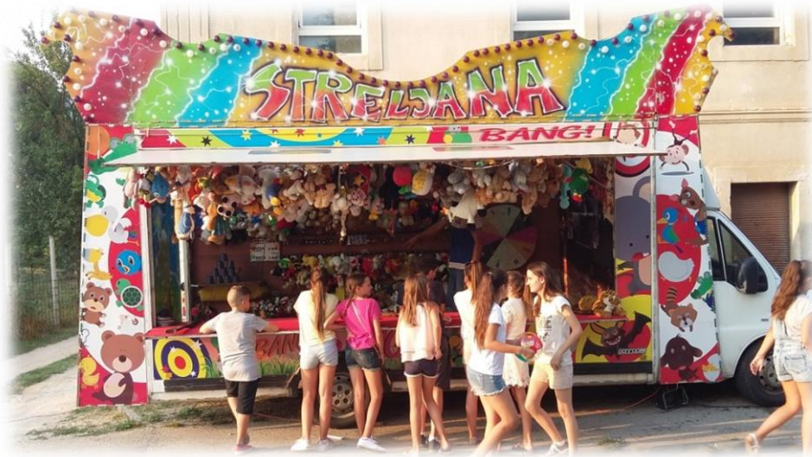
Slika 42.: Streljana Bang na Stipanjdanskom derneku Izvor: osobna snimka 3. kolovoza 2017.

Osim gostionica i po nekog kafića koji se inače nalaze na šetalačkoj ruti, u nekim dvorištima, postavljeni su i improvizirani šankovi gdje se točilo piće te stolovi na kojima se posluživalo jelo. Također, na derneku su prisutni i pokretni ugostiteljski objekti s tzv. fast food – om ili „brzogrizom“ kako ih u ovom kraju nazivaju. Osim pokretnih ugostiteljskih objekata, uz rub šetnice parkirana je i pokretna Streljana „Bang“ na kojoj oni koji imaju preciznu ruku, ili tek malo sreće, mogu osvojiti plišane igračke. Nekada su uglavnom mladići osvajali igračke i poklanjali ih djevojkama, danas je to više zabava za one najmlađe, koji su neumorno gađali kule konzevi i pikado.