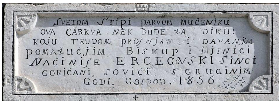
Slika 36.: Natpis na kamenoj ploči iznad ulaznih vrata stare crkve posvećene sv. Stipanu

podružna crkva u Sovićima posvećena sv. Petru i Pavlu a poslije i zvonik u Bobanovoj Dragi posvećen sv. Iliji proroku.“ 247