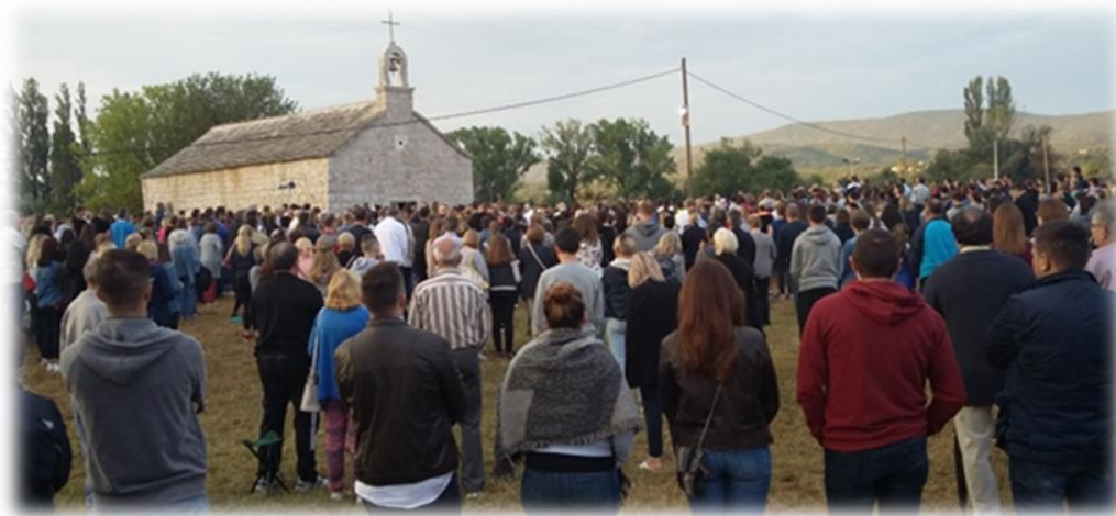
Slika 50.: Pobožnosti ispred Gospine crkvice na Opačcu Izvor: osobna snimka 15. kolovoza 2018.

Potvrdu da je, upravo ovdje, to običaj od davnina, pronašla sam zabilježenu u monografiji „Povijest, vjera i kulturna baština u Imoti“ u kojoj su objavljeni stihovi koji govore o tome.