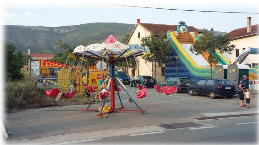
Slika 41.: mali ringišpil na Stipanjdanskom derneku Izvor: osobna snimka 3. kolovoza 2017.

Dva ili eventualno tri punkta na šetnici bilo je rezervirano za sladoledare. Ispred gostionica, koje su i inače bile uz samu prometnicu, postavljeni su improvizirani stolovi i vanjski šankovi za točenje pića. Na terasama kafića organizirana je živa glazba, gdje su mladi bendovi svirali i pjevali raznolik repertoar pjesama... redoviti i onaj po narudžbi . Ostali štandovi većinom su bili s proizvodima od plastike: igračkama, loptama, plastičnim pištoljima, puškama..sunčanim naočalama. Na nekoliko štandova nudio se nakit (bižuterija), narukvice, lančići, ogrlice... Iako se prethodnih godina na Stipanjdanskom derneku moglo kupiti i neke domaće proizvode i suvenire (drvene kuhače, bukare, pletene košare, krtole i sl.), ove dvije godine, najviše je bilo trgovačke robe industrijske proizvodnje i proizvoda poput igračaka za one najmlađe. Na nekoliko štandova bilo je moguće kupiti i odjeću. Na omanjim improviziranim štandovima nalazila se i gomila „sprženih“ CD - ova s različitom glazbom. Također na dva proširenja (cesta prema staroj crkvi) i na Stublima, postavljeni su vrtuljci (ringišpili). Dva manja za mlađu djecu i jedan veliki. Uz ringišpile postavljeni su veliki napuhani trampolini.