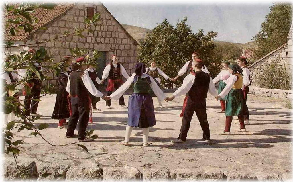
Slika 16.: Igranje kola na derneku

zapadnoj Hercegovini, najčešće je bila vezana uz dernek, odnosno dernek je bio platforma na kojoj se u prošlosti, spontano, u svom izvornom obliku, izvodilo plesanje (igranje) kola, pa sve do suvremenih derneka na kojima se kola izvode samo kao dio folklornog nastupa, uglavnom lokalnih plesnih (folklornih) društava u okviru Kulturno umjetničkih udruga. Igranje kola na dernecima, u lokalnim zajednicama, izvodi se redovito i dio su tradicijskih zbivanja kojima lokalne zajednice slave svog sveca zaštitnika ili se pak izvode tradicionalno kao dio nastupa na nekoj široj manifestaciji.