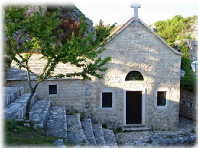
Slika 24.: Crkva Gospe od Anđela na Topani