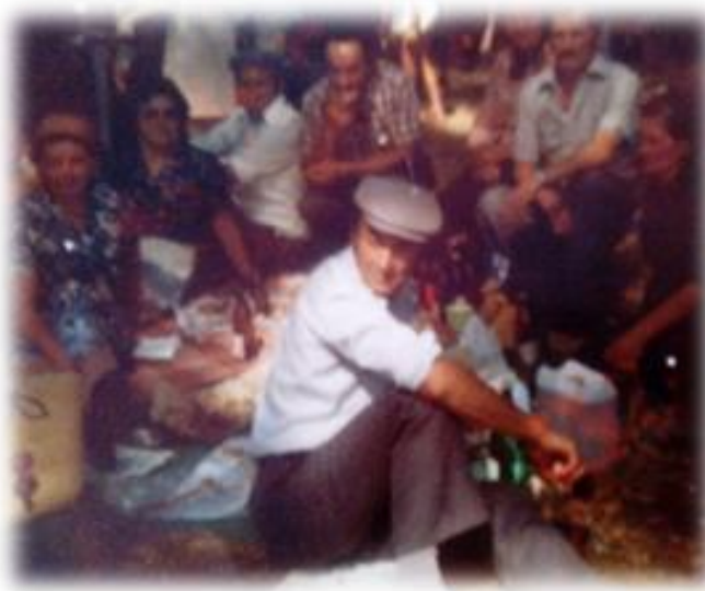
Slika 7.: Zajednička užina - dernek na Vrljici 1971.

Običaj nošenja hrane (užine) na dernek, prestao je u svim dijelovima Imotske krajine i zapadne Hercegovine, krajem sedamdesetih godina prošlog stoljeća. Uobičajeno je bilo da se donešena hrana, postavi na prostirke rasprostrte po zemlji, obično u hladovini stabala, ali uvijek u neposrednoj blizini crkve, odnosno u samom svetištu i mjestu na kojem je bio dernek. Ljudi bi obično posjedali u krug, a hrana se jela bez pribora – rukama.