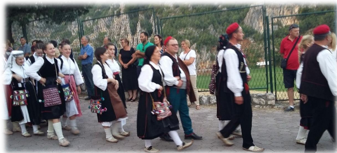
Slika 31.: KUU Nova iz Runovića u procesiji na Topani

Nakon završetka mise, ponovno se formirala procesija sa slikom Gospe od Anđela, krećući prema crkvi sv. Frane. U procesiji su, uz svećenstvo, sudjelovali barjaktari župa Imotske krajine, pripadnici povijesnih hrvatskih vojnih postrojbi te članovi „KUU Novae“ iz Runovića, ostali sudionici počeli su se razilaziti i prije, tražeći osvježenje u obližnjim kafćima ili žureći kućama.