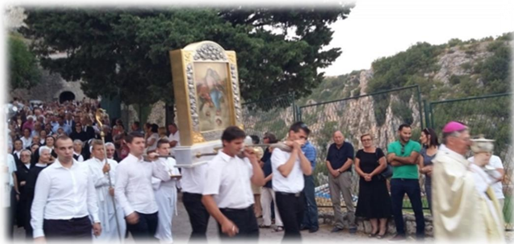
Slika 28.: Procesija sa slikom Gospe od Anđela na tvrđavi Topani