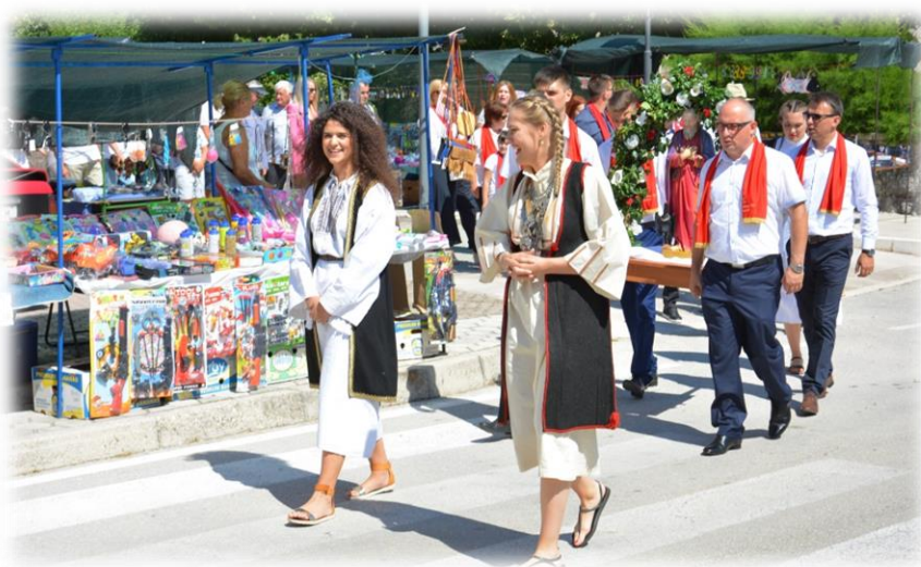
Slika 23.: Procesija kroz dernek (20.7.2018.)

Na Internetskim stranicama mjesta Studenci, o proslavi Svetog Ilije napisano je sljedeće: „Iako je bio radni dan Studenčani diljem svijeta nisu izostali na procesiji i svetoj misi u čast sv. Iliji. Ovu tradiciju stariji prebacuju na mlađe i njih je ove godine bilo puno više nego lani što je dobar znak da su od starijih primili ljubav za mjesto njihovih predaka. Vrućina je bila prava Ilinska, nenasna, ali unatoč tome nije izostao ni tradicionalni dernek, šetnja po mjestu i Franjevačkom trgu bilo s djecom ili parovima koji su bili zaljubljeni i izgubljeni. Mali štandovi, štandići, narodne rukotvorine održale su se još u Studencima. Neka. Treba ih zadržati koliko je to god moguće. Ilina je naš identitet i svakako znak zbližavanja. Sveta misa, častila je našega zaštitnika kojega su s ponosom našim mjestom pronijeli mladići a procesionalu služile djevojke u narodnim nošnjama. Melem za oči a molitva svetom Iliji da kod Boga zagovara njihove plodonosne živote, mladost i čistoću. 205