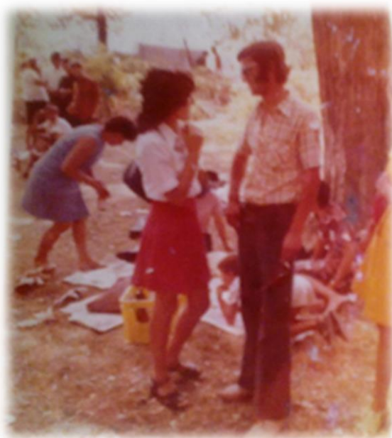
Slika 53.: Prizor s derneka na Vrljici 1971.

Iako je bilo mnoštvo ljudi, svi su se strpljivo i bez žurbe razilazili. Zastajkujući u manjim društvima, kako bi pozdravili poznanike i prijatelje s kojima se nisu dugo vidjeli. Budući da se i misa i dernek održavaju na istom prostoru, u trenu, pobožnu atmosferu i litugijske pjesme, zamijenila je glazba i pjesma iz zvučnika postavljenih na okolna stabla.