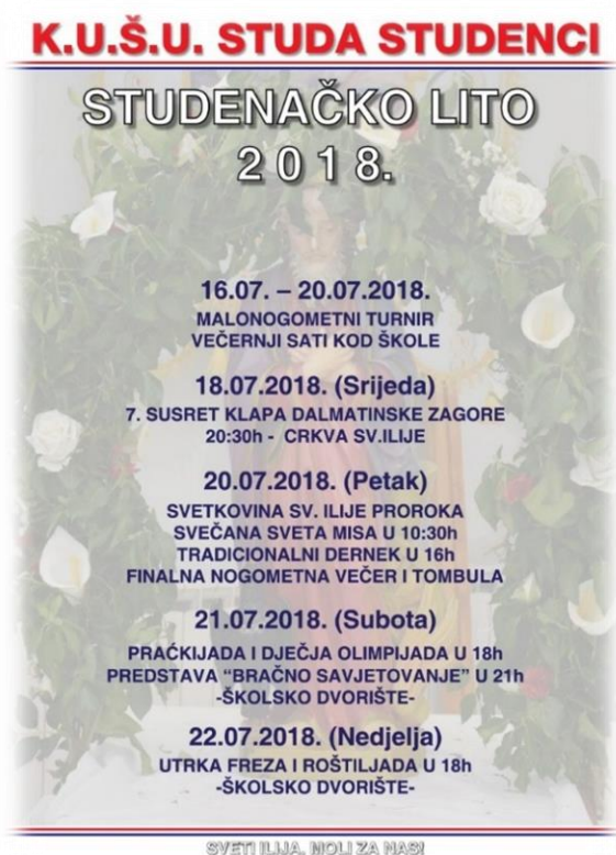
Slika 22.: Plakat s programom „Studenačko lito 2018.“

Koliko je Sveti Ilija prisutan u životu Studenčana, kako u njegovom pobožnom, tako i zabavnom dijelu, uvjerila sam se odmah na početku pripreme za ovo istraživanje, kada sam na Internetskim stranicama župe Studenci, pronašla plakat K.U.Š.U Studa – Studenci 203 kojim se najavljuje program za Studenačko lito 2018. , gdje se, između ostalog, najavljuje i program obilježavanja proslave Svetog Ilije, odnosno Ilina, kako u Studencima zovu Ilindanski dernek. Naime, iako plakat donosi informacije o sportsko-kulturno-zabavnom programu, na plakatu se nalazi svečano okičen lik Svetog Ilije (ta slika se ponavlja svake godine), a u podnožju plakata stoji zaziv: „Sveti Ilija – moli za nas“.