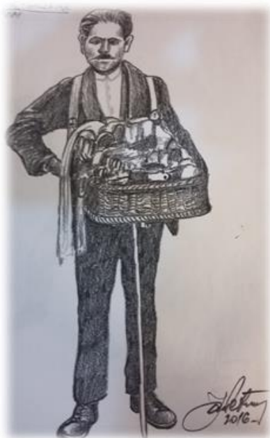
Slika 13.: Imotski galantar Izvor: fotografija originalnog crteža za „Slikovni rječnik Dalmatinske zagore“ (Ivan Branko Šamija i Josip Joško Petričević)

Galantarska torba bila je od šperploče ili jelove daske da bi se mogla lako nositi. Imala je i dva dna u koje je prodavač spremao novac i druge sitnice. Na vanjskoj strani bio je okrugli prsten u koji bi trgovac uvlačio kažiprst da izvuče škafet (ladicu) s drangulijama za prodaju. S prednje strane visjele su kravate, a dio korpe ili torbe, koji je sjedao na trbuh, bio je zaobljen. Galantar je obavezno imao štap na koji se naslanjao sa svojim pokretnim dućanom ili njime davao znak galantarskoj družini da krenu na novu „poštu“ jer od one na kojoj su stajali „nije bilo vajde“(koristi).