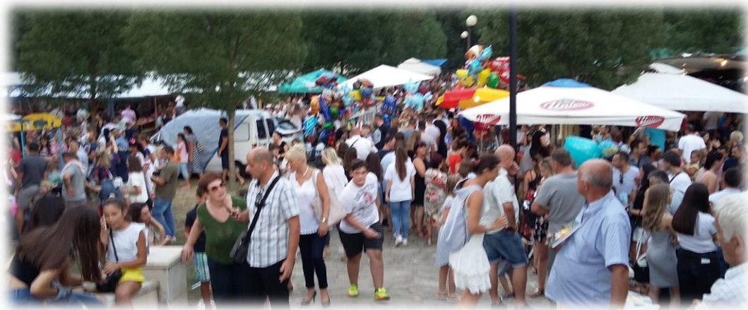
Slika 56.: Prizor s derneka na Vrljici 2018. Izvor: osobna snimka 15. kolovoza 2018.

Da i dernek na Vrljici s vremenom postaje suvremeno organizirano događanje upriličeno prigodom obilježavanja važnog datuma za zajednicu, pokazuje i podatak da se paralelno s programom bogoslužja u povodu Velike Gospe, u novije doba (s početkom devedesetih godina prošlog stoljeća) objavljuju i programi popratnih događanja koja su nekada bili sastavni dio derneka, a sada su posebno organizirane manifestacije. Osim što su organizirane u istom vremenskom periodu ili čak isti dan, one najčešće nemaju prevelike povezanosti s dernekom.