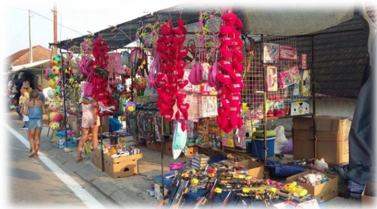
Slika 40.: Galentarski štandovi uz cestu na Stipanjdanskom derneku Izvor: osobna snimka 3. kolovoza 2017.

Dva ili eventualno tri punkta na šetnici bilo je rezervirano za sladoledare. Ispred gostionica, koje su i inače bile uz samu prometnicu, postavljeni su improvizirani stolovi i vanjski šankovi za točenje pića. Na terasama kafića organizirana je živa glazba, gdje su mladi bendovi svirali i pjevali raznolik repertoar pjesama... redoviti i onaj po narudžbi . Ostali štandovi većinom su bili s proizvodima od plastike: igračkama, loptama, plastičnim pištoljima, puškama..sunčanim naočalama. Na nekoliko štandova nudio se nakit (bižuterija), narukvice, lančići, ogrlice... Iako se prethodnih godina na Stipanjdanskom derneku moglo kupiti i neke domaće proizvode i suvenire (drvene kuhače, bukare, pletene košare, krtole i sl.), ove dvije godine, najviše je bilo trgovačke robe industrijske proizvodnje i proizvoda poput igračaka za one najmlađe. Na nekoliko štandova bilo je moguće kupiti i odjeću. Na omanjim improviziranim štandovima nalazila se i gomila „sprženih“ CD - ova s različitom glazbom. Također na dva proširenja (cesta prema staroj crkvi) i na Stublima, postavljeni su vrtuljci (ringišpili). Dva manja za mlađu djecu i jedan veliki. Uz ringišpile postavljeni su veliki napuhani trampolini.