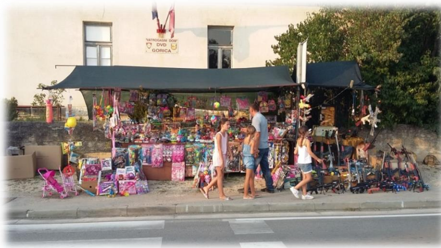
Slika 43.: štand s igračkama i „oružjem“..na Stipanjdanskom derneku Izvor: osobna snimka 3.kolovoza 2017.

Nekadašnji derneci bili su prilika za kupnju i industrijskih proizvoda i galanterije, budući da, se tijekom godine to nije moglo ni imalo gdje nabaviti. Tada su se u rijetkim dućanima mogli kupiti većinom prehrambeni proizvodi. Iako su danas, gotovo svakodnevno, djeca u mogućnosti u trgovačkim centrima kupovati različite artikle, kupovina na derneku i prodaja takve robe, s vremenom se samo povećavala.