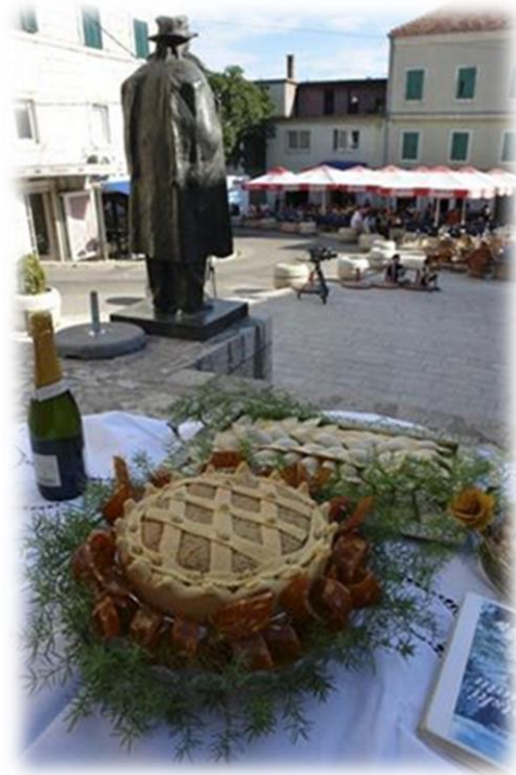
Slika 29.: Festival Imotske torte i rafijola

Imotskom, nazočio i kardinal Josip Bozanić, koji je tom prigodom posvetio nova bakrena vrata na crkvi svetoga Franje, a potom je predvodio procesiju i misno slavlje kod spomen križa na Topani. Te godine održan je i prvi Festival Imotske torte i rafijola , koji se još nekoliko godina održavao uz blagdan Gospe od Anđela. Imotsku tortu, rafiole, ali ni druge tzv. tradicijske