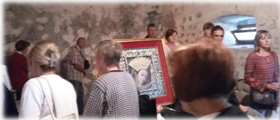
Slika 51.: Pobožnosti oko Gospine slike u crkvi na Opačcu

„Imočani od davnina zavjetuju Velikoj Gospi u crkvi Gospe od Ružarija na Opačcu, najstarijoj zavjetnoj crkvi u ovom kraju, obilaze i klanjaju se Gospinoj slici, prinose joj darove i upućuju molitve.“ 284