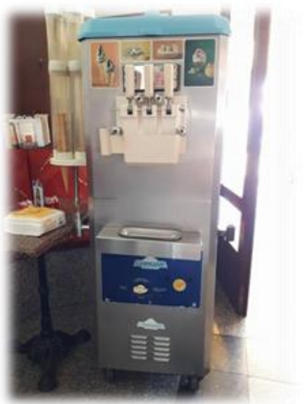
Slika 9.: Aparat za sladoled, na Stipanjdanskom derneku

Osim jabuke, koja se više darivala djevojkama kao simbol ljubavi, rashlađena, slatka lubenica, bila je glavna poslastica kojom se zaslađivalo i rashlađivalo za vrijeme ljetnih derneka, širom Imotske krajine i zapadne Hercegovine. Negdje do kraja šezdesetih godina prošlog stoljeća, rashlađena lubenica (prethodno potopljena u hladnu tekuću vodu ili stavljana na led) osvježavala je poput nešto novijeg proizvoda – sladoleda, koji se na dernecima masovnije i redovitije počeo prodavati s pojavom „aparata za sladoled“ koji su se na dernecima pojavili krajem šezdesetih i početkom sedamdesetih godina prošlog stoljeća. Od tada je sladoled s aparata postao, ne samo za najmlađe, nego i za nešto starije generacije, glavna poslastica koja se kupovala na derneku.