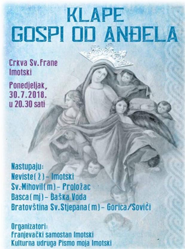
Slika 26.: Plakat Klape gospi od Anđela

Istraživanje za potrebe ove studije slučaja, provela sam 2017. i 2018. godine, na sam blagdan Gospe od Anđela 2. kolovoza, kada su se isti dan održavali vjerski obredi, ali i proslava Dana