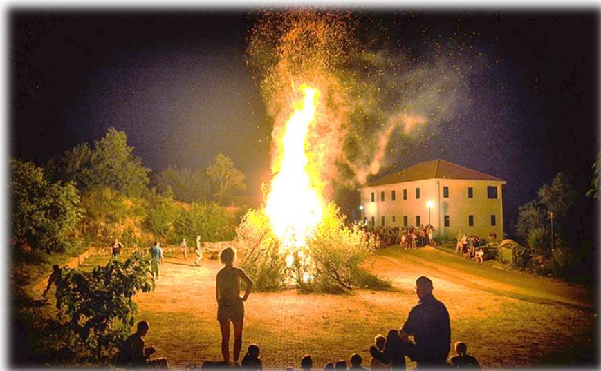
Slika 5.: Svitnjak u Imotskom na Jezeru 2016.