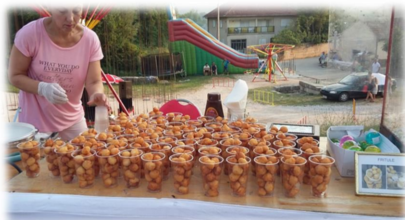
Slika 6.: Štand s fritulama na Stipanjdanskom derneku u Gorici 2017.