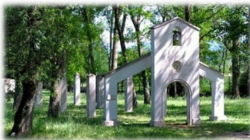
Slika 48.: Zelena katedrala na Vrljici u Prološcu

se u blizini nalazi neko veće marijansko svetište“ (usp. Belaj, M.2007:51). Da se blagdan Velike Gospe u Prološcu smatra najznačajnijim, govori i podatak, da je Proložac, kao novoosnovana općina, za Dan Općine Proložac, odredio upravo 15. kolovoza, kada je blagdan Velike Gospe, a ne sv. Mihovila (29. rujna). Za blagdan Velike Gospe 15. kolovoza, Gospi na Vrljiku dolazi mnoštvo vjernika iz ove župe, ali i iz cijele Imotske krajine, zapadne Hercegovine i nekih udaljenijih mjesta. Na prostoru svetišta Velike Gospe na Vrljici, nalaze se tri sakralna objekta posvećena Blaženoj djevici Mariji. To su: Crkva Uznesenja Blažene Djevice Marije na Durmiševcu (iz 1873.), Crkvica Sv. Marije , na arheološkom lokalitetu Opačac (iz 1719.) i Zelena katedrala na lokalitetu Lučica (1995.).