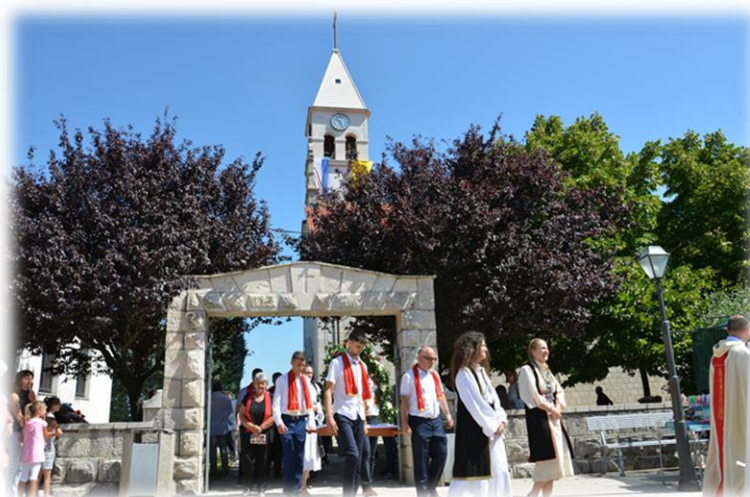
Slika 21.: Procesija ispred crkve sv. Ilije (20.7.2018.)