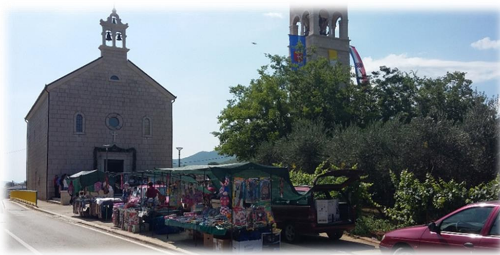
Slika 18.: dernek ispred crkve u Runovićima. (pogled prema istoku)