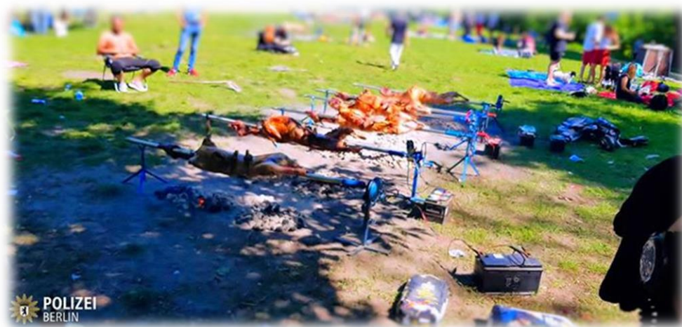
Slika3.: „Dernek“ u berlinskom parku Friedrichshain 8.5.2018.

„Policija je u berlinskom parku Friedrichshain u nedjelju pozvala vatrogasce nakon što je grupa ljudi 'okrenula' 12 janjaca na ražnju. Problem je bio u tome što je užareni ugljen bio na tlu. Isprva nitko od okupljenih nije želio preuzeti odgovornost, dok policija nije pozvala vatrogasce. Nakon toga električni ražnjevi, koje su pokretali akumulatori iz automobila su razmontirani, a vatrogasci su ugasili vatru. Neki janjci pojedeni su na licu mjesta, dok su drugi spremljeni u automobile. Tagesspiel navodi da je riječ o grupi ljudi koji dolaze iz BiH. Berlinska policija je uzela podatke odgovornih i napisala izvještaj uredu javnog tužitelja, koji će odlučiti hoće li kazniti ljubitelje pečene janjetine, a o ovom neuobičajenom slučaju izvjestili su i na svojoj Facebook stranici 8.5.2018.“ 47