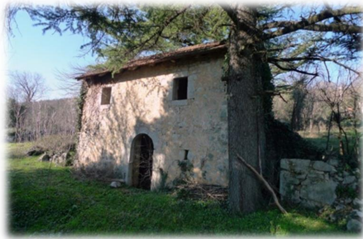
Slika 35.: Osmanska carinarnica (đumrukana) u Gorici

Povijesni naziv za širi prostor u kom su smještene naselja Sovići i Gorica je Donja Bekija (tur. bekky = ostatak). Naziv Bekija datira još od vladavine Turaka koji su od svih osvajača ostavili najviše tragova na ovim prostorima. Vrijedan spomenik nekadašnje materijalne kulture iz turskih vremena su i turske kule smještene u Gorici, od kojih je najznačajnija bila turska carinarnica zvana „Đumrukana”. 244