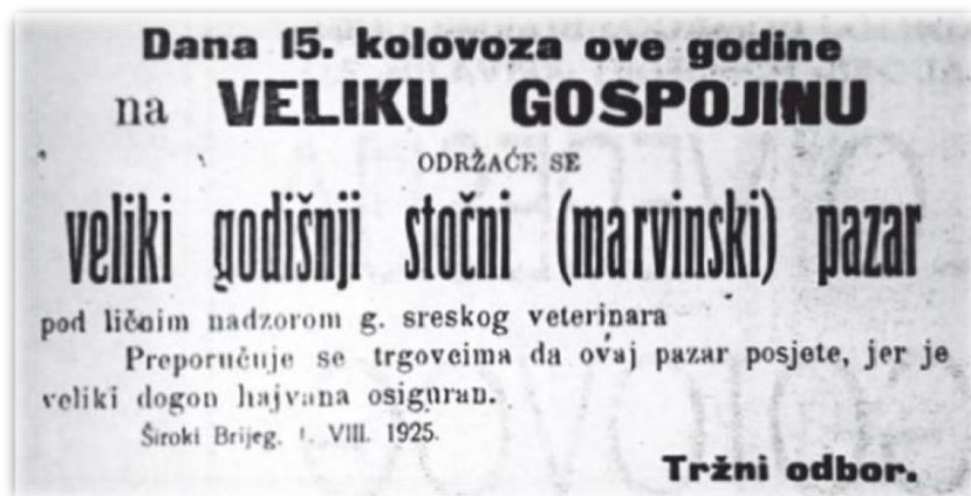
Slika.12.: Plakat iz 1925. najava pazara „na Veliku Gospojinu“

Jednako je tako i trgovina stokom, odnosno prodaja stoke, koju su u ovim krajevima nerijetko nazivali blagom, bila najčešće organizirana na dane derneka, kada se očekivalo i prisustvo najviše stanovnika, koji su često puta bili i trgovci, ali i kupci. Odnosno, prodavali su vlastite proizvode ili stoku, a kupovali ono što sami nisu proizvodili ili nisu imali. Potvrdu da se organiziranje pazara, još početkom dvadesetog stoljeća, vezivalo uz dernek, našla sam na plakatu iz 1925. godine, kojim se stanovništvo obavještava, da se upravo na „Veliku Gospojinu“ 118 15. kolovoza, organizira sajam u Širokom Brijegu, gdje se održavao i najveći dernek za „Veliku Gospu“ u zapadnoj Hercegovini.