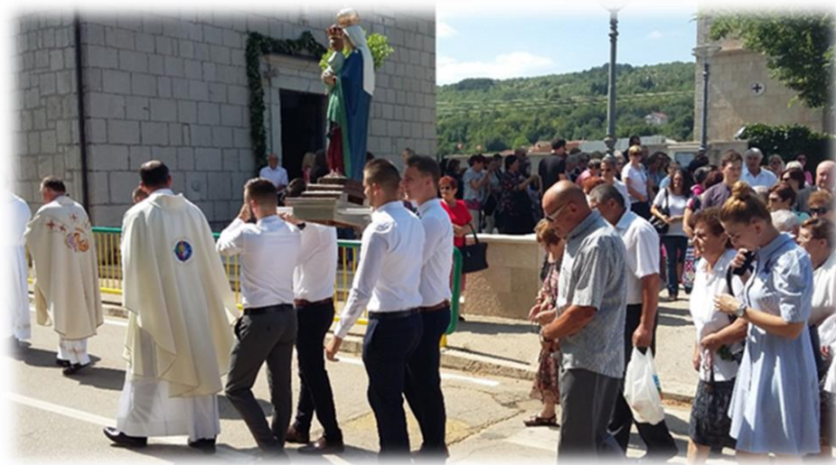
Slika 19.: Procesija s kipom Gospe Karmelske u Runovićima

procesiji, nosila su četiri mladića odjeveni u bijele košulje i tamne hlače. 190 Procesija je krenula ispred crkvenih vrata i nakon ophoda, oko crkve, završila u prostoru Crkvine (na kojem je sagrađena poluotvorena kapela), koji se nalazi preko puta same crkve. Na tom prostoru, na vanjskom oltaru, održano je središnje misno slavlje.