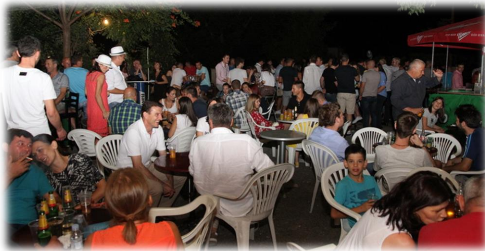
Slika 45.: Druženje uz piće na Stipanjdanskom derneku

Posljedice takvog ponašanja, vidljive su i po tome što ne rijetko, nakon povratka s derneka, po prilično pijana mladež, prespava cijeli sljedeći dan. U to sam se i sama uvjerila, kada sam dan nakon derneka, u poslijepodnevnim satima, otišla do lokalnog kafića, kako bi mi okupljeni mladići ispričali svoja iskustva s jučerašnjeg Stipanjdanskog derneka. Na moje pitanje jesu li bili na derneku i kako je bilo? Od jednog mladića 264 dobila sam odgovor: