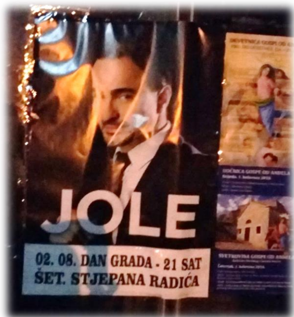
Slika 32.: Plakati Dana grada i Gospe od Anđela

Potvrdu da proslava Dana grada, samim sudionicima ne znači proslavu blagdana Gospe od Anđela, dobila sam u odgovorima većine kazivača, pripadnika različitih dobnih skupina, koje sam kao sudionike upitala znaju li što se slavi i u povodu čega se slavi.