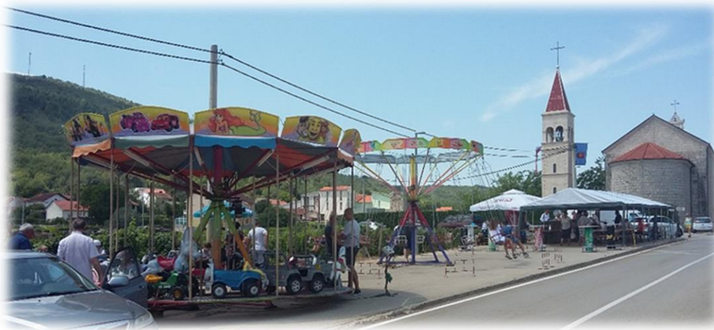
Slika 20.: dernek iza crkve u Runovićima (pogled prema zapadu) Izvor: osobna snimka (16.7. 2018.)