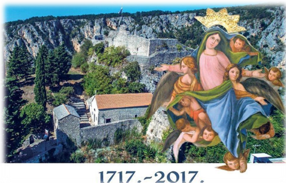
Slika 25.: Plakat proslave Gospe od Anđela uz 300. obljetnicu oslobođenja od turaka

vjernici koji dolaze u crkvu sv. Frane, na proslavu blagdana Gospe od Anđela, ne rijetko preskaču preko gomila različitih otpadaka i rekvizita preostalih od cijelonoćnog slavlja, što je ostavljalo ružnu sliku o gradu i njegovom izgledu baš na sam blagdan Gospe od Anđela. Jedan od razloga za premještanje proslave s 1. na 2. kolovoza, svakako je bio i najavljeni dolazak predsjednice Republike Hrvatske 2017. godine, na sam blagdan Gospe od Anđela, kada se proslavljao i jubilej 300 godina oslobođenja Imotske krajine od turske vladavine . Kako bi osigurali da grad Imotski, na sam Dan grada i blagdan Gospe od Anđela, bude čist te kako bi što bolje organizirali posjet predsjednice i dolazak mnogobrojnih uzvanika iz političkog i vjerskog života 232 na nacionalnoj razini, svečanu proslavu Dana grada, gradske su vlasti premjestile na sam dan, odnosno večer 2. kolovoza, pa su se i vjersko obilježavanje blagdana Gospe od Anđela i proslava Dana grada, u 2017. i 2018. godini održavale isti dan.