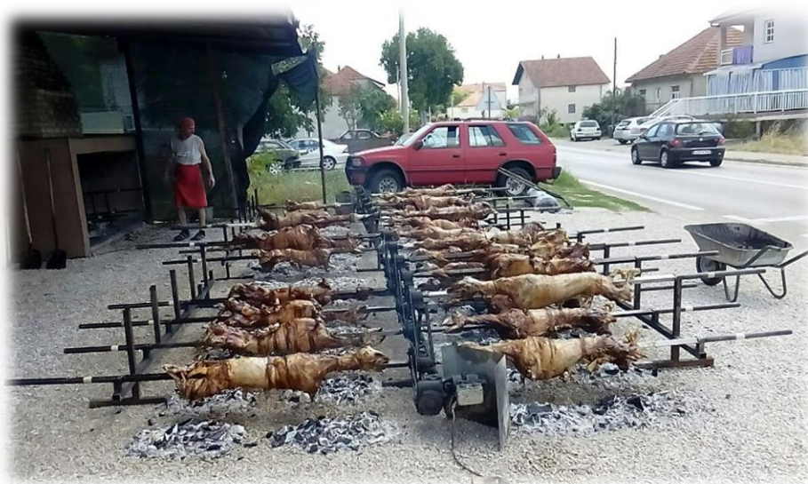
Slika 8.: Modernizirano pečenje više janjaca na ražnju za dernek Snimio: Dragan Vlašić 3.8.2017.

janjetine. Kao što pogled na brojne štandove prepune galentarske robe ili glasan zvuk glazbe s ringišpila, za većinu sudionika čine sliku derneka, miris pečene janjetine upotpunjuje tu sliku osjetom koji sva događanja, pa i ona koja nisu povezana s hranom, povezuje s doživljajem derneka. Upravo miris pečene janjetine i neke uobičajene aktivnosti, primjerice šetnju ili kupovinu, smještaju u kontekst derneka, tako da, kad se govori o šetnji po derneku ili kupovanju na derneku, uvijek navodi i miris pečene janjetine koji se širio zrakom i koji je, i tu aktivnost smještao upravo na dernek.