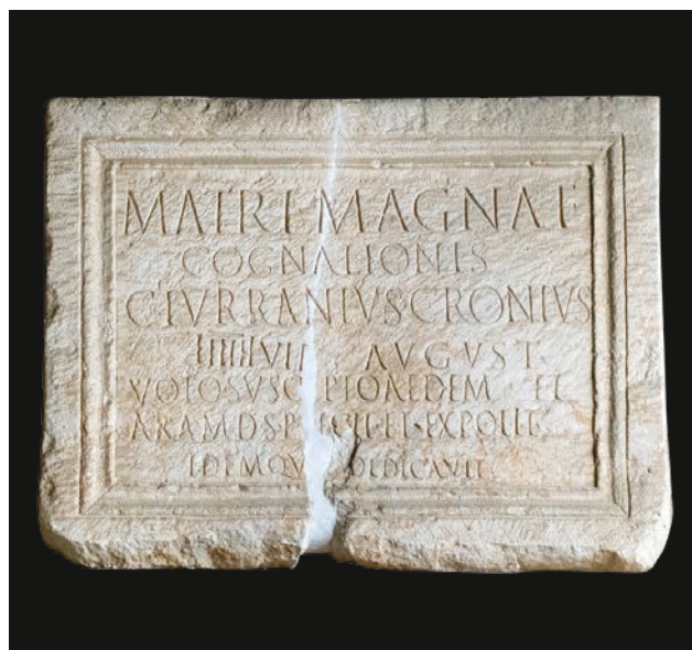
Slika 10 Ploča s natpisom Gaja Turanija Kronija (OH)