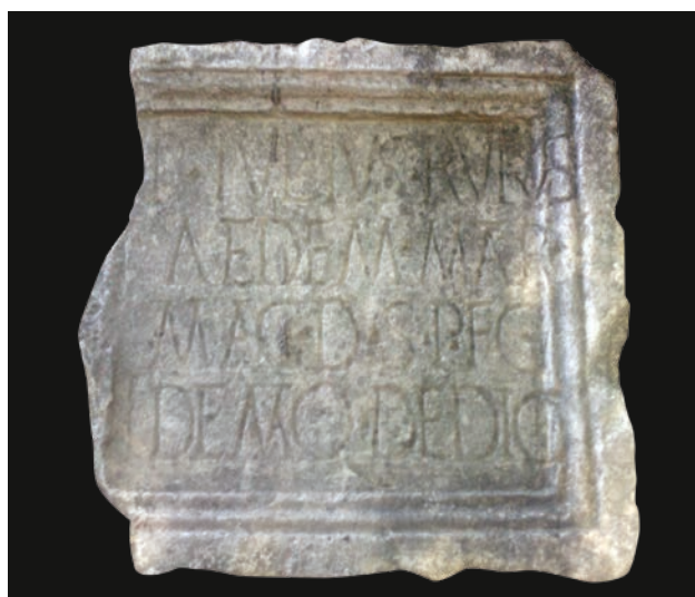
Slika 4 Ploča s natpisom Publija Julija Rufa (IVB)