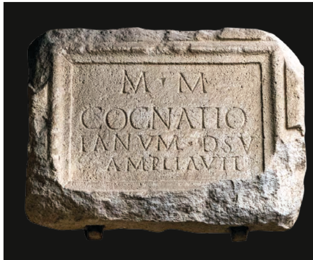
Slika 9 Ulomak ploče s kognacijskim natpisom (OH)

Kognacija je proširila svetište Velike Majke prema svom zavjetu.