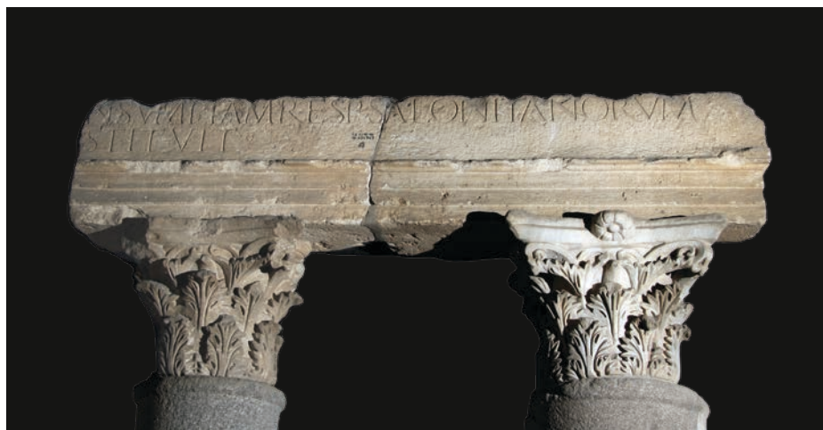
Slika 5 Arhitrav s natpisom o obnovi hrama (TS)