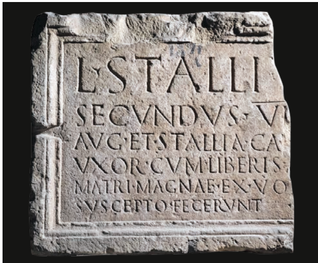
Slika 8 Ulomak ploče s natpisom Lucija Stalija Sekunda (OH)