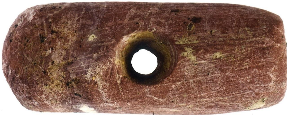
Kukunjevac - Brod, kameni predmet, kat. br. 151 Kukunjevac - Brod, stone object, cat. no. 151