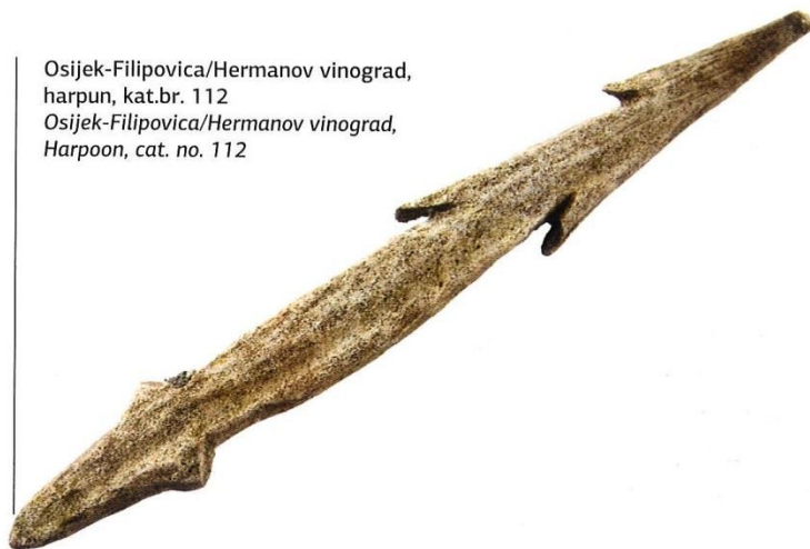
Osijek-Filipovica/Hermanov vinograd, harpun, kat.br. 112 Osijek-Filipovica/Hermanov vinograd, Harpoon, cat. no. 112

mjeri srna i divlja svinja. Često su na nalazištima prisutni ograničeni dijelovi tijela, a na samim kostima tih životinja znatno je manje tragova mesarenja u odnosu na kosti domaćih životinja. To ukazuje da se inicijalno komadanje trupla odvijalo negdje drugdje dok su samo određeni dijelovi uzimani za daljnje korištenje. Odrasli jelen osigurava priličnu količinu mesa dok dijelovi skeleta (rogovlje i kosti) mogu poslužiti za izradu alatki. Malobrojni ostaci svinja često nisu specifički određeni pa je teško razmatrati o značenju divlje svinje kao lovne vrste.