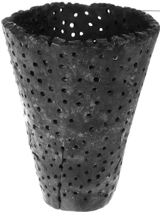
Čepin-Ovčara/Tursko groblje, cjediljka, kat.br. 66 Čepin-Ovčara/Tursko groblje, Colander, cat. no. 66

koji dolaze iz različitih polja znanosti: paleontologije, veterinarske medicine i arheologije uslijed čega ciljevi i metode istraživanja nisu nužno usklađeni.