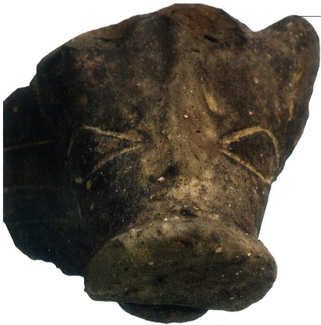
Dobrovac-Kučište I, zoomorfna noga žrtvenika, glava vepra?, kat.br. 159 Dobrovac-Kučište I, zoomorphic altar leg, boar's head?, cat. no. 159

to vrijeme dolazi do obnavljanja šuma, a kao posljedica raste i broj divljih životinjskih populacija u okolišu. S druge strane, krajem neolitika vjerojatno dolazi do određenih raslojavanja društva pa se možda lovu pridavalo veće značenje kao izvoru hrane, ali i ugleda i moći (Miracle, Pugsley 2006, 355).