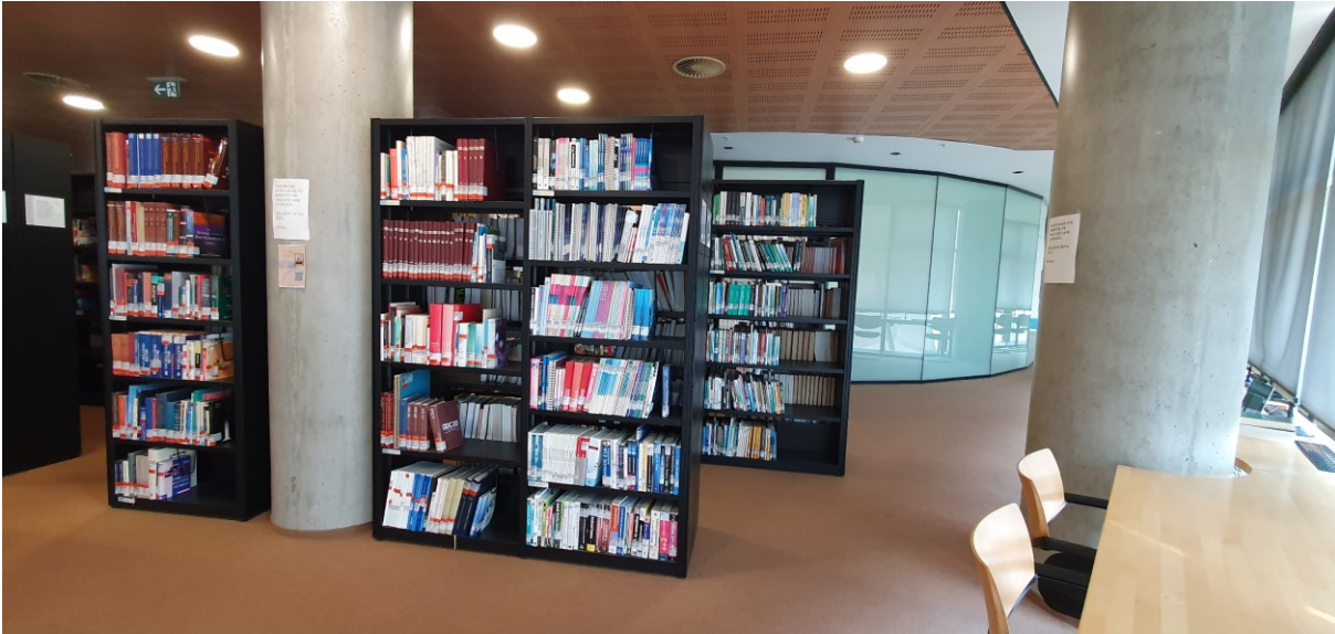
Slika 4: Zbirka za informacijske znanosti u otvorenom pristupu (fotografirano 14. 7. 2024. )

starija i rjeđe posuđivana građa. Takva građa je dostupna za posudbu na zahtjev, koji se može ispuniti isti dan. Premještanjem građe u i iz Zatvorenog spremišta omogućava se cirkulacija aktualne i tražene literature u ograničenom prostoru za slobodan pristup građi Zbirke, te oslobađa mjesto za novu građu.