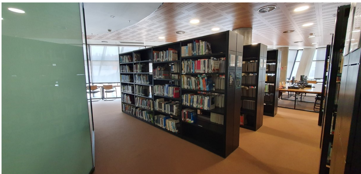
Slika 3: Zbirka za informacijske znanosti u slobodnom pristupu (fotografirano 14.7.2024. )

Zbirka kontinuirano raste iz godine u godinu, te se prostor za smještaj građe u slobodnom pristupu smanjuje. Slike 3 i 4 prikazuju trenutni izgled Zbirke u Knjižnici. U svrhu što efikasnijeg korištenja prostora i funkcija Knjižnice služi Zatvoreno spremište, gdje se redovito premješta