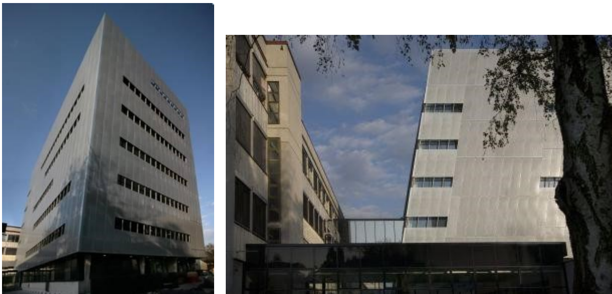
Slika 1: vanjski izgled zgrade Knjižnice Filozofskog fakulteta u Zagrebu

Na slici 2 se prikazuje presijek zgrade Knjižnice. Zgrada Knjižnica je povezana sa zgradom fakulteta kroz glavni hodnik te mostom koji ju spaja s južnom stranom fakulteta. U podrumskom području se nalazi zatvoreno spremište koje čuva u optimalnim uvjetima Zbirku za staru i rijetku građu, otprilike polovicu građe knjižnice te prostorije za individualna istraživanja. S obzirom da se tamo čuvaju vrijedni primjerci stari i do nekoliko stotina godina i knjige za čije korištenje je potrebna posebna dozvola, to je dio Knjižnice gdje su sigurnosne mjere najviše i uvijek aktivne. Pristup zatvorenom spremištu imaju samo djelatnici Knjižnice, međutim moguće je zatražiti građu koja se tamo čuva te će knjižničari spremišta unutar jednog ili dva dana omogućiti pristup građi na pulu prizemlja. Na svih pet katova zgrade se može otvoreno pristupiti knjižničnoj građi koja je raspodijeljena prema predmetnim skupinama.