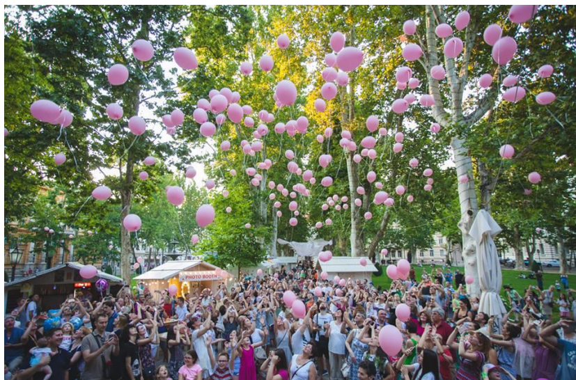
Slika 7. Zatvaranje festivala Slatki gušti , 2017.

Ljeto na Zrinjercu nekoliko godina bilo je nezaobilazna je točka zagrebačke ljetne kulturne scene. 51 U sklopu ovog festivala na Zrinjercu se postavljaju kućice i stolovi s hranom i pićem gdje posjetitelji mogu uživati u bogatoj ponudi uživajući u pogledu na zelenilo. Večeri su obično bile rezervirane za koncerte hrvatskih glazbenika, poput, primjerice, Marijana Bana (2017.) i grupe Detour (2019.). Zadnje objave na službenim stranicama datiraju iz 2019. godine te se možemo nadati da će manifestacija ponovno zaživjeti.