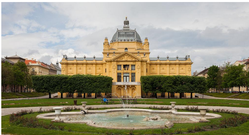
Slika 11. Pogled na zgradu Umjetničkog paviljona s Trga kralja Tomislava

Umjetnički paviljon ima istaknuto mjesto u povijesti hrvatske moderne umjetnosti. U njemu su se održale mnogobrojne izložbe poput izložbe posvećene Grupi Zemlja 1976. godine, izložba Grupa trojice 1976. godine te izložba posvećena Vlaha Bukovcu 2018. a, od međunarodno poznatih posebno se ističu izložba njemačkog umjetnika Geoga Grosza (Berlin, 1893. – 1959.) 1932. godine 61 te francuskog kipara Auguste Rodina (Pariz, 1840. – Meudon, 1917.) 2015. godine. 62 Umjetnički paviljon je 1954. godine postao samostalna kulturna ustanova. 63 Kao i mnoge zgrade u središtu grada, i on je oštećen u spomenutim potresima te još uvijek traje postupak njegove obnove.