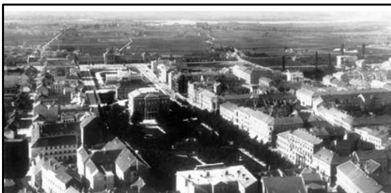
Zrinjevac i pogled na zgradu Hrvatske akademije znanosti i umjetnosti, 1898.

Slajd 5. Prikaza je Zrinjevac i pogled na zgradu HAZU, 1898. godine