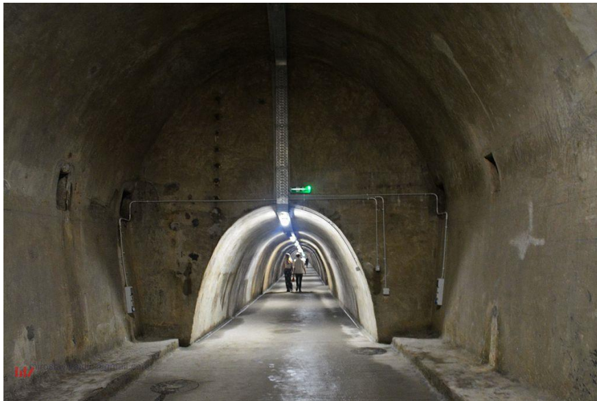
Slika 1. Tunel Grič, pogled iz središnje dvorane

Hrvatske ne dopušta uvid u dokumente iz tog razdoblja, te nije poznato kada je izgrađena velika središnja dvorana dugačka 100 metara. 21 (sl. 1)