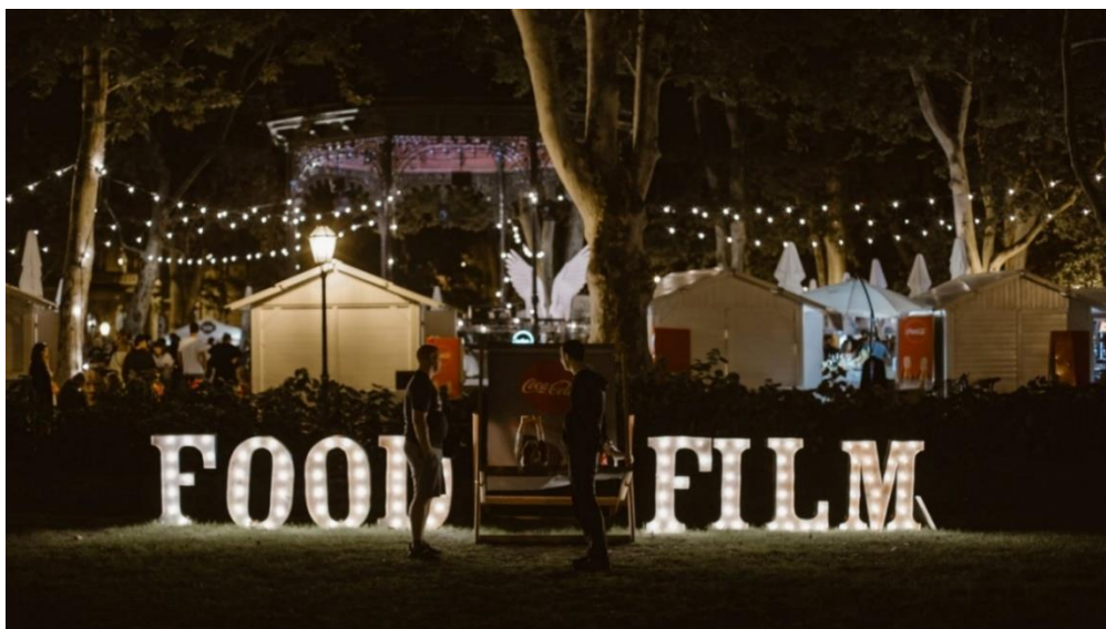
Slika 8. Food and Film festival, 2019.

Uz prethodno navedena događanja, Zrinjevac je bio dom i brojnim drugima, poput festivala slastica Slatki gušti (2012. – 2018.) 52 i Food film festivala 53 (2015. – 2023.) koji objedinjuje ljubav prema hrani i filmovima, pa tako posjetitelji imaju priliku pogledati filmske uspješnice dok uživaju u hrani.