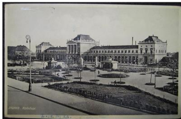
Glavni kolodvor, 1933.

Zgrade koje sa istočne i zapadne strane omeđuju Trg izgrađene su između 1892. i 1904. te na njima možemo jasno pratiti razvoj neostilova na prijelazu stoljeća: neorenesansa, neobarok i secesija.