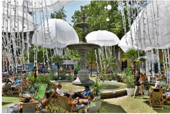
More knjiga, 2019.

Slajd 7. Prikazana je manifestacija More knjiga 2019. godine