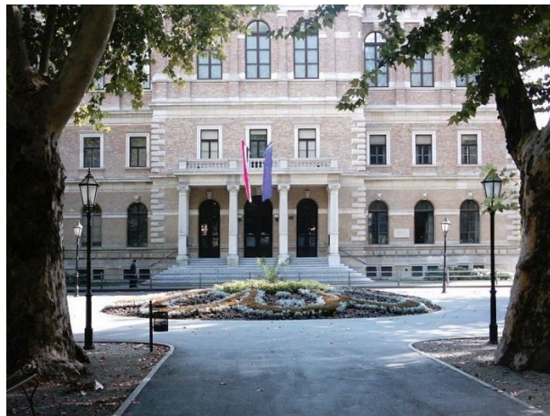
Slika 4. Pogled na zgradu Hrvatske akademije znanosti i umjetnosti, gledano sa Zrinjevca

Park unutar trga proteže se od meteorološkog stupa na sjevernoj strani preko središnjeg paviljona do polukružno smještenih bista velikana hrvatske povijest na južnom kraju. Gledajući na jug pogled promatrača zaokuplja zgrada Hrvatske akademije znanosti i umjetnosti, čija je bila dodatni poticaj za izmještanje sajmišnog prostora i preuređenje trga u perivoj. Gradnja Akademije, koji ju projektirao poznati austrijski arhitekt Friedrich von Schmidt (Gschwend, 1825. – Beč, 1891.) uz pomoć Hermana Bolléa (Köln, 1845. – Zagreb, 1926.), dovršena je 1884. godine, a iste godine otvorena je i Strossmayerova galerija na drugom katu građevine. 44