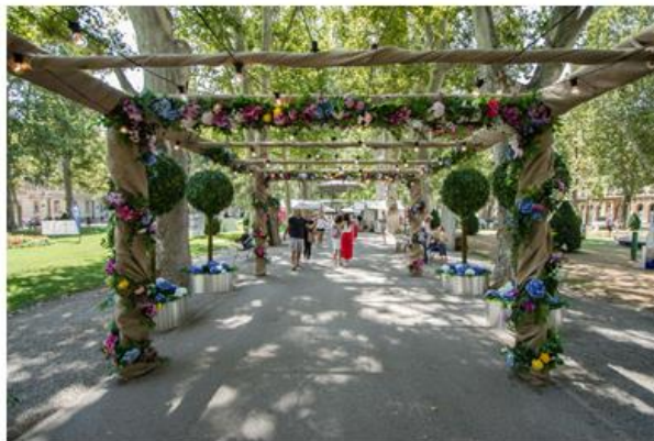
Ljeto na Zrinjercu, 2019.