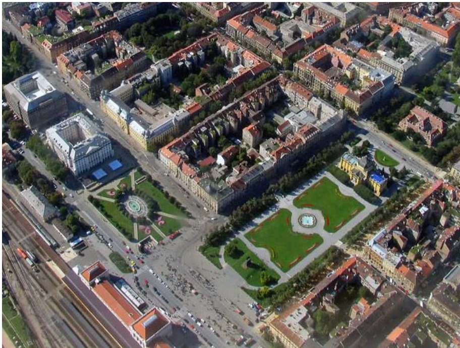
Slika 10. Pogled iz zraka na Trg kralja Tomislava, Glavni kolodvor i Umjetnički paviljon, 2010.

Zgrada željezničkog kolodvora (sveukupne dužine od 186,5 m) počela se graditi 1890. godine prema projektu mađarskog arhitekta Ferenc Pfaffa (Mohač, 1851. – Budimpešta, 1913.), a projektirana je u neoklasicističkom stilu s istaknutim središnjim i krajnjim dijelovima. Peroni su smješteni duž cijele južne strane kolodvora s otvorenom mogućnošću izgradnje cestovnog podvoznjaka ispod glavnog predvorja, što nije nikad realizirano. Od izgradnje pa do današnjih dana, Glavni kolodvor prošao je nekoliko proširivanja i dodavanja perona pa tako danas ima šest perona. 59 Zgrada kolodvora oštećena je u zagrebačkom potresu 23. ožujka 2020., a nešto kasnije i u petrinjskom potresu 29. prosinca 2020. godine što će zahtijevati dodatne obnove kolodvorske zgrade.