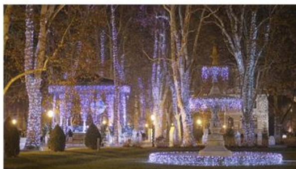
Božićne lampice u vrijeme Adventa, 2019.

Kratka sadržajna razrada: upravo je izgradnja glavne zgrade Akademije bila dodatni poticaj za izmještanje sajmišnog prostora i preuređenje trga u perivoj. Zgradu Akademije projektirao je poznati austrijski arhitekt Friedrich von Schmidt uz pomoć Hermana Bolléa. Zgrada je predana na korištenje 1884. godine, a iste godine otvorena je za javnost i Strossmayerova galerija na drugom katu zgrade