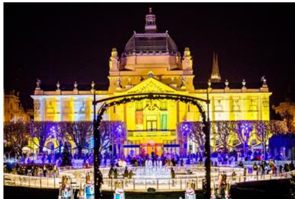
Klizalište u sklopu zagrebačkog Adventa

Paviljon je namjenski izgrađen za održavanje velikih izložbi, a otvoren je 1898. godine izložbom Hrvatski salon.