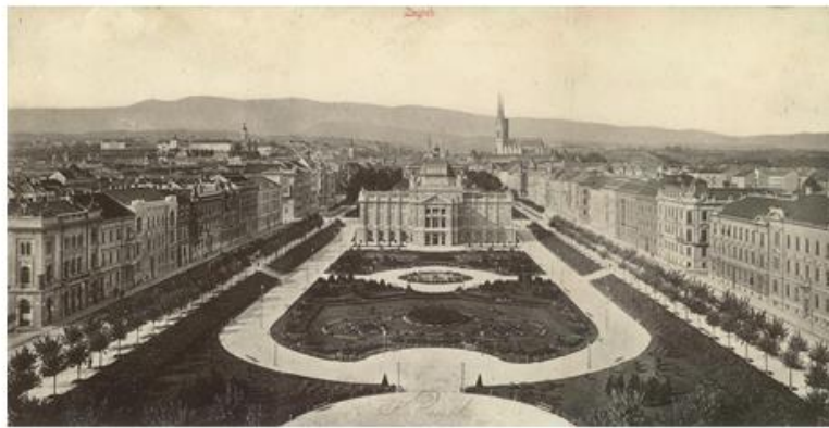
Trg Kralja Tomislava, oko 1900.