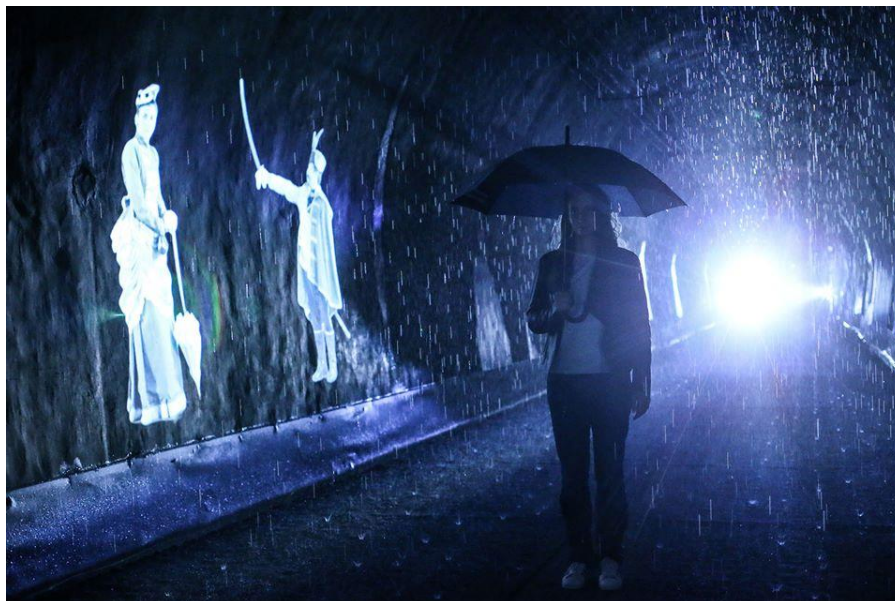
Slika 2. Izložba Croatia je Hrvatska

božićna drvca, umjetni led kao i stropna instalacija umjetnice Ide Blažičko, 30 a održavali su se i akustični koncerti. Posjećenost tunela bila je velika, posjetitelji su dolazili fotografirati se u bajkovitom okruženju i uživati u glazbi, a na taj način skratiti put između Mesničke i Radićeve ulice. Kraj Adventa najčešće označava i kraj događanja u tunelu koji opet tone u tišinu bez sadržaja. Ljudi ga većinom koriste samo kao prometni koridor da si skrate put, a posjetitelji se žale na nedostatak legendi koje bi ispričale povijest mjesta.