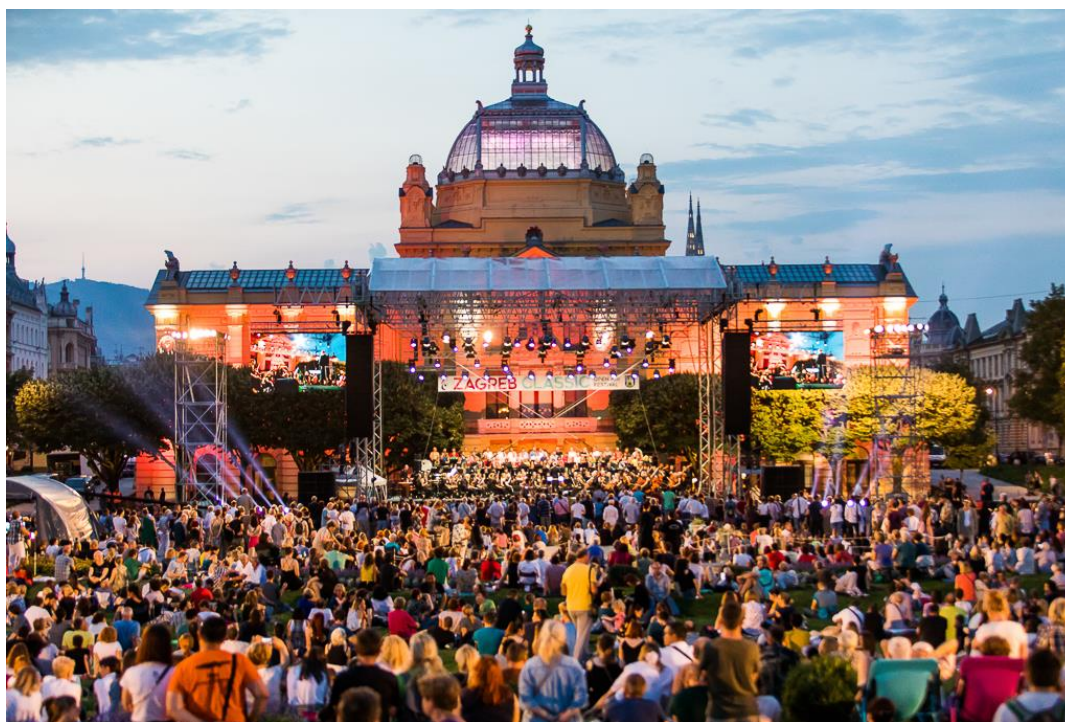
Slika 13. Zagreb classic open air na Trgu kralja Tomislava, 2019.

Trg kralja Tomislava mjesto je planiranih i spontanijih okupljanja i druženja ljudi kroz cijelu godinu. S obzirom na položaj uz glavni željeznički kolodvor postao je točka okupljanja turista i određena točka orijentiranja u gradu, a zasigurno prva upečatljiva slika grada nakon izlaska iz kolodvora. Zadnjih godina Tomislavac je postao i okupljalište skupina emigranata, vjerojatno zbog blizine željezničkog kolodvora, što kod dijela stanovništva izaziva strah od odlaska na Tomislavac, posebice u večernjim satima. 71