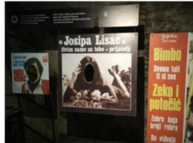
Slajd 7. Prikazani su vizuali s izložbe Croatia je Hrvatska

Kratka sadržajna razrada: 16. rujna 2017. godine u prostorima tunela Grič otvorena je izložba Croatia osiguranja pod nazivom Croatia je Hrvatska. Izložba je bila postavljena u četiri kraka tunela kao svojevrsni vremeplov kroz 133 godine Croatia osiguranja i povijesti Hrvatske. Za tu priliku u prostor Tunela postavljene su željezne konstrukcije s pločama na kojima su se mogle pročitati informacije o poznatim hrvatskim umjetnicima, izumiteljima i političarima, kao i o događajima koji su obilježili hrvatsku povijest