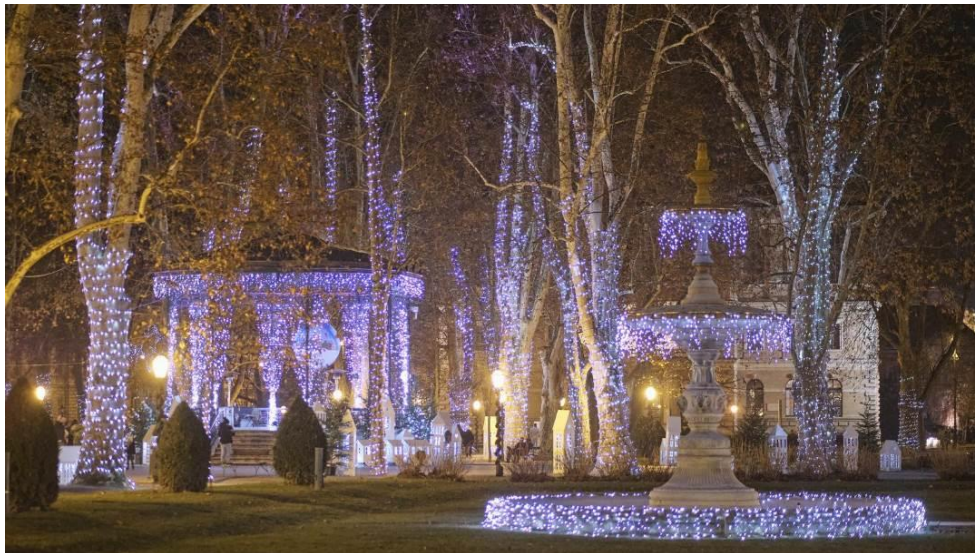
Slika 5. Lampicama ukrašeni Zrinjevac tijekom manifestacije Advent u Zagrebu, 2019.

Trg Nikole Šubića Zrinskog, odnosno i same zelene površine trga, do danas nisu izgubili svoju namjenu stečenu spomenutom zadnjom preinakom, a to je mjesto okupljanja i druženja. Danas u parku uvijek možemo zateći veliki broj ljudi, bilo da uživaju u suncu ležeći na travi ili prisustvuju nekom od mnogobrojnih događaja i koncerata koji se održavaju u središnjem paviljonu. Kroz godine ovaj trg se prometnuo u jednu od najvažnijih turističkih točaka grada čemu svjedoči i velik broj turista koje možemo sresti prilikom obilaska. Zadnjih desetak godina svjedoci smo mnogobrojnih događajima, festivalima i koncertima koji se održavaju na Zrinjercu, a najpoznatiji je svakako zagrebački Advent. Advent na Zrinjercu prometnuo se u središnju točku zagrebačkog Adventa, o čemu dovoljno svjedoči činjenica da je jedan od glavnih događaja koji označavaju početak Adventa, upravo paljenje lampica na Zrinjercu (sl. 4). Svake godine tisuće lampica postavljaju se na stabla i središnji paviljon te imaju zadatak dočarati svečanost prostora i blagdanski ugođaj.