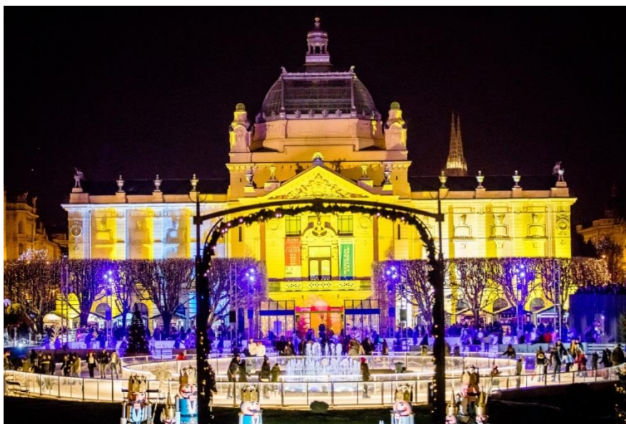
Slika 12. Klizalište na Trgu kralja Tomislava, 2022.

spomenika postavljen je na svoje mjesto tek 1947. godine. 64 Postavljanje spomenika obilježili su politički, ideološki i umjetnički sporovi zbog čega je i postavljen tek 1947. godine. Odlučeno je da će kip biti postavljen tako da gleda prema Glavnom kolodvoru kako bi „poželio dobrodošlicu“ posjetiteljima Zagreba. Ubrzo nakon postavljanja s postolja su skinuti izvorni Frangešovi reljefi obzirom da je jedan prikazivao papu kako kruni kralja Tomislava što nije bilo prihvatljivo tadašnjoj vlasti. Umjesto njih postavljeni su novi reljefi koje su izradili kipari Ivan Sabolić (Peteranec, 1921. – Zagreb, 1986.) i Želimir Janeš (Sisak, 1916. – Zagreb, 1996.), a prikazivali su flotu kralja Tomislava i kralja Tomislava kako miri Srbe i Bugare. Ti reljefi skinuti su 1991. godine nakon promjene vlasti te su vraćeni izvorni Frangešovi reljefi. 65 Postavljanjem kipa kralja Tomislava zaokružena je cijelina trga kralja Tomislava te zajedno čine jednu od najprepoznatljivijih urbanih i povijesnih cjelina Zagreba, koja ujedinjuje hrvatsku prošlost i suvremeni identitet. Upravo je ovaj spomenik i danas najčešće mjesto sastanka na trgu; posjetitelji se okupljaju oko njega i kratak vrijeme sjedeći na njegovom postolju upijajući pogled na uređeni parka.