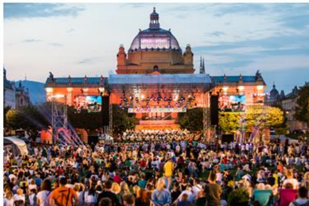
Zagreb classic open air, 2019.