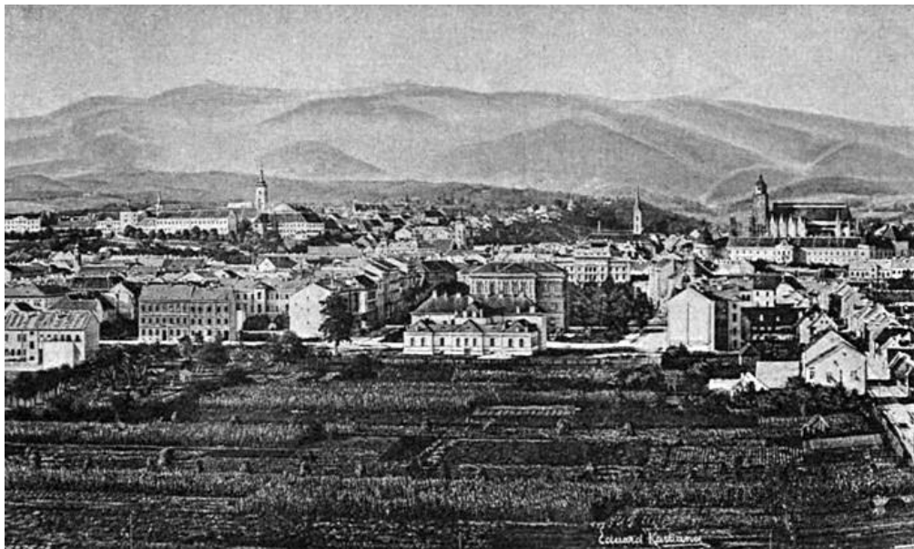
Slika 9. Izgled Trga kralja Tomislava 1892. godine

kao Trg I; 1895. godine mijenja ime u Trg Franje Josipa I.; 1927. dobiva ime po prvom hrvatskom kralju Tomislavu (vladao 910. – 928.) te tako ostaje do danas. 54 Trg kralja Tomislava ima sličnu povijest kao i trg Nikole Šubića Zrinskog, u tome što je i on bio sajmište. Naime, nakon odluke o uređenju Zrinjevca, sajmište se prebacuje na tada bezimni trg na južnom kraju Zelene potkove 1870. godine. 55 Uređenje ovog sajmišnog trga dugo je trajalo, ali usprkos tome on postaje živo središte Donjeg grada, a na njegovom južnom kraju otvara se prvo zagrebačko klizalište. 56 Odluka o uređenju ovog prostora donijeta je nakon odluke o izgradnji glavnog željezničkog kolodvora na njegovom južnom kraju (sl. 9).