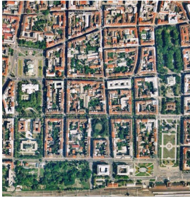
Slika 3. Pogled na Zelenu potkovu iz zraka

Park Nikole Šubića Zrinskog utemeljen je 1826. godine kao stočno sajmište pod nazivom Novi Terg. Rezultat je to nastojanja gradskih vlasti da se sajam prebaci s tadašnjeg Trga tridesetnice (današnjeg Trga bana Josipa Jelačića) na adekvatnije mjesto. 39 Naime, u to vrijeme Novi Terg nalazio se na samom rubu grada te je kao takav predstavljao dobro mjesto za stočni sajam gdje buka i neugodni mirisi životinja nisu smetali stanovništvu. Važna odrednica bila je i neposredna blizina željezničkog kolodvora zbog čega je roba lakše i brže pristizala na sajmište. 40 Do potrebe za preuređenjem ovog trga došlo je nekoliko desetljeća kasnije, točnije 1866. godine, a obilježeno je dvama događajima. Prvi je postavljanje kipa bana Josipa Jelačića na glavnom gradskom trgu te potreba da se sajmište konačno izmjesti s glavnog Trga, a druga je proslava tristote obljetnice smrti Nikole Šubića Zrinskog prilikom čega Novi Terg mijenja naziv i postaje Trg bana Nikole Šubića Zrinskog. Promjenom naziva trga u jednog od najvećih velikana hrvatske povijesti dovelo je u pitanje namjenu trga kao kao isključivo sajmišnog prostora, no idućih nekoliko godina ipak se i dalje nastojalo urediti ga kao sajmišni trg. 41