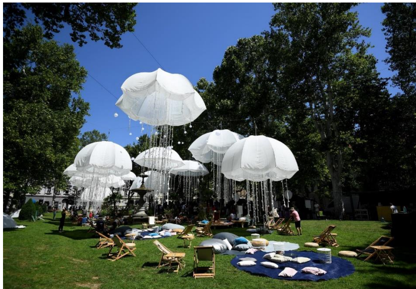
Slika 6. More knjiga na Zrinjvcu

Osim lampica svake godine na adventskom Zrinjvcu možemo pronaći i drvene kućice s raznolikom ponudom tradicionalne božićne hrane i pića te rukotvorinama hrvatskih obrtnika. Također, adventske večeri obilježene su koncertima glazbenih sastava ili dječjih zborova, ovisno o rasporedu, 46 što najčešće rezultira posvemašnjom ispunjenošću prostora posjetiteljima. Tijekom manifestacije Zrinjvcem prođu tisuće domaćih i stranih turista, a o njegovoj popularnosti svjedoči i činjenica da je nekoliko godina zaredom proglašen najboljim božićnim sajmom u Europi. 47 Usprkos ovim priznanjima, Advent na Zrinjvcu svake godine naiđe i na kritike među stanovnicima Zagreba koji se žale na buku i gužvu koja im smanjuje kvalitetu života, ali sve to najčešće ostaje zabilježeno samo u vidu negodujućih komentara ispod brojnih novinskih članaka o Adventu. 48