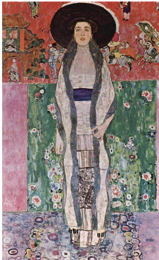
Slika 2. Portret Adele Bloch-Bauer II.