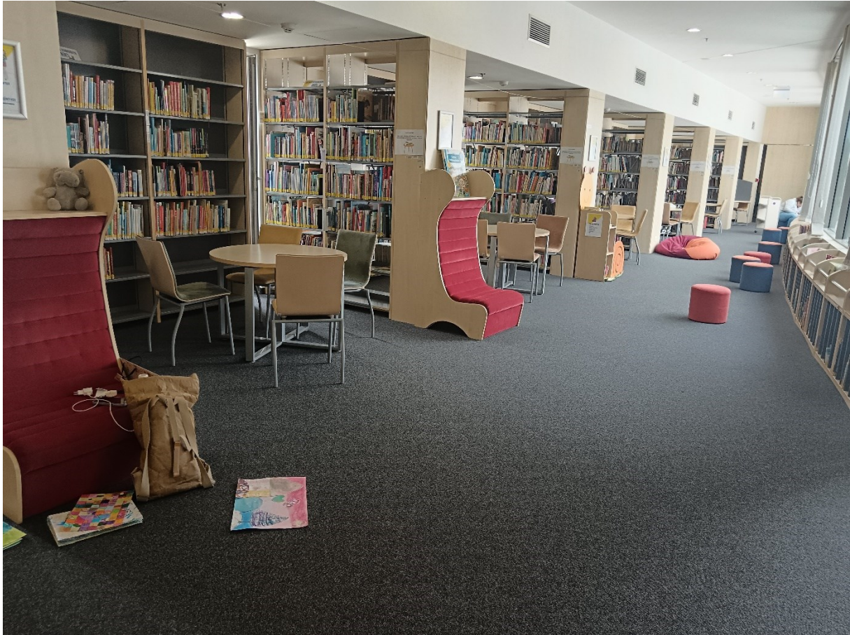
Fotografija 6. Prostor dječje knjižnice