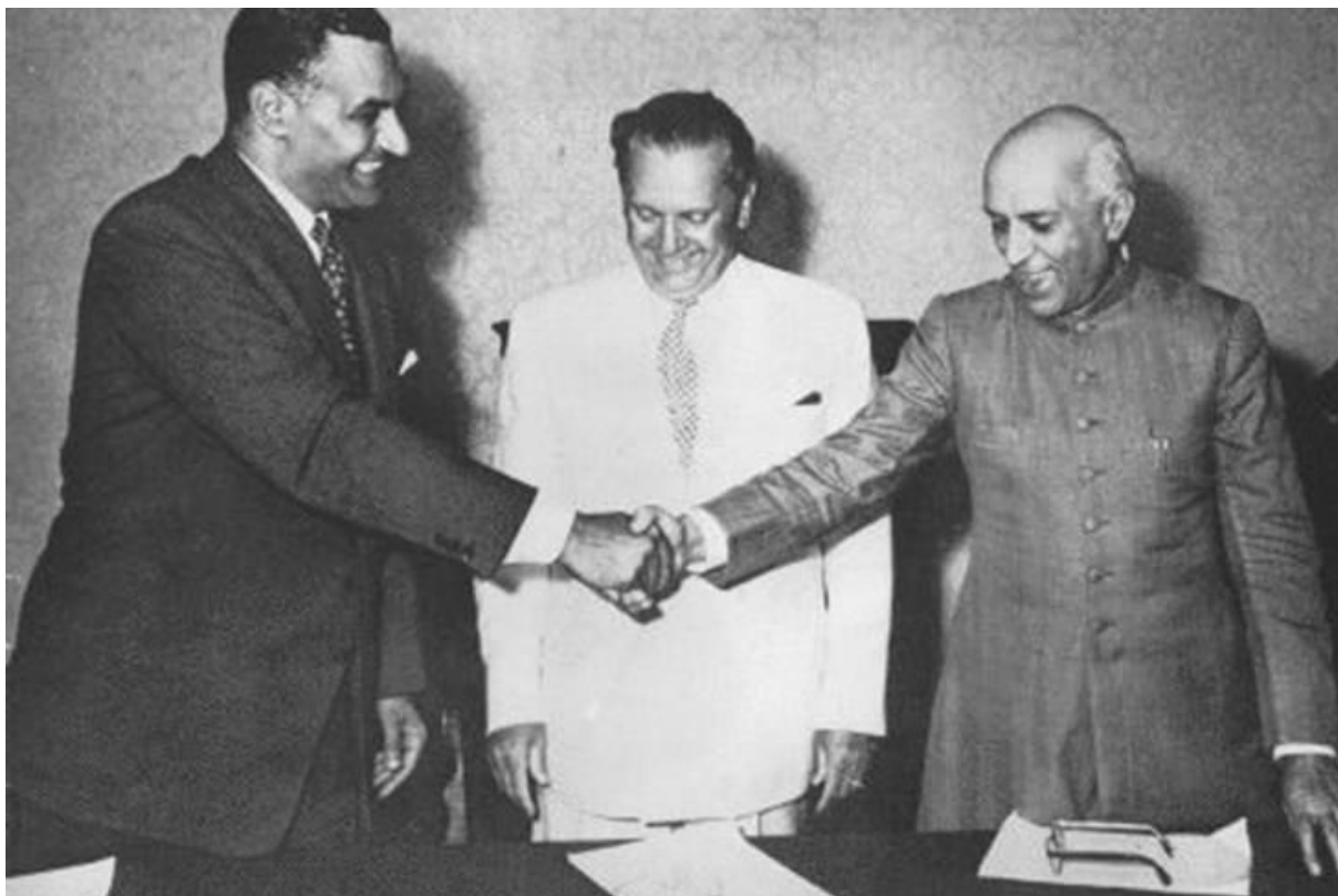
Prilog 1 5

ušao u svakodnevnu upotrebu, a ubrzo i u službeni naslov Pokreta nesvrstanih zemalja. 3 Sam Pokret nesvrstanih službeno je utemeljen na Brijunima 1956., na sastanku Tita, Nehrua i Nasera, što je izazvalo paniku prvenstveno u redovima Sovjeta, koji su, očito, pretendirali da većinu država osnivačica i članica pripoje istočnom bloku kamo im se činilo da siromašne i velikim dijelom socijalističke zemlje i pripadaju. 4