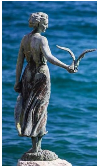
Slika 4. Djevojka s galebom