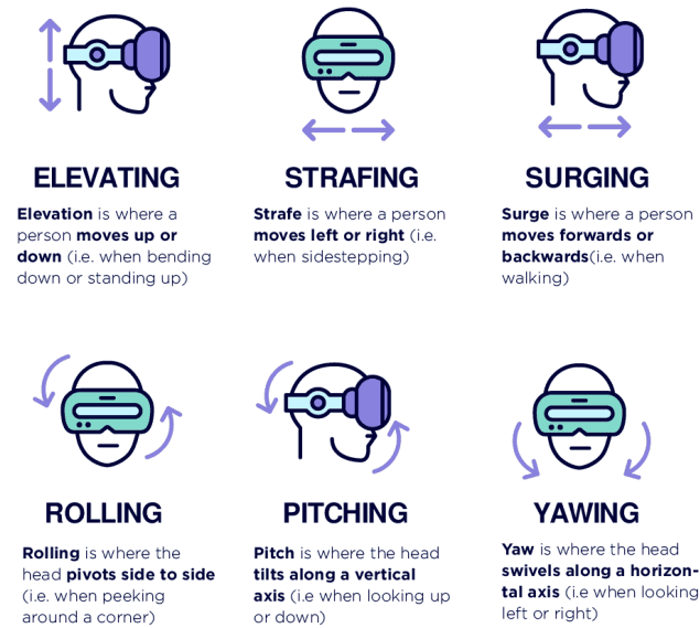
Slika 2. Vizualni prikaz pokreta translacijske i rotacijske osi DoF-a.