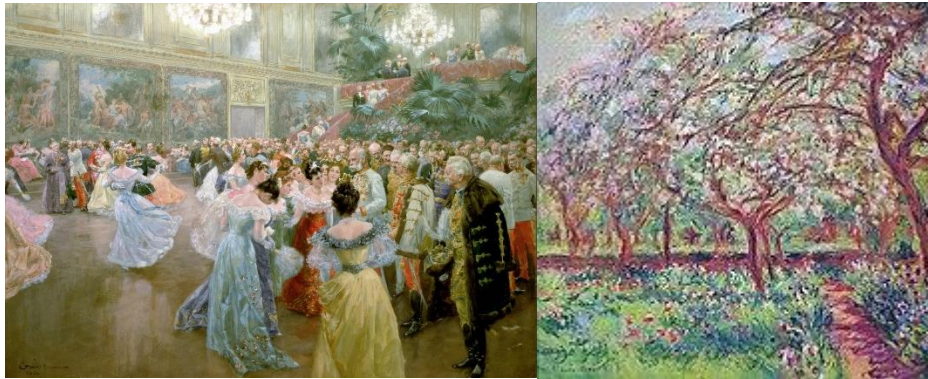
Slika 6. Court Ball at the Hofburg Slika 7. Apple Trees in Bloom at Giverny

Opcija koju možemo iskoristiti u muzejima su virtualne priče. Tokom gledanja filmova i serija ili čitanja knjiga, jeste li ikad razmišljali koliko bi zanimljivo bilo da možete i sami biti u toj priči, da se nalazite u toj okolini, da ste okruženi tim likovima i da proživite njihova iskustva? Upravo to možemo ostvariti sa virtualnim pričama, imamo mogućnost stvaranja točno tog iskustva, ako ne i boljeg. Kombinacijom digitalnog pripovijedanja i virtualne stvarnosti možemo se zateći u raznim okolinama, primjerice na baroknom balu Wilhelm Gausea koji vidimo na slici 6., ili u poznatim vrtovima koje je slikao Claude Monet na slici 7. Dakle pomoću naočala doživjeli bi potpuni imerzivni svijet, dok bi preko zvučnika svirala glazba i pričale se priče o tom dobu. Zanimljivo je što pomoću virtualne stvarnosti imamo priliku preći preko barijere vremena i prostora, više nije važno u kojem dobu se nalazimo, ni na kojem mjestu se nalazimo, sve što nam je potrebno je par naočala kako bismo prisustvovali raznim vremenima i udaljenim mjestima.