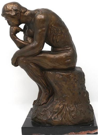
Slika 3. The Thinker

Osvrnimo se na istraživanje Pérez muzeja u Miamiu, smatrali su da bi korištenje tehnologije moglo izolirati ljude jer bi svatko bio fokusiran na ono što vidi na ekranu no dobili su baš suprotne rezultate u kojima su i potpuni stranci komunicirali međusobno i razmjenjivali dojmove o onome što vide. Također, smatrali su da će uvođenjem ove tehnologije izgubiti starije generacije posjetitelja koje bi se mogle osjećati izostavljenima no i ovdje se dogodilo suprotno, velik broj posjetitelja bio je stariji od 55 godina i svi su imali pozitivna iskustva (Vimeo). Ovo istraživanje nam može umanjiti strahove koji su ranije u radu spomenuti oko virtualne okoline u muzejima i daje nam sigurnost da korištenje nove tehnologije ne znači gubitak posjetitelja niti gubitak socijalnog iskustva u posjetu muzeju. Svi muzeji koji trenutno koriste proširenu stvarnost prenose ju putem mobilnih uređaja ili tableta, zasad nitko ne koristi naočale koje uvelike olakšavaju posjet, ovdje je važno razmisliti kako bi to utjecalo na socijaliziranje posjetitelja i kakav učinak muzej želi ostvariti, no ono što je sigurno je da bi korištenje naočala a ne uređaja koje držimo u rukama pojačalo dojam i iskustvo imerzivnosti u virtualnoj okolini.