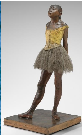
Slika 5. Little Dancer Aged Fourteen