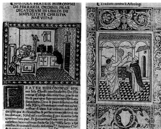
Slika 3. Naslovne stranice Savonarolinih izdanja u dubrovačkoj knjižnici (Jurić, Š., Šanjek, F. (1985.), Katalozi inkunabula crkvenih ustanova u Hrvatskoj, Croatica Christiana periodica , 9, br. 15, 174.)

Splitska dominikanska knjižnica je utemeljena u 13. stoljeća. Za njezin početak se veže 1272. godina, kada su se Trogirani Jakov i Luka Matejev obvezali prepisati jedan misal za splitsku zajednicu. 74 U dominikanskoj knjižnici u Splitu se mogu pronaći četiri raduala i tri antifonara, koje su sa sobom u grad donijeli dominikanci iz Drača. Velika vrijednost je sedamnaest inkunabula, od kojih se izdvajaju i neki iz privatne zbirke Marka Marulića. Samostan, a time i knjižnica su dvaput srušeni za vrijeme turskih ratova. Ova knjižnica nije sređena, ali posjeduje više od deset tisuća svezaka, tematike pretežno teološke i općeg kulturnog usmjerenja. 75