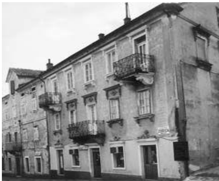
Slika 1. Kuća obitelji Jurić u Sinju