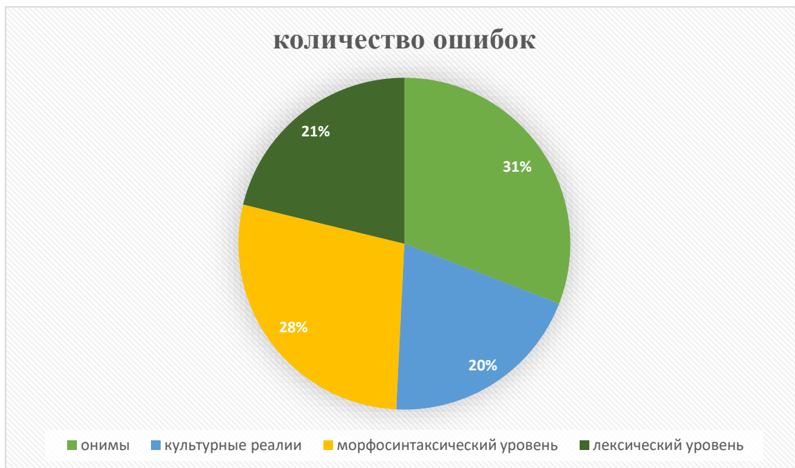
Диаграмма 2 – доля ошибок/непоследовательностей во всех текстах

Ошибки, повторяющиеся несколько раз, мы считаем одной ошибкой. Как можно увидеть, наибольшее количество ошибок связано с передачей онимов. Следовательно, опровергается гипотеза о том, что большинство ошибок при переводе туристических текстов проявляется на морфосинтаксическом уровне.