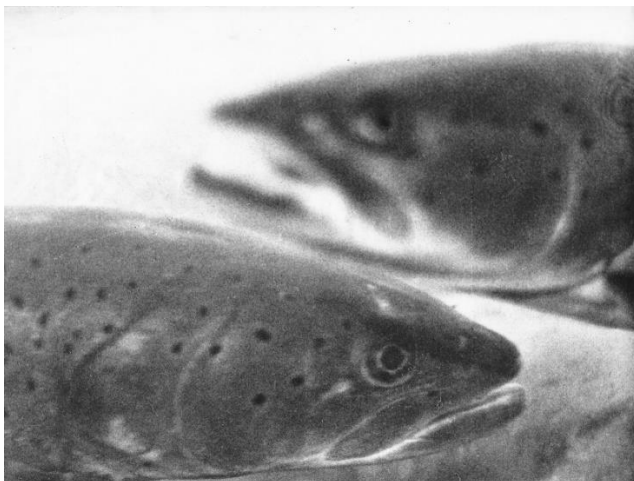
1. Priča o glavatici