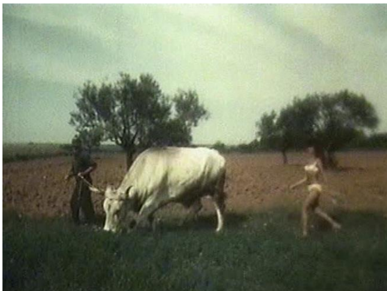
17. Sunčani Jadran

ponude odjednom se, bez naratorova komentara, pojavi prizor seljaka koji ore uz pomoć vola, a kraj njega pritom hoda turistkinja u bikiniju (fotografija 17). Nakon nekog vremena pojavi se i prizor turistkinje u bikiniju koja po pješčanoj plaži vodi jarca za uzicu. Ove bizarno smiješne antiteze pokazatelj su stilske slobode kozerijskog filma u kojem je ponekad sve dopušteno.