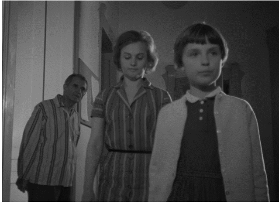
28. Moj stan