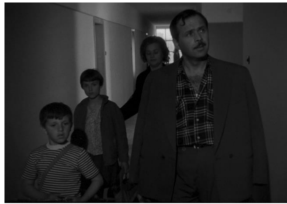
28. 1. Moj stan

Ironijski žalci Berkovićeva filma usmjereni su i prema ostalim manifestacijama socijalističkog društva. Tako se kroz naratoričine komentare ironijski razotkriva nemoć malog čovjeka pred sistemom („Moj tata je strašan kad lupi šakom o stol. Drug Holjevac bi se uplašio i odmah nam dao veći stan“) i korumpiranost sistema („Moja mama kaže da su samo budale poštene, ali ona to samo tako kaže“). Posebno je provokativno ironijsko sugeriranje izrazitih socijalnih razlika u jugoslavenskom društvu. Naime, djevojčica kroz naratorov govor kaže: „Ako netko nije sretan i zadovoljan, dovoljno je da pogleda kroz prozor i odmah mu postane lijepo u njegovom stanu...“ Nakon toga u prizoru vidimo bijedne siromaške kuće, odmah pokraj zgrade u kojoj živi djevojčica. Moj stan izrazito je duhovit i veseo kozerijski film, što mu je zasigurno pomoglo da, poput ostalih društveno kritičnih kozerijskih filmova (s iznimkom Cherchez la femme ), izbjegne cenzuru, bunkeriranje ili prigovore političkih struktura.