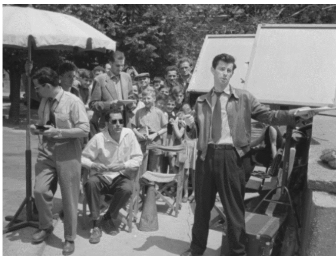
11. Viđeno na Griču