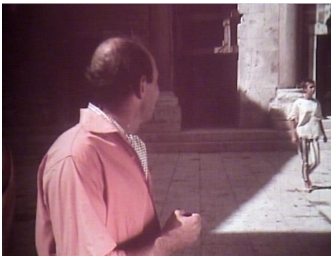
15. Turistički skerco