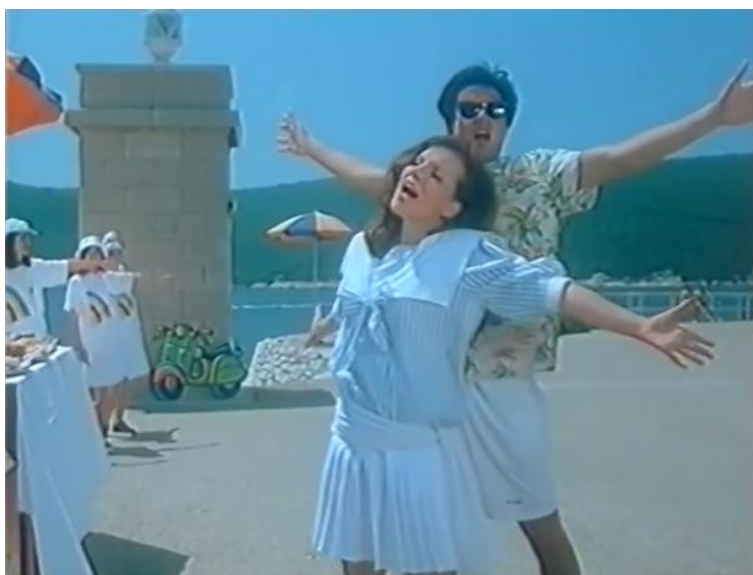
30. Ovdje nema nesretnih turista

HRV), a u filmu s izrazitijim utjecajem konstruiranog Odmor u Hrvatskoj (Zvonimir Berković, 1981, HRV) prisutan je, za kozerijske filmove netipičan, trud da se što uvjerljivije sakrije konstruiranost te održi dojam dokumentarističnosti snimaka i stvarnosne autentičnosti govora dječaka naratora. Svi ovi filmovi u službenim filmografijama kategorizirani su kao dokumentarni filmovi (Obradović, 1988: 6, 80, 118; Ješić, 1990: 15). Jedini pronađeni kozerijski film s izrazitom prisutnošću fikcije, koji je i kategoriziran kao igrani (Ješić, 1994: 15), jest namjenski turistički film Ovdje nema nesretnih turista (Goran Gajić, 1990, SRB), kronološki zadnji pronađeni kozerijski film u hrvatskoj i jugoslavenskoj kinematografiji. Kao što smo uočili, fikcionalnost se održala jedino u namjenskom filmu. Ovaj film reklamira hotelsku ponudu Rapca uz pomoć duhovite rudimentarne priče o ljubavi mlade turistkinje i turista koji borave u rabačkim hotelima, ispričane uz pomoć glazbenih brojeva u stilu mjuzikla, a glavnu ulogu glumi Nebojša Bakočević, tadašnja mlada glumačka zvijezda (fotografija 30). 126