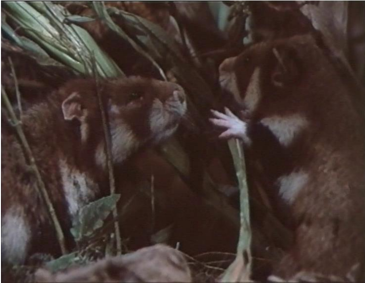
18. Mala čuda velike prirode br. 3 (Svadljivi hrčak)

Ma koliko noć bila mirna i blaga, ništa ne može razblažiti ovu prgavu narav. Hrčak je simbol dobra domaćina, ali i samoživa sebičnjaka. Misli samo na svoj drob i svoj hambar. Sve što nije on, nervira ga. Svaki šum koji nije sam proizveo, nervira ga. Čangrizljiv, razdražljiv, ljut, sav je živac. Ne trpi ni svoj rod, a kamoli stranca.