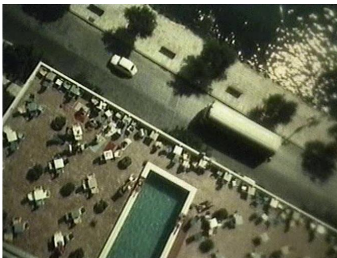
22. Sunčani Jadran

Ponekad se humor ostvaruje u iznimno kreativnoj međuigri između slike i govora. Niz takvih primjera uočili smo opisujući naratorovu upotrebu stilskih figura, a spomenimo još neke. U autoreferencijalnom primjeru u filmu Mala čuda velike prirode 1 , da bi duhovito opisao brzinu i neuhvatljivost ptice vodenkos, narator je nekoliko puta počne opisivati riječima „Ta ptica...“, ali svaki put zastane, jer vodenkos šmugne iz kadra. Duhoviti metafilmski primjer međuigre slike i govora jest naratorovo referiranje na povijest filma u kozerijskom filmu Sunčani Jadran . Naime, opisujući jadranske hotele, narator uz slikovni prikaz jednog hotela klasičnog arhitektonskog izgleda kaže: „Ovako se sviđalo Habsburgovcima“, da bi nakon toga napravio izrazitu digresiju, tipičnu za stilsku slobodu kozerijskih filmova, i uz kadar snimljen iz oštre ptičje perspektive s vrha visokog hotela Marjan u Splitu izrekao: „A ovo bi se sviđjelo Hitchcocku“, referirajući se time na poznate kadrove iz oštre ptičje perspektive u Hitchcockovim filmovima Sjever-sjeverozapad ( North by Northwest , 1959, SAD) i Vrtoglavica ( Vertigo , 1958, SAD) (fotografija 22).