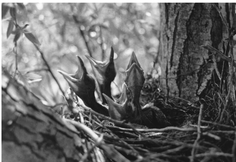
23. Briga za potomstvo

animatora u tramvaju, 99 a truba zvukovno imitira padanje zgužvanih crteža nezadovoljna animatora u koš za smeće te animirano hodanje i zijevanje lika kojeg je animator nacrtao. Imitatorski efekt ostvaruje se i upotrebom prirodnog zvuka, kada se zvukom udaranja pisaćeg stroja imitira lupkanje animatora prstima po glavi, čime se metaforično ukazuje na činjenicu da animator u glavi stvara ideju o svom crtiću. U filmu Baltazar putuje činele bubnja imitiraju Baltazarovo rušenje ljudi i stvari, a kada Baltazar odgurne cijeli red ljudi, čuje se zavijajući zvuk trube. U filmu o prirodi Briga za potomstvo (Branko Marjanović, 1959, HRV), pak, žustri zvuci puhaćeg instrumenta imitiraju energično otvaranje usta gladnih ptića (fotografija 23), klavirski akcent imitira batrganje leptira u paukovoju mreži, zviždukanje flaute imitira glasanje kolibrića, a puhaći instrument imitira ptice koje se podrugljivo smiju orlu koji ih nije uspio uhvatiti, kako nam sugerira narator.