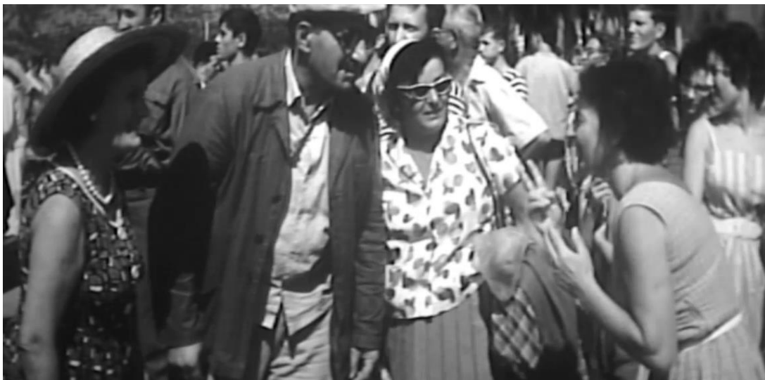
5. Pod ljetnim suncem