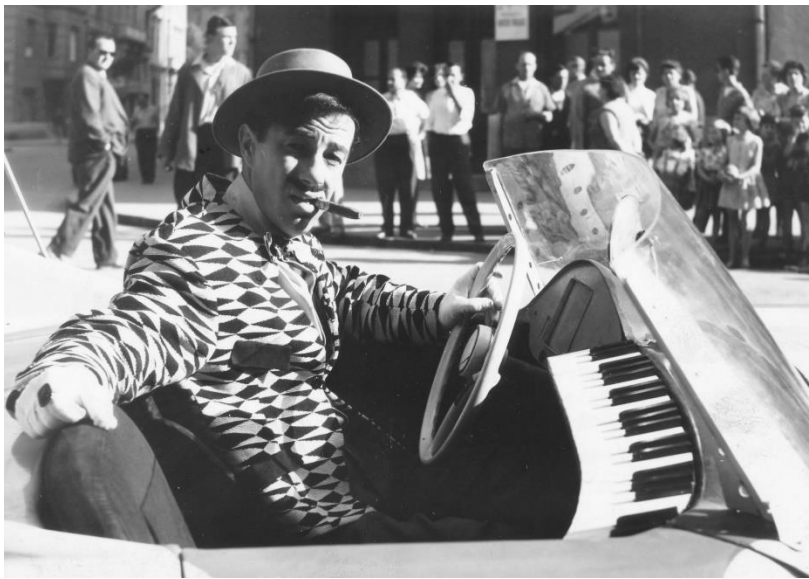
14. Dolje pješaci

maštovit i blag način ismijava se mana ljudske taštine. Dok glavni lik, što je posljedica njegove taštine, leži teško ozlijeđen pod prevrnutim autom, čak i tada izgleda komično. Na kraju filma ozlijeđena ga voze u njegovu novom prijevoznom sredstvu – tačkama, simbolu krajnje degradacije njegove tašte želje. Humor u filmu je veseo, ali nije samo „hedonistički užitek u čistoj zabavi“ jer nas uz njegovu pomoć autori upozoravaju što se može dogoditi vozačima koji se prepuste težnjama svoje taštine. Veselo komično u filmu izgledaju i stilizirani prizori gomile policajaca koji zvižde jurećem automobilu i hrpe prometnih znakova koji se sklanjaju pred automobilom, ali njihova pedagoška funkcija je jasna.