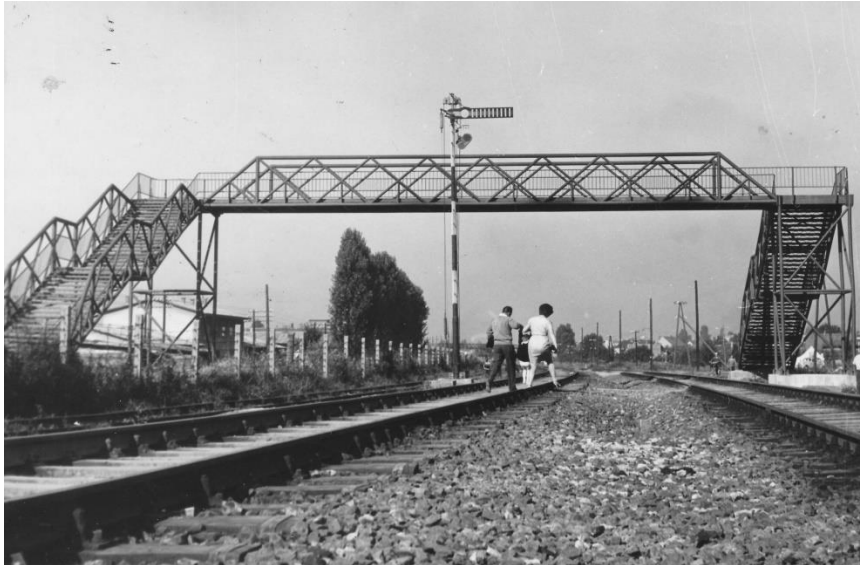
26. Most

trudnice, časne sestre, starci i ljudi s malom djecom), komično ukazuju na to da je Čepo zapravo jedini građanin koji traži izgradnju mosta (fotografija 26). Na kraju Čepo u zadnjem pismu novinama kaže: „Najprije da vam kažem da sam nedavno odustao da služim kao primjer. Sišao sam među prijatelje i sad i ja, kao i oni, idem starim i kraćim putem.“ Ovaj komentar prati jedini slikovni prizor u filmu koji je očito fikcijski, a to je prizor lika Marka Čepe koji s mosta gleda na ljude kako prolaze po pruzi, odustane od prolaska preko mosta i side među njih.