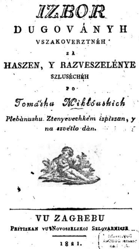
Slika 2. Naslovna stranica Izbora

„Ne znam, kak vre od nature Preljubljená Domovina Vsem vu Serdcu slast zrokuje, I na ljubav vse nagiba.“