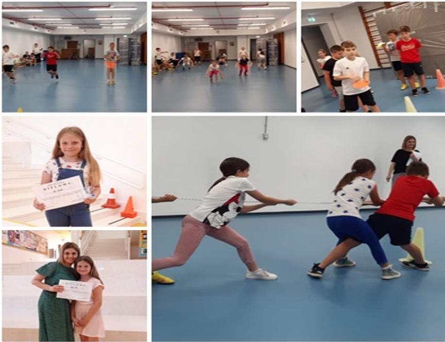
Slika 11. Aktivnosti u OŠ Pujanki tijekom sudjelovanja u projektu Čitanje ne poznaje granice / Branje ne pozna meja 61