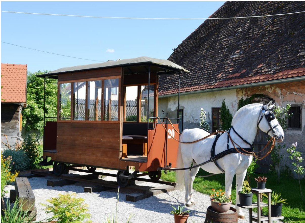
Slika 5. Rekonstrukcija kojnače u Novom Čiču