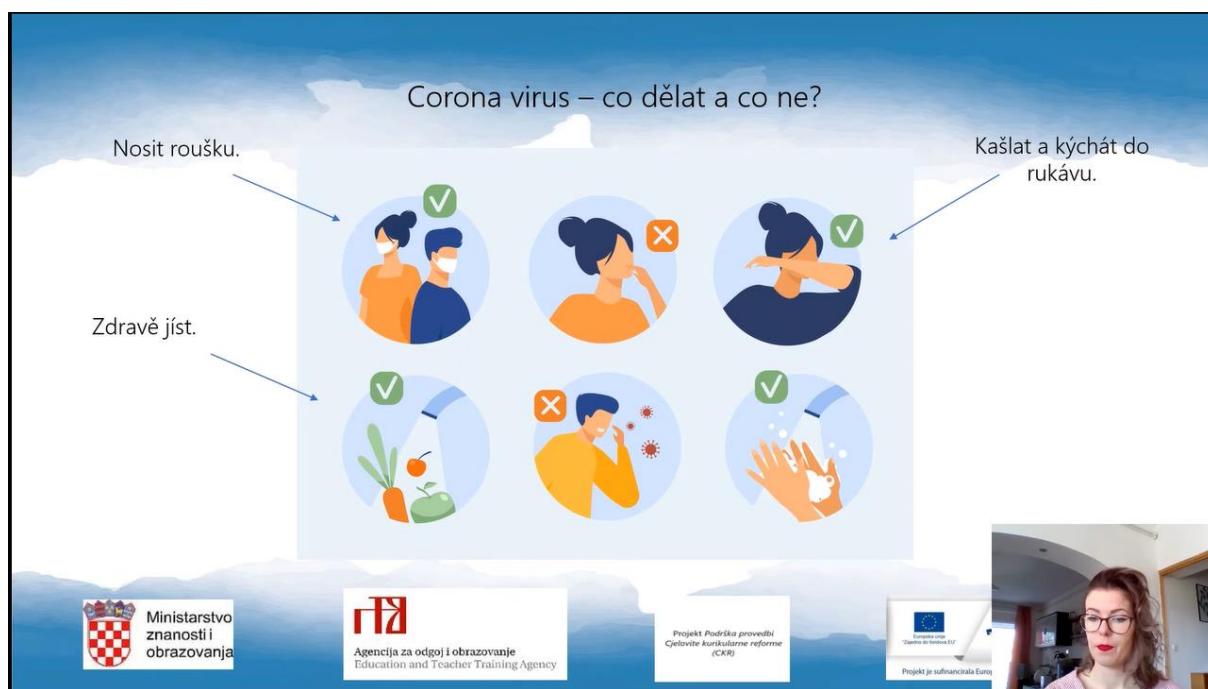
Slika 7. Videolekcija Češki jezik i kultura, 6. r. OŠ - Co potřebuješ, když jsi nemocný a když máš zranění

U 10. minuti videolekcije Co potřebuješ, když jsi nemocný a když máš zranění nastavnica na slajdu predaje o koronavirusu 38 , što prije nije predviđeno kao gradivo 6. razreda osnovne škole, ali zbog okolnosti i zdravstvene situacije u Republici Hrvatskoj, ipak je uvršteno u videolekciju.