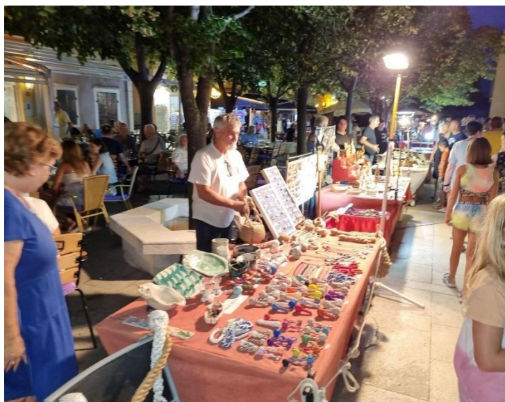
Slika 27. Sajam na Trgu Vinodolskog zakona tijekom manifestacije. Objavljeno: 20.8.2022.

Nadalje, postoji nekoliko primjera obrta predstavljenih na “sajmu” koji su vezani uz srednjovjekovno razdoblje odnosno baziraju se na povijesnom nasljeđu koje aludira na razdoblje frankopanske vladavine ovim prostorima. Na štandovima se nude proizvodi, točnije suveniri koji su tematski oblikovani prema starohrvatskom pismu glagoljici, značajnom kulturno-povijesnom elementu Vinodola. Osim glagoljice, povratak u srednjovjekovno razdoblje Frankopana predstavljaju obrtnici kovači koji u tematski kostimiranoj odjeći nude proizvode načinjene od željeza.