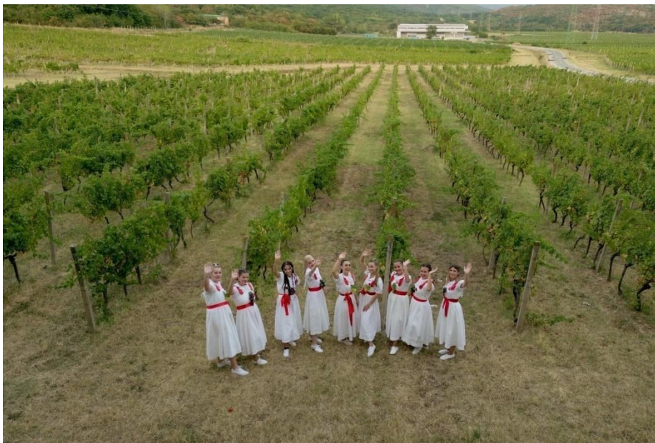
Slika 8. Djevojke “Ružice Vinodola” u vinogradima u Pavlomiru. Objavljeno: 21.8.2022.