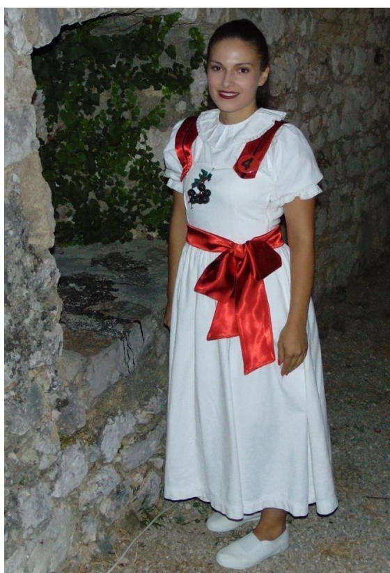
Slika 32. Natjecateljica “Ružice Vinodola” u radnoj nošnji. Objavljeno: 11.8.2018.