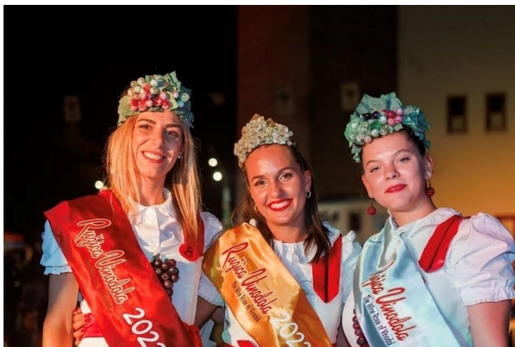
Slika 28. Pobjednica Ružica Vinodola i njene dvije pratilje sa stiliziranim krunama. Objavljeno: 21.8.2022.

Između 23h i ponoći, na trg Precrikva dolazi povorka u pratnji sopilaša i KUD-a “Ilija Dorčić” koja “preuzima” djevojke i vodi ih prema glavnoj pozornici između Frankopanskog trga i Trga Vinodolskog zakona, odnosno pokraj frankopanskog kaštela i kule Kvadrac. Uz zabavno-glazbeni program, dočekuju se natjecateljice, te proglašuje prva tri mjesta. Pobjednica sa najviše postignutim bodovima proglašava se Ružicom Vinodola kojoj prethodna tj. prošlogodišnja Ružica predaje zlatnu krunu. Kruna odnosno tijara oblikovana je simbolično zlatnim listovima vinove loze i grozdovima. Uz krunu pobjednica dobiva buket cvijeća i lentu sa natpisom manifestacije i osvojene titule, godinom izvođenja, logom “Ružice Vinodola”.