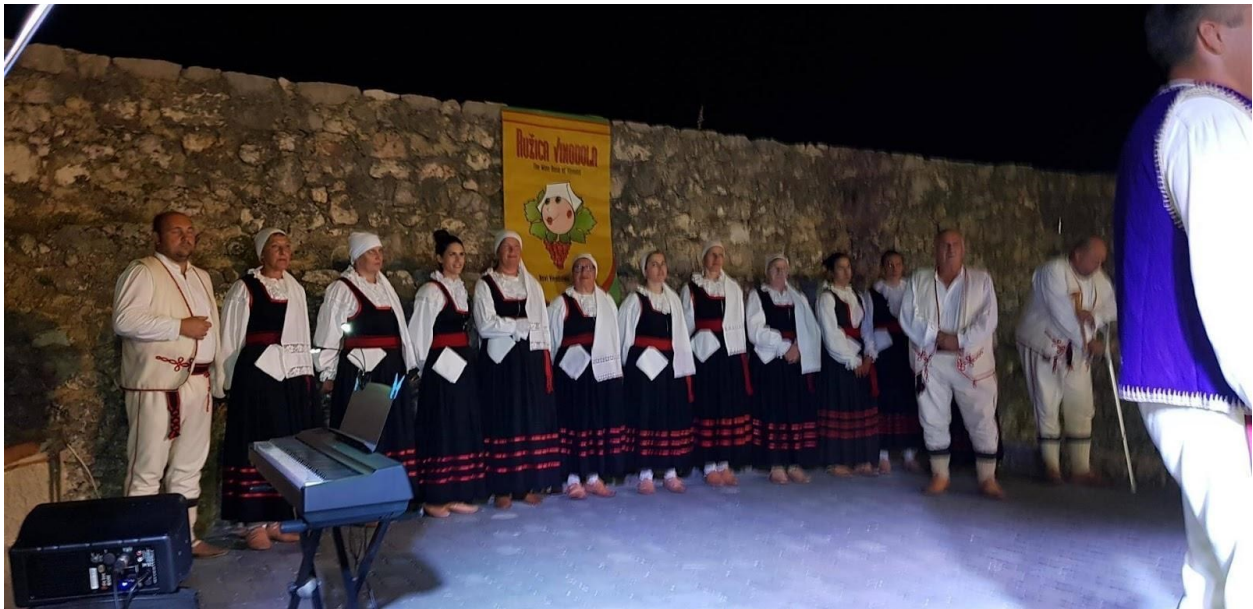
Slika 29. KUD „Bribir“ na ceremoniji predstavljanja natjecateljica ispred bribirske gradine. Objavljeno: 11.8.2018.