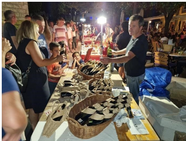
Slika 26. Sajam na Trgu Vinodolskog zakona tijekom manifestacije. Objavljeno: 20.8.2022.