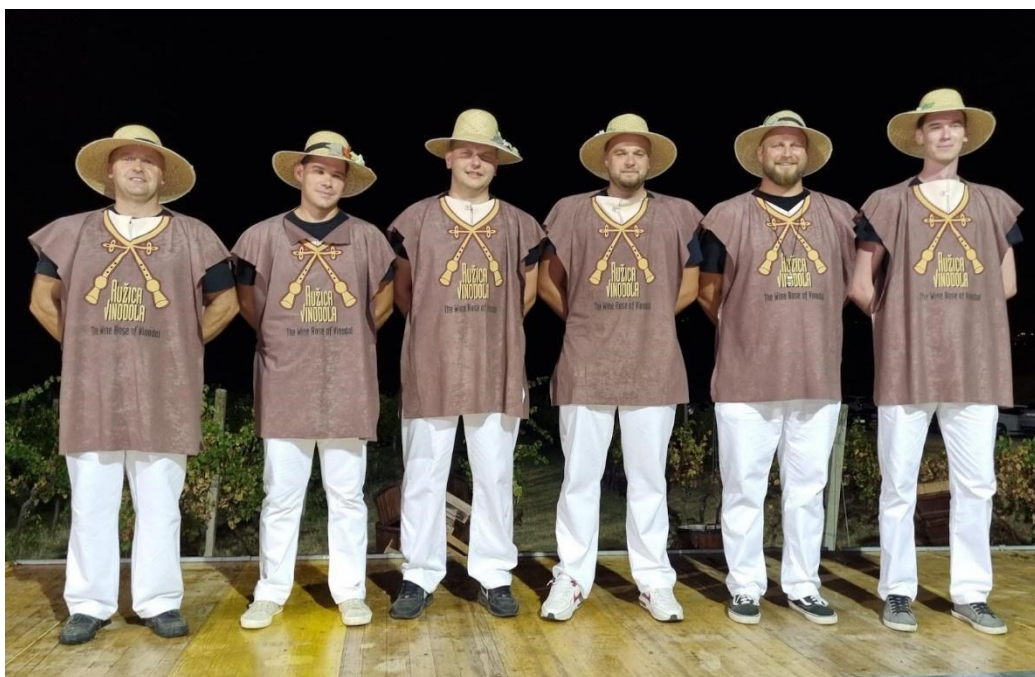
Slika 33. Suci manifestacije “Ružice Vinodola“. Objavljeno: 19.8.2022.

Wine Rose of Vinodol ”). Iznad natpisa prikazana su dva ukrštena instrumenta, sopila. Pratitelji djevojaka također nose tunike, ali sa drugačijim simbolima. Tunike su crne boje sa tamno crvenim i zlatnim obrubom. Na prednjem dijelu nalazi se imitacija kragne bijele košulje ispod čega se nalazi simbol “skočca” odnosno grožđa i listova vinove loze, te natpis manifestacije jednak onome na tunici sudaca.