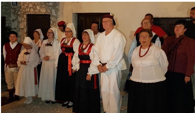
Slika 30. Članovi KUD-a “Ilija Dorčić” na trgu Precikva. Objavljeno: 19.8.2018.