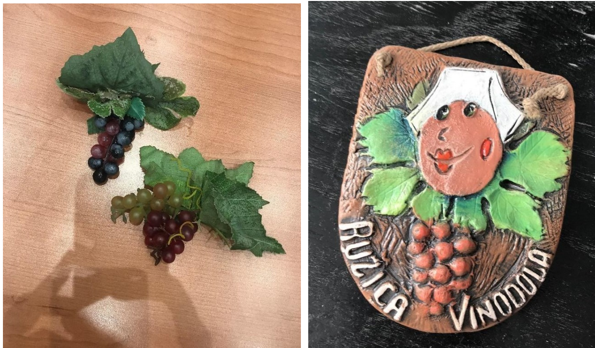
Slika 6. Primjer “skočca” odnosno komada grozda sa listovima vinove loze.