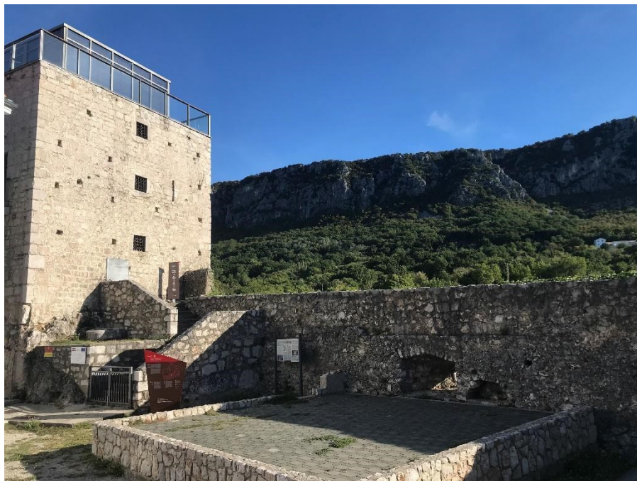
Slika 11. Pogled na bibrirsku kulu Turan i ostatke gradine, te pozornicu na kojoj se predstavljaju Ružice