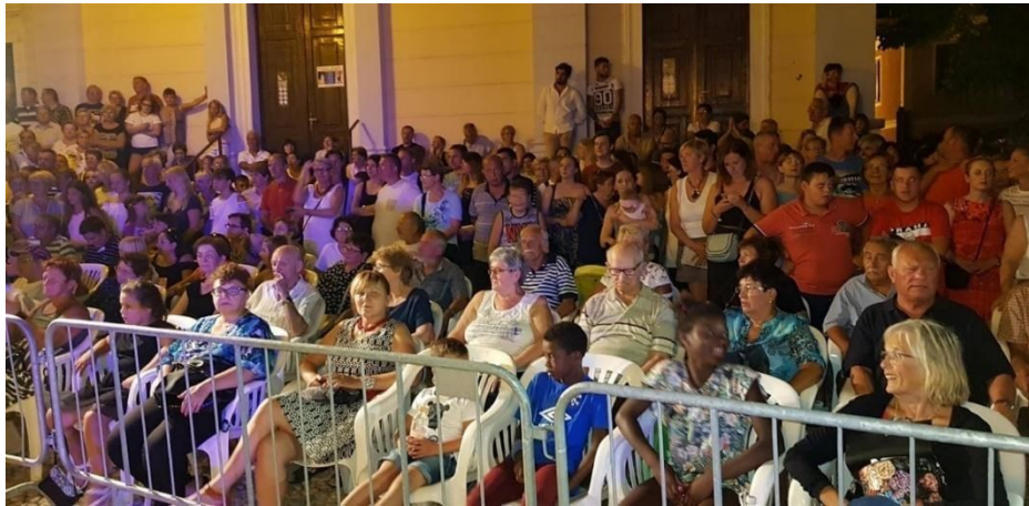
Slika 18. Pogled na posjetioce sa pozornice na trgu Precrikva. Iza njih nalazi se župna crkva sv. Filipa i sv. Jakova. Objavljeno: 19.8.2018.

Jadransku magistralu. Prostor odiše posebnim ambijentom koji se kao povijesna cjelina kulturne baštine grada savršeno uklapa sa konceptom i ciljem manifestacije, a to je da posjetitelji uz zabavni program pobliže upoznaju dio vinodolske kulture. Unatoč ograničenom prostoru izvođenja, taj maleni i skromni trg svake godine u potpunosti se ispunjava znatiželjnim promatračima, posjetiteljima i lokalnim stanovništvom.