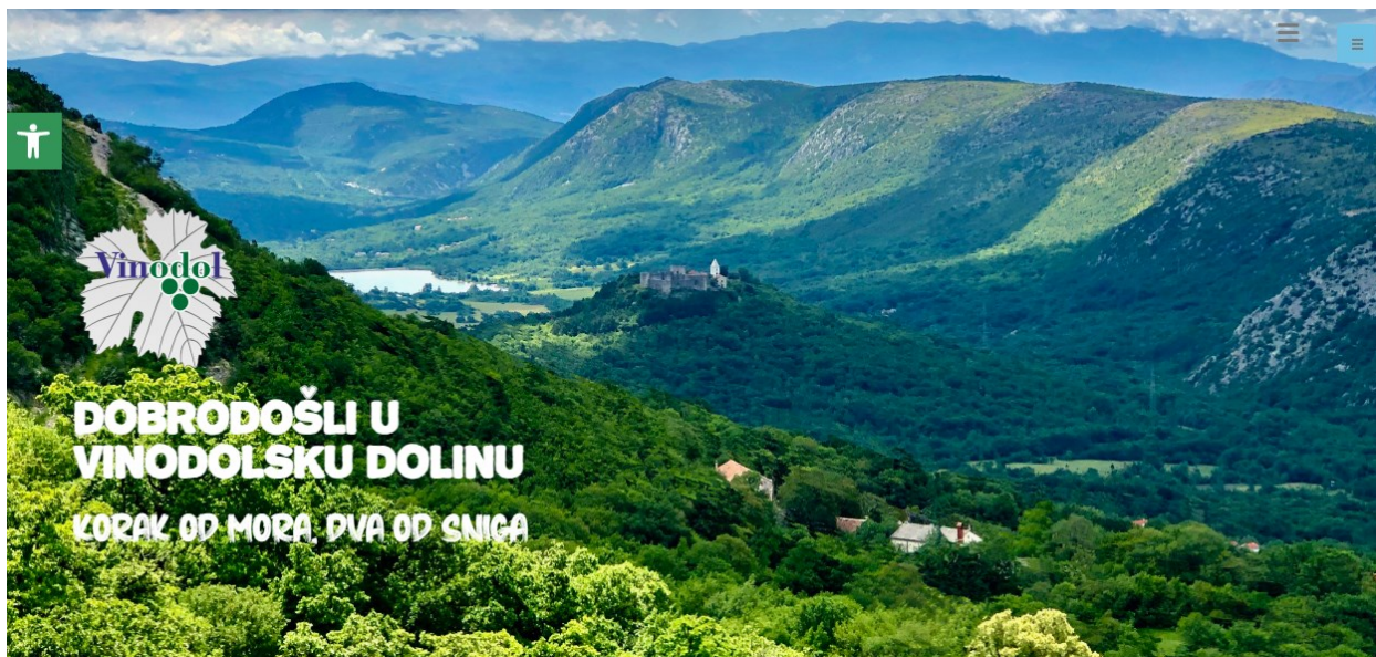
Slika 2.: Prikaz naslovne strane internetske stranice Turističke zajednice Vinodolske općine.

Tek u nekoliko natuknica HTZ predstavlja kulturno nasljeđe Vinodola spominjući glavne ljetne manifestacije Vinodolske ljetne večeri i Ružica Vinodola te zimski Mesopust, zatim muzejsku zbirku važne povijesne umjetničke ličnosti Jurja Julija Klovića i graditeljsku baštinu starih Vinodolaca - vrela i perila. Jednako tako, kulturno nasljeđe je predstavljeno i za grad Novi Vinodolski, naglašavajući najvažniji narodni običaj Novljanski mesopust i kolo kao stoljetnu tradiciju koja se mora doživjeti te posjet Starom gradu, župnoj crkvi, Kaštelu i kuli Kvadrac kao svjedokom frankopanskog razdoblja. Također su navedene i najistaknutije ljetne manifestacije vezane uz povijesno nasljeđe grada i/ili gastronomsku ponudu: Ljetni karneval, Okolotorno, Fešta od kilometra, Ružica Vinodola te Novljanski gušti.