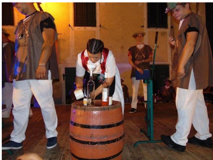
Slika 24. Igra pretakanja vina u lončice. Objavljeno: 19.8.2017.