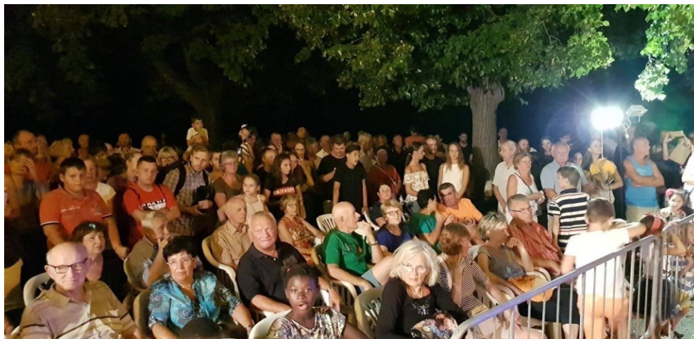
Slika 19. Posjetioci na trgu Precrikva, ispred pozornice. Objavljeno: 19.8.2018.

Drugi dan manifestacije započinje povorkom u središtu grada Novog Vinodolskog, točnije na krajnjoj točki Korza hrvatskih branitelja. Simboličnom povorkom kroz grad, članovi KUD-a "Ilija