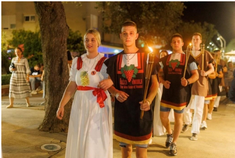
Slika 34. Povorka natjecateljica i svojih pratitelja u specifičnim crnim tunikama. Objavljeno: 21.8.2022.

što potvrđuje svijest lokalnog stanovništva o navedenim kulturnim elementima kao sastavnog dijela vlastitog identiteta.