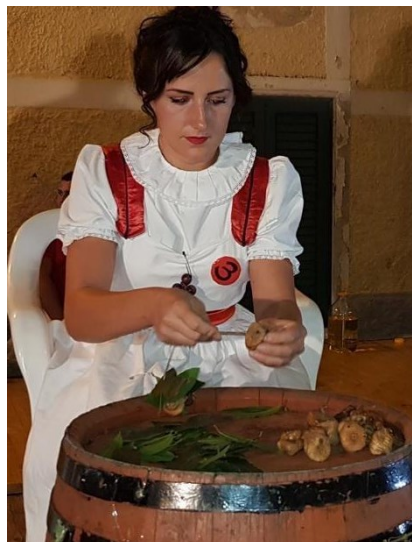
Slika 25. Igra pravljenja vjenčića od suhих smokava i lovorovog lista. Objavljeno: 17.8.2019.