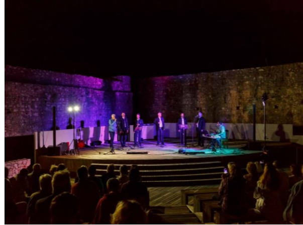
Slika 4.: Prikaz Vinodolskih ljetnih večeri u Bribiru ispred frankopanske kule i gradine.

Osim na nacionalnoj razini, Vinodol se predstavlja i u regionalnom kontekstu kroz turističke promotivne materijale. U promotivnoj brošuri “Kvarner - primorje, otoci i gorje” (2008.) uključena je turistička ponuda grada Novog Vinodolskog i Vinodolske općine koja se najviše očituje u kulturnoj baštini navodeći Frankopanske kaštele, lokalne sakralne objekte, starohrvatsko pismo glagoljicu kojom se krasi mnogi vinodolski spomenici te tradicionalni instrument sopile. Spominje se i gastronomska ponuda koja uključuje tradicionalne voćke poput smokava i trešanja, a od poljoprivrednih grana istaknuto je vinogradarstvo odnosno uzgoj vinodolske žlahtine. Drugi oblici narodnih običaja nisu predstavljeni. Uz kulturnu baštinu Vinodola, spominje se i drugi turistički motiv, već dobro poznati za ovo područje, a to su wellness , sportski turizam i aktivni odmor, navodeći Vinodol kao mjesto idealno za biciklizam, vodene aktivnosti poput sky-lifta i ronjenja te ribolov uz Tribaljsko jezero. Od manifestacija jedino spominju Dane sporta i Ljetni karneval u Novom Vinodolskom, Vinodolske ljetne večeri u Vinodolskoj općini te Ružicu Vinodola kao manifestaciju koja je uklopljena unutar oba vinodolska područja.