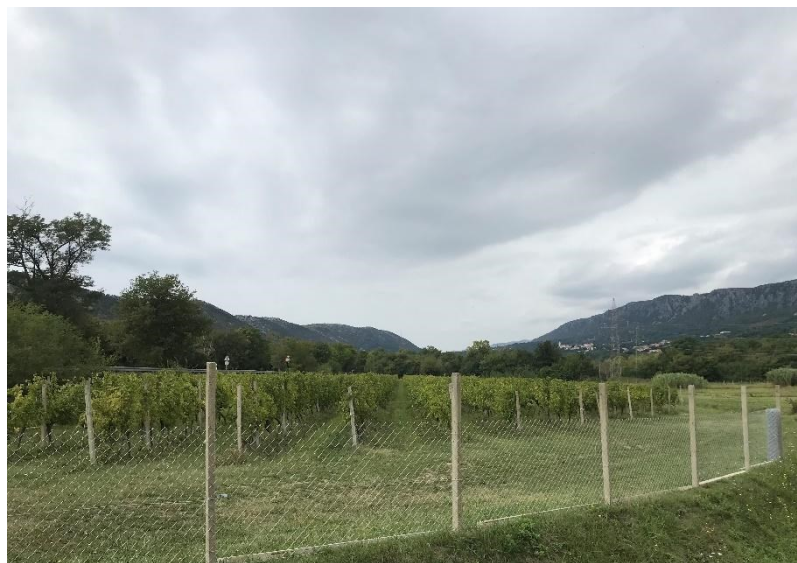
Slika 9. Pogled na vinograde u Pavlomiru, Novi Vinodolski