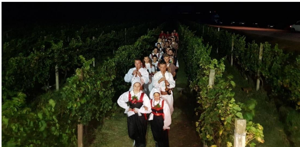
Slika 12. Povorka mladih članova KUD-a “Ilija Dorčić” kroz pavlomirski vinograd, u pratnji sopilaša, natjecateljica i njihovih pratitelja. Objavljeno: 17.8.2018.

Izvor: Facebook profil: Ružica Vinodola (Pristup: 20.7.2023.)