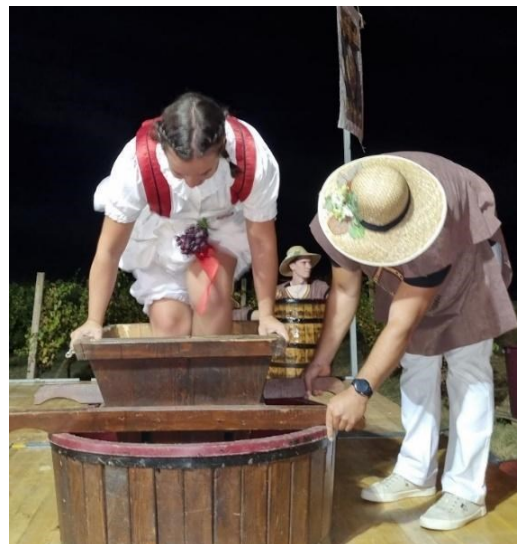
Slika 16. Druga igra: Ručno mašćenje grožđa uz provjeru sudaca. Objavljeno: 19.8.2022.