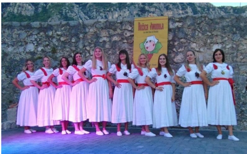
Slika 10. Predstavljanje Ružica na pozornici pred bribirskim Kaštelom. Objavljeno: 10. 8. 2019.