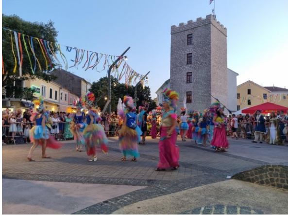
Slika 3.: Prikaz Ljetnog karnevala u Novom Vinodolskom. Objavljeno: 3.7.2022.