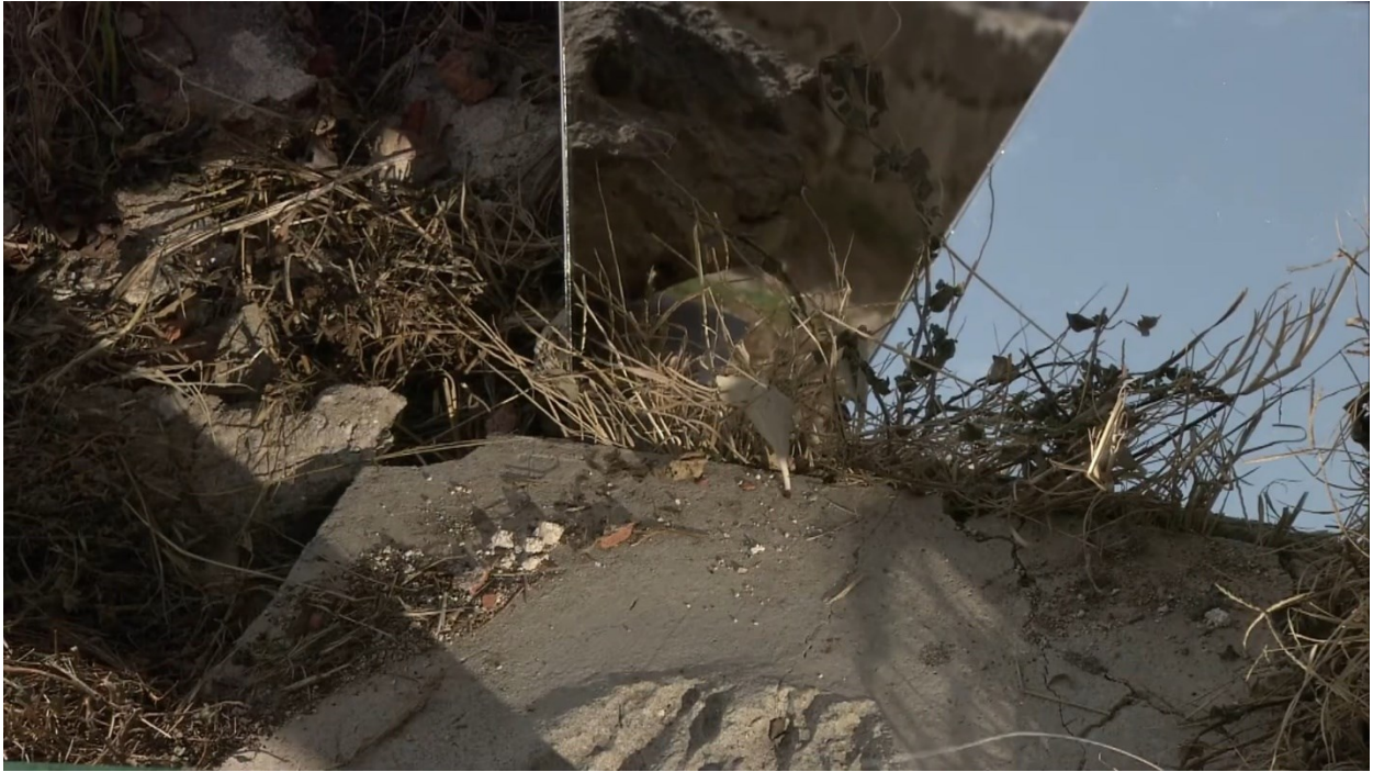
Sl. 1. Neli Ružić, Nigdina (2018.), kadar iz filma

su do njezina povratka u Hrvatsku bili odsutni. Umjetnica kroz jezične i vizualne referencije (sl.1.) na Roberta Smithsona progovara o vlastitoj umjetnosti.