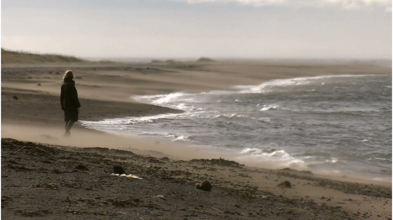
Sl. 12. Renata Poljak, Porvenir (2020.), kadar iz filma

Završetkom filma Renata Poljak se referira na obiteljsku povijest, kao i na prvi film iz triptiha – Partenza . Njezina je prabaka poput mnogih žena s Bola na Braču iščekivala svog supružnika, koji se iz daleke zemlje nije vratio. U tekstu odjavne špice filma Porvenir otkriva se kako je njezin pradjed preminuo od upale pluća, izazvane djelovanjem jakih vjetrova u Porveniru. Antropologinja Nadia Lovell smatra kako je krajolik u interakciji s ljudskim iskustvom te je stvoren i definiran kroz njega, te uvelike ovisi o sjećanju kako bi se perpetuiralo njegovo postojanje. 180 Prema njoj, „upisivanje prirode na tijela, i tijela unutar prirode, transformira odnos koji ljudi održavaju s prirodom u dijalektički proces ugrađen u memoriju.“ 181 Umjetnica nije uspjela saznati informacije o djedovu boravku u Porveniru, no pred kamerom je prikazala vlastito otjelovljeno iskustvo grada u koji je on migrirao te u njemu živio stotinu godina ranije. Umjetnica u ovom filmu, kao i u nizu drugih radova, isprepliće osobno i društveno kako bi osobnim primjerom progovorila o širem društvenom kontekstu. 182