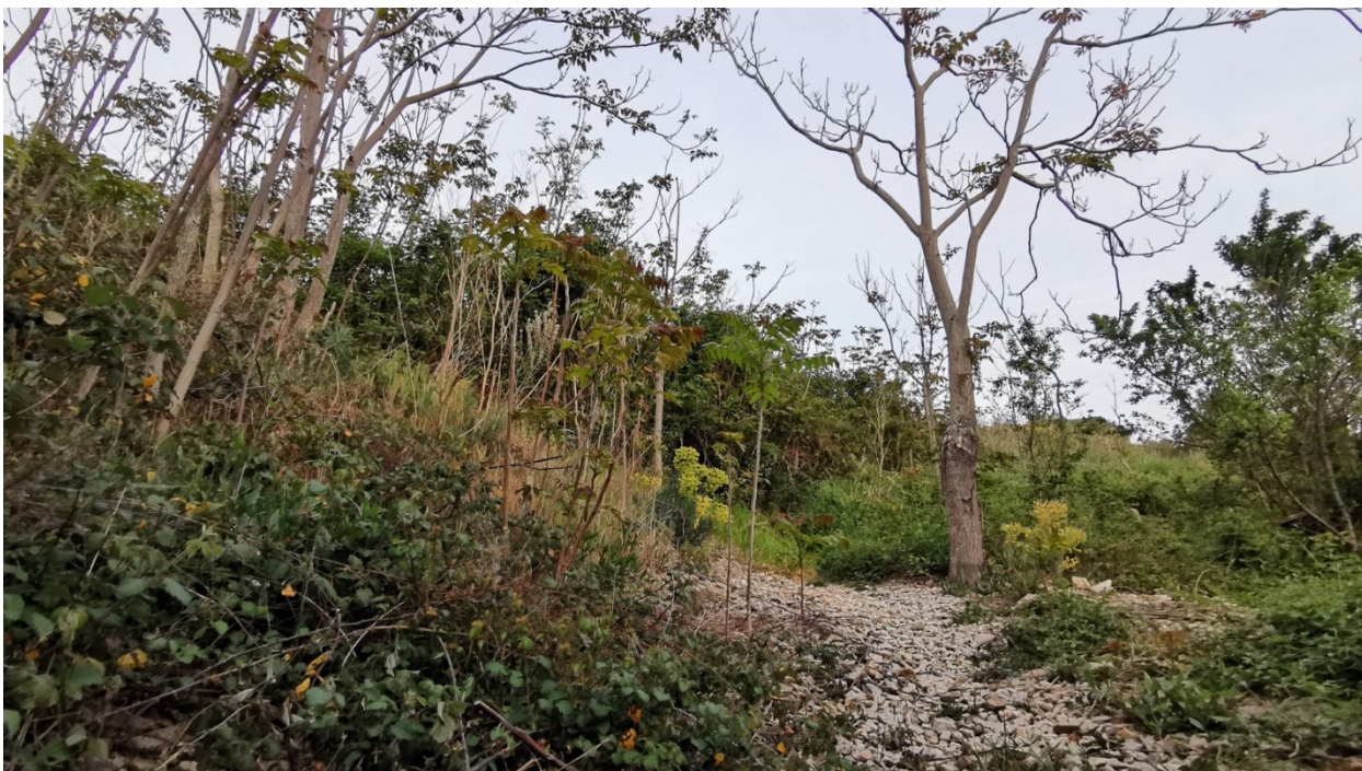
Sl. 5. Sabina Mikelić, Tražeci nju (2021.), kadar iz video rada