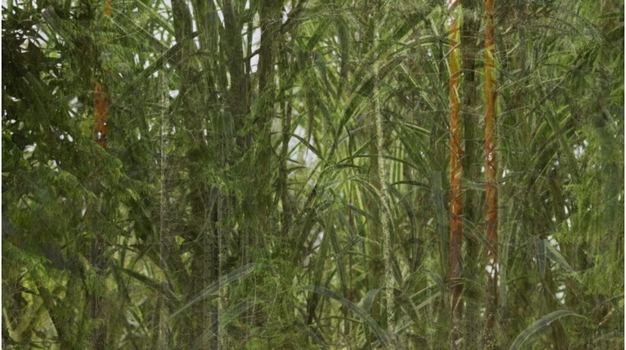
Sl. 4. Nina Kurtela, Dragi Aki (2021.), kadar iz filma

Sabina Mikelić je svoj višekanalni video režirala i snimila. Dokumentirala je sedam ispovijesti žena različitog porijekla koje su imigrirale u nizozemski grad Nijmegen, uključujući vlastitu. Kroz njezin se rad provlači tema pripadanja – pripadanja mjestima koje su napustile (sl. 5.) te onim novima s kojima su se (više ili manje uspješno) povezale. Ona najneposrednije izlaže vlastitu poziciju i njezin je sedmokanalni video najizravnija studija iskustva migracije. U prezentaciji je od svih autorica najbliža dokumentarnom filmu. Kada se sagleda u cjelini, projekt Tražeći nju blizak je autoetnografskom istraživanju.