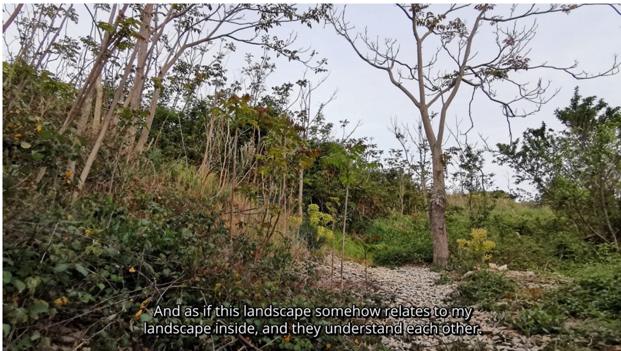
Sl. 19. Sabina Mikelić, Tražeci nju (2021.), kadar iz video rada

Sabina, umjetnica u svojstvu kazivačice otkriva svoje mjesto pripadanja – Der ili Derinu na otoku Rabu. Na fotografiji je snimljena obrasla zaravan, predio u blizini kuće njezinih bake i djeda. Pripovijeda kako se na tome mjestu igrala kada je bila mala i tamo je imala cijeli svoj svemir. Imala je posebna mjesta koja su određivale biljke koje su ondje rasle i koje su bile njezini tajni prijatelji. Navodi markere u krajoliku – veliki kamen, mjesto gdje su rasle papučice , perunike i mličac , poljski makovi i kupine. No tvrdi da toga mjesta više nema i kako se čitav Rab promijenio. Nema više tog cvijeća, ni divljine – iznosi kako je sve više kuća i apartmana, tamo gdje su prije bili njive i putovi. Pri svakom posjetu tom mjestu osjeća kako je nešto iz tog mjesta „hrani, napaja i smiruje“. Opisuje to iskustvo detaljnije, ovdje preneseno na rapskom dijalektu: „K'o da nevidljivi koreni iz zemlje gredu kroz moje noge va mene i k'o da smo spojeni Der i ja, Rab i ja. I k'o da taj vanjski krajolik nekako odgovara temu krajoliku unutra. I k'o da se razumu.“ Prethodno navedene rečenice (sl. 19.) Sabine Mikelić ključne su za razumijevanje njezinog projekta Tražeci nju . Njezine usporedbe impliciraju ono o čemu piše Ingold, na razumijevanje pojedinca kao organizma-osobe u uzajamnom odnosu oblikovanja s krajolikom kojemu pripada. 216