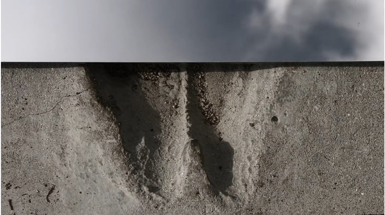
Sl. 9. Neli Ružić, Nigdina (2018.), kadar iz filma

Ukazujući na konstruiranje i razgradnju društvene memorije te nestalnost povijesti, Neli Ružić u filmu istražuje osobno sjećanje i vlastitu prošlost. Traga za komadićima vlastita identiteta razasutima nad oceanom. Prema Christopheru Tilleyju „kretanje u svijetu uvijek uključuje gubitak mjesta, kao i dobitak fragmenta vremena.“ 166 Neli Ružić kao da ima bezbrojne fragmente vremena koje ne može posložiti – na početku filma sjetno se osvrće na „regije praha vremena“.