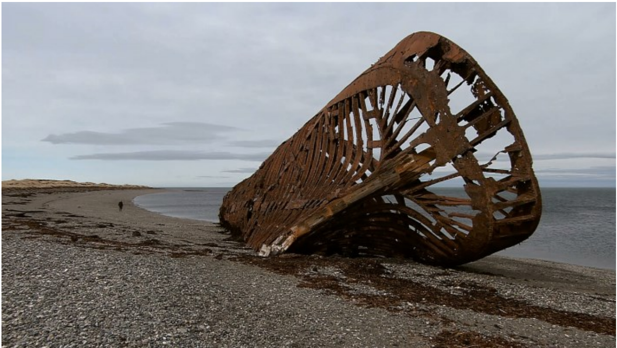
Sl. 11. Renata Poljak, Porvenir (2020.), kadar iz filma

Umjetnica šetajući dolazi do morske obale i nalazi ogromnu nasukanu olupinu prevrnutog broda (sl. 11.). Isprva ga promatra pa zastaje pred njegovom veličinom. Nižu se brojni kadrovi lijepog, ali napuštenog krajolika. Je li to mjesto prikladno za život? Ženska leđa, osvjetljena pred tamnom pozadinom, kao sugestija odgovora ostaju povijena. „Iskustveno, znajuće i smještajno tijelo“ 175 polazište je umjetničkog istraživanja, a njegovo prikazivanje performativna je strategija u filmu Porvenir .