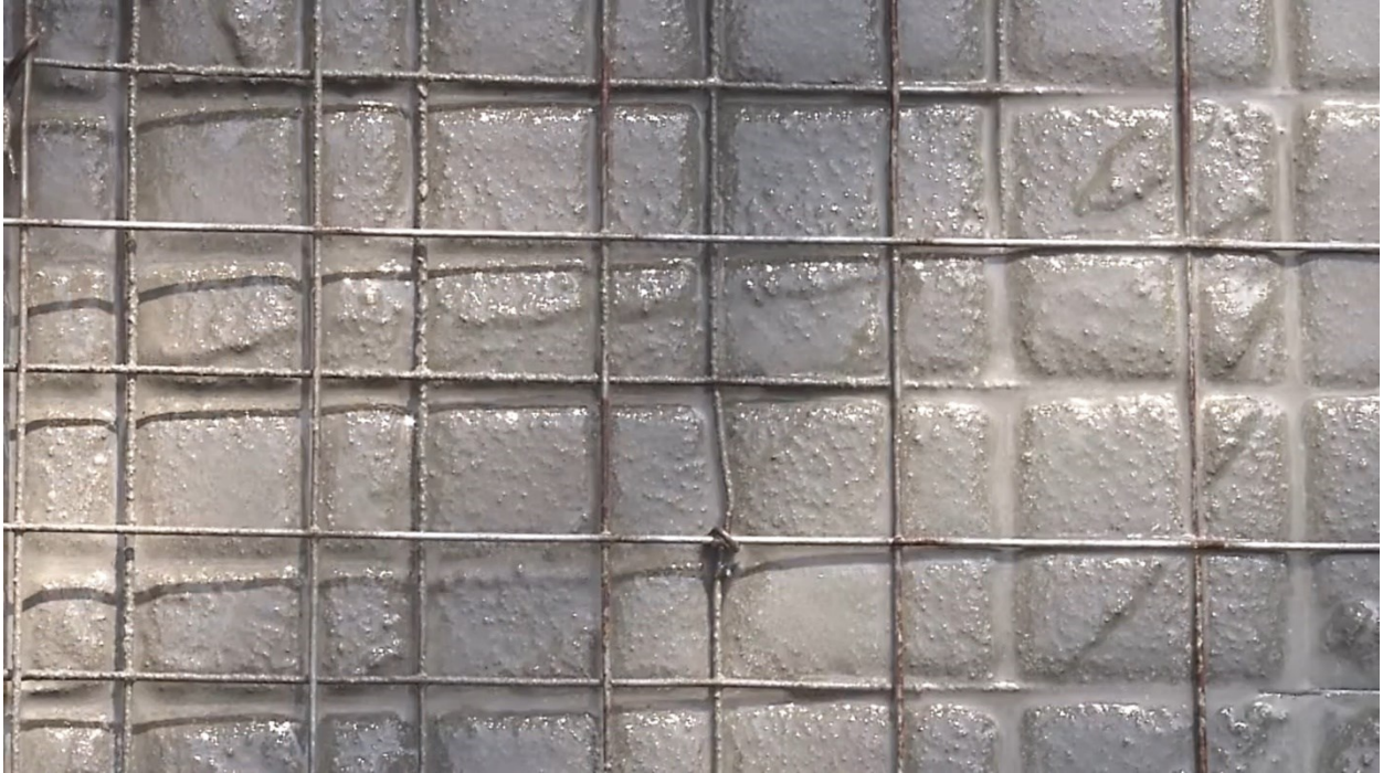
Sl. 7. Neli Ružić, Nigdina (2018.), kadar iz filma

Kliški krajolik prikazan je u crno-bijeloj slici te u time-lapse tehnici dok se doba dana izmjenjuju (sl. 8.). Rečenice fragmentarnog narativa, koje umjetnica izgovara, prate sugestivni kadrovi. Izjavu o tome kako je 1996. godine odlučeno da se Čuvar slobode ne uklapa u ambijent tvrđave, prati zamračeni kadar sniman iz donjeg rakursa, s gotovo crnom trobojnicom koja se vijori na oblačnom nebu. Atmosfera je komorna i zvučna kulisa postaje neugodna za slušanje. Umjetnica na taj način slikom i zvukom predočava vlastiti odnos i stav prema događajima iz prošlosti, čija se temporalnost proteže u sadašnjost. Devedesete su za nju „zagušljivo i nepomično vrijeme koje ne prolazi“ – navodi kako ga je Bogdanović nazvao vremenom „novokomponovanih sećanja“.