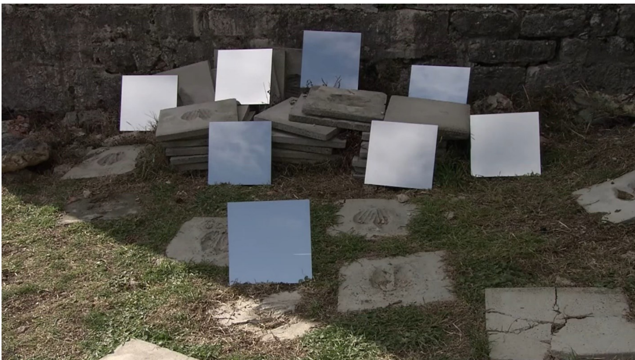
Sl. 6. Neli Ružić, Nigdina (2018.), kadar iz filma

Prema Timu Cresswellu, jedan od primarnih načina konstituiranja sjećanja jest kroz proizvodnju mjesta. Jedno od takvih mjesta je zasigurno Kliška utvrda, kao i postavljeno pa uklonjeno spomen-obilježje Čuvar slobode . Cresswell smatra kako sama materijalnost mjesta ukazuje na to da je sjećanje upisano u krajolik kao javna memorija. 155 Edward S. Casey piše o mjestima-sjećanja kao „sposobnosti mjesta da oživi prošlost u sadašnjosti i doprinese proizvodnji i reprodukciji društvenog sjećanja.“ 156 „Materijalnost, značenje i prakse zajedno sudjeluju u stvaranju mjesta sjećanja“ tvrdi Cresswell. 157 Tilley smatra kako su lokaliteti i krajolici ugrađeni u društvena sjećanja te njihove prošlosti i njihovi prostori konstituiraju njihove sadašnjosti. 158 Autor ističe kako su prostor i vrijeme povezani društvenim praksama. Ingold percipiranje krajolika povezuje s prisjećanjem, ali ne onim koje zahtijeva predodžbu mentalne slike pohranjene u umu, „već perceptivno se angažirajući s okolišem bremenitim prošlošću.“ 159