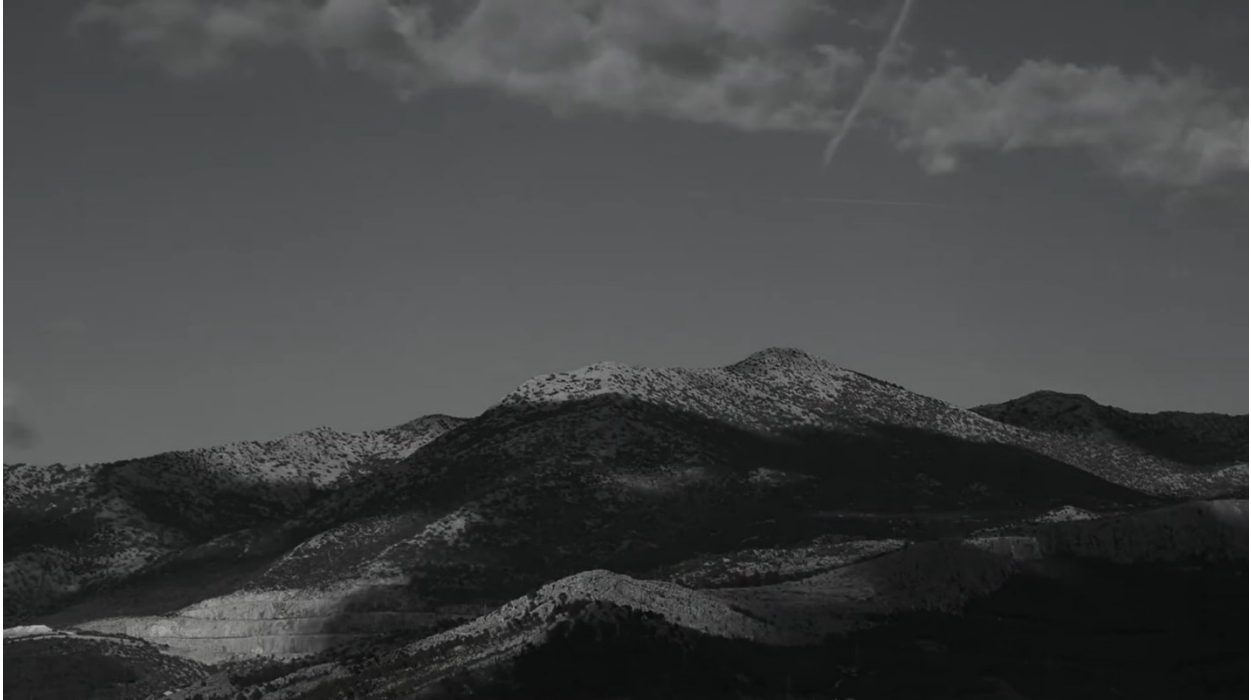
Sl. 8. Neli Ružić, Nigdina (2018.), kadar iz filma

U drugom dijelu filma prikazuju se kadrovi u kojima su prisutna kvadratna ogledala. Umjetnica ih je postavila na mjesto gdje je stajalo Bogdanovićevo spomen-obilježje. Ogledala su postavljena i između betonskih ploča njezina rada. Na betonsku ploču s udubljenim otiskom ljudskih ruku položila je ogledalo koje reflektira odbljesak sunca i putanju oblaka. Umjetnica jukstaponira materijalnost ploče u kojoj je zabilježen otisak ljudskih ruku te ogledalo koje pruža efemernu refleksiju okoliša i vremena (sl. 9.). Prema Michelu Foucaultu ogledalo objedinjuje zajedničko iskustvo utopije i heterotopije. 163 Utopijom ga čini spoznaja kako je ono „bezmjestno mjesto“ te se osoba u njemu vidi ondje gdje je odsutna, a heterotopijom to što osoba sebe percipira stvarnom kroz tu virtualnu točku. 164 Irena Bekić u umjetničkoj knjizi Nigdina / NOWhere ukazuje kako je sam naslov filma referencija na Smithsonovu praksu postavljanja ogledala kako bi se mapirao prostor. Navodi kako se tim konceptom nastoji obuhvatiti beskraj, a zrcalna fragmentarna slika održava mjesto iako to sama nije. 165