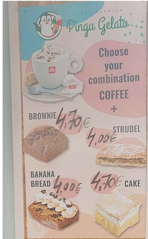
Slika 20. Primjer znaka