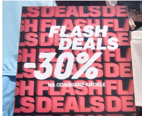
Slika 15. Primjer znaka