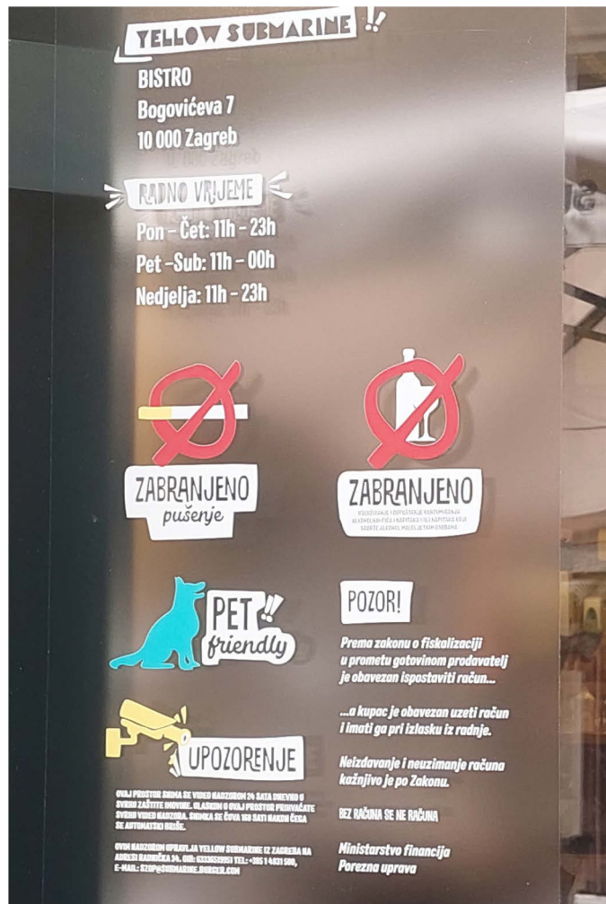
Slika 11. Primjer znaka