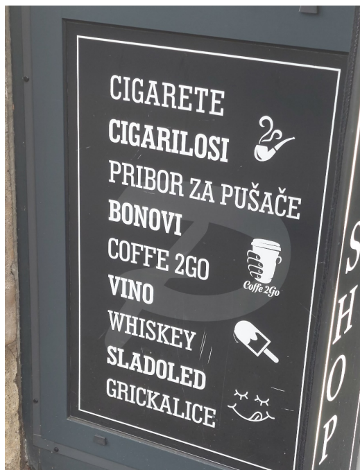
Slika 13. Primjer znaka