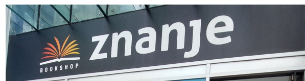
Slika 9. Primjer znaka