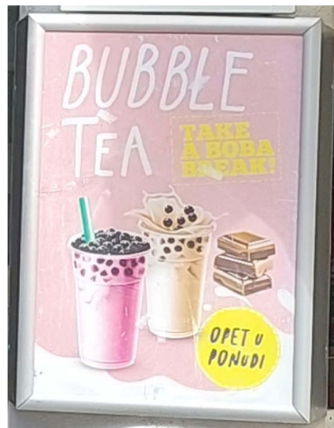
Slika 16. Primjer znaka

Kada sagledamo i komplementarne znakove koje smo izuzeli, a koji su komplementarni bez obzira na naziv, možemo primijetiti da se na dosta njih engleski rabi na sličan način. Primjerice, Slika 17. prikazuje jelovnik koji samo nazive jela ima na engleskom, ali su opisi i druge informacije na hrvatskom, a na Slici 18. prominentna je engleska fraza, no čitatelji tog časopisa hrvatski su govornici. Ovakvi primjeri komplementarnih znakova upućuju na orijentiranost prema lokalnoj publici. S druge strane, zabilježeno je nekoliko primjera koji su vjerojatno više namijenjeni turistima jer je engleski puno istaknutiji (Slika 19. i Slika 20.). Ovdje bi se čak moglo reći da se hrvatski upotrebljava radi udovoljavanja potrebe turista za autentičnošću. Sve u svemu, čini se da su komplementarni znakovi pretežno namijenjeni lokalnom stanovništvu, ali svakako ne isključivo njima.