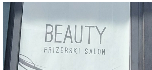
Slika 8. Primjer znaka

Naposljetku, kao što je već pokazano, komplementarnost je najzastupljeniji obrazac, no nakon što se izuzmu znakovi s nazivima, broj komplementarnih znakova naglo se smanjuje. Ovo izuzimanje nije savršeno rješenje jer se time gubi dio informacija. Naime, neki su znakovi komplementarni jer ih naziv čini takvima. Primjerice, znakovi koji sadrže naziv na jednom jeziku te neku dodatnu informaciju na drugom jeziku (Slike 8. i 9.) ili znakovi koji sadrže više od jednog naziva na različitim jezicima. Međutim, drugi su znakovi komplementarni bez obzira na naziv (Slike 10. i 11.) i njihovim izuzimanjem ne dobivamo cjelovitu sliku jezičnog krajolika. Nažalost, u ovome se istraživanju nije bilježila takva distinkcija, pa nije lako prikazati točne kvantitativne podatke vezane uz komplementarne znakove.