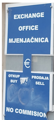
Slika 5. Primjer znaka

Fragmentirani su znakovi također djelomično namijenjeni onima koji ne razumiju hrvatski jer je dio teksta dupliciran, ali sadrže i dodatne informacije na jednom jeziku, u nekim slučajevima na hrvatskom (Slika 4.), a u drugim slučajevima na engleskom (Slika 5.). Što se tiče dodatnih informacija na hrvatskom, u velikom broju slučajeva to je manje važna informacija ili se radi o informaciji koja je jasna iz konteksta (osoba ne mora znati što točno znače riječi „radno vrijeme” da bi shvatila da gleda u znak s radnim vremenom), pa se može reći da ti znakovi ipak zadovoljavaju potrebe turista, ali je teško odrediti komu su znakovi primarno namijenjeni. Međutim, kada su u pitanju dodatne informacije na engleskom, tu možemo s većom sigurnošću zaključiti da su prioritet stranci.