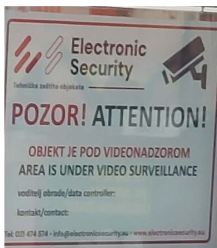
Slika 6. Primjer znaka