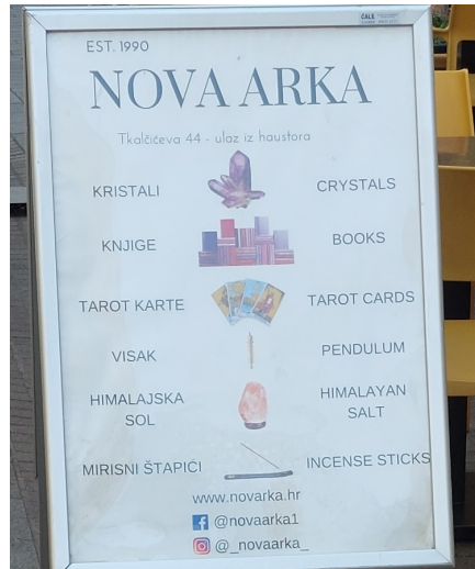
Slika 7. Primjer znaka

Naposljetku, kao što je već pokazano, komplementarnost je najzastupljeniji obrazac, no nakon što se izuzmu znakovi s nazivima, broj komplementarnih znakova naglo se smanjuje. Ovo izuzimanje nije savršeno rješenje jer se time gubi dio informacija. Naime, neki su znakovi komplementarni jer ih naziv čini takvima. Primjerice, znakovi koji sadrže naziv na jednom jeziku te neku dodatnu informaciju na drugom jeziku (Slike 8. i 9.) ili znakovi koji sadrže više od jednog naziva na različitim jezicima. Međutim, drugi su znakovi komplementarni bez obzira na naziv (Slike 10. i 11.) i njihovim izuzimanjem ne dobivamo cjelovitu sliku jezičnog krajolika. Nažalost, u ovome se istraživanju nije bilježila takva distinkcija, pa nije lako prikazati točne kvantitativne podatke vezane uz komplementarne znakove.