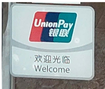
Slika 2. Primjer naljepnice za UnionPay

UnionPay (Slika 2.) koji se može naći na vratima različitih trgovina i ugostiteljskih objekata. Ovo je primjer kako samo jedan akter može utjecati na cjelokupnu sliku jezičnog krajolika.