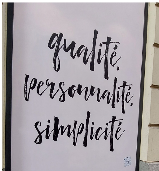
Slika 22. Primjer znaka

Sve u svemu, iako je jasna orijentacija na turizam, u jezičnom krajoliku ipak prevladava hrvatski i za većinu se znakova može reći da su primarno namijenjeni lokalnom stanovništvu. Strani jezici jesu dosta zastupljeni u jezičnom krajoliku te postoje znakovi koji su očigledno namijenjeni turistima, ali u većini se slučajeva strani jezici upotrebljavaju radi isticanja i ostavljanja dojma prestižnosti kod lokalnog stanovništva, a ne prenošenja informacija turistima. Za neke je znakove teško procijeniti komu su više orijentirani, pa bi se u potencijalnim budućim istraživanjima moglo ispitati aktere koji ih kreiraju i postavljaju.