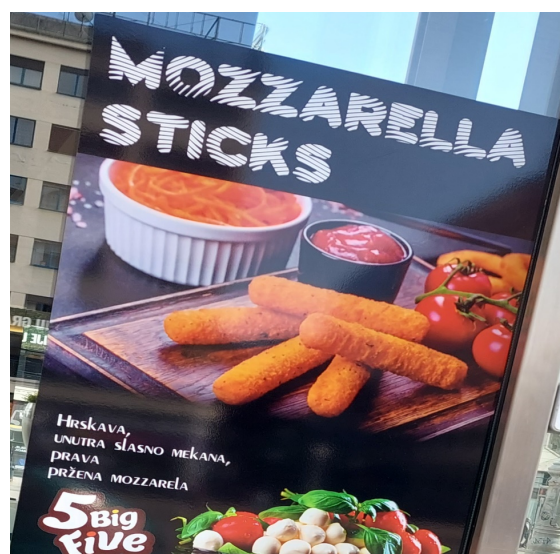
Slika 12. Primjer znaka