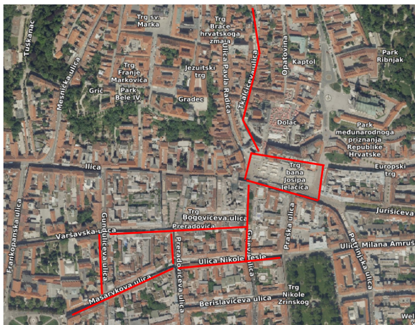
Slika 1. Prostor istraživanja

centru Grada Zagreba s mnogo različitih trgovina i ugostiteljskih objekata 6 , a koji mogu biti privlačni i turistima i lokalnom stanovništvu. Pri odabiru trgova i ulica te određivanju granica istraživačkog prostora uzete su u obzir moguće rute kretanja kako tipičnih turista tako i tipičnih građana, a to je i razlog zašto u prostor analize ulaze samo dijelovi nekih ulica 7 . Istraživanje će se stoga provesti na sljedećim mjestima: Teslina ulica, Masarykova ulica, dio Gundulićeve između Masarykove i Varšavske, dio Varšavske između Gundulićeve i Cvjetnog trga, Cvjetni trg, dio Preradovićeve ulice između Cvjetnog trga i Tesline/Masarykove, Bogovićeve ulica, dio Gajeve između Tesline ulice i Trga bana Jelačića, Trg bana Jelačića te Tkalčičeva ulica do križanja s Ulicom Tome Mikloušića.