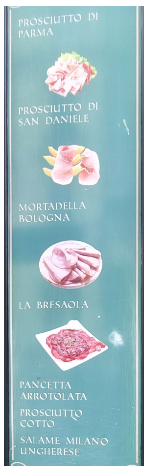
Slika 21. Primjer znaka

Na pitanje komu su namijenjeni jednojezični znakovi teško je odgovoriti, ali budući da se hrvatski jednojezični znakovi upotrebljavaju u puno više različitih namjena i za veći raspon djelatnosti te najčešće prenose važnije informacije, možemo zaključiti da su oni pretežno namijenjeni lokalnim stanovnicima. No, samo njihovo postojanje može zadovoljiti potrebu turista za autentičnošću. Ipak, malo je vjerojatno da akteri koji kreiraju takve znakove imaju to na umu. Što se tiče engleskih jednojezičnih znakova, komu su namijenjeni ovisi o kontekstu u kojem se znak nalazi. Primjerice, ako se radi o nazivu koji je na engleskom, to može privući obje kategorije potencijalnih klijenata, ali s druge strane jelovnici i druge informacije na trgovinama i ugostiteljskim objektima vjerojatnije su namijenjeni primarno turistima. Jednojezični znakovi na ostalim stranim jezicima uglavnom su nazivi objekata, a nekoliko iznimki koristi se zbog prestiža jezika ili ostavljanja dojma autentičnosti (Slika 21. i Slika 22.) što može zadovoljiti potrebe i turista i lokalnog stanovništva.