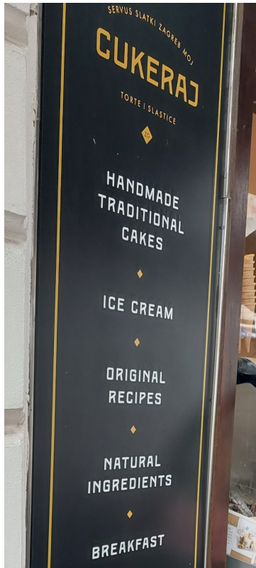
Slika 19. Primjer znaka