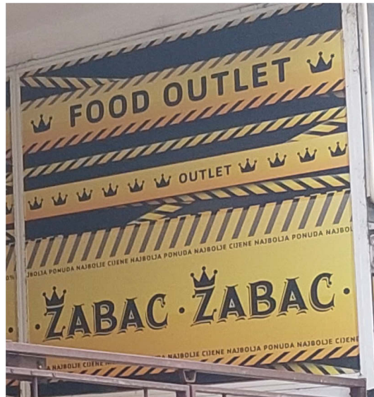
Slika 10. Primjer znaka