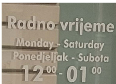
Slika 4. Primjer znaka