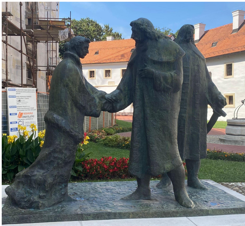
Oproštaj Petra IV. i Ane Katarine Zrinski

Zadatak 1: Pročitaj oproštajno pismo Petra Zrinskog supruzi Ani Katarini i odgovori na polazna pitanja.