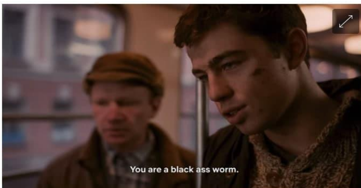
«Не брат ты мне, гнида черножопая» / «Брат»

Фраза «Не брат ты мне, гнида черножопая» переведена как “You are a black ass worm.” В данном переводе обнаруживаются два спорных момента. Первым моментом является выбор слова worm для перевода слова гнида . Сначала обратимся к слову worm . Если бы его перевели обратно на русский, эквивалент был бы глист , который не