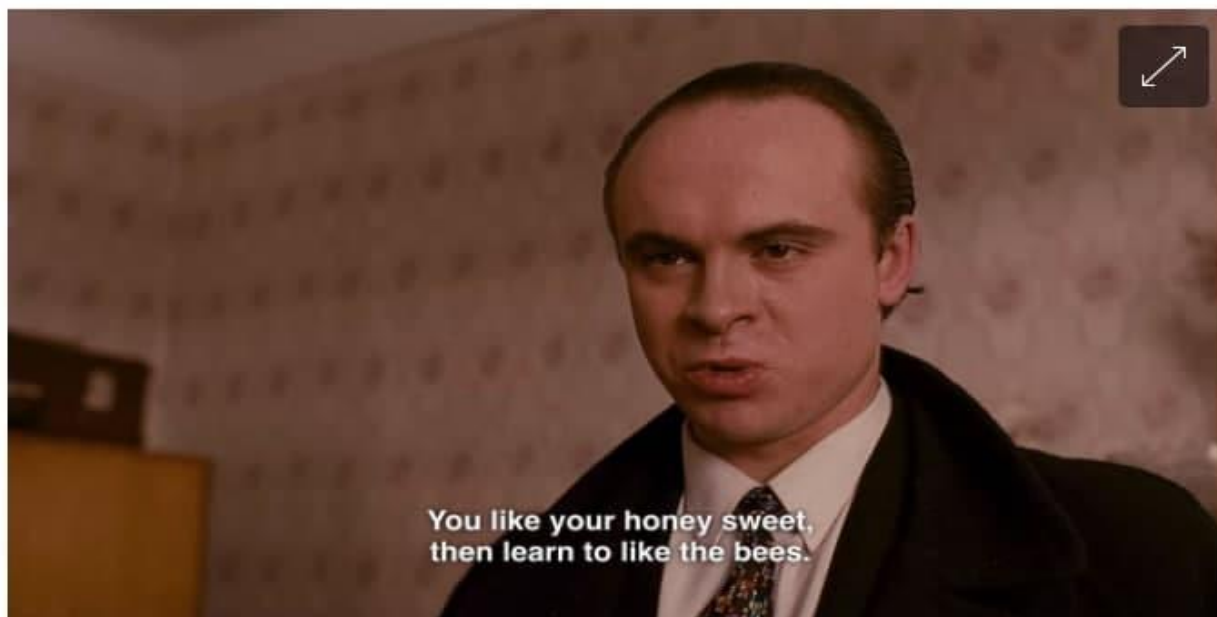
«Любишь медок – люби и холодок» / «Брат»