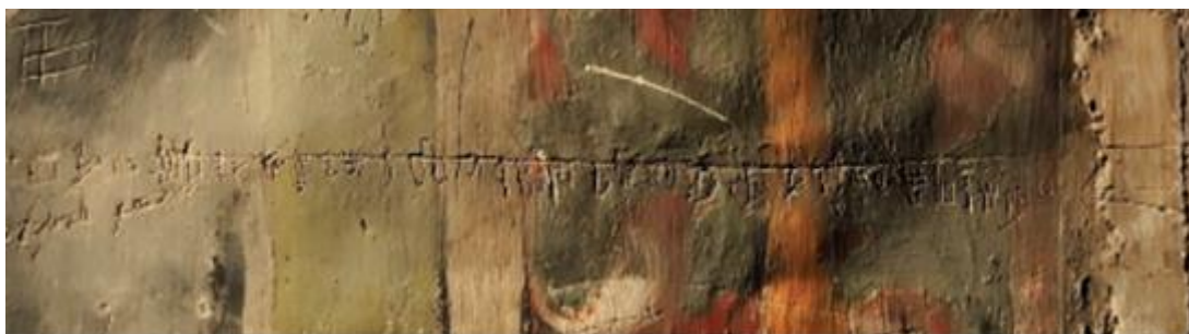
Slika 8. Potpuni glagoljski abecedarij

Jedan se nalazi na prizoru „Raspeća“, na zelenoj pozadini, s desne strane ramena trećeg vojnika. Smješta se u ¾ XV. st., nakon dovršetka zidnih slika, odnosno iza 1479. godine. Veličine je 178x185cm. Također je evidentno da je pisan rukom nekog vježbenika, početnika, s obzirom na to da je slovo „N“ napisano kao zrcalna slika, što je česta početnička greška u pisanju. Zanimljivo da je to slučaj i danas, odnosno ista je problematika pisanja slova „N“ i među današnjim učenicima koji tek počinju učiti pisati. Međutim ono što je vrlo bitno spomenuti jest da je ovo potpuni azbučni niz, odnosno da sadrži sva slova, njih 33, koja su tada bila u upotrebi. 69 (Slika 8.)