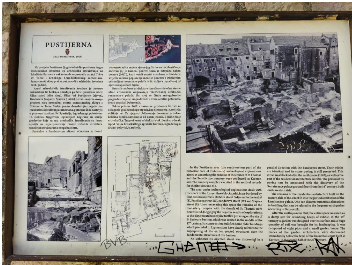
Slika 6: Ploča koju je postavio Grad Dubrovnik 2006. Ulici ispod Mira s objašnjenjem okolnosti nastanka i razvoja „ruševina“ na Pustijerni