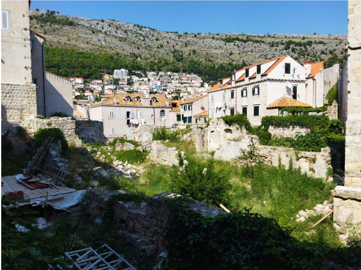
Slika 5: „Ruševine“ na Pustijerni 22. 8. 2023.