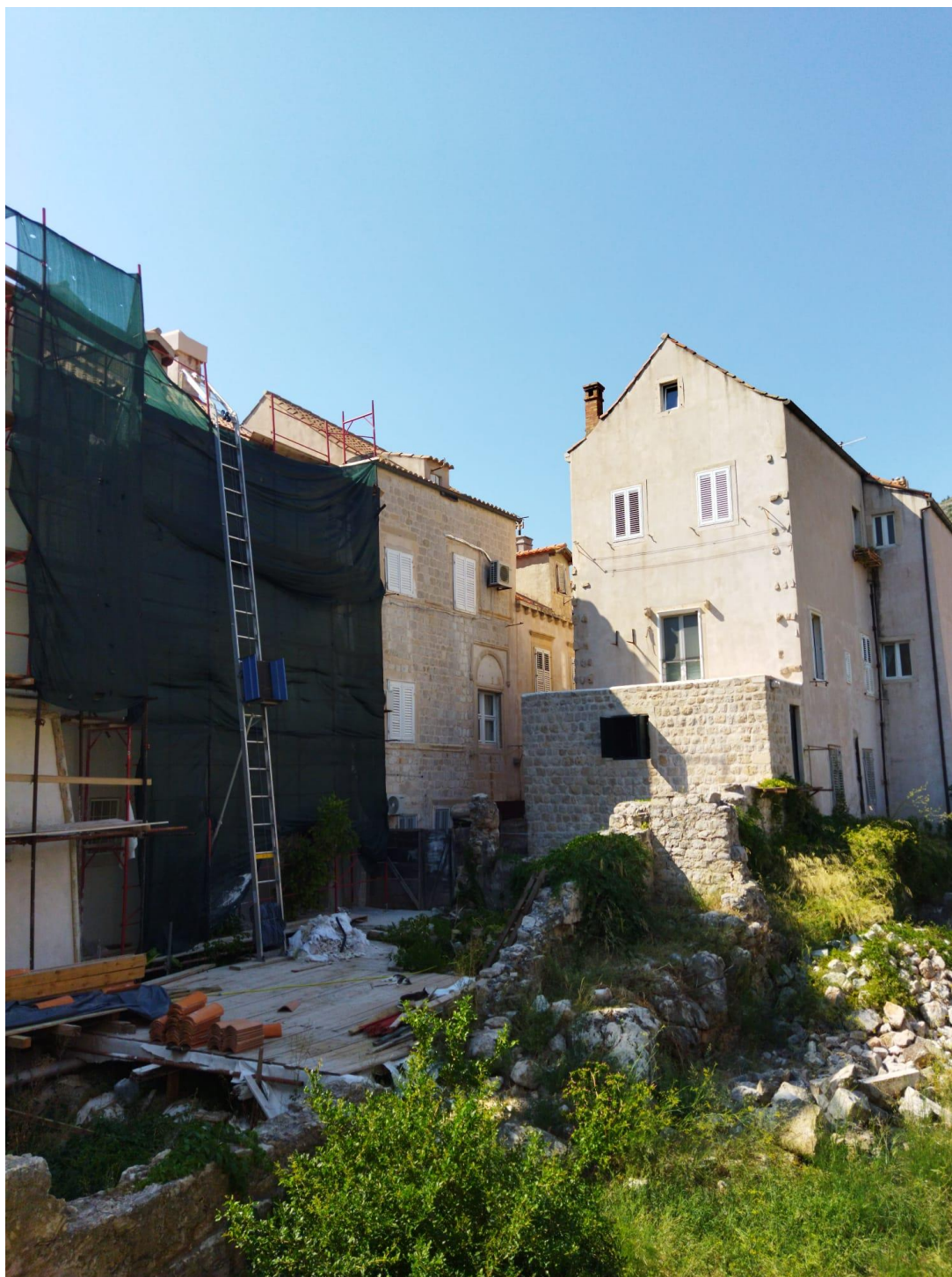
Slika 4: Pogled na Bandurevu 6 (zgrada desno od skele s četiri prozora) od strane bastiona Svetog Spasitelja