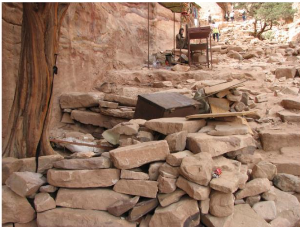
Slika 1: Nekadašnje stepenice koje su vodile do riznice u Petri sada su uništene zbog prijevoza turista na magarcima (Comer i Willems, 2011)

kamenih spomenika zbog ljudskog kontakta, pojačana utjecajem vlage i temperaturnih fluktuacija“ (Comer i Willems, 2012, str. 508). Na pješčenjačkim zidovima stvaraju se bijele nakupine i kemijskom analizom utvrđeno je da su one posljedica naslanjanja umornih turista, koje je dovelo do reakcije kamena i znoja i masnoće s njihovih ruku. (Abu Tayeh i Hussein Mustafa, 2011). Oni također često prolaze putevima koji im nisu namijenjeni, i penju se i sjede po kamenim zidovima i ruševinama. S riznice Khazneh i staroga kazališta je u samo deset godina nestao sloj debljine 40 mm zbog dodirivanja, grebanja i naslanjanja (Abu Tayeh i Hussein Mustafa, 2011). Grafiti i urezivanje natpisa u zidove je česta pojava, kao i smeće, unatoč dovoljnom broju kanti za odlaganje.