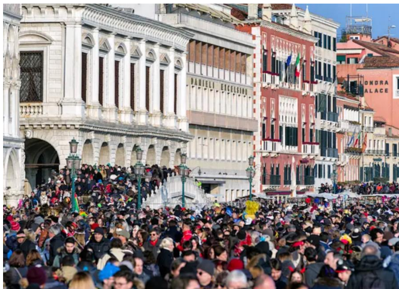
Slika 4: Gužva zbog prekomjernog broja turista u Veneciji (Coffey, 2018)

Venecija je jedno od najpoznatijih turističkih odredišta u Europi. Oko 20 milijuna turista posjeti ju svake godine, dok njenim ulicama dnevno prošeće njih čak 120 000 (Simmons, s.p.). Masovni turizam u Veneciji je „pošast za osjetljive spomenike i okoliš grada“ (Giuffrida, 2019, s.p.). Većina turista zadržava se u relativno malome dijelu grada, blizu najpoznatijih znamenitosti kao što su most Rialto i Trg svetog Marka, što znači da se oko njih uvijek stvara gužva. Turisti u Veneciju najčešće pristižu zračnim prijevozom ili kruzerima, koji nanose veliku štetu i okolišu grada. Valovi koji nastaju prolazom kruzera stvaraju eroziju na podvodnim stupovima na kojima leži grad i zagađuju vodu u kanalima (Giuffrida, 2019). Tijekom vrhunca posjećenosti i do 44 000 turista dnevno bi pristiglo u grad kruzerima, a ostali bi samo nekoliko sati, kupili suvenire i otišli, stoga od takvih posjeta stanovnici grada „nemaju niti velike ekonomske koristi“ (Simmons, s.p.). Michele Levorato, stanovnik Venecije je u intervjuu za The Guardian izjavio da, iako su stanovnici naviknuti na turiste, htio bi da dolaze „bolji,“ jer po njemu mnogi ne poštuju grad (Giuffrida, 2019, s.p.). Osim što izazivaju nesnosne gužve (Sl. 4), stvaraju velike količine otpada, plivaju u kanalima ili rade piknike na trgovima i mostovima i tako ih ometaju u obavezama svakodnevnoga života (Simmons, s.p.).