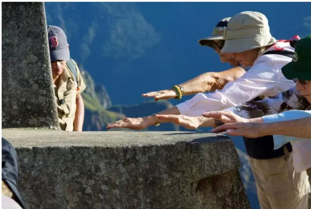
Slika 3: Turisti dodiruju kamen Intihuatana kako bi osjetili njegovu "pozitivnu energiju." Danas je to zabranjeno i čuvari nadgledaju turiste („The Intihuatana stone in Machu Picchu,“ 2017)

pokušali stati na kraj takvim aktivnostima, a volonteri su se okupljali kako bi raščistili otpad na lokalitetu (Meisch, 1985). Dijelovi staroga grada još uvijek se „urušavaju i kližu“ pod težinom mnogobrojnih turista (Buckley, Leung, Spenceley i Hvenegaard, 2018, str. 21). Kao što je slučaj u Petri, i u Machu Picchuu dolazi do uništavanja zbog penjanja i dodirivanja kamenih blokova (Sl. 3).