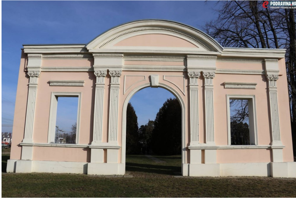
Slika 15. Portal groblja (Matija Gudlin, 2019.)