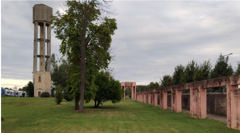
Slika 5. Sadašnje stanje Danice (Ivana Šeničnjak 2022.)