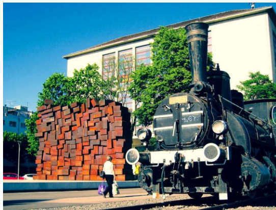
Slika 6. Lokomotiva „Katica“ (Boris Jagačić, 2022.)

Danas je kompleks pod zaštitom gradskog muzeja i sastoji se, kako je vidljivo na slici 5, od ulaznih vrata, vodotornja, parka iz 1980-ih, triju stambenih objekata i ostataka industrijske arhitekture iz početka 20. st., te od spomenika „Izvidnica“ i „Vješala“ s portalom. Međutim, sjeverni dio nekadašnjeg zemljišta Podravka koristi kao parkiralište kamiona, što je neprimjereno s moralnog gledišta (Laszlo, 2008, str. 21). Također bi se kompleksu trebala vratiti „Katica“. Ona je bila premještena bez ičijeg stručnog mišljenja 1992. pokraj zagrebačkog Glavnog kolodvora, a 2022. pridodan joj je spomenik žrtvama Holokausta i ustaškog režima, što se vidi na slici 6, i, prema mišljenju Laszloa, trebala bi se vratiti spomen-području, jer se ne vodi briga o materijalu, ali niti o značenju (nije naznačeno čemu je služila), čime postaje banaliziranom. Tek se od 2005. provodi uređenje prostora, koje je ostalo zapušteno nakon zatvaranja Spomen-muzeja 1991., što je bio odraz kulturne politike revizionizma, nacionalizma te zataškavanja prošlosti tijekom i neposredno poslije Domovinskog rata. Jednu od zgrada logoraša gradski muzej koristi kao spremište etnografskog odjela (Muzej grada Koprivnice).