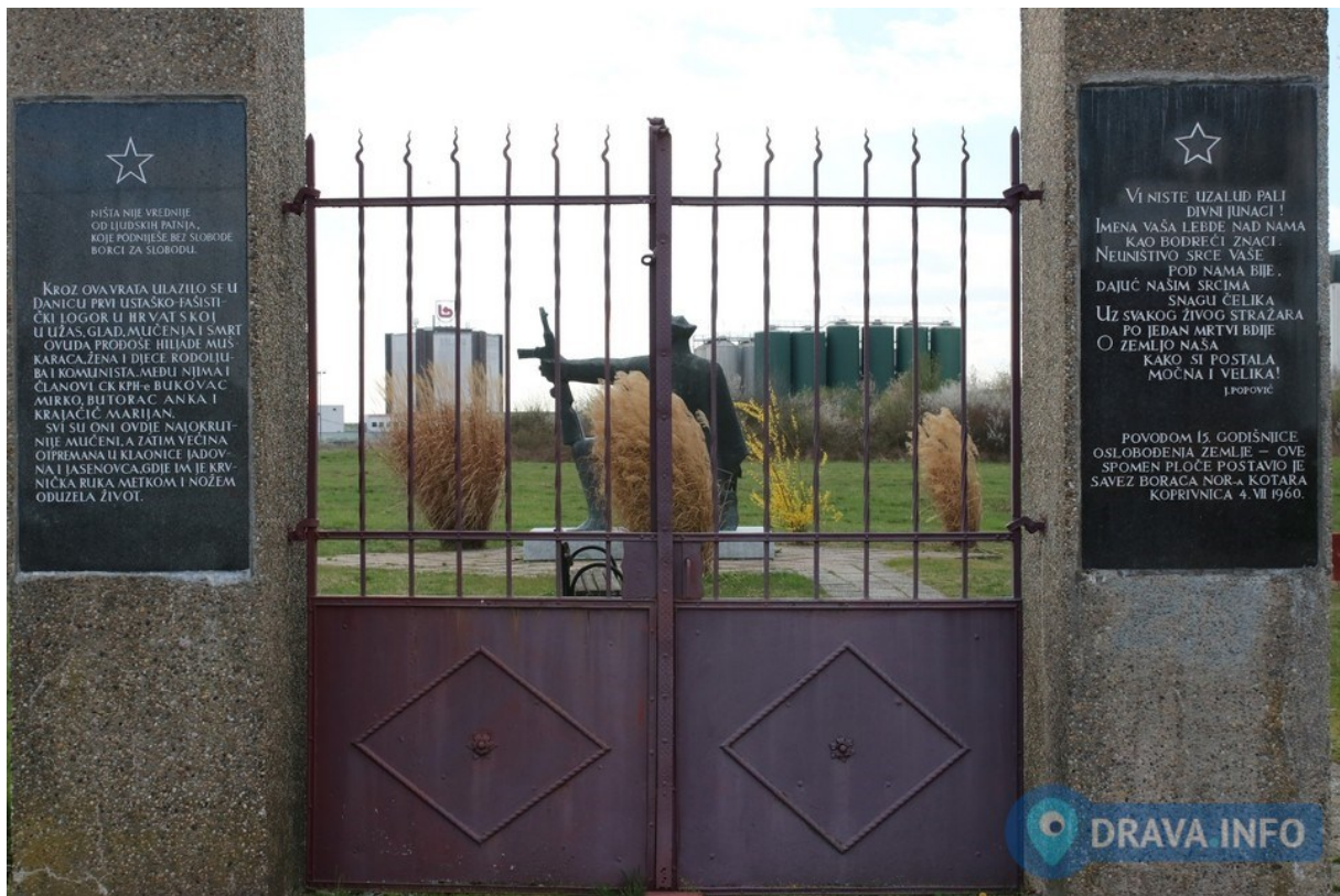
Slika 1. Spomen-područje „Danica“ – ulaz

zbog „aure“, koja se povezala s identitetom ustaštva, provela se prodaja strojeva i upotrebljivog materijala.