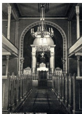
Slika 9. Nekadašnja unutrašnjost sinagoge (nepoznat autor, nepoznata godina)