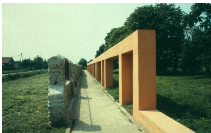
Slika 3. Memorijalni zid (Lenko Pleština, 1981.)