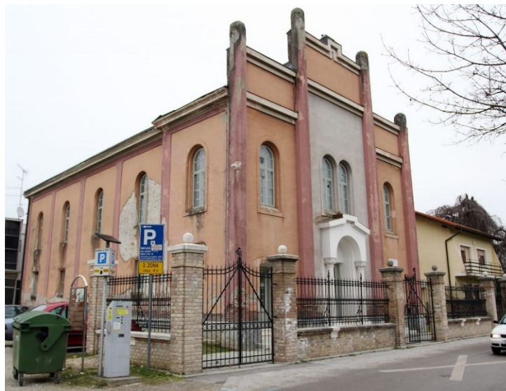
Slika 10. Sinagoga danas