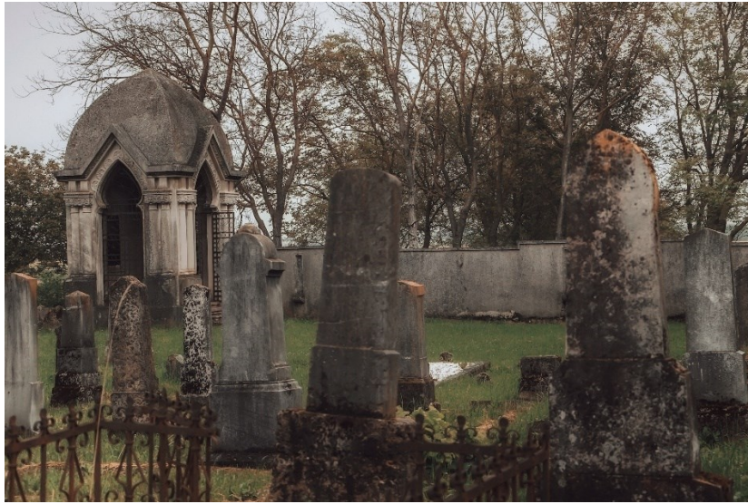
Slika 13. Židovsko groblje

jedno od 65 preostalih groblja takve vrste u RH (ibid., 285), i njegov prostor nije prenamijenjen u stambene ili gospodarske svrhe, što je slučaj s većinom.