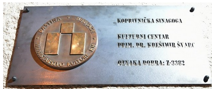
Slika 11. Spomen-ploča (Marko Posavec, 2019.)