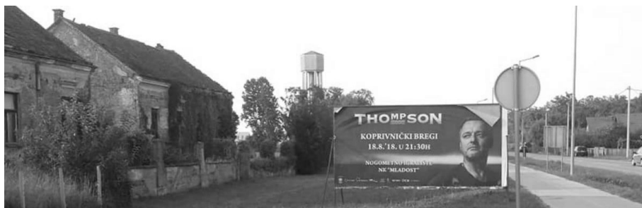
Slika 7. Plakat koncerta Thompsona pored Danice (Zoran Vitanović, 2018.)

Potvrđuje se Krausovo mišljenje da se i danas, kod određenih skupina, veličaju zločini ustaškog režima, i da se ništa ne poduzima, osim paljenjem svijeća, postavljanjem vijenca i održavanjem govora kod komemorativnih događaja, koji se ispunjavaju „pro forma“. Osim debakla s Thomposonovim plakatom, u Koprivnici, uz spomenike antifašizmu, postoji i jedan, posvećen NDH. Naime, u blizini Danice, i dalje stoji obnovljeni spomenik iz 1943., posvećen poginulim domobranima u bitci na Kalniku 1942., kojeg je 1997. obnovilo gradsko poglavarstvo, u suradnji s lokalnim ogrankom Hrvatskog domobrana (Petrić, 2012, str. 74). Premda se na njemu jasno nalaze ustaška obilježja i premda slavi zločince, njega do danas lokalne vlasti SDP-a nisu uništile ili maknule. Zbog takve političke nevolje u suzbijanju neoustaštva, ali i financiranja HOS-a i ostalih desničarskih udruga, manjinske zajednice od 2016., odbijaju sudjelovati na službenim komemoracijama, posebice na onoj u Jasenovcu, kako bi odvojeno izrazili pijetet prema pokojnicima (Vidović 2018), i to će činiti sve dok se ne poduzmu ozbiljnije i konkretne mjere u pitanju kažnjavanja bilo kakvog govora mržnje, što bi, po Ustavu i UN-u, trebalo biti omogućeno.