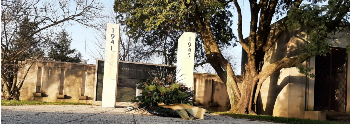
Slika 14. Spomenik žrtvama holokausta (Muzej grada Koprivnice, 2021.)

Dolaskom ustaša u Koprivnicu devastacija groblja je započela te su mnogi spomenici i grobnice srušeni ili oštećeni. Njemačka vojska je 1941. bombardirala groblje. Između nadgrobnih spomenika 1943. vodile su se borbe za oslobođenje Koprivnice, stoga su vidljiva oštećenja od granata i metaka na mramoru. Zbog tih antropogenih razloga, ali i zbog „urbanih i hortikulturnih utjecaja (zarastanje), atmosferilija i promjene tla“ (Fiket, 2022, str. 286), židovska su groblja postala jednom od najviše ugroženih svjedočanstava kulture Židova, koja se, za razliku od kršćanskih, nedovoljno proučavaju. Groblje je nakon rata ostalo zapušteno, u arheološkom kontekstu, zbog toga što se nije više koristilo i održavalo, sve do 1975. g., kada se prepravio spomenik poginulima u Prvom svjetskom ratu iz 1934. g. (Dobrovšak, 2017, str. 56), vidljiv na slici 14. Tada su se za spomen na žrtve fašizma, uz nadležnost SUBNOR-a (Dobrovšak, 2017, str. 63), promijenile brojke 1914. i 1918. na 1941. i 1945. g, a ostatak spomenika nije se mijenjao, čime se gubi kulturna informacija o sudjelovanju Židova u Prvom svjetskom ratu. U 1990-ima, na inicijativu lokalne zajednice redovito se obavlja košnja te ostali poslovi održavanja, premda je tada bilo slučajeva mladenačkog vandalizma.