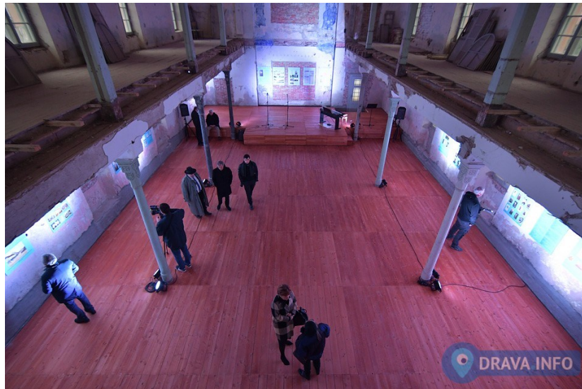
Slika 12. Današnja unutrašnjost sinagoge (Marko Posavec, 2019.)

Nakon rata poprima različite namjene, no ipak, usprkos svemu, posjeduje glavne arhitektonske značajke. Zagrebačka židovska općina, kao nastavak koprivničke, nakon rata je prodala sinagogu gradu Koprivnici u gospodarske svrhe, pošto nije više obavljala religijsku funkciju. Sredinom 1950-ih bila je mjesto djelovanja tvornice tekstila „Krojačko poduzeće“, 1970-ih i 1980-ih služila je kao trgovačko skladište „Izvor“, a 1990-ih kao trgovina rabljenom robom i namještajem (Jalšić Ernečić 2005, str. 26). Ipak, već 1996. postavljena je spomen-ploča, sa slike 11, te se počinje koristiti u kulturne svrhe, čime je židovska zajednica izrazila zadovoljstvo, jer time koprivnička javnost „na izvjestan se način može odužiti brojim svojim bivšim židovskim sugrađanima“ (Švarc, 1996, str. 164). Ta djelatnost započela je već 1990-ih, održavanjem modne revije, kasnije raznih izložaba, koncerata i performansa. Danas je prenamijenjena u koncertnu dvoranu, što se vidi na slici 12, u sklopu Glazbene škole, u kojoj se održava i Festival izvedbenih umjetnosti i kazališta (Siuc, 2019, str. 19) s time da se jedna omanja prostorija zadržala za potrebe preostale židovske zajednice.