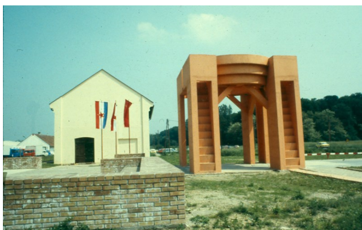
Slika 4. Portal, konjušnica i „Vješala“ (Lenko Pleština, 1981.)