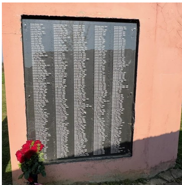
Slika 2. Popis žrtava