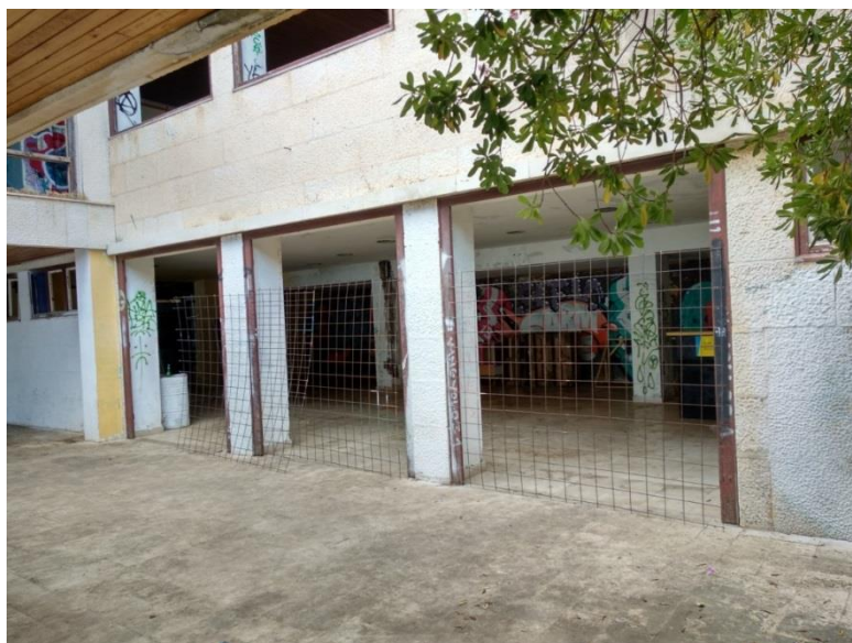
Prilog 10. Prostor unutar Bijele kuće gdje se nalazila pozornica, koji su organizatori nakon završetka ovogodišnjeg festivala ogradili ogradom.

Nakon službenog završetka festivala organizatorima i volonterima još ne predstoji vrijeme za upijanje dojmova, već prije svega rad koji ponovno karakterizira njihovo korištenje prostora. Zatvara se krug između društvene proizvodnje koja prethodi otvaranju festivala i one koja na red dođe kad se festival zatvara. Budući da je program gotov, sva oprema i sadržaji se trajno premještaju, i gotovo odmah nakon završetka glazbenog programa počinje se s čišćenjem Bijele kuće, koje s prekidima traje i tjedan dana nakon završetka festivala. Nakon zadnjeg nastupa gasi se razglas i poslije glazbe čuje se isključivo razgovor posjetitelja. Nagla promjena u decibelima stvara zanimljiv doživljaj. Koliko god brzo se prostor znao napuniti prije nekog nastupa, toliko brzo se sad isprazni. Sa svakom minutom odnos festivala i prostora sve više blijedi jer nedostatak publike to najviše dočarava. Iako festival više ne nudi program ili prodaju pića, u trenucima nakon završetka festivala i dalje mnogobrojni posjetitelji uglavnom se premještaju na plažu ispod Bijele kuće ili u lokacije u kojima su smješteni. Pogotovo plaža ispod Bijele kuće kao prostor koji ne ovisi toliko o programu kao Bijela kuća nudi mogućnost za nastavljanje festivalskih praksi za publiku i nakon službenog završetka festivalskog programa.