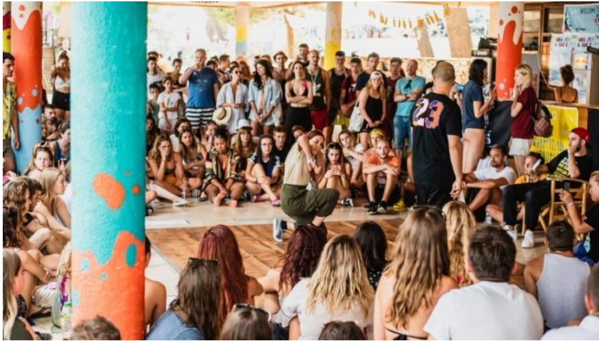
Prilog 22. Pun plato Bijele kuće za vrijeme breakdance natjecanja trećeg festivalnog dana, 27. srpnja.