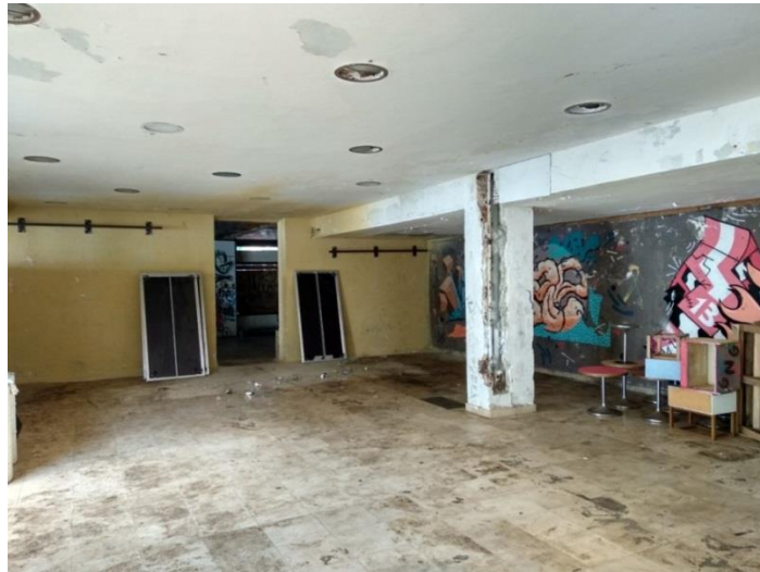
Prilog 20. Unutrašnji prostor Bijele kuće gdje se odvijaju nastupi fotografiran jedan dan nakon završetka festivala.

grupa. Osim što je teza o „festivalu bez pozornice“ ponovno vidljiva, budući da se izvođač (u žutim hlačama po sredini fotografije) nalazi između publike, prostor je ispunjen mnogobrojnim posjetiteljima i fanovima, što pojačava kontrast u odnosu na Prilog 20. Tu sam fotografiju snimio 29. srpnja, jedan dan nakon završetka festivala. Vidi se pozornica koja je rastavljena i čeka odvoz. Isto tako je s prolaza koji je vodio u backstage prostor maknuta GNG zastava koja je služila kao zastor. Stolovi u desnom kutu fotografije izneseni su iz backstagea . Na stropu prostorije vidljiv je manjak rasvjete, a na stupu oštećena žbuka i instalacije koje se nalaze uz njega. Ti detalji u masi posjetitelja nisu vidljivi niti se na njih obraća pažnja, no kad se prostor isprazni, pogled automatski seže prema tim segmentima prostora. Vidljivi su i graffiti kojih inače nema mnogo u unutarnjem prostoru Bijele kuće, barem ne onih naslikanih za vrijeme festivala.