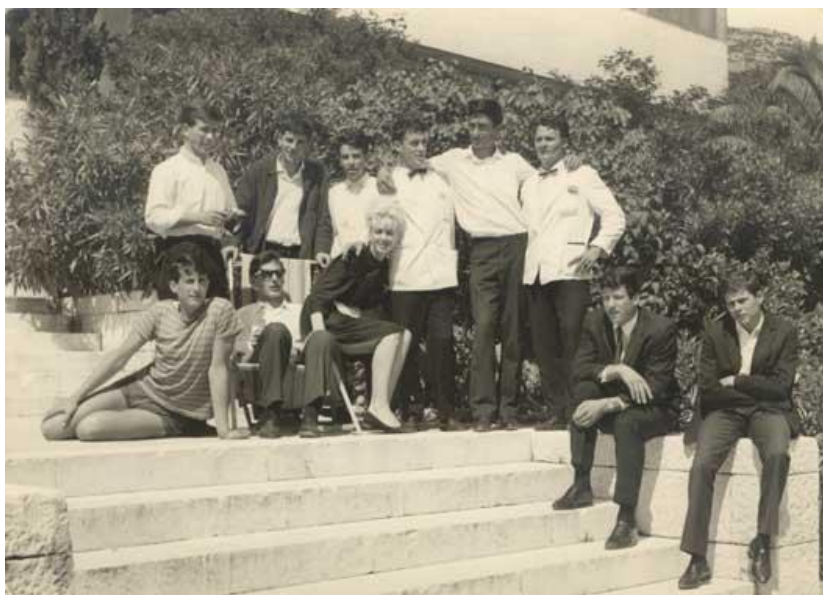
Prilog 5. Osoblje hotela „Bijela kuća“ 1964. godine.

rat. Tijekom 1967., 1968. i 1969. izgrađene su sjeverno od „Bijele kuće“ i dvije nove dependanse: „Martinica“ i „Tamaris“ 22 .