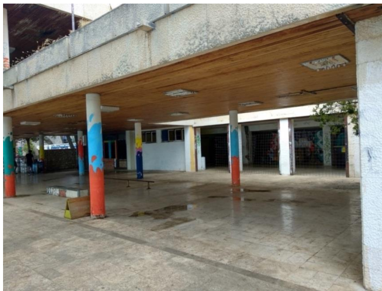
Prilog 23. Glavni plato Bijele kuće nakon završetka festivala.

https://www.facebook.com/GraffitiNaGradele/photos/a.2401473819968023/2401474436634628 (pristup 24. 10. 2019.)