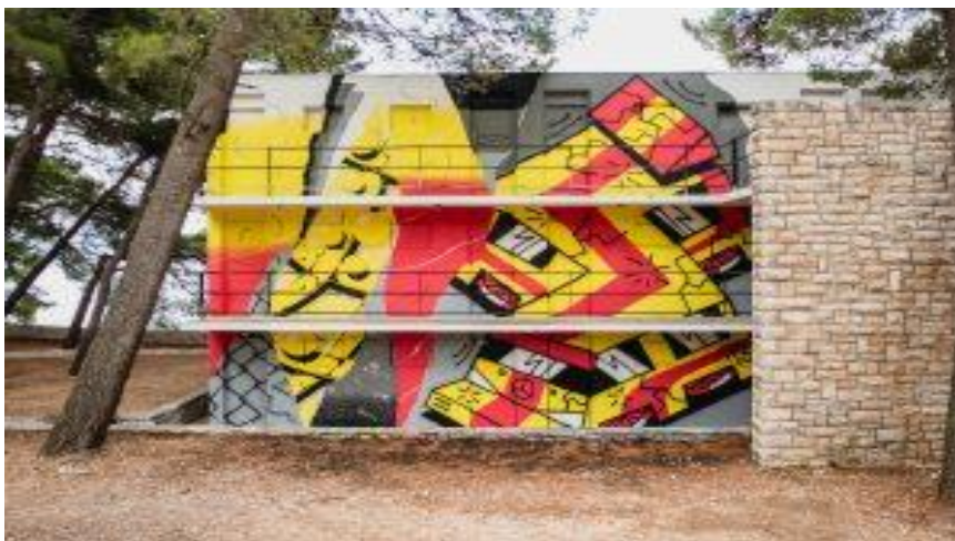
Prilog 12. Mural na zidu istočnog paviljona. Izgled nakon završetka ovogodišnjeg festivala.

Prostor je promijenjen do te mjere da se vrata i prozori više ne prepoznaju. Arhitektonski je to i dalje isti prostor, no on estetski i dekoracijski šalje dvije potpuno različite poruke i kod