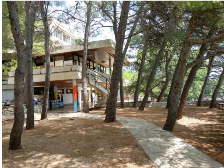
Prilog 18. Prostor uz glavnu zgradu Bijele kuće dan nakon završetka festivala. 29. 7. 2019.

sam prostor Bijele kuće odaje dojam novostvorene funkcionalnosti. Osim prve očite razlike koja se odnosi na broj ljudi u prostoru, primjetna je i razlika u dekoracijama i osvjetljenju koji su obilježje festivala.