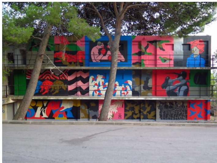
Prilog 16. Mural na vanjskom zidu najzapadnijeg od tri paviljona okrenut prema cesti koja vodi do Bijele kuće, nakon završetka ovogodišnjeg festivala.

Svi paviljonski zidovi prikazani na prethodnim fotografijama se u pravilu iznova prebojaju svake godine. Graffiteri prije početka festivala prvo okreće zid gdje se nalazio stari mural te zatim počnu s radom na novom muralu. Isti proces se onda ponovi sljedeće godine. Organizator mi je rekao da je to programska „strategija kako ne bi došlo do neke monotonije“ i da „to njima [graffiterima] nije problem jer sami žele svakog lita probat nešto novo“. Festival putem njih svoj trag trajno ostavi na prostoru, jer jedan mural samo zamijeni drugi. Taj proces traje već pet godina, otkad se festival služi prostorom Bijele kuće. Velika razlika između izgleda paviljona prije dolaska festivala na prostor i njihovog izgleda danas rezultat je utjecaja festivala i njegovih izvođača. Organizatori su prostor zatekli u stanju u kojem se i