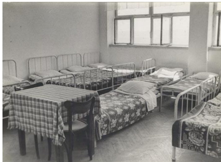
Prilog 4. Spavaonica Đačkog doma u kojoj su ljeti tijekom 1960-ih godina boravili studenti iz Francuske.