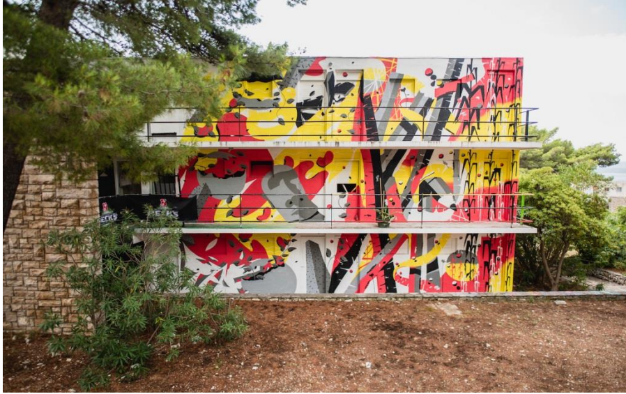
Prilog 14. Druga strana vanjskog zida istočnog paviljona. Izgled nakon završetka ovogodišnjeg festivala. Izvor: https://vizkultura.hr/spoj-otockog-ambijenta-i-ulicne-umjetnosti/ (pristup 24. 9. 2019.)

Na fotografiji iz 2011. može se primijetiti loše stanje vrata od kojih su neka i razbijena, kao i hrđa na pojedinim mjestima. Na novijoj fotografiji vizualno se ponovno gube stara obilježja paviljona, vrata i prozori vide se samo izbliza, a umjetnički motiv murala s jedne strane zida nastavlja se i na drugoj te se vide i pojedina sponzorska obilježja festivala koja su tu samo za trajanja festivala. Boje su kod drugog murala slične kao i kod prvog. Iako su dva dijela paviljona odnosno dva murala odvojena kamenim zidom osjećaj kontinuiteta između dva umjetnička djela svejedno je prisutan.