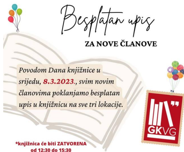
Slika 5: Plakat s pozivom na besplatan upis povodom Dana knjižnice 2023. godine

Besplatan upis omogućen je i učenicima prvih razreda tijekom Mjeseca hrvatske knjige, povodom Dječjeg tjedna, te pobjednicima u natjecajima u organizaciji knjižnice i slično.