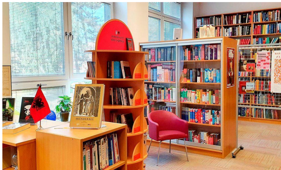
Slika 12: Albanski kutić u Gradskoj knjižnici Velika Gorica, otvoren 2021. godine