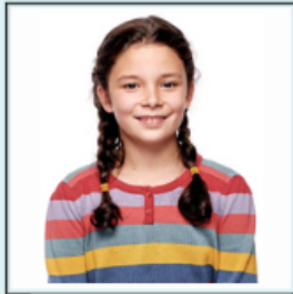
1. Finja C

1. Ergänze die fehlenden Namen und verbinde die Figuren mit ihrer Handlung wie im Beispiel.