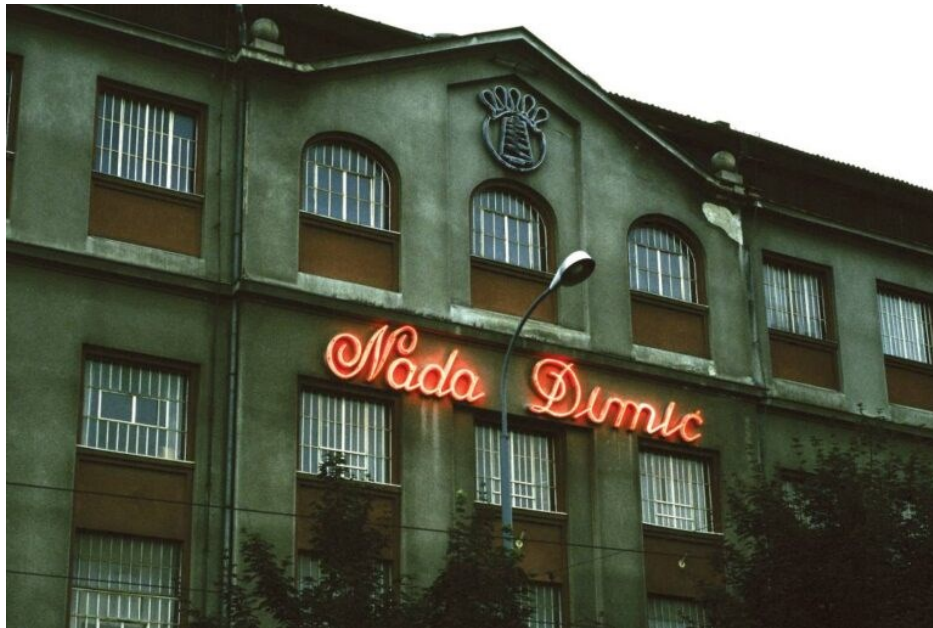
Slika 9. Tvornica Nada Dimić s umjetničkom intervencijom Sanje Iveković („Sanja Iveković: Nada Dimić File 2023 / Nada Dimić – Rekonstrukcija Industrijskog Nasljeđa, Izložba - SVIJET KULTURE,” 2023)