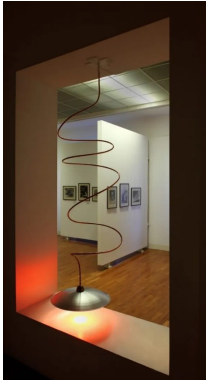
Slika 1. Dubravka Rakoci, Crtež u prostoru , 2011. („Dubravka Rakoci, Crtež u prostoru , 2011. - Muzej za umjetnost i obrt,” 2018)

funkcionalne svjetiljke, sugeriraju da ih je potrebno doživjeti kao simbolične svjetlosne interpretacije karakterističnog motiva kruga koji je temelj njezina slikarstva (Fučkan, 2019).