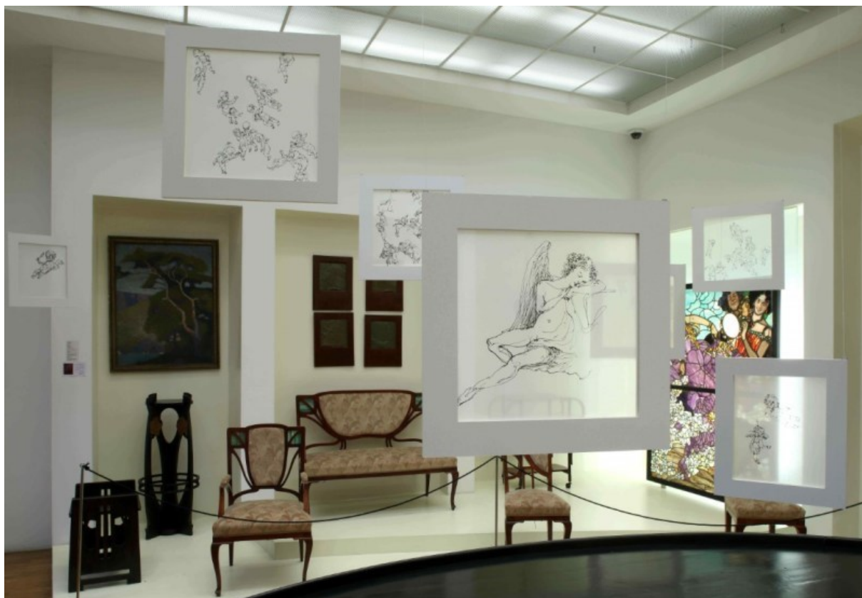
Slika 3. AKIKO SATO : DRAW ATTENTION, 2018 („Artist-in-residence: Akiko Sato - Muzej za umjetnost i obrt,” 2018)

Konačno, kroz primjere izložbi i umjetničkih intervencija u stalnoj zbirci, ovaj projekt pridonio je naglašavaju uloge muzeja kao institucionalnog čuvara društvene memorije i čuvara materijalnih dokaza o prošlosti. Također, njima se ističe potreba za prilagođavanjem stalnog postava kako bi se bolje povezao sa suvremenim umjetničkim praksama (Fučkan, 2019).