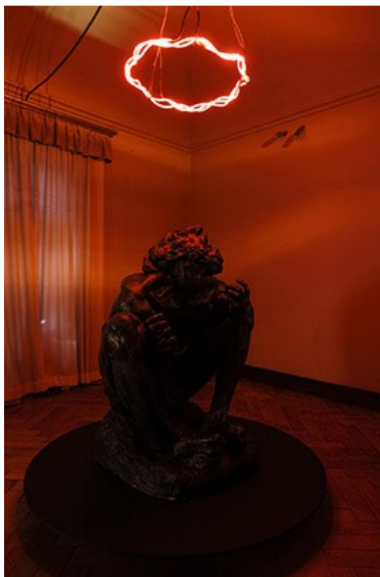
Slika 4. Petar Barišić, Vručina (Zlomislíć, 2014)