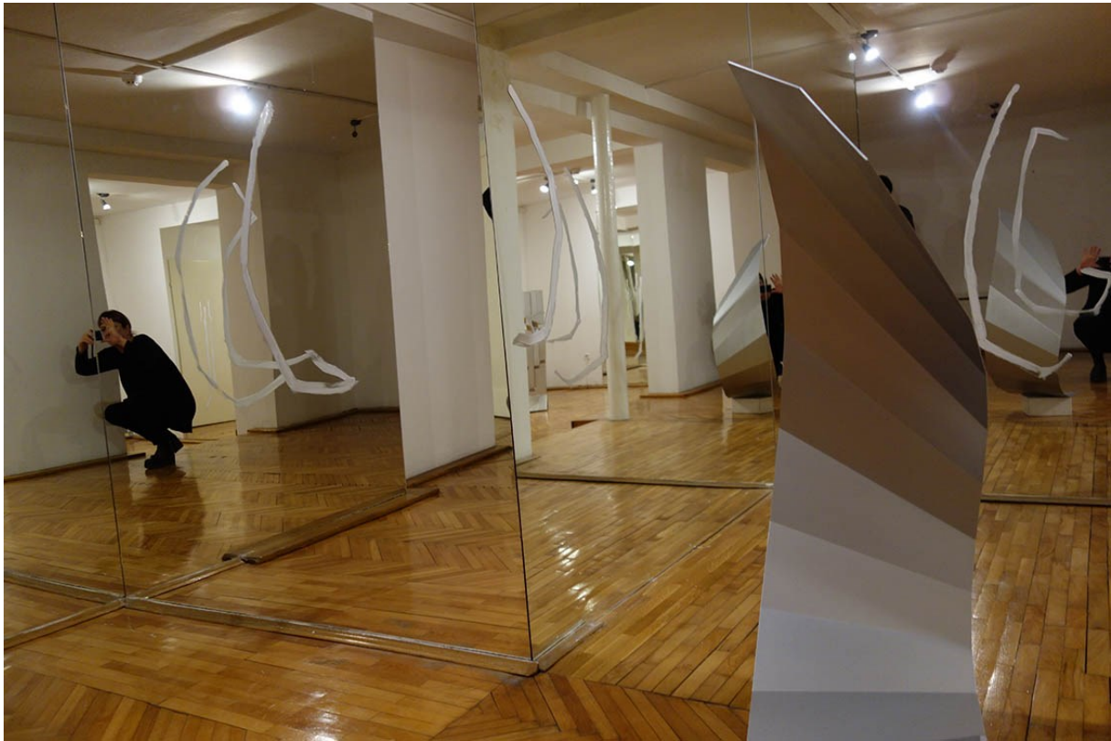
Slika 6. Ksenija Turčić, Procjepi (Babić, 2018)

koje se umjetnica referira. Umjetnica intervenira u prostor postavljajući ogledala koja stvaraju iluzionistički dojam, čime prostor postaje prividno beskonačan. Richterove geometrijske forme Turčić interpretira u dvodimenzionalnoj verziji, pri čemu linije daju dojam titravosti. Promatrač postaje aktivnim sudionikom ovakve intervencije jer se linije, koje su izvedene u prostoru, poklapaju s Richterovim skulpturama pod određenim kutom promatranja, pa promatrač kretanjem utječe na te vizualne relacije (Babić, 2018).