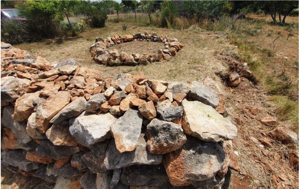
Slika 14. Josip Zanki, land art instalacija ("Land Art Instalacije Suhozida Na Pagu," 2021)