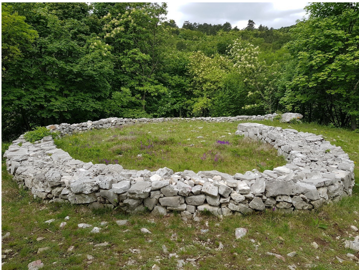
Slika 13. Ljubo De Karina, Veles (Flajsig, 2020)

Gore spomenuto umijeće suhozidne gradnje umijeće je izrade konstrukcija od kamena bez upotreba vezivnog materijala koje je prisutno na jadransko-dinarskom području Hrvatske od prapovijesti do danas („Umijeće suhozidne gradnje“, s.a.). Oslanjajući se upravo na ovu tradiciju, nastao je projekt Suhozidi: trag u krajoliku ili zaboravljena kulturna baština , koji je proveden u lipnju 2021. godine. Projekt se sastajao od gradnje land art instalacija na više mjesta duž hrvatske obale. Lokacije s land art instalacijama pomogle su podizanju vidljivosti suvremene umjetničke prakse te također svijesti o potrebi očuvanja kulturne baštine. Na projektu su sudjelovali umjetnici, etnolozi i kulturni antropolozi te studenti i učenici. Nastale su razne instalacije, a istaknut ću rad umjetnika Josipa Zanko koji je napravio land art rad oblika bunje, tradicionalne građevine koja je imala funkciju poljskog skloništa diljem hrvatskog Jadrana (Sl. 14). Rad je napravljen na Paškim vratima na otoku Pagu („Završio je projekt Suhozidi ”, 2021).