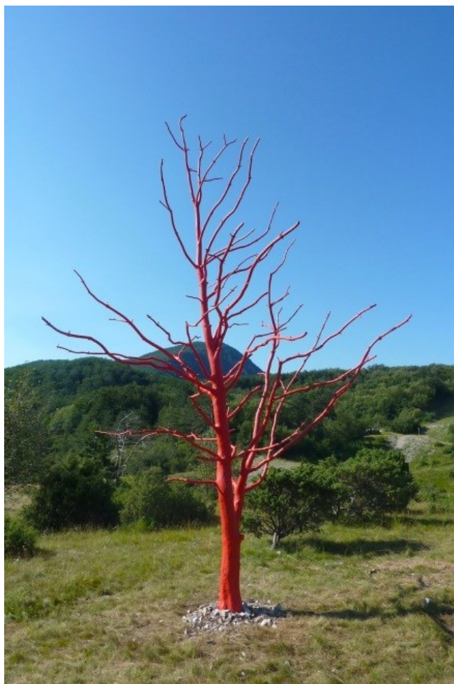
Slika 12. Boris Pecigoš, Crveno stablo (Pecigoš, s.a.)

Ljubo De Karina, hrvatski kipar, u Parku prirode Učka radi intervenciju naziva Veles (Sl.13). Intervencija je izvedena participativno, a uz umjetnika sudjelovali su i studenti raznih smjerova. Veles je izveden na jednoj točki mitsko-povijesne staze Trebišća – Perun (Flajsig, 2020) koja ima cilj približiti slavenska vjerovanja te povijest i život njihove zajednice (Poučne staze i šetnice – Park prirode Učka, 2022). Staza je otvorena 2009. godine te se iste godine održava prva radionica umijeća suhozidne gradnje u sklopu koje je izveden upravo i rad Veles koji poprima oblik zmije (Flajsig, 2020).