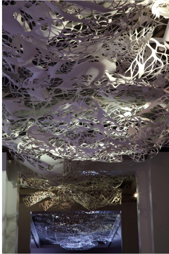
Slika 2. Ida Blažičko, Topologija beskraja, 2015. (Ida Blažičko, Topologija Beskraja, 2015. – Muzej za umjetnost i obrt, 2018)

Zadnja umjetnica koja će biti spomenuta kao dio ovog projekta jest japanska umjetnica koja živi i djeluje u Hrvatskoj – Akiko Sato i koja je velikodušno svoj umjetnički rad donirala Muzeju. Umjetnica je izvela seriju od otprilike sedamdeset crteža na svili inspiriranih muzejskim predmetima (Sl.3). Ovi su crteži postavljeni u ambijentalne inscenacije koje odražavaju vjerovanja šintoizma, animističke religije u Japanu. Cilj ovog projekta bio je oživjeti duhovni potencijal pojedinačnih prikaza muzejskih predmeta te stvoriti imaginarnu povezanost između likovnih reprezentacija „duhova” koji obitavaju u muzeju. Akiko Sato na svojim je crtežima prikazala antropomorfne i zoomorfne motive kao predstavnike vitalnih psiholoških aspekata i povezala ih u dramatične situacije. Također, posjetiteljima je pružena mogućnost sudjelovanja u projektu kroz zadatak crtanja njihovog omiljenog muzejskog motiva, čime je izložba dobila interaktivan i radionički karakter (Fučkan, 2019).