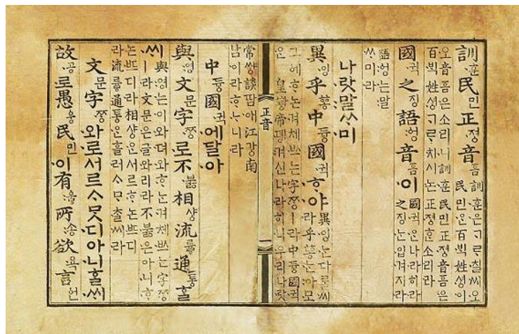
Slika 4. Hunminjongum; prvi oblik hangula (Anon., n.d.)

sačinjavali elitnu klasu bili su dobro obrazovani u pisanom kineskom jeziku, i mogli su pisati korespondenciju za kineski dvor, argumente o neokonfucijanskoj filozofiji, poeziju i bilo što drugo što je mogao svaki dobro obrazovani Kinez. Mogli su korejski pisati i modificiranim kineskim pismom - idu , ali je bilo toliko teško i zamorno da su ga mogli koristiti samo dobro obrazovani, tj. oni koji su znali klasični kineski. Vidljiva na slici 4, nova abeceda izvorno se zvala hunminjongum što znači „poučavati ljude ispravnim zvukovima“ (Peterson & Margulies, 2010). Jasno je da je abeceda imala preskriptivnu svrhu i čini se da je briga za obične ljude bila na prvom mjestu u umu kralja Sejonga. Danas je abeceda poznata kao hangul te se sastoji od 24 slova: 14 suglasnika i 10 samoglasnika (King Seijong Memorial Society, 1970).