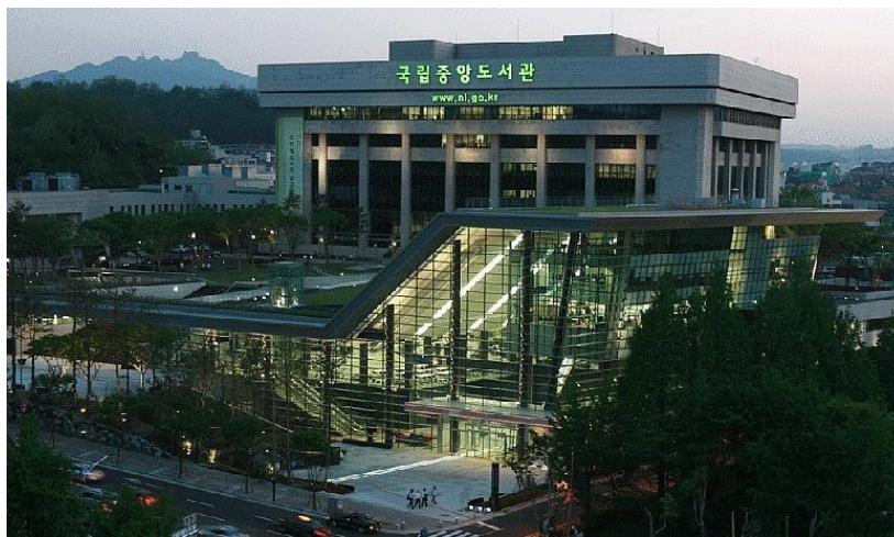
Slika 7. Nacionalna knjižnica Koreje danas (Anon., n.d.)

kao mala zbirka knjiga i dokumenata koji su bili sakriveni od japanske kontrole tijekom rata, ali je od tada narasla u jednu od najvećih knjižnica u Aziji, s preko 10 milijuna svezaka knjiga i druge knjižnične građe. Nacionalna knjižnica ima niz važnih funkcija osim što služi kao spremište informacija; odgovorna je za prikupljanje, očuvanje i širenje korejske kulturne baštine i služi kao nacionalni centar za istraživanje bibliotekarstva i informacijskih znanosti. Uz glavnu knjižnicu u Seulu, Nacionalna knjižnica ima podružnice u drugim dijelovima zemlje, uključujući Međunarodnu knjižnicu dječje književnosti u Jeonjuu i knjižnicu Nacionalne skupštine u Yeouidu, koja služi kao knjižnica južnokorejskog parlamenta. Nacionalna knjižnica je također poduzela brojne inicijative kako bi svoje izvore i informacije učinila dostupnijima javnosti. Tako je 2008. godine pokrenula projekt 'Nacionalna digitalna knjižnica Koreje', čiji je cilj bio digitalizirati i omogućiti online pristup milijunima jedinica u svojoj zbirci. Knjižnica također nudi niz online usluga, uključujući digitalnu referentnu uslugu, mobilnu aplikaciju i online izložbe (Chung, 2007).