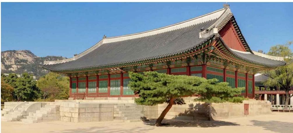
Slika 5. Jiphyeonjeon; kraljevska knjižnica (Cultural Heritage Administration, n.d.)

Kralj Sejong je 1402. kao dio svojih nastojanja da unaprijedi obrazovanje i znanost u Koreji osnovao dvije institucije: Gyeongyeon (kraljevska predavaonica) i Jiphyeonjeon (kraljevska knjižnica). Ove dvije institucije, blisko surađujući jedna s drugom, odigrale su ključnu ulogu u proučavanju konfucijanskih rituala i sustava tijekom Sejongove ere (Koo, 2021). Prikazan na slici 5, Jiphyeonjeon je služio kao primarna knjižnica kraljevskog dvora i koristio se za pohranu i očuvanje važnih povijesnih dokumenata, literature i znanstvenih tekstova, a također je služio i za odgoj i obrazovanje učenjaka. Knjižnica je također odigrala ključnu ulogu u razvoju korejskog jezika, budući da je kralj Sejong upravo u njoj osmislio korejsku abecedu, poznatu kao hangul. Knjižnica se nalazila unutar palače Gyeongbokgung u glavnom gradu Seulu i smatrana je jednom od najvažnijih kulturnih institucija u Koreji. Jiphyeonjeon je dizajniran da bude mjesto gdje bi znanstvenici mogli dolaziti provoditi istraživanja, proučavati i razmjenjivati ideje. Knjižnica je bila podijeljena u dva dijela, glavnu dvoranu i unutarnju prostoriju. U glavnoj dvorani nalazila se zbirka knjiga, koja je bila podijeljena u kategorije prema sadržaju, dok je unutarnja prostorija služila kao mjesto za čitanje i proučavanje knjiga za učenjake (Koo, 2021).