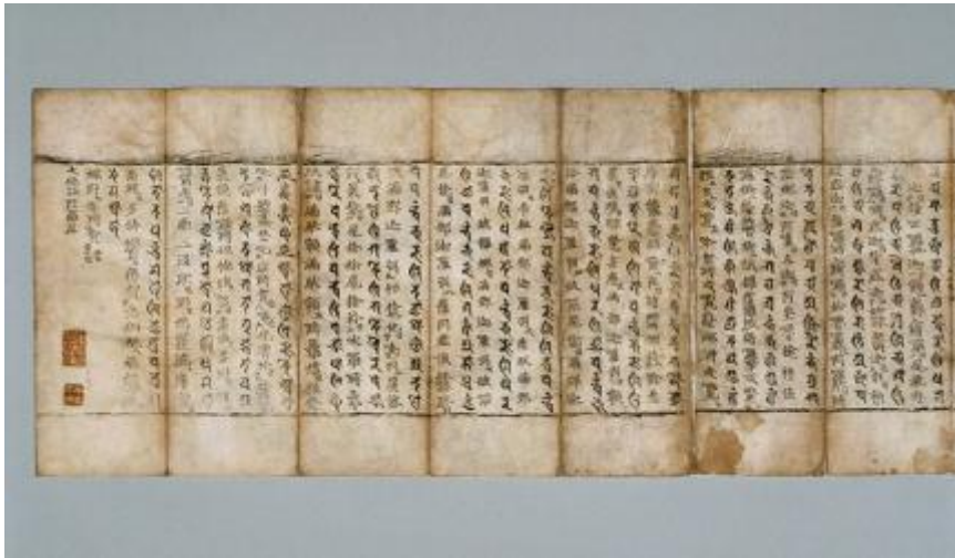
Slika 3. Dharani Sutra (Cultural Heritage Administration, 2006)