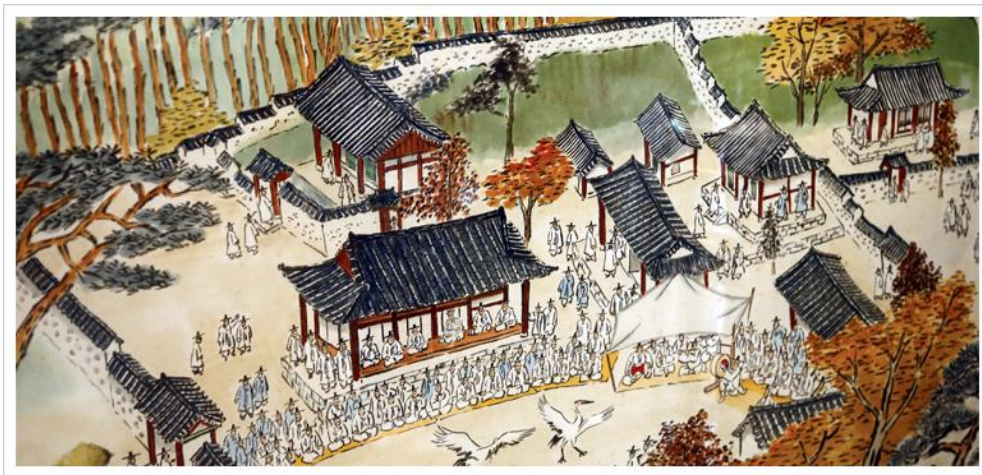
Slika 6. Depikcija sarim seowon kompleksa (Oh, 2014)

proučavanje konfucijanskih klasika i učenja, a služili su kao središta učenja i intelektualne aktivnosti za Joseon elitu. Neki znanstvenici vide osnivanje sarima kao posljedicu povlačenja konfucijanskih učenjaka zvanih sarim („šuma učenjaka“) iz političke sfere kako bi izbjegli suđenje (Haboush & Deuchler, 1999). Odjednom se dogodio veliki pad u osnivanju državnih obrazovnih ustanova, a upravo taj pad je pridonio porastu osnivanja privatnih ustanova poput sarim seowona. Na drugu ruku, neki znanstvenici tvrde da je rast privatnih obrazovnih institucija manifestacija rasta konfucijanske moći. Nova vrsta učenjaka-činovnika, sarimi, bili su više ideološki predani neokonfucijanizmu i bili su odlučni ostvariti ciljeve postavljenih od strane konfucijanskih mudraca. Unatoč neuspjesima koje su pretrpjeli, sarim znanstvenici i dužnosnici nastavili su stjecati političku snagu i osnivali su privatne obrazovne institucije kako bi ostvarili svoje ideološke i političke ciljeve (Hinton, 1956).