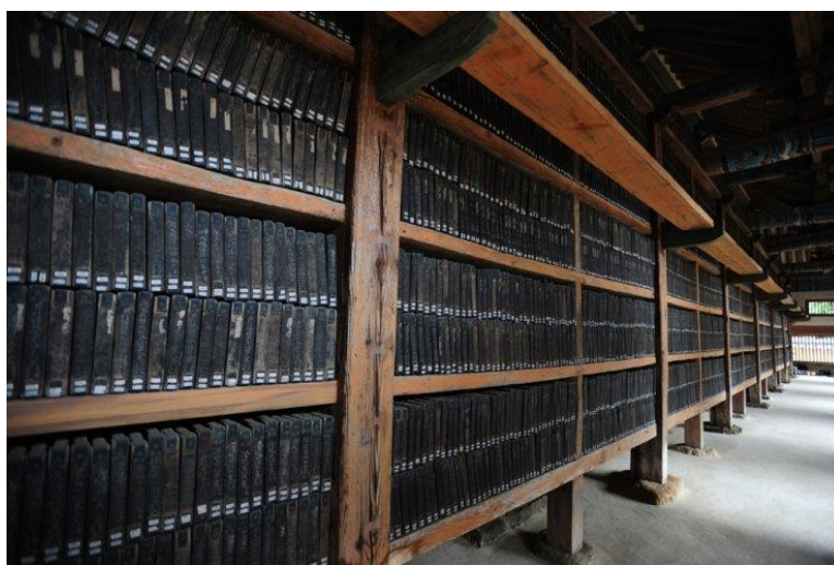
Slika 2. Tripitaka Koreana čuvana u hramu Haeinsa (Park, 2021)

je 553. godine sagradio kralj Jinheung kako bi hram služio kao simbol njegove novonastale dinastije. Knjižnica je bila poznata po svojoj golemoj zbirci budističkih spisa, uključujući i korejsku verziju Tripitake – Tripitaka Koreana . Godine 989. korejski kralj Hojong naredio je prijepis kineske Tripitake čija je priprema trajala desetljećima, a većina primjeraka uništena je u mongolskom napadu u 13. stoljeću. Svega nekoliko primjeraka sačuvano je u Japanu (Stipčević, 1985). Godine 1236. kralj Gojung naredio je izradu drvoreza za prijepis drugog izdanja Tripitake, a čitave ekipe drvorezaca izrađivale su drvorez punih 16 godina. Ukupno je izrađeno više od 160 tisuća drvoreza na više od 80 tisuća drvenih ploča koji se sve do danas čuvaju u budističkom hramu Haeinsa, prikazanom na slici 2 (Hebrang Grgić, 2018). Kompleks hrama Haeinsa poznato je odredište za hodočašća, ne samo među korejskim budistima, već i budistima iz cijelog svijeta. Spremišta hrama Haeinsa jedinstvena su kako u svojoj specijaliziranoj vrsti strukture, tako i zbog izuzetno učinkovitih ideja razvijenih u 15. stoljeću za rješavanje problema pohranjivanja i očuvanja 80.000 drvenih ploča. Tripitaka Koreana danas se smatra jednim od najznačajnijih artefakata korejske budističke kulture i prepoznata je kao dio svjetske baštine UNESCO-a (Unesco, 1995).