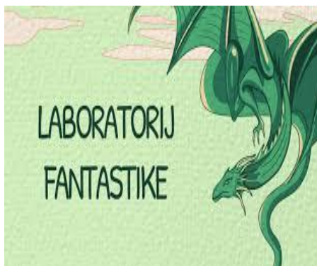
Slika 5. Radionica kreativnog pisanja „Fantasy Lab“ u Gradskoj knjižnici Rijeka

Još jedan primjer dobre prakse je i onaj iz Gradske knjižnice Rijeka. Naime, Udruga 3. zmaj u suradnji s Gradskom knjižnicom Rijeka pokrenula je još jedan krug radionica kreativnog pisanja fantastike, znanstvene fantastike i horora pod nazivom „Fantasy Lab“, namijenjenih dobnoj skupini od 15 do 27 godina, a sudjelovanje na radionici je bilo besplatno. Radionice su se održavale u Dječjem domu u Rijeci od travnja do lipnja 2022. godine. Seminari su se održavali jednom tjedno, a broj prijava je bio ograničen. Radionica je održana više od deset puta pod vodstvom Zorana Krušvara, autora brojnih priča, romana, slikovnica i drugih nagrađivanih tekstova, člana Društva hrvatskih književnika, Hrvatskih samostalnih umjetnika, neformalnih grupa Ri lit i Fluminati kolektiva .