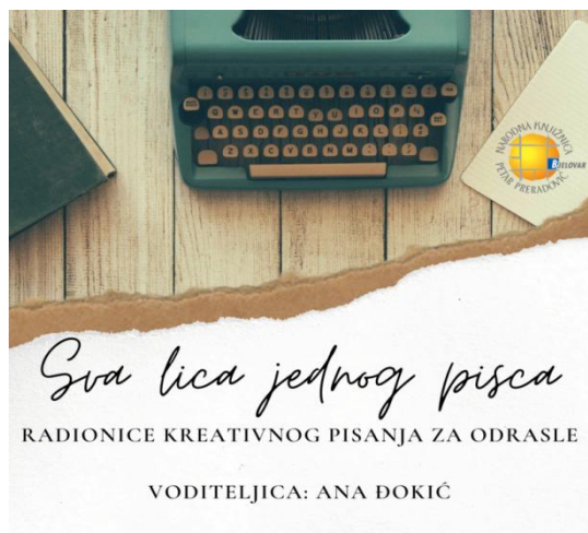
Slika 7. Radionica kreativnog pisanja „Sva lica jednog pisca” u Narodnoj knjižnici Petar Preradović

U Narodnoj knjižnici Petar Preradović u Bjelovaru, povodom Mjeseca hrvatske knjige 2020. godine pod vodstvom književnice Ane Đokić održana je (preko platforme Zoom) i radionica kreativnog pisanja za odrasle pod nazivom „Sva lica jednog pisca”. 43