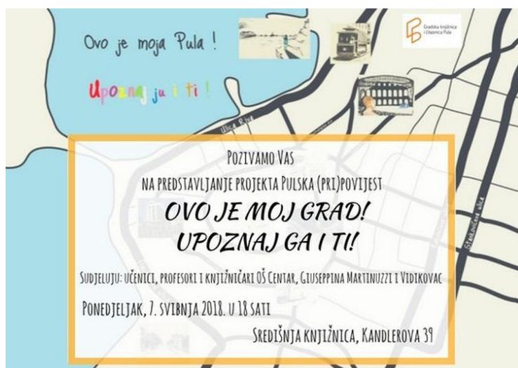
Slika 6. Radionica kreativnog pisanja „Pulska (pri)povijest-ovo je moj grad! Upoznaj ga i ti!” u Gradskoj knjižnici i čitaonici Pula

Knjižnica i čitaonica Fran Galović u Koprivnici organizira različite projekte i seminare, a posebno se ističu njihove kreativne radionice. Ove radionice održavaju se u prostorima knjižnice ili u njenom vrtu, a njihov glavni cilj je pružiti mjesto za druženje, razmjenu znanja i ideja te poticanje kreativnosti. Radionice vode različiti pisci, umjetnici, edukatori, učitelji i učenici. Primjerice, u radionici kreativnog pisanja stripa koja je održana u knjižnici 2016. godine pod vodstvom umjetnika Zvonimira, sudjelovalo je 26 polaznika u dobi od 6 do 13 godina. Osim toga, organizirana je i radionica pod nazivom „Neispričane priče”, gdje su učenici bili zaduženi za izdvajanje dijelova priče i stvaranje jedne priče, osmišljavanje slikovnice s voditeljem te na kraju pisanje teksta koji povezuje sve slike i riječi u slikovnicu. Radovi s ovih radionica dostupni su i u elektroničkom obliku na mrežnoj stranici knjižnice. 39