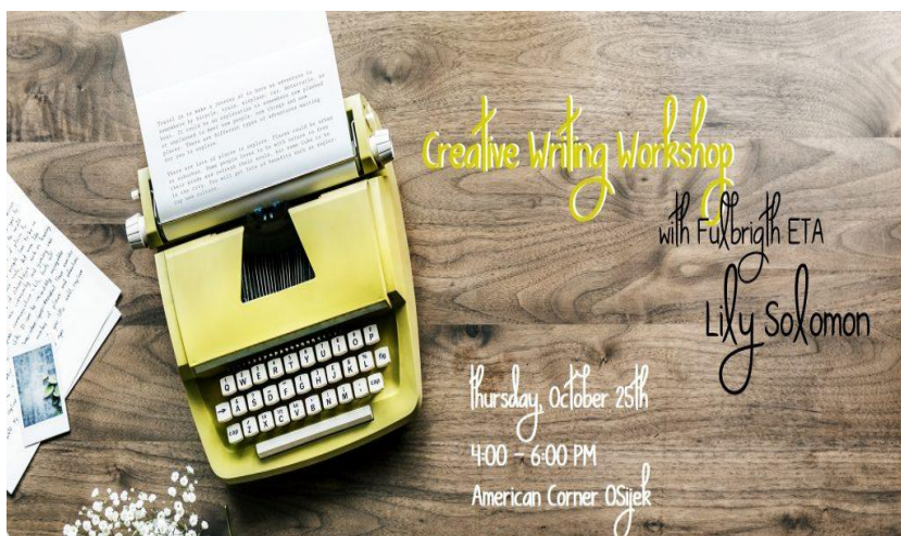
Slika 4. Radionice kreativnog pisanja u Gradskoj i sveučilišnoj knjižnici Osijek

Još jedan primjer dobre prakse je i onaj iz Gradske knjižnice Rijeka. Naime, Udruga 3. zmaj u suradnji s Gradskom knjižnicom Rijeka pokrenula je još jedan krug radionica kreativnog pisanja fantastike, znanstvene fantastike i horora pod nazivom „Fantasy Lab“, namijenjenih dobnoj skupini od 15 do 27 godina, a sudjelovanje na radionici je bilo besplatno. Radionice su se održavale u Dječjem domu u Rijeci od travnja do lipnja 2022. godine. Seminari su se održavali jednom tjedno, a broj prijava je bio ograničen. Radionica je održana više od deset puta pod vodstvom Zorana Krušvara, autora brojnih priča, romana, slikovnica i drugih nagrađivanih tekstova, člana Društva hrvatskih književnika, Hrvatskih samostalnih umjetnika, neformalnih grupa Ri lit i Fluminati kolektiva .