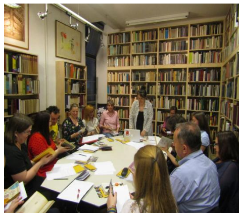
Slike 1.i 2. Radionica kreativnog pisanja „Piči!” - čitaj i piši ” u Gradskoj knjižnici Vladimira Nazora u Zagrebu

Nadalje, primjer projekta koji je proveden 2018. godine je „Vrata nepoznatog”, koji je organizirala Čitaonica i knjižnica grada Daruvara. Ovaj projekt je bio dio međunarodnog projekta "Biti pisac" koji se paralelno provodio u Češkoj, Slovačkoj, Poljskoj i Hrvatskoj, a Čitaonica i knjižnica grada Daruvara bila je jedina knjižnica koja je sudjelovala u ovom projektu. Na kraju svake radionice, šest najboljih radova odabranih na radionici uvršteno je u međunarodne književne zbirke. 32