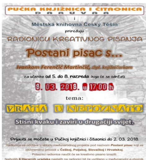
Slika 3. Radionica kreativnog pisanja „Vrata nepoznatog” u čitaonici i knjižnici grada Daruvara

Nadalje, primjer projekta koji je proveden 2018. godine je „Vrata nepoznatog”, koji je organizirala Čitaonica i knjižnica grada Daruvara. Ovaj projekt je bio dio međunarodnog projekta "Biti pisac" koji se paralelno provodio u Češkoj, Slovačkoj, Poljskoj i Hrvatskoj, a Čitaonica i knjižnica grada Daruvara bila je jedina knjižnica koja je sudjelovala u ovom projektu. Na kraju svake radionice, šest najboljih radova odabranih na radionici uvršteno je u međunarodne književne zbirke. 32