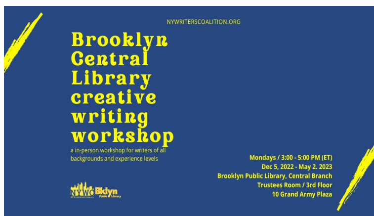
Slika 9. Radionica kreativnog pisanja u Brooklyn Public library

Jacksonville Public library na Floridi organizira niz kreativnih radionica pod nazivom Writer's Lab . Na ovim radionicama, poput Starting Your Memoir , Preparing to Write Your Novel i Graphic Storytelling , sudionici mogu naučiti različite teme vezane uz pisanje i istražiti različite stilove pisanja. Svaka radionica nudi jedinstvene mogućnosti za učenje i razvoj vještina pisanja, omogućujući sudionicima da izaberu stil koji najbolje odgovara njihovim željama i potrebama. 51