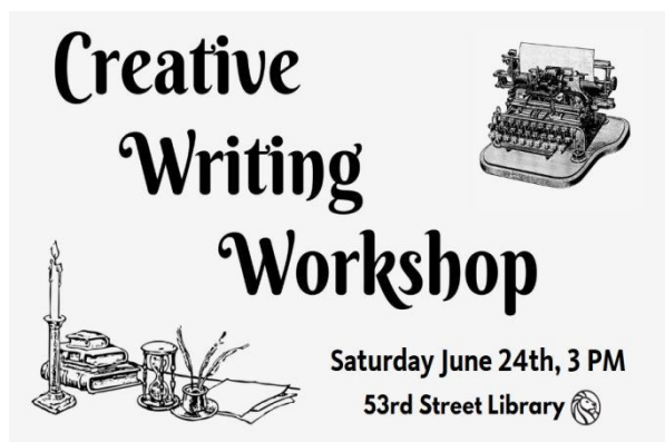
Slika 8. Radionica kreativnog pisanja Art of short story u New York Public Library

Nature Writing Workshop je radionica kreativnog pisanja za odrasle koja potiče sudionike da pronađu inspiraciju u prirodi i okolini, te da razvijaju svoj vlastiti stil pisanja, bilo da se radi o autobiografiji, romanu, kratkoj priči, poeziji ili časopisu. Radionica je dostupna svima koji žele pisati i kreativno se izražavati, bez obzira na prethodno iskustvo, a vodit će je Jon Curley, pjesnik i pisac. New York Public Library organizira različite vrste kreativnih radionica poput ove kako bi potaknuo zajednicu na razvoj kulture i podizanje svijesti o umjetnosti. Knjižnica redovito objavljuje popise novih događaja, programa i radionica kako bi informirala javnost o mogućnostima koje nudi. 49