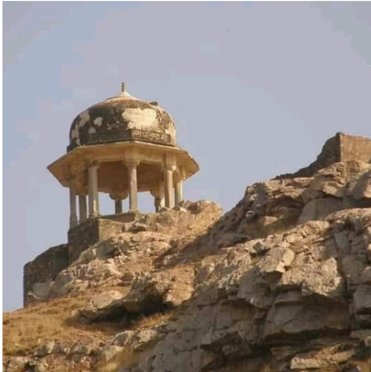
(slika 4 – gore, slika 5 - dolje)