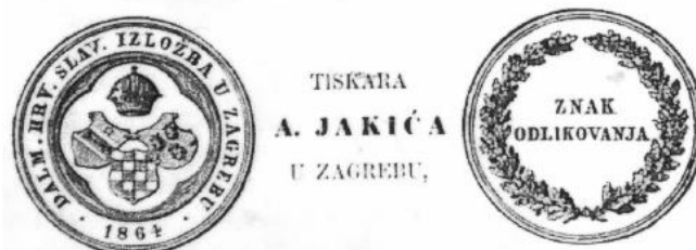
Slika 3. Tiskara Antuna Jakića nagrađena na Izložbi, isječak iz lista Sidro, 24.10.1864.

Na prvoj hrvatskoj izložbi u Zagrebu 1864. srebrnom kolajnom odlikovana