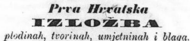
Slika 2. Naslov koji izvještava o Izložbi u Sidru 29.8.1864