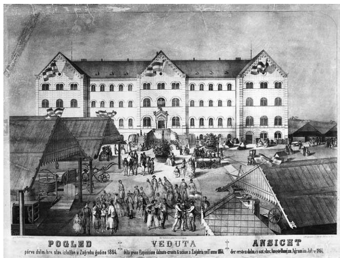
Slika 4. Prikaz Izložbe 1864. godine

listopada navodi da je jednoglasno odlučio brzojavom pozvati I. Mažuranića na otvorenje izložbe. 182 Zašto Mažuranić nije sudjelovao na otvorenju, nije poznato.