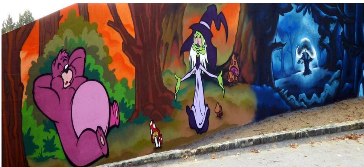
(Slika 13, Centar za obrazovanje mladih "Slava Raškaj"- web prikupljanje:

https://www.facebook.com/hashtag/graffitizagreb/?source=feed_text&epa=HASHTAG )