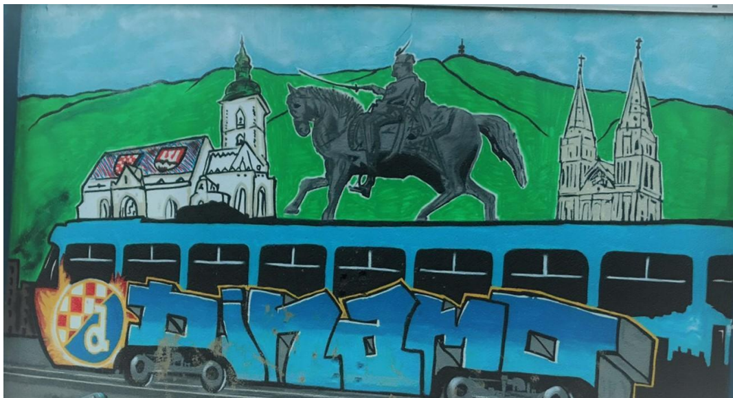
(Slika 51, Savski gaj- prikupljeno fotodokumentacijom)