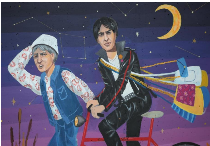
(Slika 21, križanje Bužanove i Kušlanove ulice)

Dvadeseta i dvadeset prva slika prikazuje grafite kulturne serije „Smogovci”. Mural je nastao suradnjom Hrvatskog društva likovnih umjetnika, Zajednice Nakladnika i Knjižara HGK. Autorica murala je Mia Matijević. „Smogovci” su bili dječja humoristična dramska serija koja se emitirala od 1982. do 1997. godine. Grafit na dvadesetoj slici prikazuje petoricu