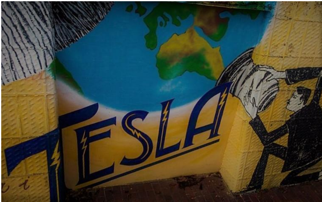
(Slika 11, Gradec- prikupljeno fotodokumentacijom)

ježurku koji luta po šumi, a na jednoj od slika stoji i tekstualni početak priče: „PO ŠUMI, ŠIROM, BEZ STAZE, PUTA, JEŽURKA JEŽIĆ POVAZDAN LUTA.” Ježevu kućicu napisao je bosanskohercegovački autor Branko Ćopić. Knjiga je u Hrvatskoj izdana 1950. godine te je nedugo nakon toga uvrštena u osnovnoškolsku lektiru. Iako je jedno vrijeme bila izbačena s popisa, nakon Domovinskog rata, danas je priča o hrabrom lovcu Ježurki Ježiću, neizostavan dio djetinjstva svakog djeteta ovog podneblja. Ova priča, iako je svoj početak doživjela u vrijeme Jugoslavije, ostala je kulturno i tradicionalno vezana za hrvatsku kulturu. Normalna je i očekivana pojava da se nakon emancipacije, Hrvatska odrekla mnogih tradicija i običaja koje su dijelili s drugim narodima u vrijeme Jugoslavije, no to ne znači da ti običaji i tradicije ne žive i dalje u srcima ljudi koji su ih doživjeli i smatraju ih svojim. Upravo jedna takva tradicija je Ježeva kućica, koju su čitali, slušali i izvodili naše bake i djedovi, roditelji i naposljetku i mi sami.