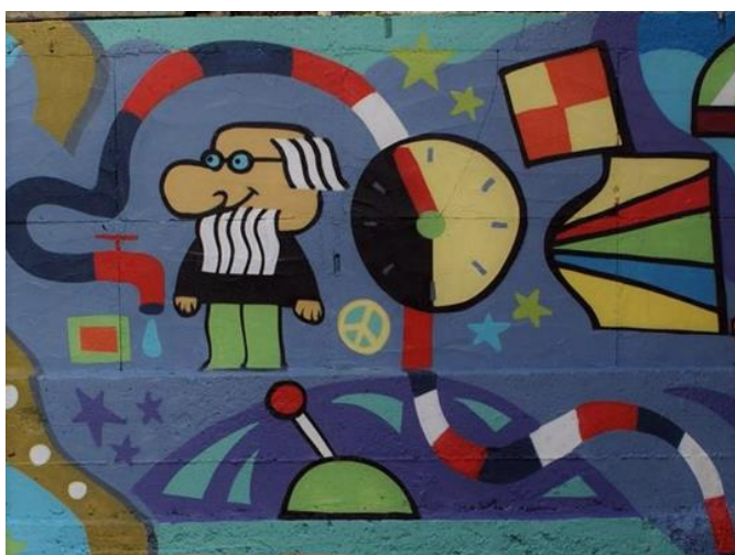
(Slika 31, Gračani - prikupljeno fotodokumentacijom)