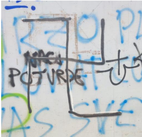
(Slika 2, Siget- prikupljeno fotodokumentacijom)

Druga analizirana slika je simbolički grafit svastike. Ovaj grafit osvanuo je u novozagrebačkom kvartu Siget. Spada u negativni nacionalistički grafit. Simbol svastike nosio se u ime diskriminacije, mržnje, nasilja i genocida, te se i danas povezuje s nacistički nastrojenim uvjerenjima, zakonom i društveno-politički je sankcioniran.