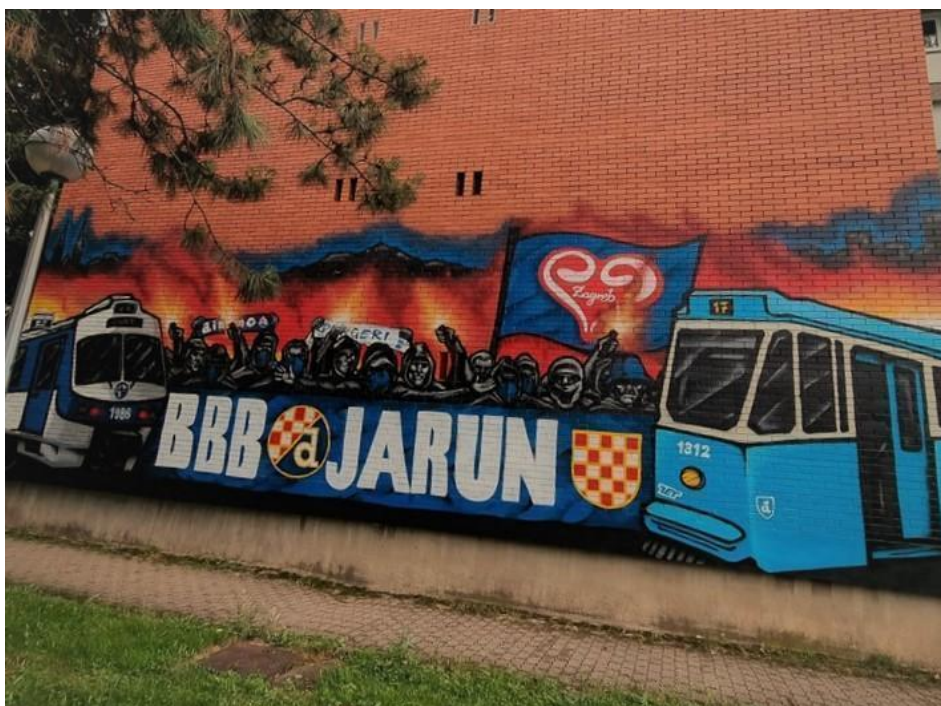
(Slika 45, Jarun- prikupljeno fotodokumentacijom)

Na Jarunu nalazi se slikovno-tekstualno-simbolički grafit koji prikazuje navijače skupine BBB u radikalnom i agresivnom kontekstu (kapuljače, maske, baklje...) (slika 45). Natpis „JARUN“ obilježava kvart iz kojeg dolaze, sa strane su slike tipičnog zagrebačkog tramvaja i vlaka. Ovaj grafit slavi pobunu i naglašava ponos onim aspektima navijačkih rituala, koji se smatraju društveno nekorektnim.