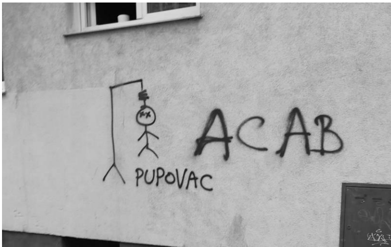
(Slika 3, Slovenska ulica)

Druga analizirana slika je simbolički grafit svastike. Ovaj grafit osvanuo je u novozagrebačkom kvartu Siget. Spada u negativni nacionalistički grafit. Simbol svastike nosio se u ime diskriminacije, mržnje, nasilja i genocida, te se i danas povezuje s nacistički nastrojenim uvjerenjima, zakonom i društveno-politički je sankcioniran.