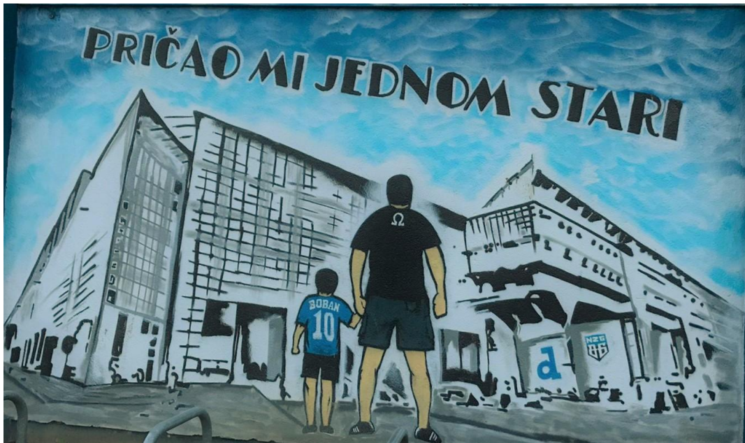
(Slika 50, Savski gaj - prikupljeno fotodokumentacijom)

Grafit koji se nalazi u Dugavama, slikovno-tekstualne je kategorije i prikazuje licitarsko srce, simbol Zagreba i zagrebačkih običaja i tradicija (slika 48). Ovaj grafit je navijački jer su ga napravili članovi BBB skupine, a to je naglašeno plavom bojom koja je pozadina i kojom je ofarban cijeli stup.