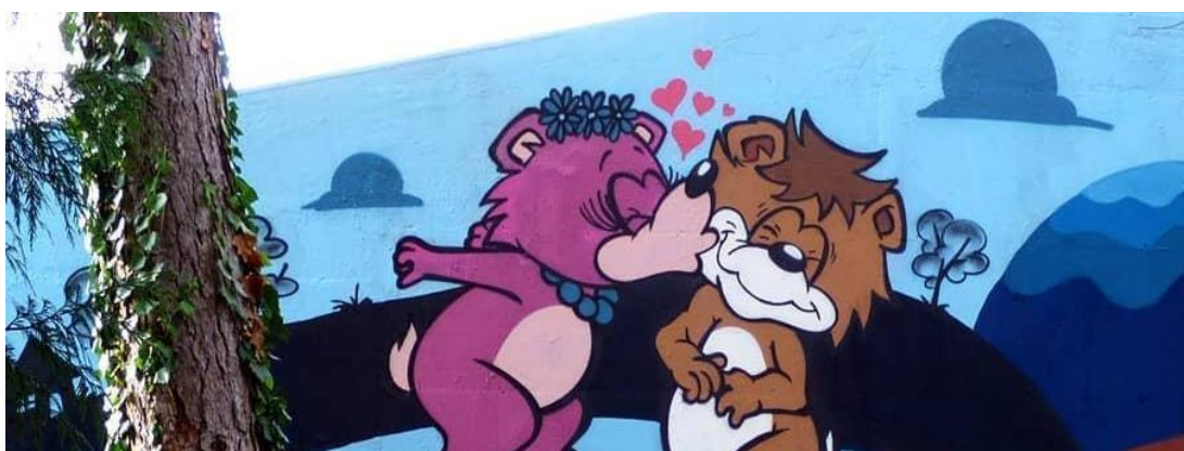
(Slika 14, Centar za obrazovanje mladih "Slava Raškaj"- web prikupljanje:

https://www.facebook.com/hashtag/graffitizagreb/?source=feed_text&epa=HASHTAG )