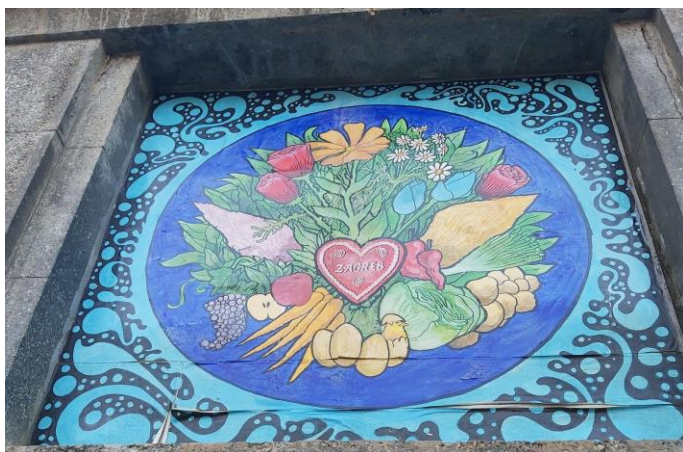
(Slika 7, Dolac- prikupljeno fotodokumentacijom)

Na zgradi Cibone (slika 6) nalazi se tekstualno-slikovni grafit hrvatskog košarkaša Dražena Petrovića. Dražen Petrović bio je jedan od najvećih hrvatskih i svjetskih košarkaša. Preminuo je mlad na vrhuncu svoje karijere te tako postao i ostao jedan od simbola hrvatskog sporta. Autor/ica grafita nepoznat/a.