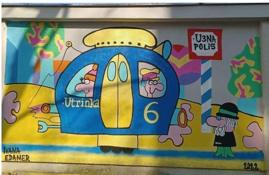
(Slika 25 i 26, Utrine- web prikupljanje:

https://m.facebook.com/vmo.utrine/photos/pcb.4726813294104976/4726812620771710/ )