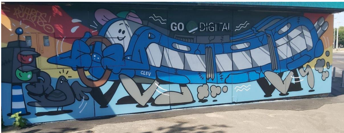
(Slika 22, Avenija Dubrovnik 46- prikupljeno fotodokumentacijom)

braće, „Drageca Vrageca”, „Peru Vrageca”, „Mazala Vrageca”, „Cobru Vrageca” i „Bucu Vrageca”, a grafit na dvadeset prvoj slici prikazuje legendarni dvojac „Crnog Đeka” i „Kumpića”. Serija je tematizirala život velike zagrebačke obitelji Vragec i pratila je pustolovine šestorice braće koji su se morali snalaziti sami. Serija je napravljena po istoimenoj knjizi Hrvoja Hitreca. Svih šest sezona serija je uživala veliku popularnost te je ostala zapamćena kao simbol hrvatske književne i filmske umjetnosti. Grafit spada u kategoriju iskazivanja nacionalizma/patriotizma kroz grafite jer slavi hrvatsko stvaralaštvo i simbolizira zagrebački način života, koji su „Smogovci“ vjerodostojno dočarali.