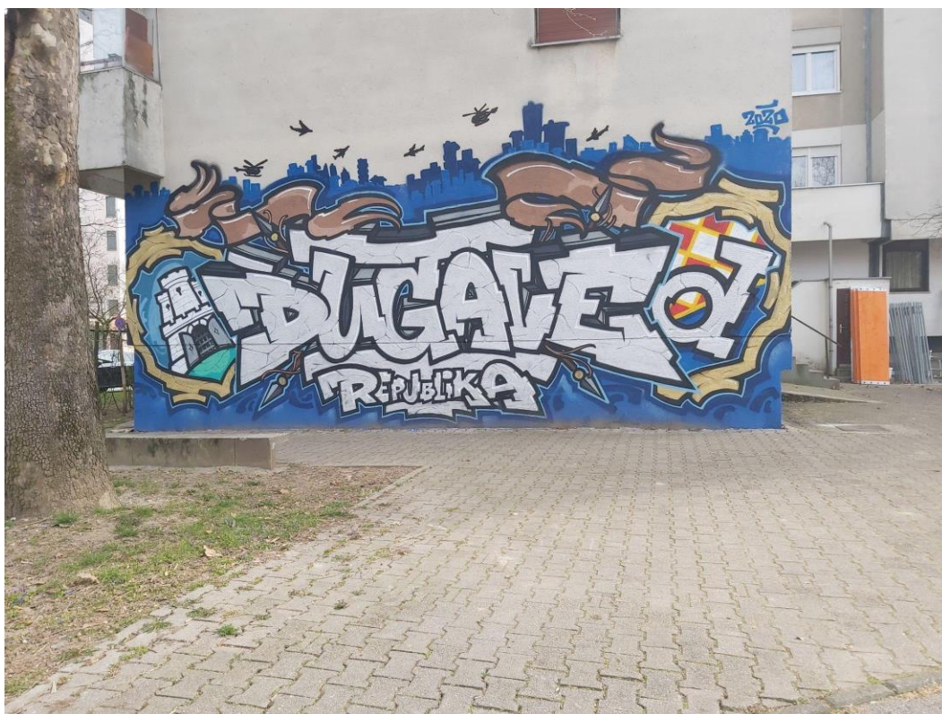
(Slika 42, Dugave- prikupljeno fotodokumentacijom)

Grafit koji se nalazi u Dugavama, spada u tekstualno-simboličko-slikovnu kategoriju (slika 42). Sam tekst koji definira Dugave kao republiku, naglašava izdvajanje svojeg kvarta iznad drugih, da tvoj kvart ima posebna pravila i da odgovara sam sebi. Koplja, avioni i helikopteri koji lete iznad nebodera, simboliziraju pobunu, nasilje i nered.