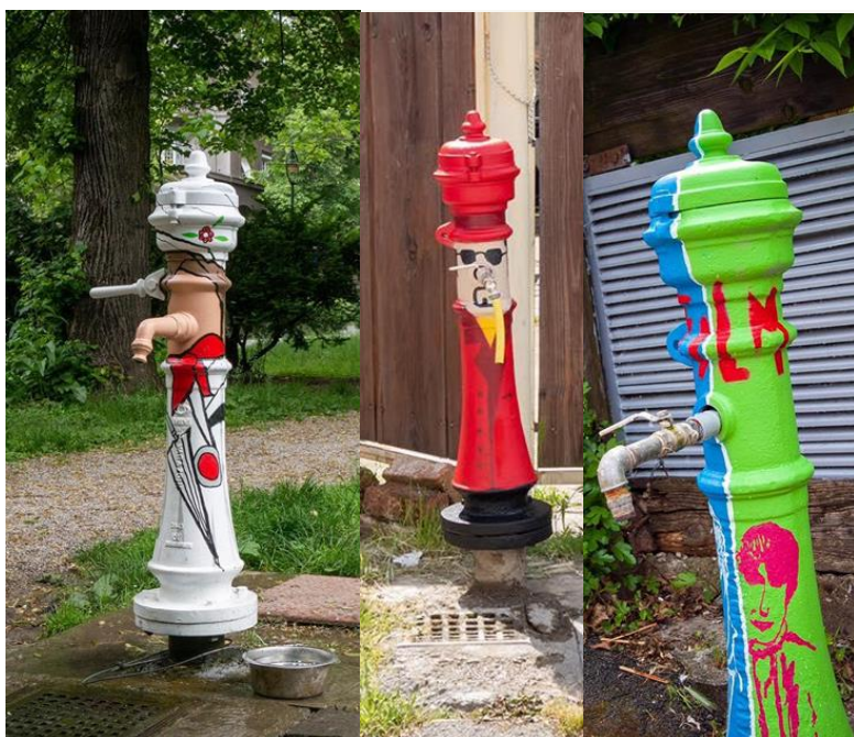
(Slike 37, 38 i 39, Trg kralja Petra Krešimira, Radonjska ulica, Plitvička ulica)

Mural koji se nalazi na Volovčici, nastao je suradnjom „City Centra One” i ekipom iz kolektiva „Graffiti na gradele”. Na izradi sudjelovali su poznati grafiteri „Chez” i „Sarme”. Mural prikazuje šaroliku sliku drveta iz kojeg vire razni likovi i predmeti. Dva takva lika su stilizirani, plavi zagrebački tramvaji.