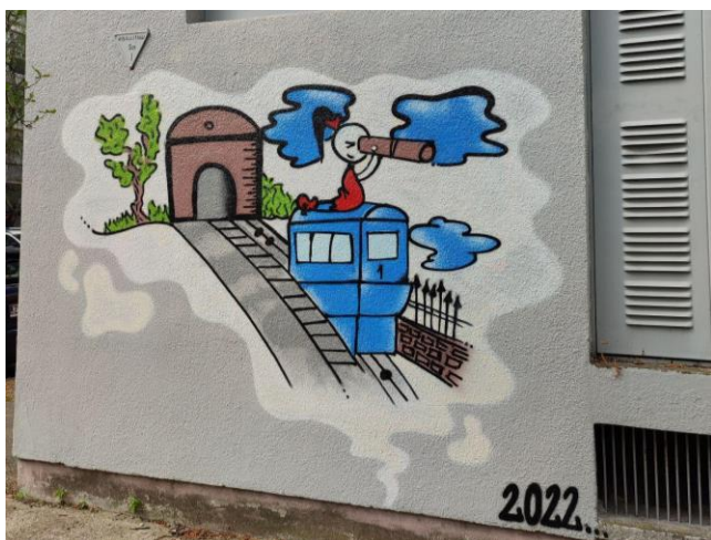
(Slika 24, Utrine- prikupljeno fotodokumentacijom)