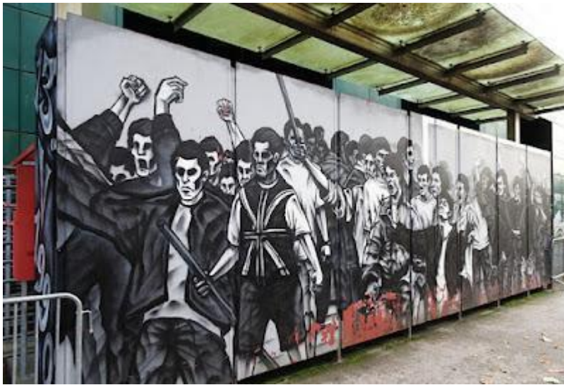
(Slika 44, Dinamov stadion, Maksimir)

Četrdeset treći grafit još je jedan primjer radikalnijeg navijačkog nacionalizma. Grafit se nalazi na zidu kod Tržnice Utrine i spada u slikovno-simboličku kategoriju grafita. Prikazuje navijače, koji razbijaju, pale baklje, vijore zastavom i drže dva velika buldoga koji stoje u obrambenom stavu. Iza silueta navijača stoji stilizirani grad Zagreb, tri nebodera, tipični zagrebački tramvaj, ulični sat i prevrnuti auto. Vidi se da u gradu vlada nemir, sve je u dimu i prašini. Slika simbolizira nered, nasilje i nadmoć Dinama, pokušava se naglasiti da Dinamo ima svoja pravila i slobodu te da navijači odgovaraju samo njemu.