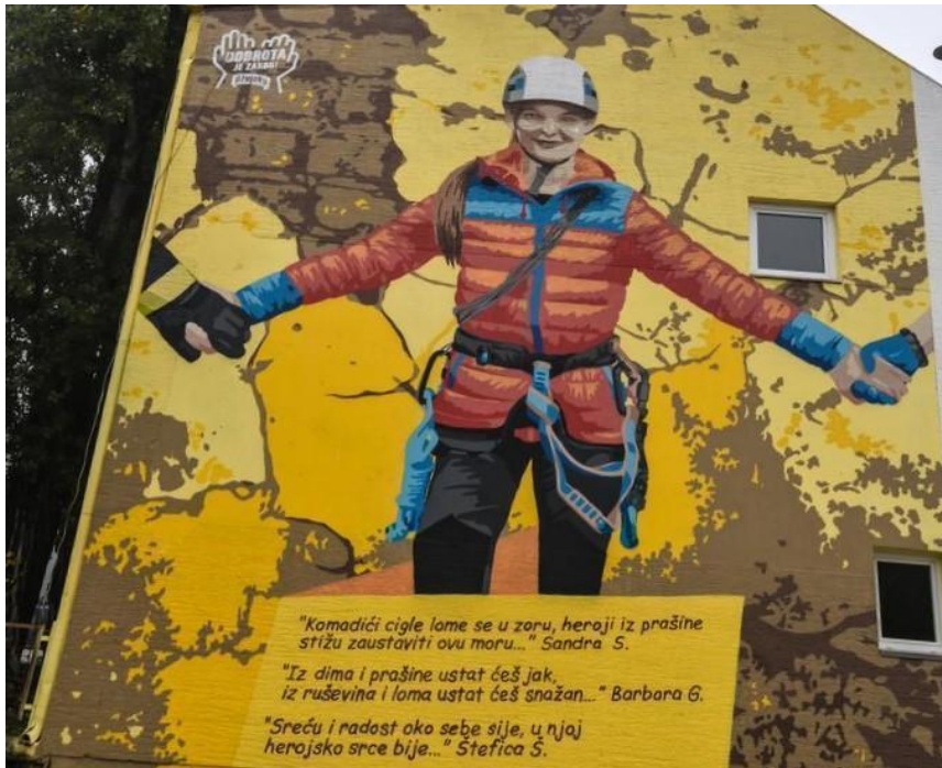
(Slika 5, Savska ulica 160- prikupljeno fotodokumentacijom)

Peta slika prikazuje tekstualno - slikovni grafit alpinistice koji je nastao kao suradnja „Ožujskog piva”, „Grafitna na gradele” i „Dostave zvuka”, koji su u sklopu projekta „Murale za junake” naslikani u tri grada: Osijeku, Zagrebu i Splitu. Ta tri grafita, na kojima su prikazani liječnica, vatrogasac i alpinistica, predstavljaju zahvalu i slavljenje hrvatskih junaka koji su pomagali za vrijeme pandemije i potresa te su stoga grafiti pozitivnog nacionalizma.