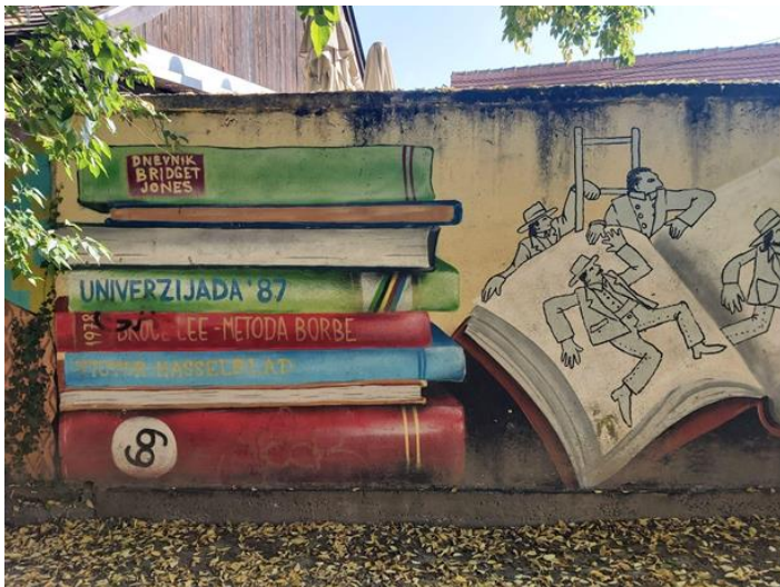
(Slika 27, Park Opatovina- prikupljeno fotodokumentacijom)

Grafit iz Utrina, prikazuje stiliziranu promatračicu koja sjedi na zagrebačkoj uspinjači, javno prometalo koje spaja Gornji grad Zagreba i Donji grad Zagreba (slika 24). Zagrebačka uspinjača ima dugu povijest i tradiciju te je postala simbol Zagreba i njegove prošlosti. Druga dva Utrinska grafita prikazuju likove iz animirane serije „Profesor Baltazar” (slika 25 i 26). Grafit na 26. slici ima i natpise „Utrinka” i „U3NAPOLIS”, koji predstavljaju kvart Utrine. Ovi grafiti nastali su kao dio projekta Mjesnog odbora Utrine, a autorica je Ivana Edamer.