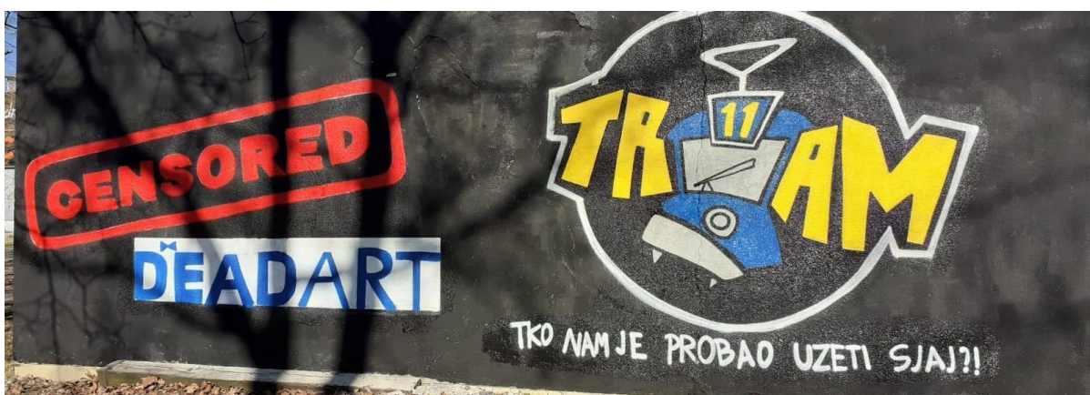
(Slika 47, Vukovarska ulica)

Četrdeset šesti navijački grafit je tekstualno-simboličke kategorije i nalazi se u Sopotu (slika 46). Crna boja koja je podloga ovog grafita, općenito simbolizira, više od plave boje, u krugovima BBB radikalniju struju. Na grafitu piše: „ZAGREB A GENUINE RIOT BRAND, NKDZ” ( ZAGREB ISTINSKA MARKA POBUNE, NKDZ), NKDZ stoji kao kratica za „Nogometni klub Dinamo Zagreb”. Iznad natpisa stoji stilizirani simbol grba Zagreba. Natpis doslovno predstavlja Zagreb i njegove navijače kao pobunjenike.