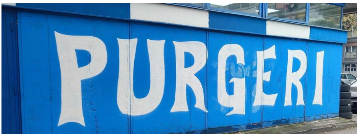
(Slika 54, Zapruđe- prikupljeno fotodokumentacijom)

Grafit na pedeset trećoj slici je slikovno-simbolički grafit posvećen Cici Kranjčaru. Zlatko „Cico” Kranjčar bio je hrvatski nogometaš i trener, koji je preminuo 2021. godine. Ovaj grafit može budi pozitivna sjećanja i osjećaje za nacionalni sport.