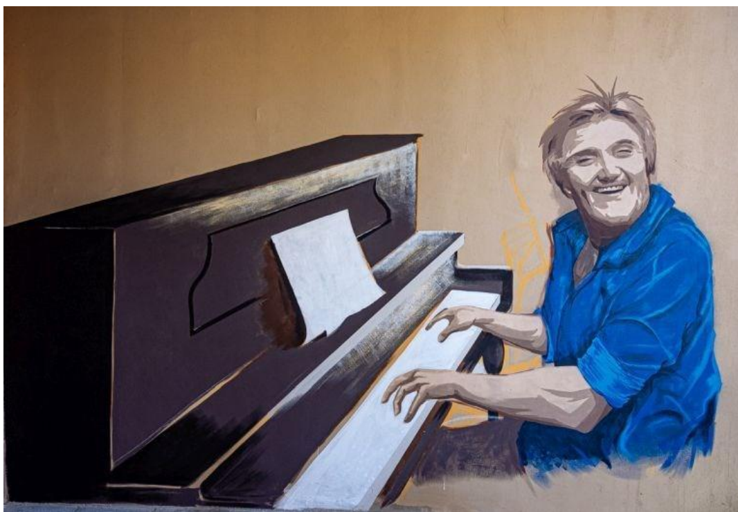
(Slika 19, Ravnice.)

Na devetnaestoj slici nalazi se slikovni grafit Rajka Dujmića koji je osvanuo u kvartu Ravnice, autor/ica nepoznat/a. Na slici je prikazan Rajko Dujmić, voditelj kulnog sastava „Novi fosili” i poznati hrvatski glazbenik i skladatelj, kako svira klavir. „Novi fosili” bili su jedan od najpopularnijih sastava 1970-ih i 1980-ih godina. Mnoge njihove pjesme ostale su simboli hrvatske pop glazbene scene. Ovaj grafit je nastao kao komemoracija nakon što je Rajko Dujmić preminuo 2020. godine. Grafit predstavlja slavlje i ponos nacionalnim bendom koji je donio mnoštvo nezaboravnih pjesama, te se ovaj grafit stoga smješta u kategoriju iskazivanja nacionalizma/patriotizma kroz grafite.