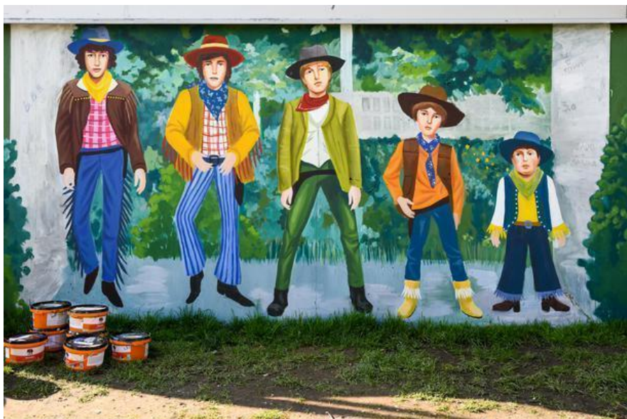
(Slika 20, križanje Bužanove i Kušlanove ulice)