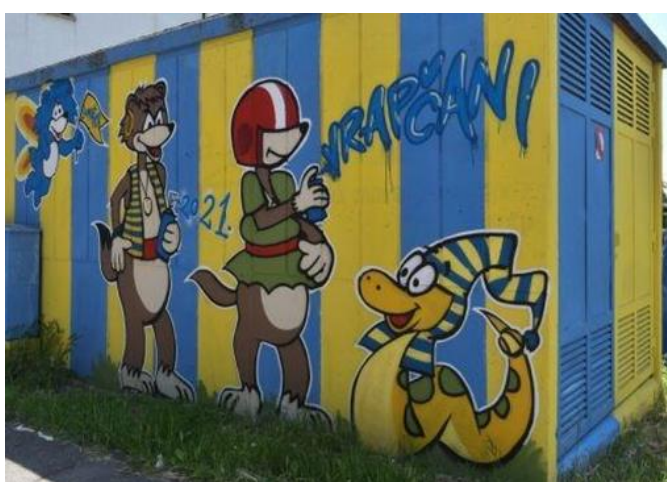
(Slika 32, Vrapče)