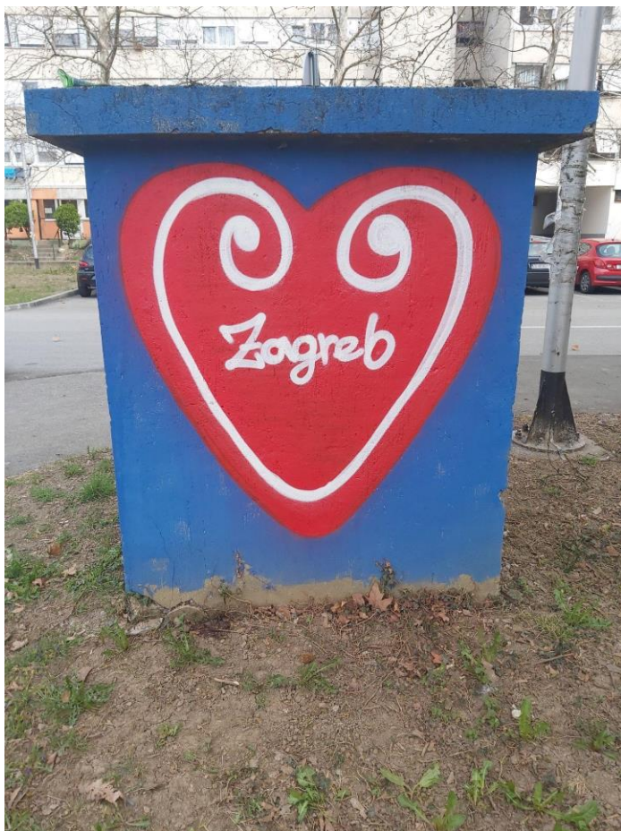
(Slika 48, Dugave - prikupljeno fotodokumentacijom)

Grafit iz novozaagrebačkog kvarta Dugave (slika 47), prikazuje logo hrvatskog rap sastava „Tram 11”, ako znamo što članovi grupe zastupaju te poslušamo stihove, vidjet ćemo da su puni govora mržnje i stavova koji isključuju druge nacije i društvene grupe. Otvoreno iznose homofobne, mizogine, šovinističke, rasističke i srbofobne izjave i stavove. „ Fašisti, komunisti na odstrelnoj listi isti, tobožnji pacifisti u biti su antikristi. Na čelu ti petokraka, u oku dugine boje, u koliko si udruga što milijarda kuna broje, puši k...c Titu malo Kastru, ko Danka partizanka provaljuješ na terasu... “ (mnoge su razbjesnili stihovi s novog albuma Tram 11, 2022). Grafit je otvoreno negativan, jer izražava mržnju i prijetnju prema diskografskoj kući „Menart” koja je raskinula ugovor s grupom „Tram 11” radi govora mržnje.