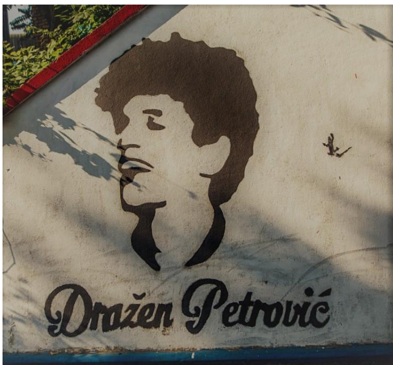
(Slika 6, Cibona- prikupljeno fotodokumentacijom)

Na zgradi Cibone (slika 6) nalazi se tekstualno-slikovni grafit hrvatskog košarkaša Dražena Petrovića. Dražen Petrović bio je jedan od najvećih hrvatskih i svjetskih košarkaša. Preminuo je mlad na vrhuncu svoje karijere te tako postao i ostao jedan od simbola hrvatskog sporta. Autor/ica grafita nepoznat/a.