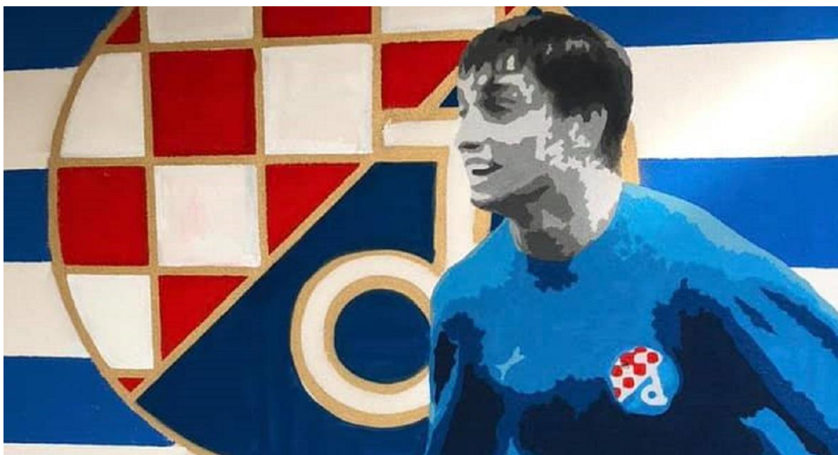
(Slika 53, Maksimir )

Grafit na pedeset trećoj slici je slikovno-simbolički grafit posvećen Cici Kranjčaru. Zlatko „Cico” Kranjčar bio je hrvatski nogometaš i trener, koji je preminuo 2021. godine. Ovaj grafit može budi pozitivna sjećanja i osjećaje za nacionalni sport.