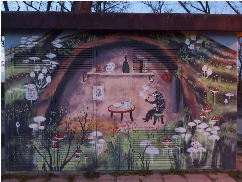
(Slika 9, BundeK- prikupljeno fotodokumentacijom)