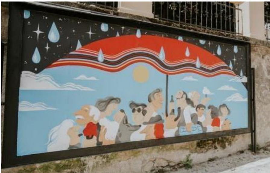
(Slika 17, Radićeva)

filma „Tko pjeva zlo ne misli”, „gospodin Fulir” i „Franjo Šafranek”. „Tko pjeva zlo ne misli” je najgledaniji hrvatski film koji je izašao 1970. godine, žanrovski spada u ljubavnu komediju s pjevanjem. Mjesto radnje filma je grad Zagreb u svojem punom sjaju 70-ih godina, Maksimir, kupalište na Savi itd. Film odlično prikazuje staro vrijeme, kulturu i običaje Zagreba, stoga gospodin Fulir i Franjo Šafranek na ovom grafitu upravo simboliziraju stara vremena i kulturu hrvatske nacije. Osim njih na slici su prikazani i stari zagrebački tramvaj, katedrala i uspinjača, također jedinstvenosti grada i njegove prošlosti. Između slika velikim slovima je napisan tekst „PARIZ NEMA KAJ TI IMASŠ”. Na slovu i nalazi se umjesto točke, oblik stiliziranog srca, koje simbolizira ljubav. Tekst naglašava vrijednost Zagreba i Hrvatske, uspoređujući je s Parizom. Ovaj grafit spada u patriotizam jer stoji kao spomen Zagrebu i njegovim vrijednostima.