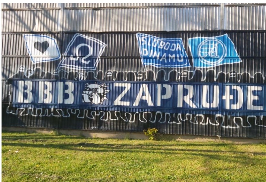
(Slika 41, Baburičina, Zapruđe- prikupljeno fotodokumentacijom)

Idućih 13 grafita su dio prikupljenih uzoraka koji najbolje predstavljaju kategoriju navijačkih grafita kao simboličkog prostora iskazivanja nacionalnog.