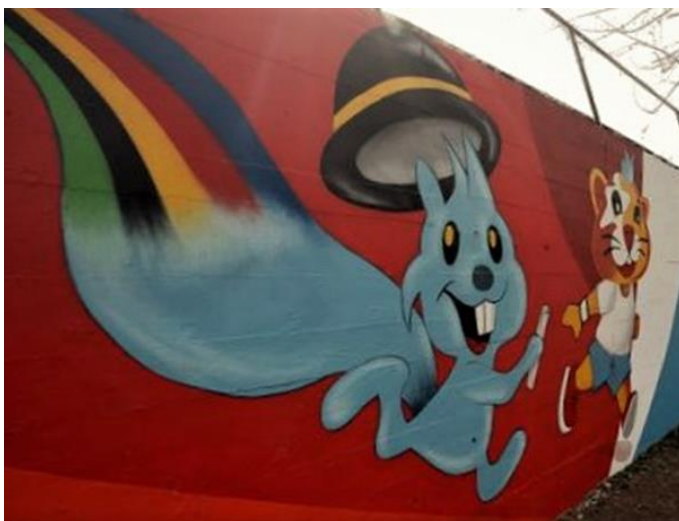
(Slika 28, Jarunska- prikupljeno fotodokumentacijom)

Grafit u parku Opatovina (slika 27) prikazuje, na jednom svojem dijelu, hrpu knjiga na kojima je jedan od naslova: „UNIVERZIJADA ‘87’”. Slika prikazuje samo dio velikog grafita