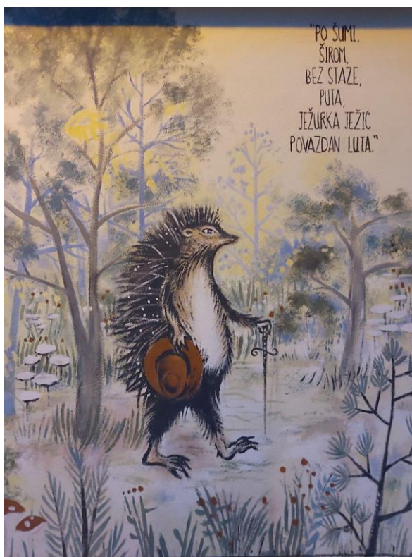
(Slika 10, BundeK- prikupljeno fotodokumentacijom)

Grafit koji prikazuje dijelove poznate priče za djecu „Ježeva kućica”(slika 9 i 10), spada u slikovno-tekstualnu kategoriju. Mural je nastao povodom 70. rođendana „Ježeve kućice”, a naslikala ga je mlada umjetnica Lora Elezović. Grafiti prikazuju ježurku u svojem domu te