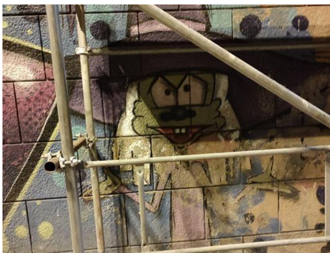
(Slika 30. Močvara - prikupljeno fotodokumentacijom)