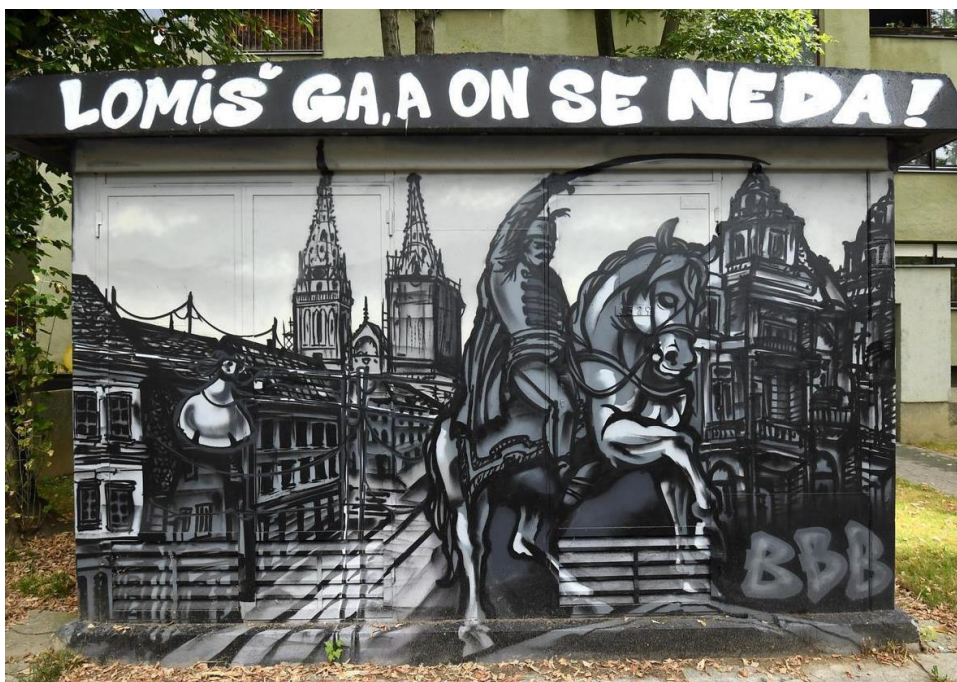
(Slika 52, Jarun- web prikupljanje: https://www.telegram.hr/fotogalerije/zivot/na-jarunu-se-pojavio-dirljiv-grafit-posvecen-je-danu-kad-je-zagreb-prezivio-potres/ )

Grafit trideset dva, prikazuje zagrebački tramvaj, kip Josipa Bana Jelačića i katedralu, simbole kojima se slave pozitivne strane grada Zagreba i tradicije nogometa i naše nogometne nacije.