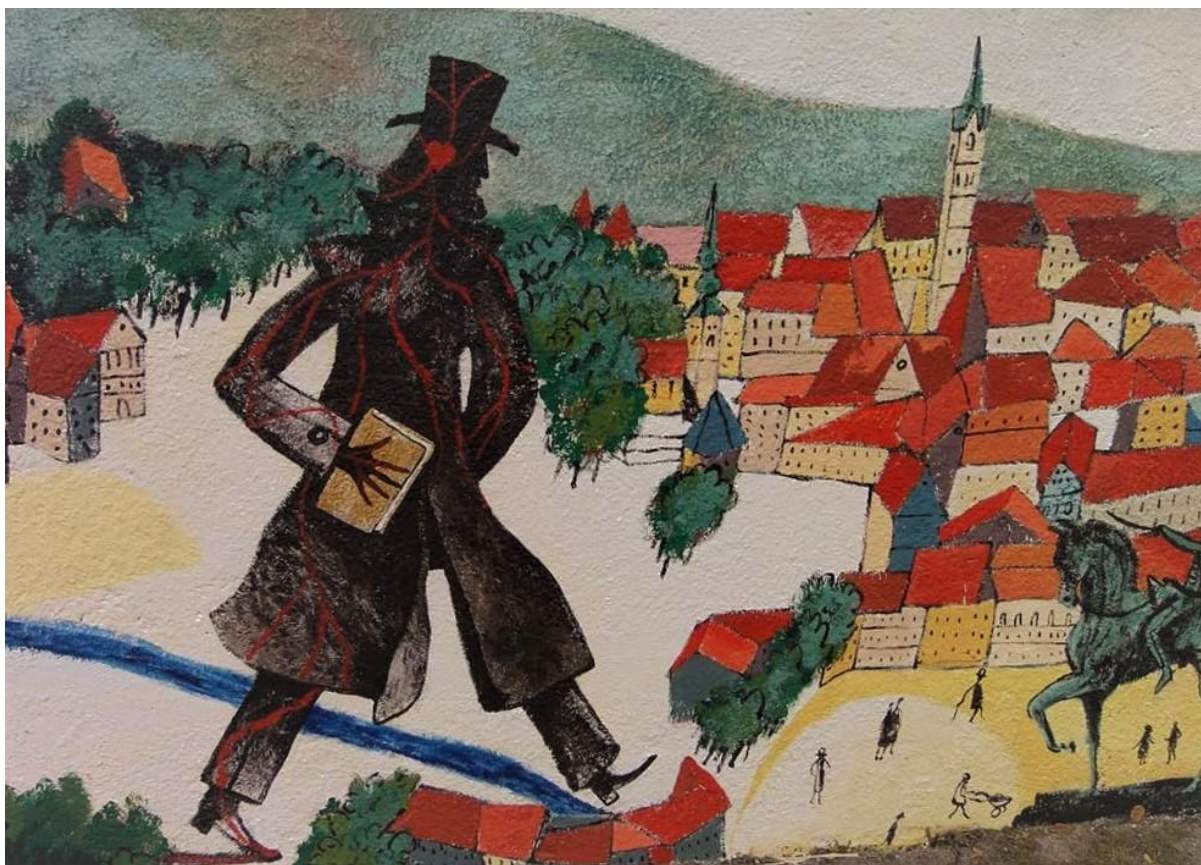
(Slika 18, Ul. Ive Mallina 27, kuća Šenoa- web prikupljanje: https://travelhonestly.com/zagreb-street-murals/ )

Grafit autora Dominika Vukovića, koji se nalazi u ulici Ive Mallina je slikovni grafit koji prikazuje stiliziranog Augusta Šenou kako šee gradom Zagrebom (slika 18). Na slici se vide kućice grada i kip Josipa Bana Jelačića, jedan od simbola Zagreba. Šenoa je umjetnički nacrtan kao crna silueta, veća od svih drugih, koja hoda po Zagrebu i u ruci drži knjigu. August Šenoa bio je hrvatski pisac, pjesnik i pripovjedač, jedan je od najutjecajnijih pisaca devetnaestog stoljeća te ga se čak i smatra jednim od pisaca koji su postavili temelje moderne hrvatske književnosti. Grafit simbolizira njegovo stvaralaštvo, koje je nadahnuto životom u Zagrebu i zagrebačkim ulicama. Ovaj patriotski grafit stoji kao simbol ponosa i slavlja hrvatskih pisaca.