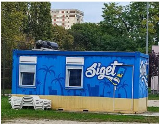
(slika 29, Siget- prikupljeno fotodokumentacijom)

književnog lika „Gullivera” koji je nastao u sklopu projekta „Riši Briši”, a oslikali su ga Boris Bare i Dominik Vuković. Grafit na dvadeset osmoj slici prikazuje crtež „Zagija” i „Hrkija”, koje je naslikala ekipa iz „Pimp my pump” u sklopu Europskih sveučilišnih igara 2016. godine. Zagi je bio maskota Univerzijade koja se održala u Zagrebu 1987. godine. Univerzijada je međunarodno studentsko natjecanje u sportu, bio je to veliki događaj u kojem su sudjelovali mnogi sportaši. Tadašnja maskota je bio dugovječno zapamćena plava vjeverica „Zagi”, koja je postala svojevrsni simbol univerzijade, sporta i zajedništva. Zagijev nasljednik je maskota Europskih sveučilišnih igara, hrčak „Hrki”.