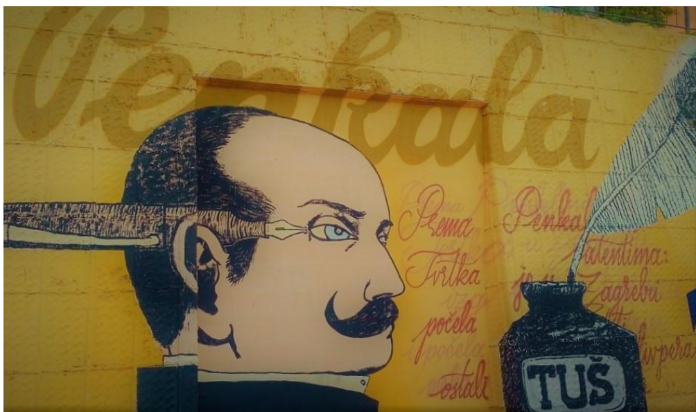
(Slika 12, Gradec- prikupljeno fotodokumentacijom)

Grafit na Gradecu je slikovno- tekstualno-simboličke kategorije i prikazuje dva izumitelja i inženjera koji su imali veze s Hrvatskom, Nikolu Teslu (slika 11) i Eduarda Slavoljuba Penkalu (slika 14). Ovi grafiti nastali su kao kolaboracija trojice umjetnika, „Modula 8”, „Bareta” i „Dominga”. Na dvanaestoj slici prikazan je Tesla, veliki izumitelj koji je radio i živio u Americi, rođen u hrvatskom selu Smiljan. Na grafitu je ispisano njegovo ime „TESLA“, koje je ukrašeno malim munjama koje služe kao simbol elektrotehnike kojom se bavio. Na četrnaestoj slici je grafit u spomen Eduarda Slavoljuba Penkale, koji nije bio hrvatskog podrijetla, ali je živio i radio u Hrvatskoj. Grafit prikazuje stiliziranu sliku Penkale, nalivpero, tintu i pero za pisanje, koji simboliziraju njegove izume, mehaničku olovku i nalivpero. Ovaj grafit koji slavi dva izumitelja, pozitivnog nacionalističkog je karaktera jer slavi, ponosi se i naglašava vrijednost postignuća pojedinaca koji su imali veze s Hrvatskom.