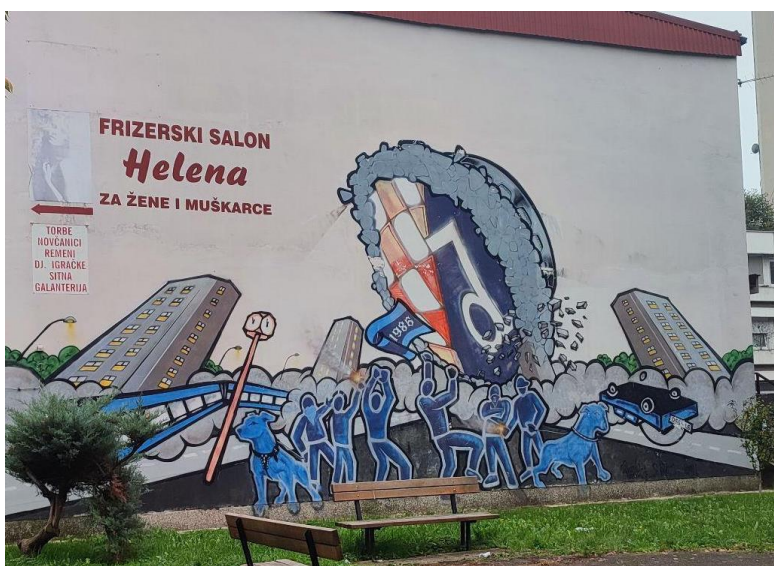
(Slika 43, Tržnica Utrine- prikupljeno fotodokumentacijom)

Grafit koji se nalazi u Dugavama, spada u tekstualno-simboličko-slikovnu kategoriju (slika 42). Sam tekst koji definira Dugave kao republiku, naglašava izdvajanje svojeg kvarta iznad drugih, da tvoj kvart ima posebna pravila i da odgovara sam sebi. Koplja, avioni i helikopteri koji lete iznad nebodera, simboliziraju pobunu, nasilje i nered.