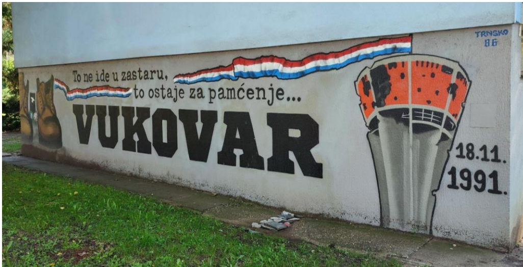
(Slika 4, Trnsko- prikupljeno fotodokumentacijom)

Idućih 37 grafita su dio prikupljenih uzoraka koji najbolje predstavljaju kategoriju iskazivanja nacionalizma/patriotizma kroz grafite.