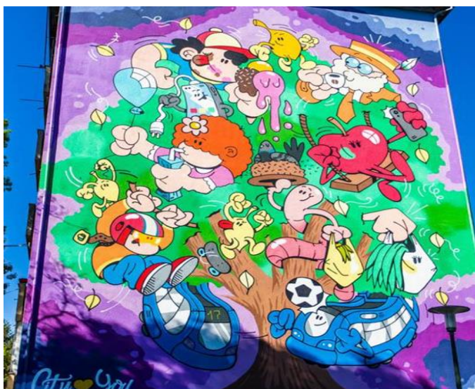
(Slika 36, Volovčica- web prikupljanje: https://fotografijezagreba.hr/mural-nastao-suradnjom-city-center-zagreb-centra-i-kolektiva-graffiti-na-gradele/ )

Mural koji se nalazi na Volovčici, nastao je suradnjom „City Centra One” i ekipom iz kolektiva „Graffiti na gradele”. Na izradi sudjelovali su poznati grafiteri „Chez” i „Sarme”. Mural prikazuje šaroliku sliku drveta iz kojeg vire razni likovi i predmeti. Dva takva lika su stilizirani, plavi zagrebački tramvaji.