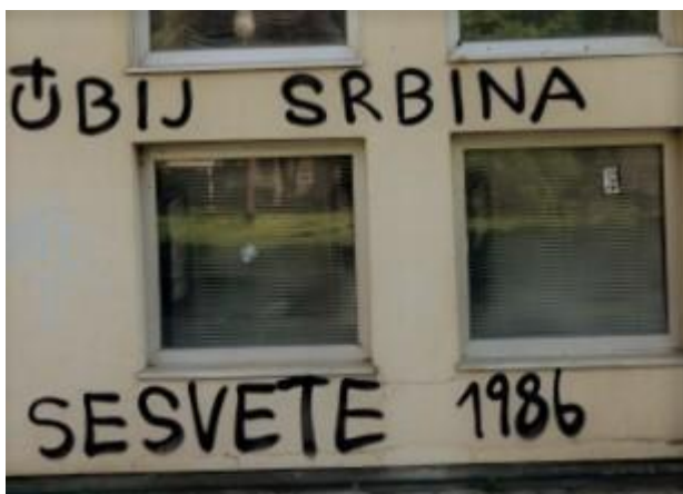
(Slika 1, Sesvete- prikupljanje fotodokumentacijom)

Iduća tri primjera predstavljaju kategoriju iskazivanja šovinističkog neprijateljstva/mržnje prema Drugome kroz grafite.