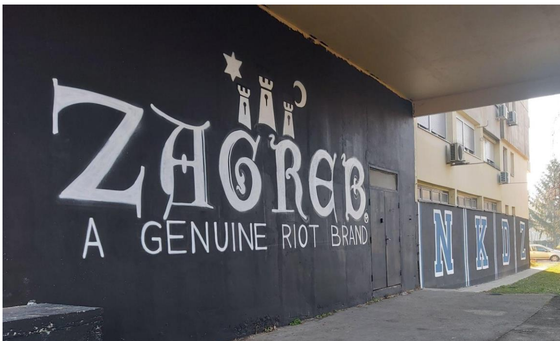
(Slika 46, Sopot- prikupljeno fotodokumentacijom)

Četrdeset šesti navijački grafit je tekstualno-simboličke kategorije i nalazi se u Sopotu (slika 46). Crna boja koja je podloga ovog grafita, općenito simbolizira, više od plave boje, u krugovima BBB radikalniju struju. Na grafitu piše: „ZAGREB A GENUINE RIOT BRAND, NKDZ” ( ZAGREB ISTINSKA MARKA POBUNE, NKDZ), NKDZ stoji kao kratica za „Nogometni klub Dinamo Zagreb”. Iznad natpisa stoji stilizirani simbol grba Zagreba. Natpis doslovno predstavlja Zagreb i njegove navijače kao pobunjenike.