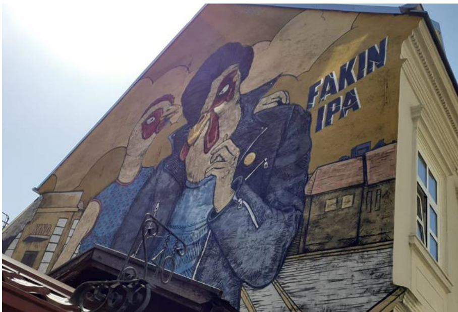
(Slika 34, Tkalčičeva- prikupljeno fotodokumentacijom)

Slike trideset tri i trideset četiri prikazuju dva grafita koja se nalaze u Tkalčičevoj ulici. Jedan poziva na zagrebačko ljeto, prikazujući nekad popularno kupalište na rijeci Savi. Grafit je