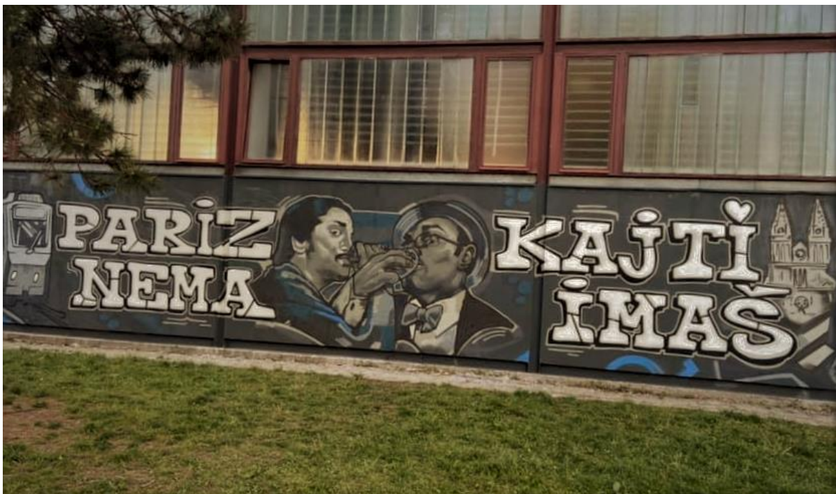
(Slika 16, Osnovna škola Dugave- prikupljeno fotodokumentacijom)

Na trinaestoj, četrnaestoj i petnaestoj slici prikazan je slikovni grafit koji je dio dvorišta Centra za obrazovanje mladih „Slava Raškaj”. Ovaj grafit proteže se velikim zidom i sastoji se od više prikazanih likova iz starih crtića koje je izdala kuća animiranog filma „Zagreb film”. Grafit na trinaestoj slici prikazuje crteže „Štapića” i medvjeda „Mate” iz dugometražnog crtića „Čudesna šuma” koji je izašao 1986. godine te je uživao veliku popularnost. Na četrnaestoj slici prikazani su „Joško” i „Jasmina”, leteći medvjedići koji spašavaju šumu od ljudske ruke, likovi iz popularne animirane serije, koja je prodana u više od 100 država te je svoju veliku slavu zadržala i nakon prikazivanja 1991. godine. Posljednja petnaesta slika prikazuje grafit profesora Baltazara, glavnog lika iz istoimene animirane serije „Profesor Baltazar”. Profesor Baltazar je simpatični znanstvenik koji se brine o svojim sugrađanima i rješava njihove probleme. Sva tri djela, posebice profesor Baltazar, ostala su simboli hrvatskog stvaralaštva i animirane umjetnosti. Dan danas ti crtići se gledaju i žive u našim srcima kao podsjetnik na našu kulturu i stvaralaštvo, zato ovaj grafit kategorijski spada u iskazivanje nacionalizma/patriotizma kroz grafite.