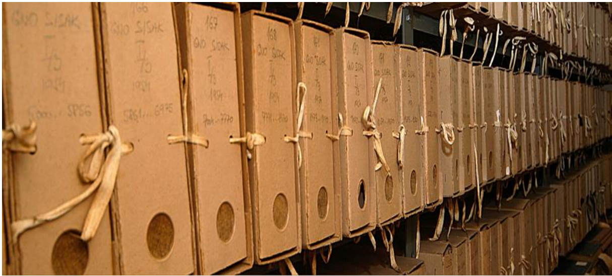
Slika 7. Gradivo u spremištu. 56

Među najveće probleme suvremenog razvoja arhivske službe uvijek se ubraja sve veća produkcija arhivskog gradiva, kao i pojava novih nositelja informacija (nekonvencionalna gradivo). Ta veza između službe arhiva s institucijama zahtijeva ne samo teorijsku obradu, već i praktičan pristup u rješavanju različitih problema (praćenje stvaranja i prestanka rada nekih institucija, a naročito vrednovanje njihovog gradiva u nastajanju). 55