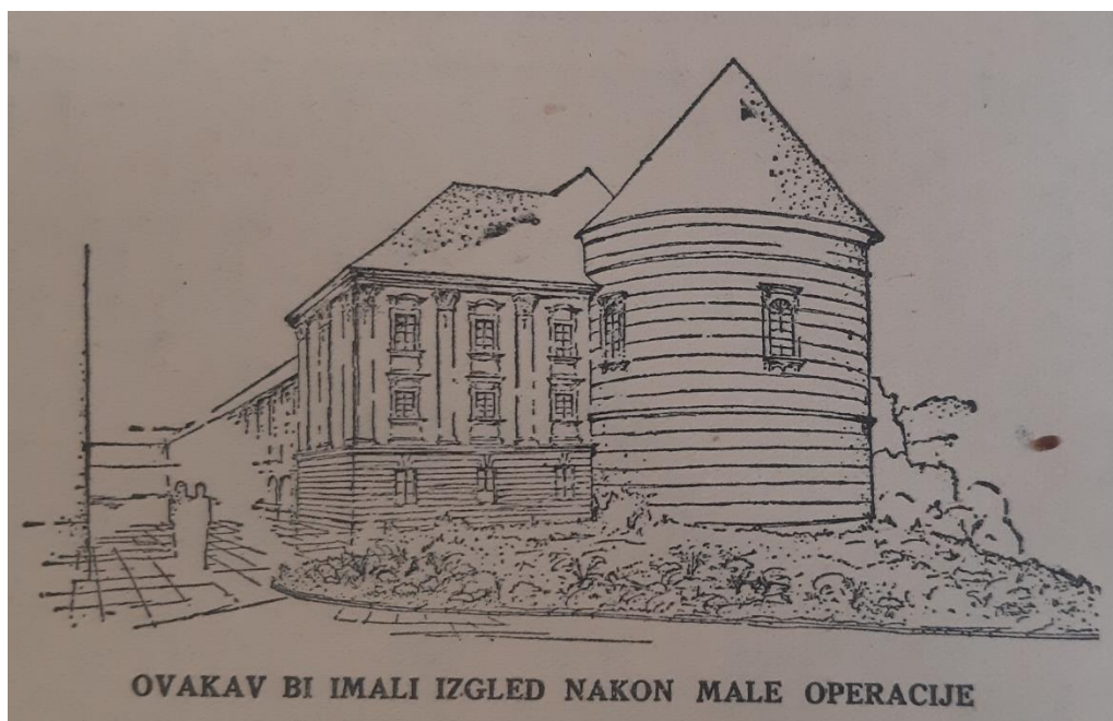
Slika 6. Planirani izgled Bolléove prigradnje Nadbiskupskom dvoru prema privremenoj regulaciji Kaptola iz 1933. godine

Što se tiče financijskog aspekta cijele priče, Zemljak na samom kraju teksta poručuje Koreniću kako će bilo kakvi radovi obradovati nezaposlene kojima se ionako ne može „izmisliti rada ni zarade“ 127 , odbacujući time njegovu zabrinutost o uzaludnom trošenju.