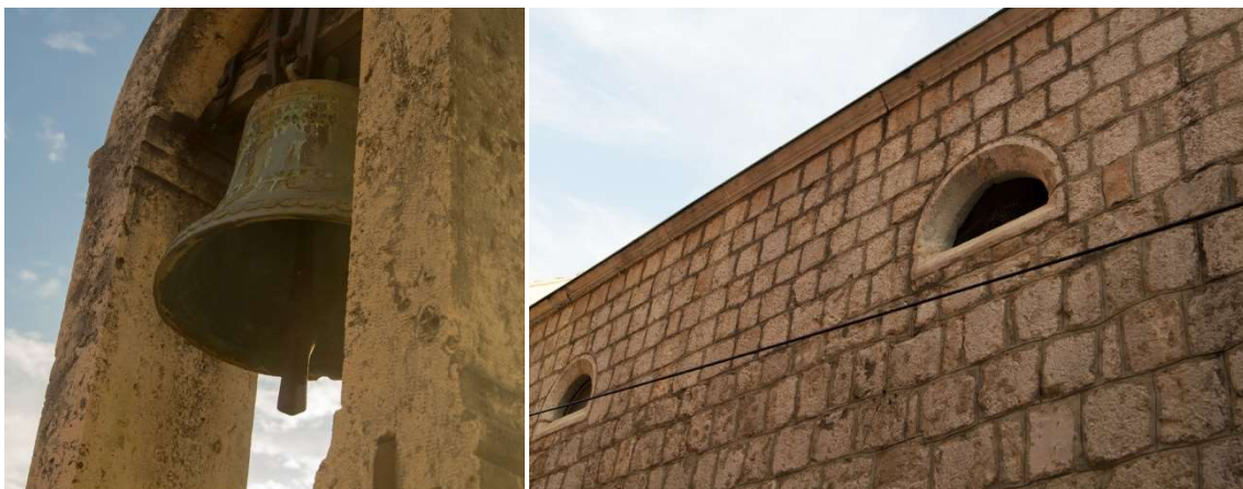
Slika 5: Pročelje - preslica i zvono.