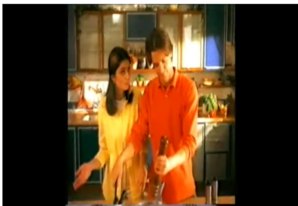
Stare reklame HRT 2002.)