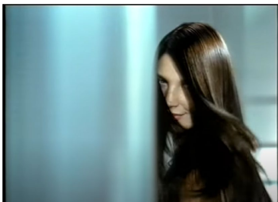
Slika 6.