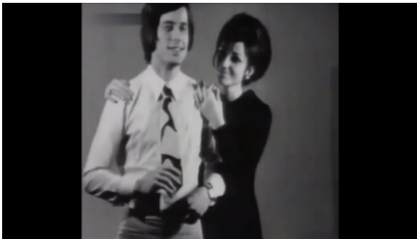
Slika 2.