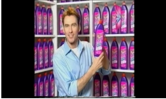
Slika 4.