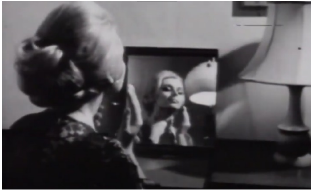
Slika 7.