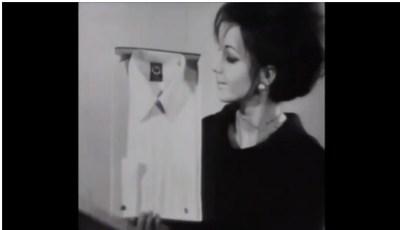
Slika 1.