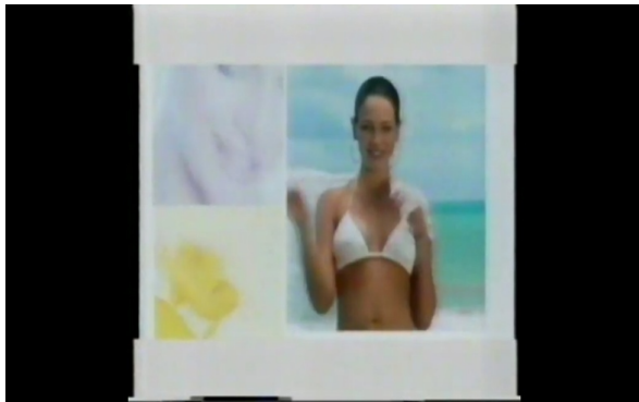
Stare reklame HRT 2002)