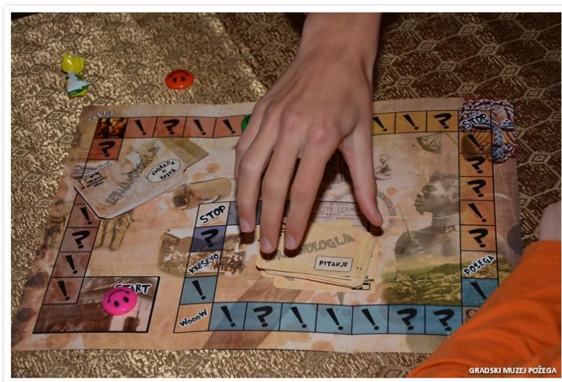
Prilog 6. Društvena igra Lermanologija .

Godine 2013. u čast 150. godišnjice rođenja i 95. godišnjice smrti GMP održava edukativno muzejsku izložbu pod imenom Lermanologija ili kako smo kroz Lermana puno naučili jedni o drugima . Poučnost njegove priče, slična je onoj izrečenoj u recenziji Novih listova pred stotinjak godina (Trstenjak 1894), ocrtavajući ga kao osobu "velikih postignuća, hrabrosti, domoljublja, jednostavnosti i poniznosti, istinskih kršćanskih opredjeljenja" od čijih uspjeha i padova mogu naučiti "svi, a posebno mladi" (" Lermanologija – završnica ", Gradski muzej Požega , 13. prosinca 2013). Projekt je bio sačinjen od pokretne izložbe sa 12 panoa na kojima je sakriveno 12 muzejskih predmeta iz njegove zbirke. Sudionici, uglavnom učenici osnovnih i srednjih škola, morali su potražiti predmete uz pomoć video uratka i sudjelovanja u jednoj ili više od petnaestak ponuđenih radionica (plesna, geografska, povijesna, likovna, dramska, matematička...). U Muzeju su još osmislili istoimenu društvenu igru baziranu na Monopolyju i Čovječe, ne ljuti se u kojoj igrač "kombinacijom znanja i sreće prolazi na zanimljiv i uzbudljiv način kroz Lermanov životni put" (" Lermanologija – edukativno muzejski projekt ", 2013). Uz natjecanje u Lermanologiji organizirane su i razne projekcije o Africi, uključujući Kiiruov film kojom prigodom je i redatelj održao predavanje, zajedno sa povjesničarkom i kartografkinjom dr. sc. Mirelom Slukan Altić.