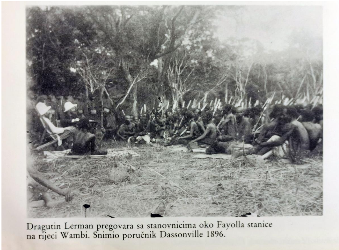
Prilog 2. Fotografija iz Afričkih dnevnika (1989)

Unatoč tome, otpor Europljanima je bio čest, te su dnevnici puni opisa borbi sa stanovnicima koji su se protivili okupaciji, poput sela Kinsuka gdje su "urođenici veoma protiv Europejaca, osobito činovnika Kongo države, veleći da mi nemamo u njihovoj zemlji ništa tražiti, da ista njima pripada" (ibid. str.64).