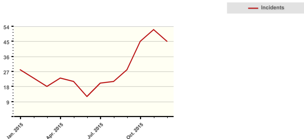
Slika 1: Graf frekventnosti napada u Zapadnoj Europi 2015. godine