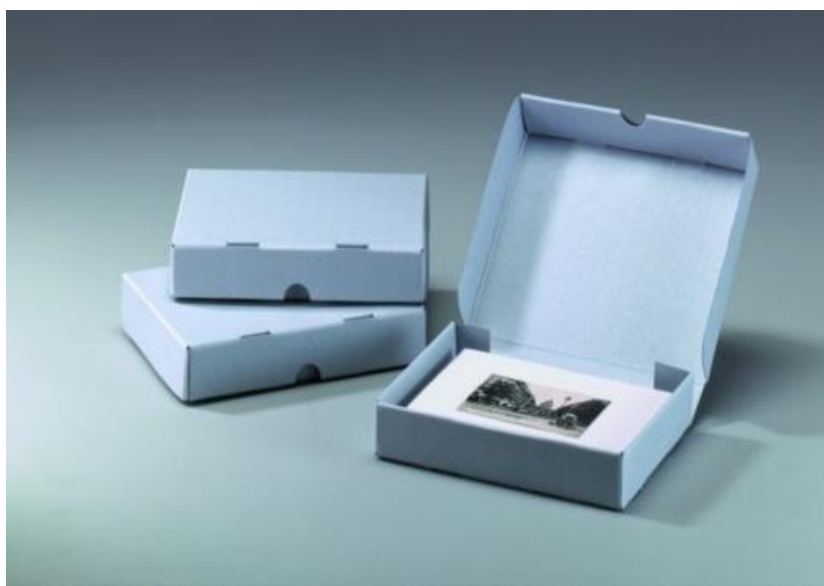
Slika 3. Primjer fotokutije

Na svakoj kutiji moraju biti upisani svi neophodni podaci o materijalu koji je u njih pohranjen.“ (Mušnjak, 1988, str. 338)