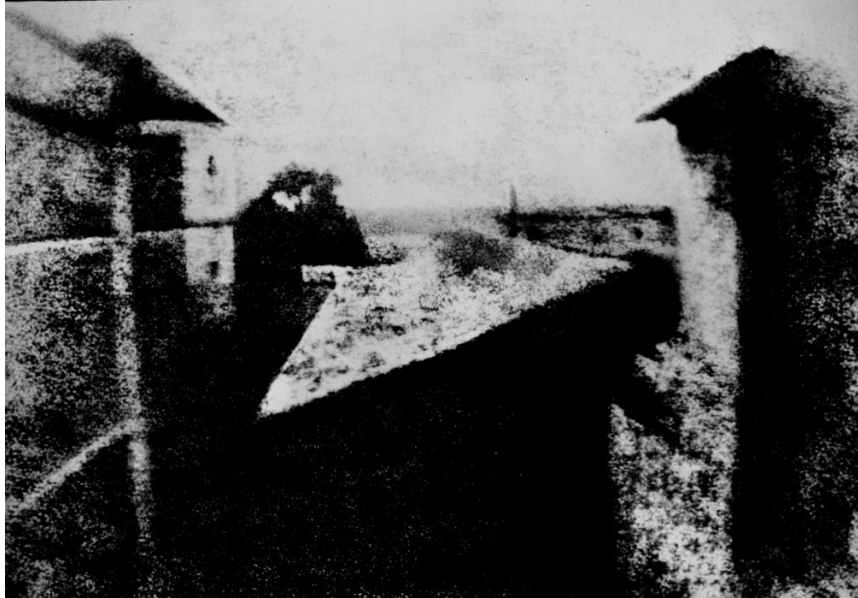
Slika 2. Nicéphore Niépce: „Pogled s prozora u Le Grasu“, prva fotografija

obrnuto na premazanu površinu lima. Odstranjivanje topljivog asfalta, jetkanje tih mjesta do glatkog metala te slijeganje tiskarske boje na kraju dovode do cjelovitog postupka nazvanog „heliogravuram“ i ujedno nastanka prve fotografije. (Mušnjak, 1988, str. 328)