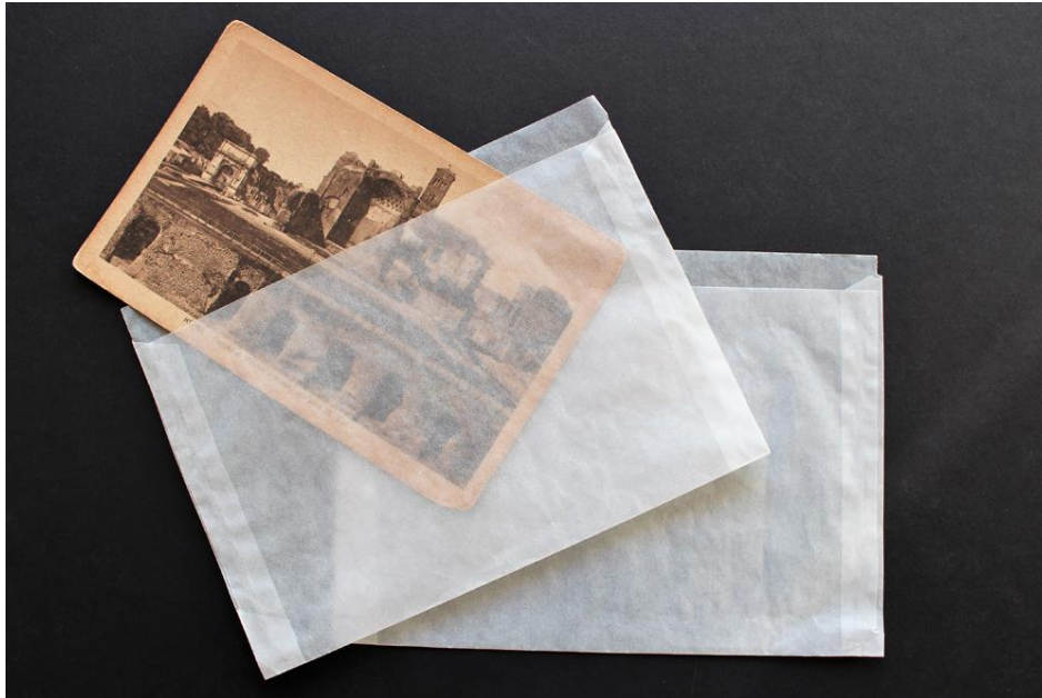
Slika 4. Primjer pergamenskih vrećica

„Transparentni materijali su uglavnom plastični i time onemogućuju normalno 'disanje' objekta koji je u njemu i zato ih treba izbjegavati za dugoročno arhiviranje. Vrećice od polivinilklorida (PVC) su strogo zabranjene.” (Dabac, 2000, str. 134) U takozvanom "radnom arhivu" dozvoljeno je korištenje vrećica koje su napravljene od zavarenih folija od poliestera, polietilena i polipropilena samo ako se radi o spremanju duplikat-negativa i duplikat-slika. Pozitivna strana tih prozirnih vrećica je to što nije nužno vaditi objekt, odnosno fotografiju iz nje kako bi se mogla promotriti. „Za 'tih arhiv' pogodne su šivane vrećice ili višestruko preklopljeni omoti od kemijski neutralnog specijalnog papira koji sadržava mnoge čiste - celuloze. Treba imati na umu da i bezkiselinski pergamin papir zbog strukture s kratkim vlaknima nije postojan i zato nije prikladan za dugoročno arhiviranje.” (Dabac, 2000, str. 134)