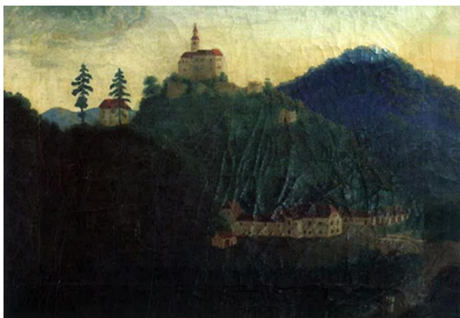
sl. br. 5: nepoznat autor, Trakošćan , ulje na platnu, prva polovice 19. stoljeća, 38,5 x 45 cm, muzej Dvor Trakošćan, inv. br. DT 1198