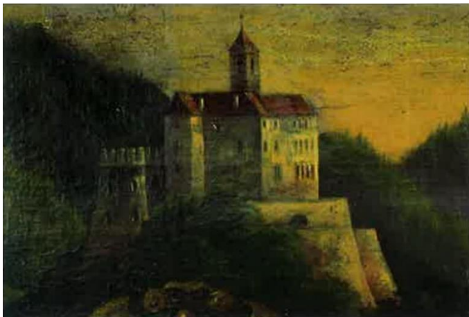
sl. br. 1: Veliko rodoslovlje obitelji Drašković (detalj) , neutvrđeni slikari, Hrvatska, oko 1668. godine, ulje na platnu, 365 x 195 cm, Hrvatski državni arhiv (trajna posudba muzeju Dvoru Trakošćanu)