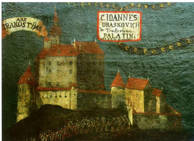
DTsl. br. 2: Malo rodoslovlje obitelji Drašković (detalj) , neutvrđeni slikar, Ugarska ili Hrvatska, oko 1775. godine, ulje na platnu, 131 x 259 cm, muzej Dvor Trakošćan, inv. br. DT 189