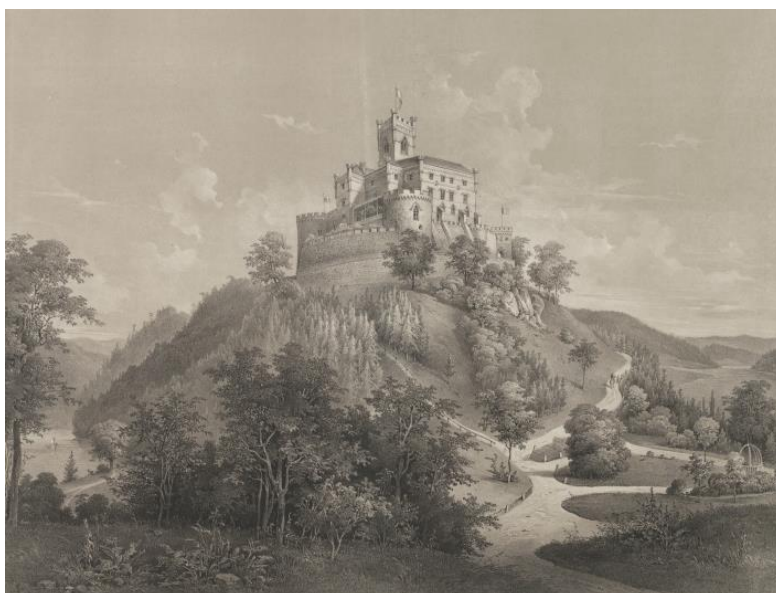
sl. br. 11: Ludwig Czerny, pogled na dvor Trakošćan; tisak: Rieffenstein & Rösh, u Albertini datirana oko 1850. godine (zbog prikaza terase treba je datirati u 1862. godinu), 48 x 62,4 cm, Wien: Albertina, Kartensammlung und Goblönmuseum, inv. br. KAR0511887