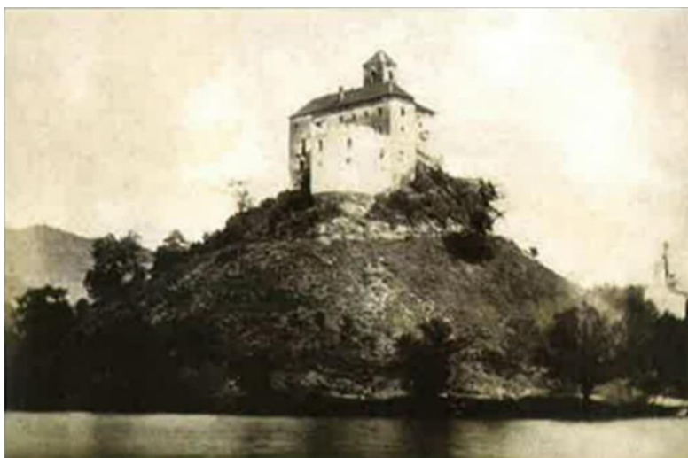
sl. br. 10: Fotografija (kalotipija) Jurja VI. Draškovića; u: Marije Tonković pod nazivom: Juraj i Karlo Drašković kao fotografi, MUO, Zagreb, 1985., kat br. 8, obilježena podacima: Trakošćan, prije 1853.godine, 10,4 x 13,4 cm, inv. Br. MUO 15589/9