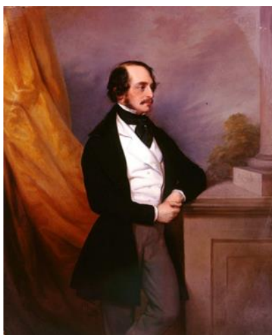
sl. br. 9: Josef Kriehuber, Juraj VI. Drašković , oko 1850. (1851.), ulje na dasci, 49 x 38 cm, Muzej za umjetnost i obrt, sig 1.d. „Kriehuber“