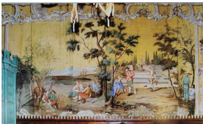
sl. br. 4: Oslikane tapete s prizorima iz života običnih građana, neutvrđeni zapadnoeuropski slikar, početak druge polovine 18. stoljeća, tempera na platnu, razne dimenzije, Mali salon za pušenje i zabavu , muzej Dvor Trakošćan