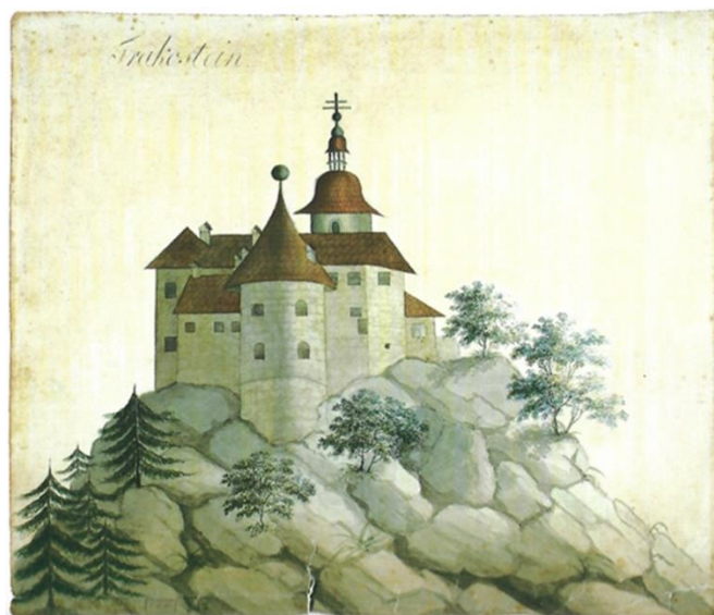
sl. br. 6: Stjepan Drašković ( u dobi od 19 godina), Trakošćan , akvarel, papir, 242 x 281 mm, muzej Dvor Trakošćan, inv. br. DT G-II-121