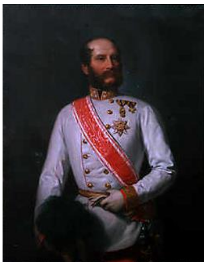
sl. br. 7: August Prinzhofer, Juraj VI. Drašković , Graz, 1864., ulje na platnu, 135,5 x 96, 5 cm, Muzej Dvor Trakošćan, inv. br. DT 77