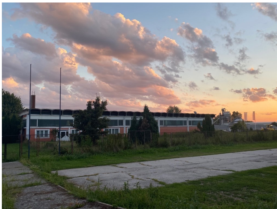
Slika 21. Bertolan d.o.o. u nekadašnjem skladištu Kristala , 2022.