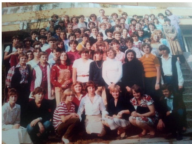
Slika 4. Polaganje zaštite na radu, 1980. godine.

Za radno mjesto u pakirnici bilo je potrebno proći obuku u trajanju od tri mjeseca. Nakon završene obuke crtanja mreža i pregleda robe, moglo se započeti s radom. Kazivačica N.R. objašnjava organiziran proizvodni proces u pakirnici . Prvo se polugotovi proizvod u pakirnici raspakiravao i razdvajao u daljnji postupak ili u lom te se pripremao za daljnje brušenje kod kristalografera. Zatim su žene pomoću vodootpornog flomastera i šablona za crtanje oslikavale mreže i motive koje su kristalograferi strojno brusili. Dobar vid i mirna ruka bili su važni za rad u pakirnici . Nakon što je mreža na proizvodu bila izbrušena, proizvod bi se vraćao nazad u pakirnicu na kontrolu. Kontrolorke su pregledavale kako je uzorak izbrušen, je li uredan, te bi se u slučaju greške, ako je to bilo moguće, proizvod vraćao kristalograferima na popravak. U slučaju kada popravak nije bio moguć, proizvod bi se otpisao. Iz pakirnice proizvod bi išao u polirnicu na poliranje i dobivanje finiša . Iz polirnice bi se proizvod vraćao u pakirnicu na dovršavanje. U jednoj smjeni bilo je 6 kontrolorki i 6 žena koje su prije pregleda svaki kristalni pregled detaljno oprale i očetkale (proces četkanja prikazan je na fotografiji) .