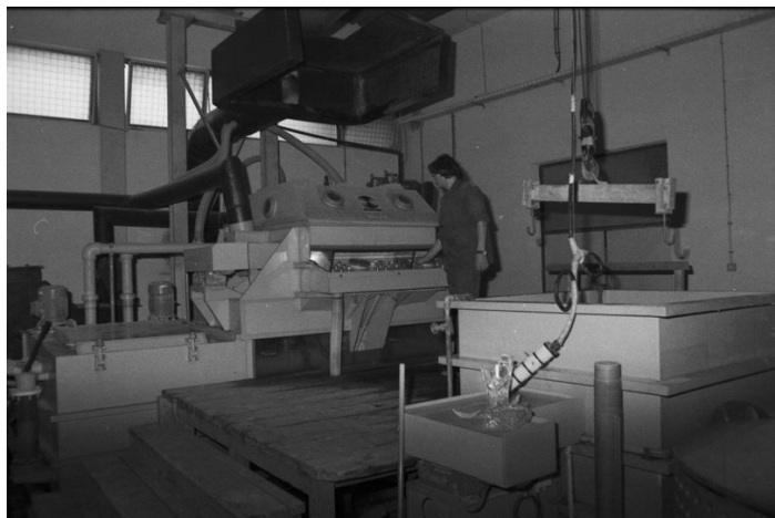
Slika 11. Stroj za poliranje kristala, 1981.

„On kad dođe kao sirovina on je onako mat, nema sjaja, a kad ga staviš u bubnjeve te plastične i puštiš da se to kao u veš mašini vrti, tada je to dobilo sjaj i kvalitetu. A ako si ti pogriješio ili nisi znao koji je sastav tog kristala, sirovine, mogao si čak i spaliti i da su bili rupe i uništiti.“ (N.J., 16. 6. 2022.)