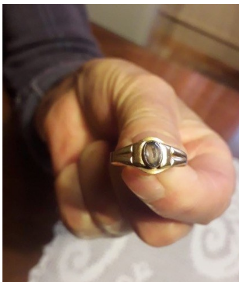
Slika 23. Prsten kazivačice D.D. kupljen zadnjim isplaćenim novcem, 2019.

„(...) Mi smo dobili nakon možda 5, 6 godina, išla sam u Križ po novac, tamo su nas pozvali za koje je sud odlučio da mi trebamo dobiti to plaćeno. Međutim to smo bili pozvani i ja sam dobila nekih, to sam kupila ovaj prsten, kakvih 100 maraka.“ (D.D., 30. 7. 2022.)