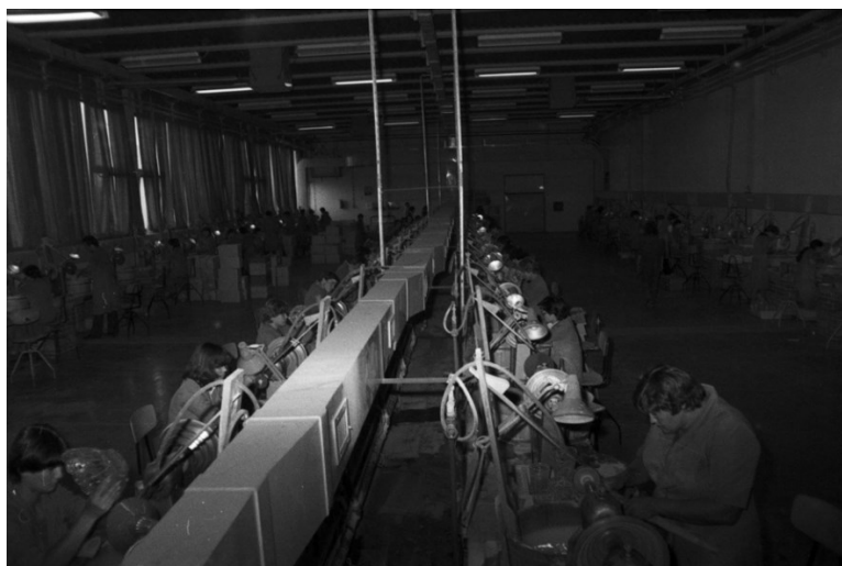
Slika 9. Izgled pogona u kojem su radile kristalograferke, 1981.