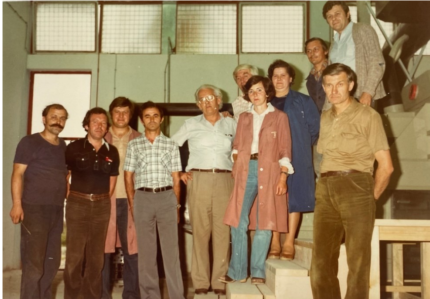
Slika 12. Kazivačica N.J. sa Nijemcima prilikom otvaranja polirnice te bračnim parom Pačariz, 1980.

Kiselina je također bila štetna i opasna za zdravlje. S obzirom da je kiselina bila nagrizajuća, moralo se paziti kako ne bi došla u doticaj sa kožom jer bi u tom slučaju nagrizla odjeću i kožu. U slučaju prejake mješavine kiselina, ponekad su zaposlenici znali i izgubiti glas zbog udisanja te kiseline. Zbog toga je bila obavezna zaštitna oprema: maske, gumene rukavice i čizme iako N.J. ističe kako često nisu nosili zaštitnu opremu. U polirnici se radilo u tri smjene, a radilo se u timu. Kazivačica N.J. ističe kako je ona bila jedina žena u polirnici , a ostatak su bili muškarci. Prema tome, u svakoj smjeni bilo je oko tri muškaraca. Prva jutarnja smjena radila je od 6 do 14 sati, druga popodnevna smjena od 14 do 22 sata i treća noćna smjena od 22 do 6 sati. Četvrta smjena je bila slobodna. Za razliku od radnog vremena kristalografera i pakirnice , u polirnici su se tako radile i noćne smjene te tijekom vikenda, a radilo se na normu. Cijeli tjedan radio se jedan turnus primjerice jutarnja smjena, a idući tjedan drugi turnus. Takav način rada fizički je bio naporan te je kod pojedinaca uzrokovao i poremećaje spavanja. Za razliku od žena Jugoplastike kojima je smjenski rad u tri smjene i rad vikendima utjecao na teško usklađivanje obiteljskih obaveza s radom u tvornici (Blagaić 2012:246), kazivačica N.J. ističe da je uspješno usklađivala rad u tvornici s obiteljskim obavezama.