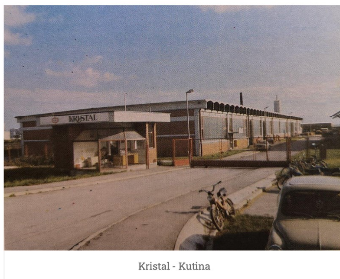
Slika 3. Tvornica Kristal nakon izgradnje.