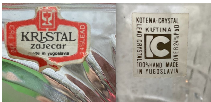
Slika 19. Stara etiketa Kristal Zaječar i nova etiketa Kotena-Kristal , 2022.

Čini se da je Zaječar donio mnogo pogrešnih odluka jer su Kutinčani skidali stare etike sa proizvoda kako bi se riješili nagomilane robe iz skladišta, a proizvod prodavali pod novim imenom Kotena-Kristal .