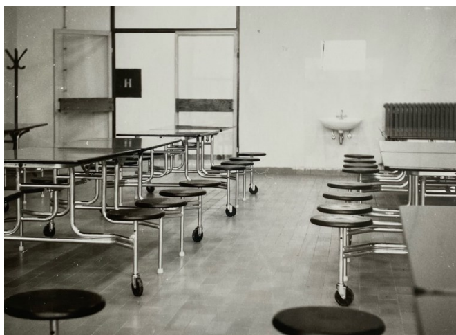
Slika 14. Opremljen restoran Kristala , 1979.

Tvornica je imala uredan sanitarni čvor s tuševima i toaletima, garderobe u kojima su se žene presvlačile te klimatizaciju. Kazivačice su istaknule kako je sve bilo čisto, uredno i održavano. Kroz kazivanja kazivačica provlači se usporedba „nekad i danas“. Prema njihovim navodima, rad u Kristalu donio im je mnoge povlastice, vodila se briga o radnicima te su bile zadovoljne i osjećale su se sigurno . Osim beneficiranog radnog staža, zaposlenice su imale sindikat i pravo na godišnji odmor, regres i dodatak na uzdržavanog člana obitelji (dijete). Preko sindikata su radnici mogli nabavljati i zimnice pa su u velikim količinama naručivali jabuke, kruške, krumpire i ostalo. Sve kazivačice su istaknule da su radom u Kristalu imale sve .