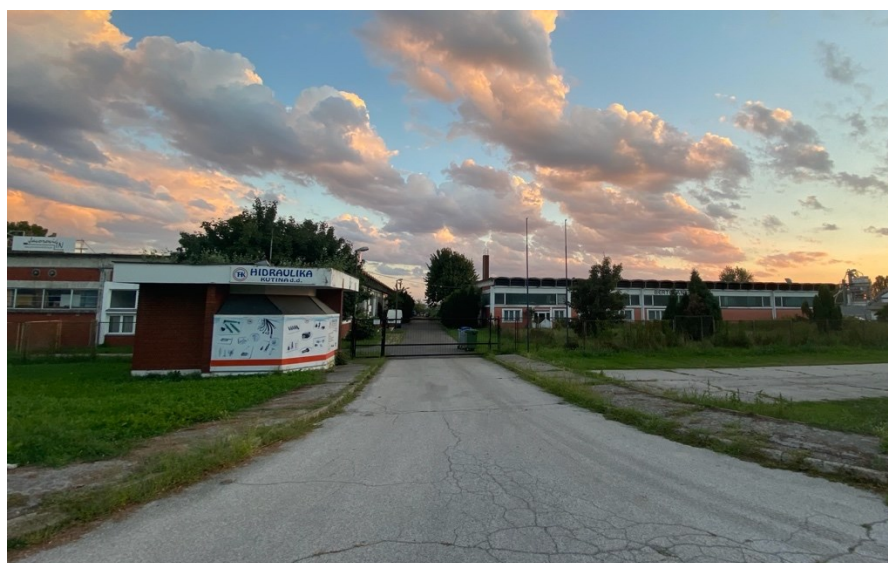
Slika 22. Zgrade i porta tvornice nekadašnje tvornice Kristal , 2022.

Ti lokaliteti, koje možemo definirati mjestom sjećanja kazivača, bude osjećaj nostalgije za nekadašnjim načinom života kojeg su imali za vrijeme rada u tvornici i za uspomenama, ali i osjećaj tuge zbog tužne sudbine Kristala i što ono danas predstavlja: