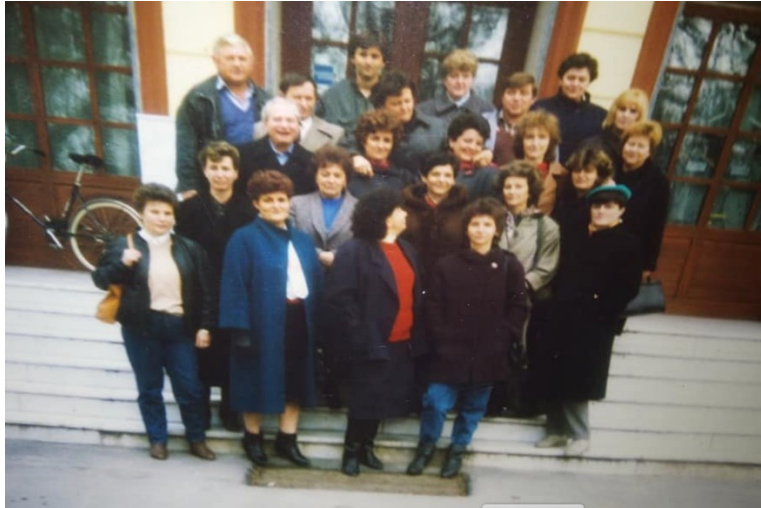
Slika 15. Izlet „Kristalaca“ u Zaječar, nepoznata godina.

U prostorima Kristala održavale su se kulturno-zabavne priredbe. Za „Kristalce“ je u hali tvornice 1981. godine, povodom Dana žena, održana izložba slikara amatera 25 , a 1984. izložba ručnih radova 26 . U restoranu tvornice su se, kao što je već spomenuto, održavala i razne proslave, posebice za praznike. Na Dan žena (8. ožujka) žene su na posao dolazile te su radile do deset sati, a nakon toga su u restoranu imali glazbu i zabavu te su dobivale poklone od tvornice. Kazivačica J.K. sjeća se kako su za Dan žena dobile kristalne posudice za bombone u obliku srca. Slavilo bi se i za ostale praznike, poput Nove godine. Iako su se u SFR Jugoslaviji slavili samo državni praznici, bilo je dozvoljeno družiti se i na katoličke blagdane: