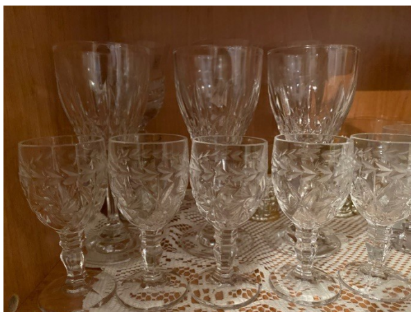
Slika 13. Kristalne čaše izrađene u Kristalu 1989. godine, 2019.