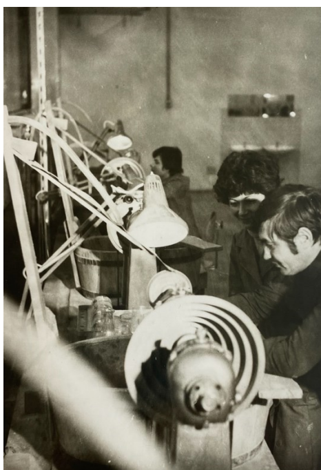
Slika 7. Obuka na stroju u Kristalu , 1979.

Također, u Centru za usmjereno obrazovanje „Milenko Brkić-Crni“ 22 1980. godine pokrenut je trogodišnji srednjoškolski program u dva odjeljenja, za radno mjesto kristalografera. Jugoplastika je također imala program stipendiranja za zanimanja tokar i elektromehaničar, odnosno zanimanja koja su im bila potrebna (Blagaić 2012:248). Kristalov program, nažalost, nije dugo trajao te je upisao samo jednu generaciju, 35 učenika. 23