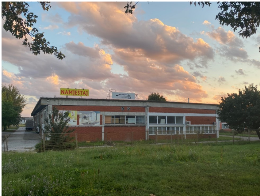
Slika 20. Salon namještaja Javorović IN u prvoj zgradi Kristala , 2022.

Na lokaciji nekadašnjeg Kristala moguće je još uvijek vidjeti zgrade tvornice. Prva zgrada (izgrađena 1979.) sastojala se od dvije hale, trgovine, restorana i ureda. U prvoj hali nalazio se pogon, a u produžetku hale (u obliku slova L) nalazila se polirnica i pakirnica koja je bila usporedno sa restoranom. Odmah do prve hale nalazila se druga hala s pogonom. Na mjestu prve zgrade danas se nalazi Salon namještaja Javorović IN . Iza se nalazi Hidraulika Kutina koja od 1994. godine još uvijek posluje. Druga zgrada, nekadašnje skladište, u vlasništvu je Bertolana d.o.o. koji je u stečajnom postupku. Za razliku od zgrada Jugoplastike koje su u potpunosti razrušene, a na njihovom mjestu su niknuli apartmani, hoteli i shopping centar, zgrade Kristala zadržane su u gotovo nepromijenjenom obliku, ali su dobile novu namjenu. Demoliranje zgrada Jugoplastike koje su bile simbol socijalističkog grada predstavlja tranziciju u kapitalističko, potrošačko društvo (Jambrešić Kirin i Blagaić 2013:46). S druge strane, zgrade Kristala ostale su simbol socijalističkog društva, gdje druga zgrada „ugostujućí“ novu industriju stvara sliku (de)industrijaliziranog grada, a pretvaranjem prve zgrade u salon namještaja odraz kapitalističkoga društva.