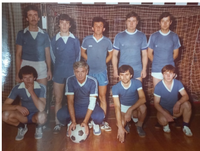
Slika 17. Malonogometna muška momčad Kristala , 1984.

Kristal je osiguravao i druženja radnika kroz sport, organizirajući malonogometni muški klub i ženski rukometni klub Kristal koji je postigao mnoge uspjehe.