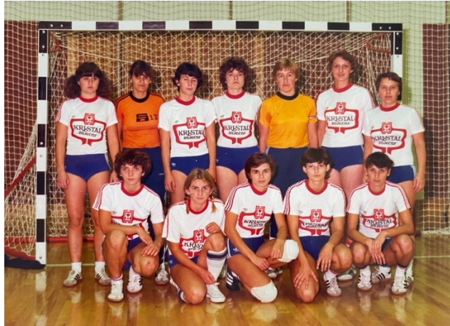
Slika 18. Ženski rukometni klub Kristal, 1980.