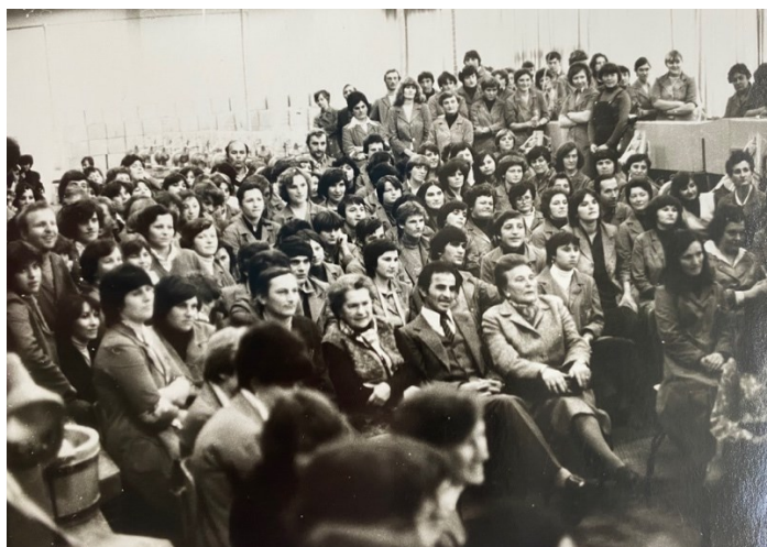
Slika 16. Prikazivanje emisije Veselo veče u proizvodnoj hali, 1980.

Kristal je osiguravao i druženja radnika kroz sport, organizirajući malonogometni muški klub i ženski rukometni klub Kristal koji je postigao mnoge uspjehe.