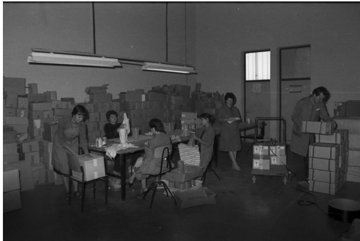
Slika 6. Pakiranje gotovih proizvoda u pakirnici , 1981.

zablendirao, ja sam pregledala što gore piše i kutija se zatvarala da više nitko ne može do trgovine otvoriti. Organizirano. Vrhunski.“ (N.R., 18. 6. 2022.)