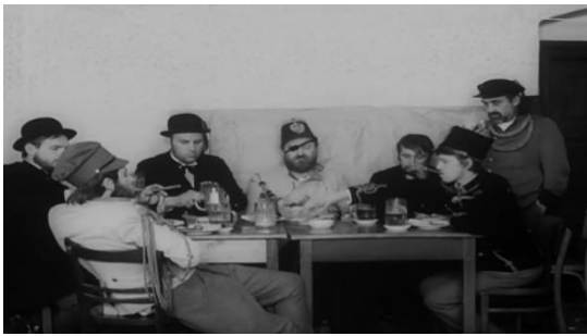
Slika br. 7 Svećenikov kraj

Prvi Paskaljevićev film, Čuvar plaže u zimskom periodu , u mnogočemu je sličan Varljivom letu , ali i filmovima čeških autora. Također se bavi seksualnim sazrijevanjem glavnog lika, ali ono što je zanimljivije i što ga spaja s češkim novim valom je upotreba tabloa . Naravno, tablo nije svojstven isključivo češkoj novovalnoj kinematografiji, ali s obzirom na način kojim su kadrovi konstruirani i na njihovu kompoziciju, možemo Paskaljevićev film povezati s češkim autorima Schormom i Menzelom.