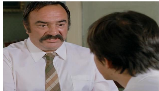
Slika br. 6 Varljivo leto '68.