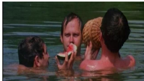
slika br. 2 Samo jednom se ljubi