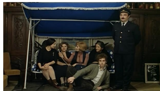
Slika br. 10 Čuvar plaže u zimskom periodu