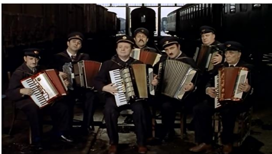
Slika br. 9 Čuvar plaže u zimskom periodu