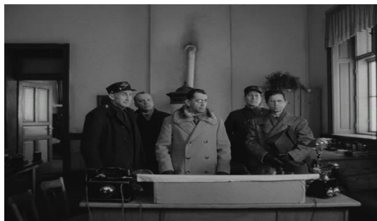
Slika br. 12 Strogo kontrolirani vlakovi