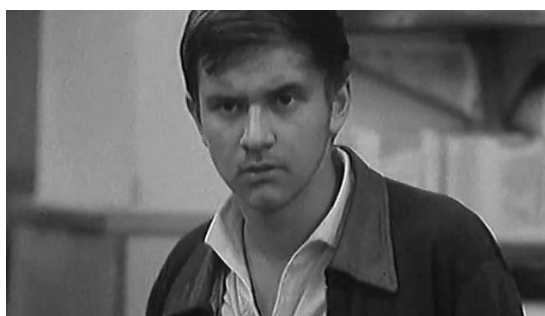
slika br.3 Crni Petar

Kada priča o realizmu u Češkom novom valu, kojeg smatra produktom novih tendencija 60-ih godina, Hames (2009: 58) koristi filmove Crni Petar i Ljubavi jedne plavuše kako bi ga uspio protumačiti. Za početak, ističe kako je realizam nastao kao odgovor na estetiku i norme socijalističkog realizma kojim je Čehoslovačka kinematografija bila već dobro zasićena (iste tendencije pronalazimo u Crnom valu jugoslavenskog filma). Forman je bio poznat po korištenju naturščika i stvarnih lokacija kod snimanja svojih filmova te je time, uz pomoć cinéma-vérité a postignuo, ali i povećao autentičnost svakodnevnog života (ibid). Iako je Paskaljević posezao za iskusnim glumcima u svojim filmovima (Danilo Bata Stojković, Mira Banjac, Velimir Bata Živojinović, Slavko Štimac, Irfan Mensur itd.), a kadrovi su bili pažljivo planirani (čime je sličniji Menzelu nego Formanu), ipak kod njega možemo prepoznati autentičnost svakodnevnog života. Poput Formanovih, Paskaljevićeve glavni likovi dolaze iz radničke klase, ne zanima ih nikakva poslovna karijera te su zapravo bez ikakvih ambicija. Ljubav im pruža jedini bijeg od dosade i utega „odraslog života“. Naposljetku, nitko od njih „ne podliježe stereotipima Socijalističkog realizma, ne nose u sebi pozitivne stavove, nisu politički motivirani i ne vjeruju u socijalističku utopiju“ (ibid).