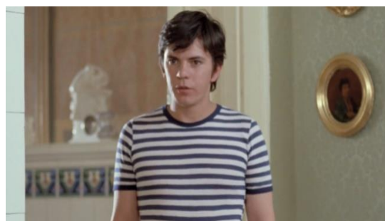
slika br. 4 Varljivo leto '68.