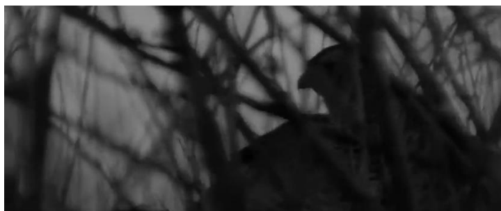
Slika br. 13 Marketa Lazarová