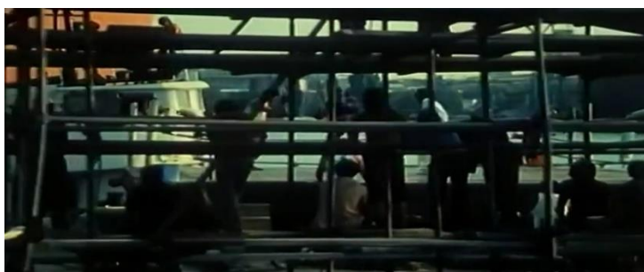
Slika br. 14 Muke po Mati

Sve ove postupke, uključujući i tretman tijela kao prostor sukoba ideologija, možemo pronaći i u Mukama po Mati . Vratimo li se na sudjelovanje gledatelja u svijetu filma, Velisavljević (2013: 22) navodi kako Zafranović „vrtoglavom vizuelnošću, sa neprekidnim pokretima kamere, zumovima i vožnjama [...] uvodi gledaoca u specifičnu atmosferu naglašene telesnosti, radničkog miljea i bokserske borbe i kojoj nad ekonomskim dominira simbolički ulog“. Sličan stilski postupak, poput gore navedenog kadra sokola, koristi i Zafranović.