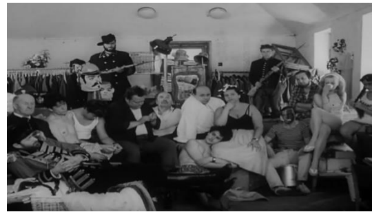
Slika br. 8 Svećenikov kraj