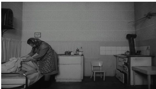
Slika br. 11 Strogo kontrolirani vlakovi