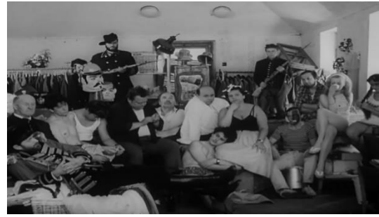
Slika br. 8 Svećenikov kraj