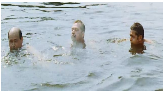
slika br. 1 Hirovito ljeto