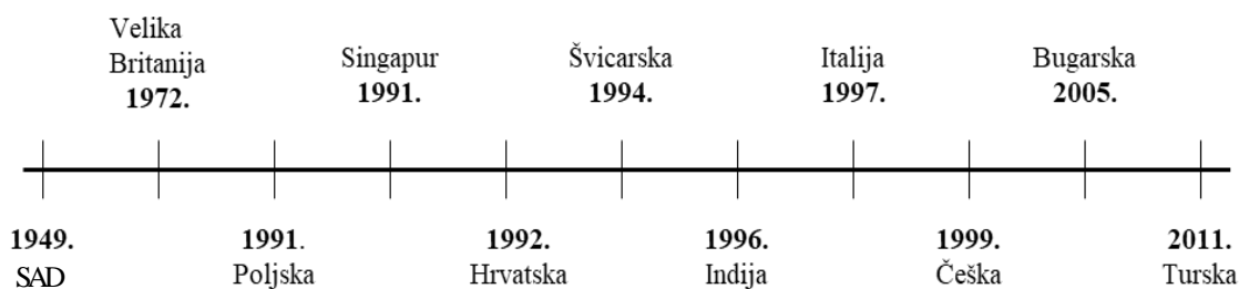
Slika 1: Lenta vremena osnivanja udruga za disleksiju diljem Europe i svijeta

Neprofitna organizacija Dyslexia International, osnovana 2000. godine radi na tome da pruža online informacije i materijale da bi se učenici, koji se muče, mogli rano identificirati i primjereno educirati te kako bi se lakše nosili sa svojom teškoćom. U svome djelovanju Dyslexia International okupila je globalni tim stručnjaka, učitelja, vladinih službenika i sudionika iz 190 različitih zemalja koji dijele znanja, materijale, vježbe i podršku učiteljima za identifikaciju disleksije i strategije poučavanja.