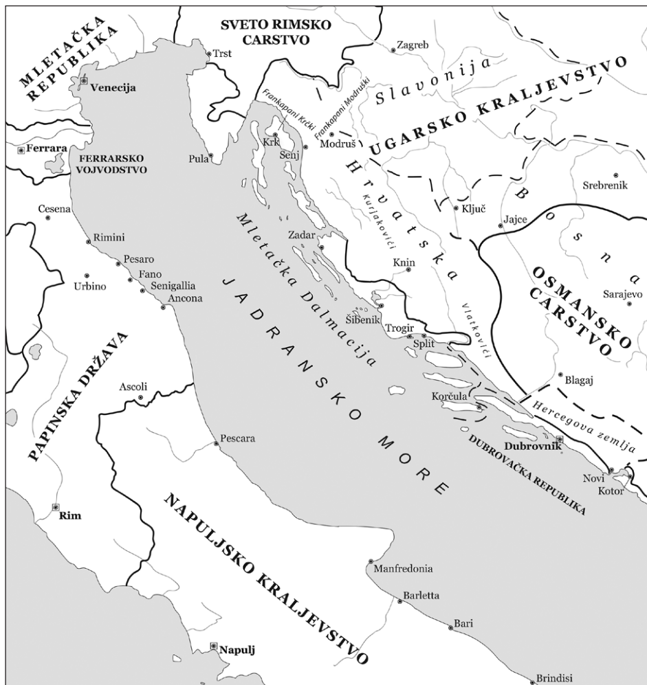
Jadranski prostor 1472-1473. godine