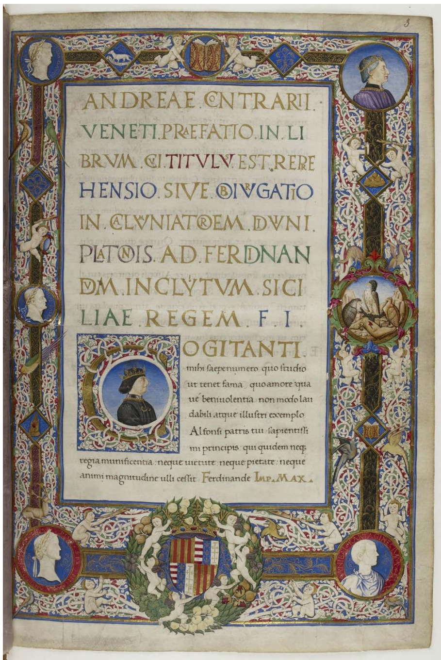
Sl. 1b. Frontispicij Contrarijeva predgovora u slavu kralja Ferrantea (MS BnF lat. 12947, fol. 3r)