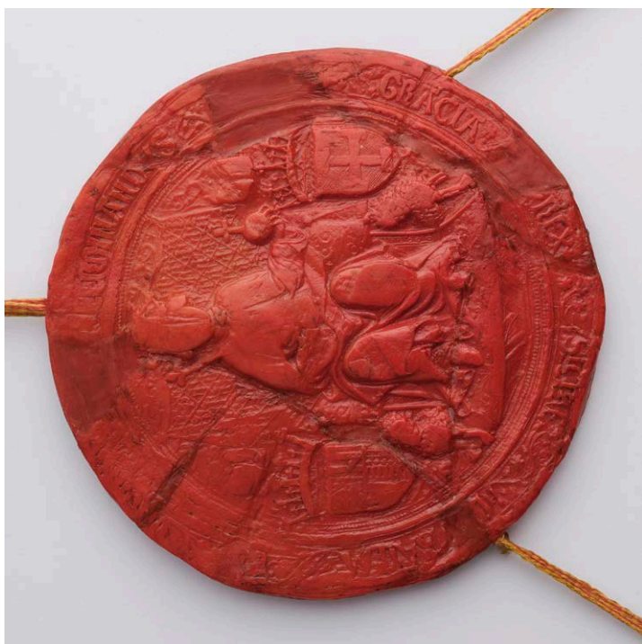
Sl. 3b-c. Avers (lijevo) i revers (desno) velikog dvostranog pečata kralja Ferrantea s povelje Jindřicha od Hradeca (SOA Třebon-Jindřichův Hradec, Sbirka listin, inv.č. 155)