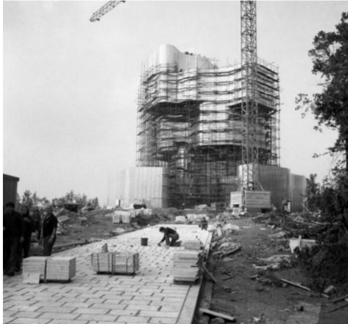
Slika 11. Izgradnja Spomenika na Petrovoj gori

Prostori za edukaciju i rekreaciju smješteni su u prizemlju spomenika u dva izdužena kraka dok se muzejski prostor nalazi na višim razinama. Organiziran je u šest cjelina odnosno galerija kroz koje se prolazi penjući se prema vrhu. Prostor je ritmički organiziran kako bi se prirodno uspinjalo prema vrhuncu građevine, vidikovcu.