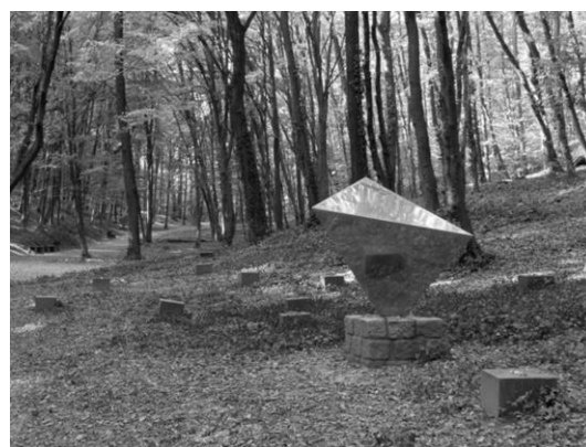
Slika 6. i 7. Kristalni oblici, Dolina grobova u Dotrščini, Zagreb