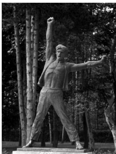
Slika 2. Vojin Bakić, Poziv na ustanak (1946.-1947.)