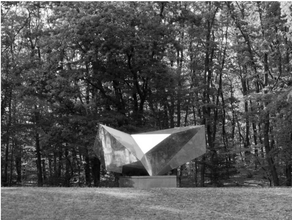
Slika 8. Vojin Bakić, Spomen-obilježje u Dotršćini (1964.-1968.)

njegovo trenutno stanje i status govore o nedovoljnoj osviještenosti šire zajednice o simboličkoj, povijesnoj i umjetničkoj vrijednosti mjesta koje se nalazi u njihovom susjedstvu. Briga o Dotršćini spala je na pojedince i volontere koji ulažu napore kako bi park bio održavan i čist. Prepuštena je propadanju, mladenačkom, ali i usmjerenom vandalizmu pojedinaca koji grafitima, natpisima i drugim destruktivnim akcijama svakodnevno nagrđuju i dodatno narušavaju opstale spomenike. 120