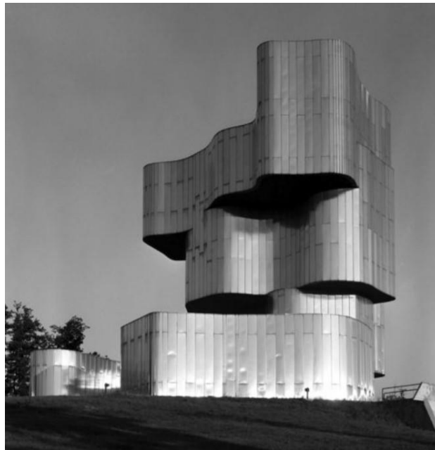
Slika 12. Vojin Bakić, Spomenik ustanku naroda Banije i Korduna (1970.-1981.)

Njihovi tragovi danas leže po okolnim šumama, a vanjština spomenika davno je preprodana i prenamijenjena. Nekada ulaštena vanjština postala je izvorom sekundarne sirovine za sve pojedince koji sami sebi daju pravo devastirati ovaj velebni spomenik. Još od 90-ih godina opna se spomenika polagano uklanja, skida i odvozi u nepoznato, a njezine skelet poput svjedoka strše i svjedoče o nekadašnjoj slavi, a današnjoj sramoti i kriminalu. Unutrašnjost također nije doživjela ništa manje tragičniju sudbinu. Ona je gotovo ogoljena. Kako je već spomenuto, nekadašnji edukativni materijali, eksponati, ali i cijeli unutrašnji inventar u potpunosti je uništen, odnesen i izgubljen. Ostavljena je samo nova ikonografija četničkih i ustaških simbola kao i vandalskih grafita bez posebnog značenja. 144