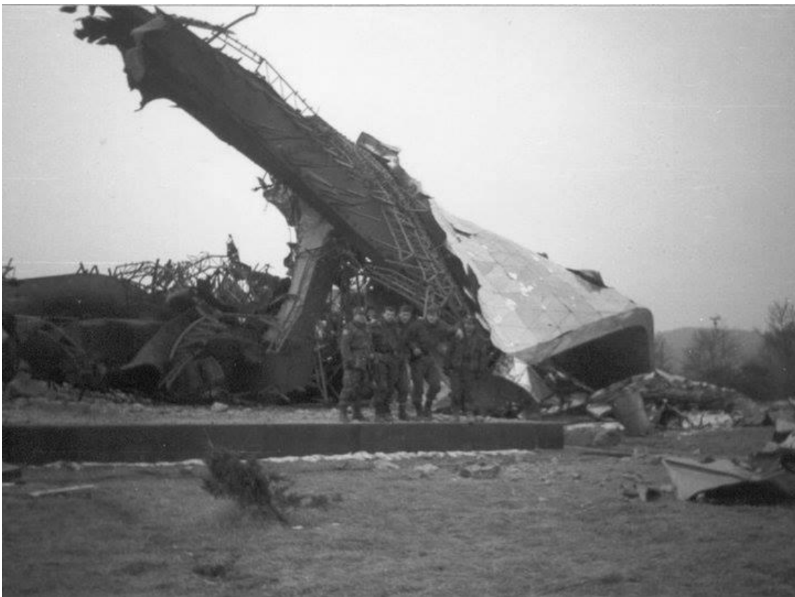
Slika 14. Razoreni Bakićev Spomenik (1992.)

Na samome kraju dotaknut ćemo se aktualnih i trenutnih vijesti vezanih uz Bakićeve spomenike na koje se ovaj rad fokusira. Na taj način prikazat će se te u kratko ocrtati njihovo današnje stanje i akcije koje se nad njima (ne) provode. Savez antifašističkih boraca i antifašista (SABA) raspisalo je 2011. godine Apel za obnovu sedam kapitalnih spomenika NOB-a . Između navedenih spomenika za koje se traži obnova našao se i Spomenik ustanku naroda Banije i Korduna na Petrovoj gori. Apel je potpisalo oko 150 osoba među kojima su političari, povjesničari, intelektualci i umjetnici. Spomenici su birani prema kriteriju umjetničke, a potom i društvene vrijednosti, a njihovim restauriranjem želja je bila naglasiti osudu devastacije u devedesetima te potvrditi državnu borbu protiv fašizma. 219 Iako je inicijativa stara jedno desetljeće još uvijek nije polučila rezultate.