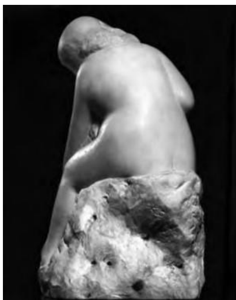
Slika 1. Vojin Bakić, Kupačica

Ovom razdoblju pripada i jedna prvih javnih narudžbi za spomenik koji je postavljen u rodnom mu Bjelovaru. Poziv na ustanak (1946.-1947.) skulptura je izvedena u bronci u gotovo stvarnim dimenzijama. Bakić je uhvatio emociju, gestu i snagu mladog ratnika. Načinio je skulpturu u duhu tadašnjeg socrealizma . Rasporedom svojih elemenata, skulptura tvori geometrijski okvir koji ju izdiže na razinu simbola. Stav široko razmaknutih nogu, čvrsto stisnuta i podignuta šaka te grimasa lica tvore junaka kao personifikaciju borbe, hrabrosti i herojstva. 50 (Slika 2.)