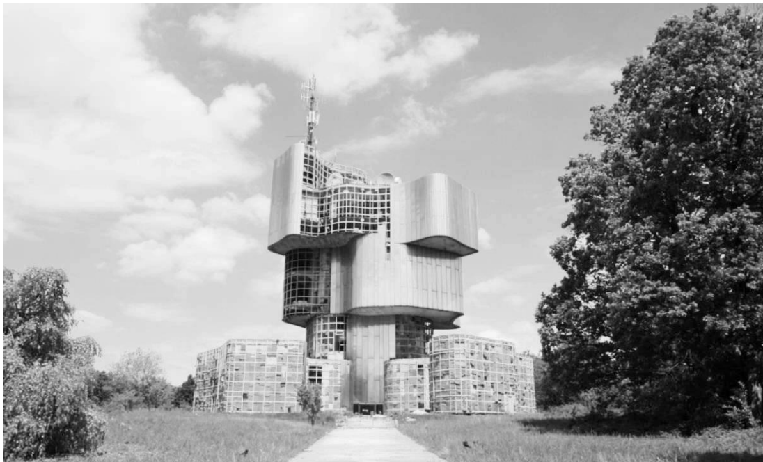
Slika 13. devastirani Spomenik na Petrovoj gori

Unatoč svemu navedenom, Spomenik u Kamenskoj biva uništen, dok Spomenik na Petrovoj gori i dalje propada. Pri tome je zanimljivo primijetiti još jednu činjenicu. U Drugom protokolu Haške konvencije donesenom 1999. godine pojavljuje se pojam „vojne nužnosti“ koji naizgled može djelovati i poslužiti, kako Pešut piše, kao „pravni vakuum“ za pravdanje nasilja provođenog nad kulturom. 190 Međutim za devastaciju spomenika tijekom Domovinskog rata to svakako ne može biti slučaj. Drugi protokol Haške konvencije na snazi je, kako je spomenuto, od 1999. godine, a Zakon o potvrđivanju Drugog protokola uz Konvenciju za zaštitu kulturnih dobara u slučaju oružanog sukoba Hrvatski sabor donosi 29. studenog 2005. godine. 191 Ako se prisjetimo kako je Spomenik pobjedi revolucije naroda Slavonije srušen u noći s 21. na 22. veljače 1992., za spomenuti čin ne postoji nikakvo opravdanje niti može biti riječ o bilo kakvom „pravnom vakuumu“.