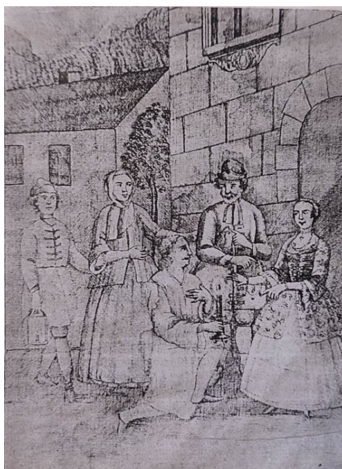
Image 3. La copie ragusienne de la gravure parisienne, 4 ème livre du manuscrit A.