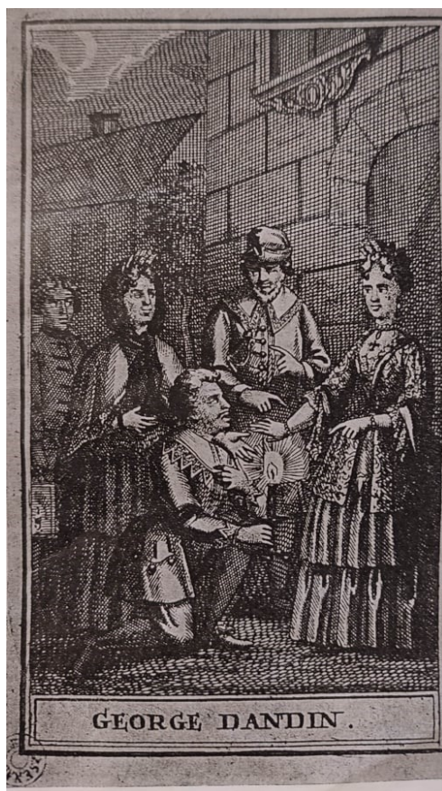
Image 2. La gravure de l'édition parisienne de 1716.